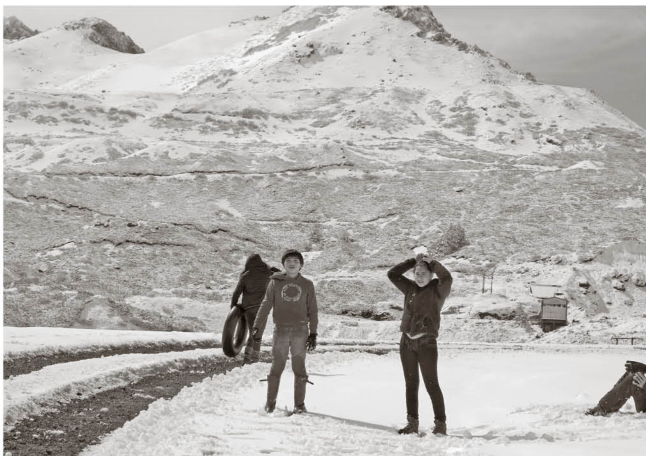
LAS AGLOMERACIONES se presentan desde las 11 de la mañana en adelante.