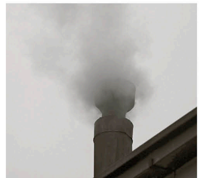
CONTAMINACIÓN DOMICILIARIA emanada por el uso de leña húmeda.