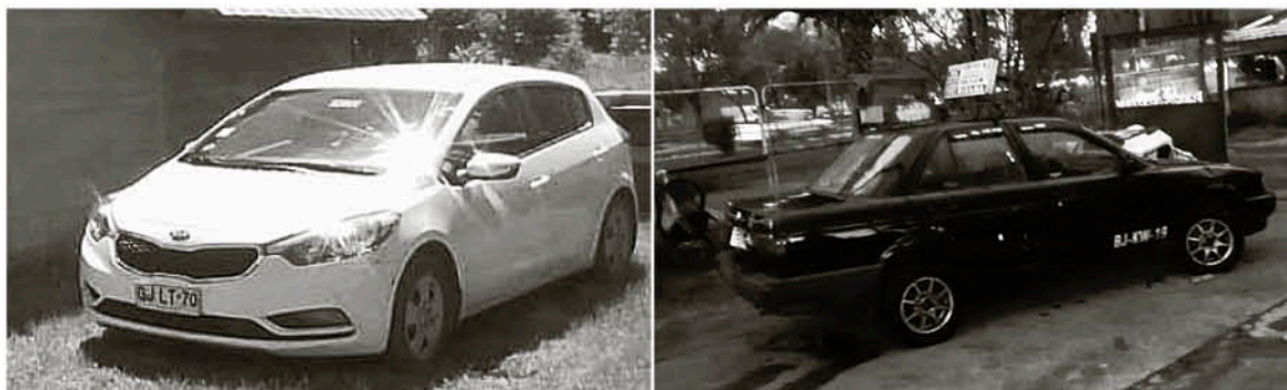
AMBOS VEHÍCULOS fueron sustraídos desde lugares de seguridad para sus dueños.

Mayor Héctor Soto, comisario de la Primera Comisaría de Los Ángeles.