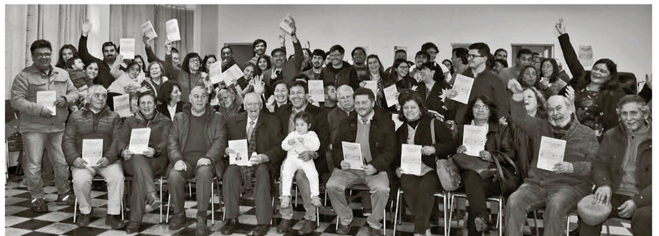
EL SÁBADO SE REPARTIERON los primeros 150 ejemplares.