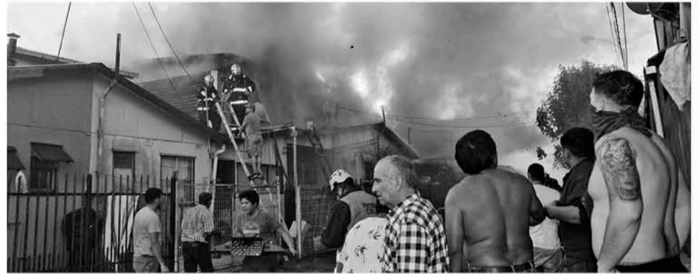
LAS FAMILIAS DE ESTE SECTOR pasaron todo el invierno en las viviendas de emergencia.

Con el paso del tiempo se dio a conocer la medida para este hombre por el trágico hecho que mantiene además a