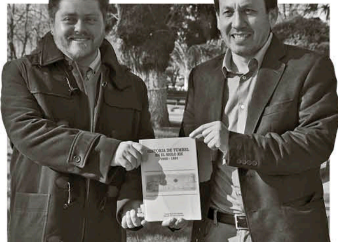
LOS PROFESORES LUCEN orgullosos su trabajo en la plaza de Yumbel.

establecimientos educacionales de la comuna recibirán ejemplares del libro, de tal manera que los estudiantes puedan recurrir a él para conocer más sobre la historia de Yumbel y contribuir a generar identidad local.