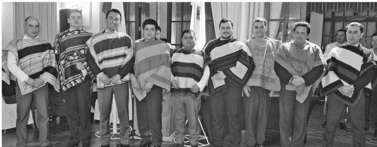
EL DIRECTORIO SALIENTE se presentó bajo la tradicional vestimenta del huaso chileno.

En grandes ciudades se desconoce su origen y práctica, así como también las costumbres afiatadas al entorno rural, sin embargo el rodeo nacional se niega a desaparecer y se mantiene presente más que nunca como una tradición nacional que a pesar de los años y movimientos opositores forma parte de idiosincrasia popular.