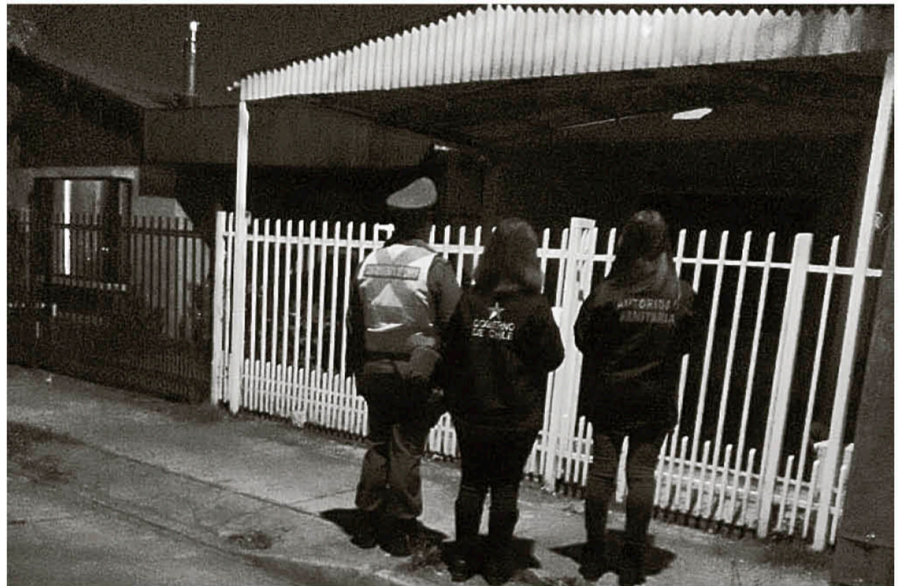
FISCALIZACIÓN DOMICILIARIA realizada por la Autoridad Sanitaria.