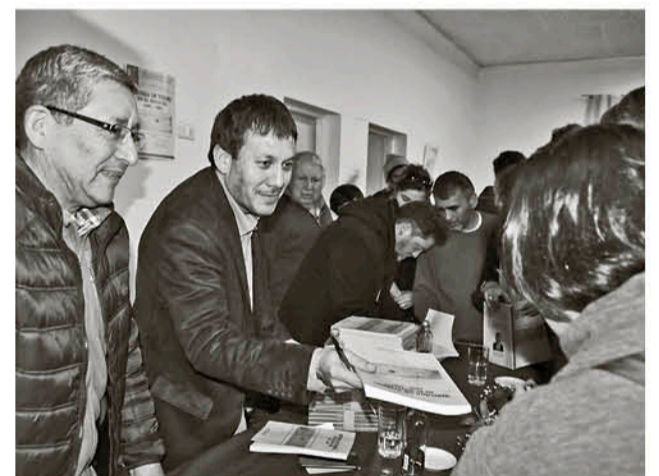
EL LIBRO SERÁ distribuido gratuitamente.

Cabe destacar que esta obra no va a ser comercializada, sino que será distribuida gratuitamente, porque los autores creen que este aporte