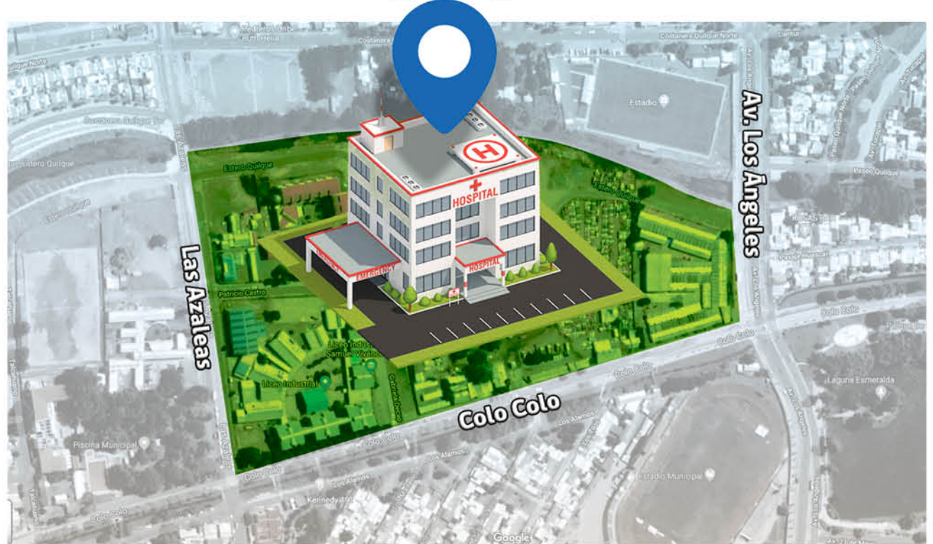
EL CONCEJO MUNICIPAL DE LOS ÁNGELES resolvió entregar el terreno ubicado en calle Colo Colo, entre avenida Los Ángeles y Las Azaleas para la ejecución del proyecto.

concreto, entre las alternativas que eran aún analizadas en terrenos fiscales y privados por parte del Servicio de Salud. "Estamos absolutamente convencidos de que la Municipalidad de Los Ángeles, a través de la entrega de este terreno, puede generar condiciones para apurar la