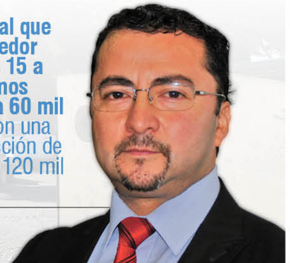
Rodrigo Sierra, director del Servicio de Salud de Biobío.

“Es un hospital que tendrá alrededor de 300 camas, entre 15 a 20 pabellones. Estamos hablando de 50 mil a 60 mil metros cuadrados con una inversión de construcción de aproximadamente de 120 mil millones de pesos”.