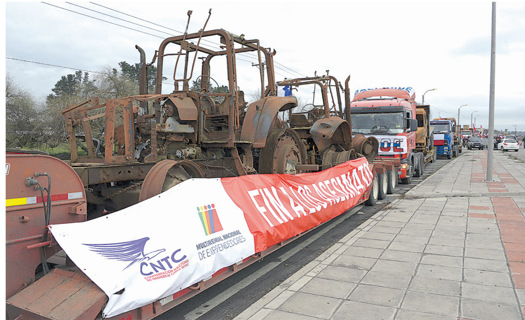
LOS ATENTADOS VIVIDOS EN BIOBÍO, Araucanía y Los Ríos son una de las bases para el proyecto de ley de La Moneda.

En paralelo, el vicepresidente del Senado, Alfonso De Urresti, advirtió que la votación de la ley corta, contemplada para hoy, debiera detenerse, toda vez que las palabras de La Moneda advierten sobre un flagelo aún más grande que el previsto por el proyecto de ley, lo que se traduce como un revés importante para Piñera, pues pese a que este mensaje o idea legislativa del Ejecutivo no cuenta con la admiración de los legisladores de oposición,