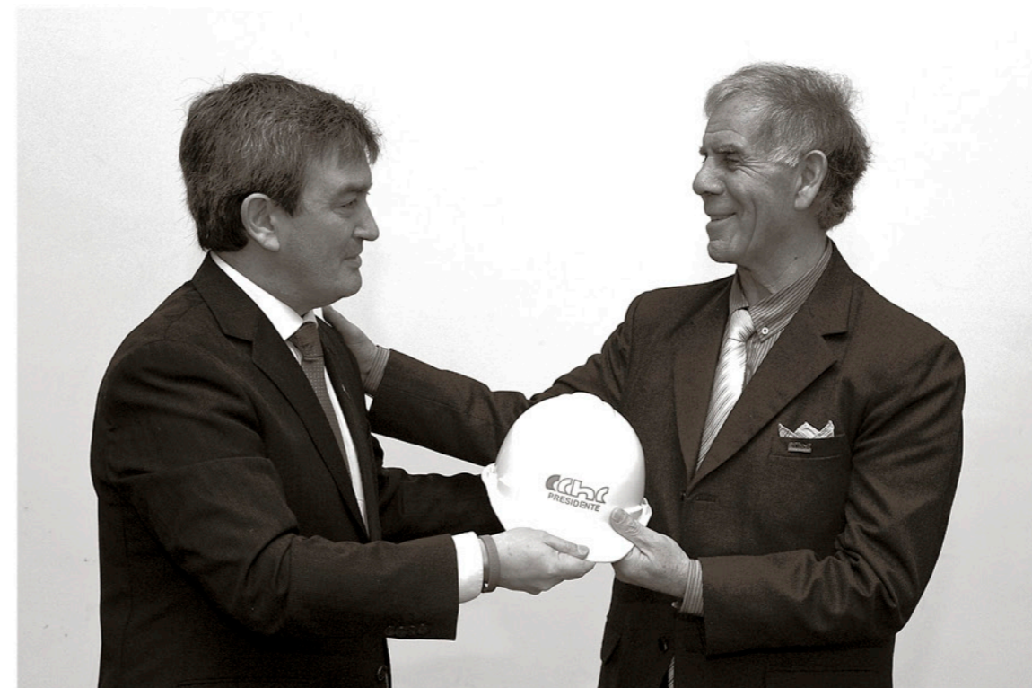
Cambio de mando Cámara Chilena de la Construcción Los Ángeles.

rollo integral. Acá hay muchas personas capacitadas, no sólo quienes cuentan con educación formal superior sino también, mucha gente humilde que a través de su oficio es capaz de resolver muchos problemas que se le presentan. Aprovechemos la instancia, para vivir bien ahora y permitamos que los que vienen también lo hagan, porque ellos tendrán que aportar lo suyo en su minuto”.