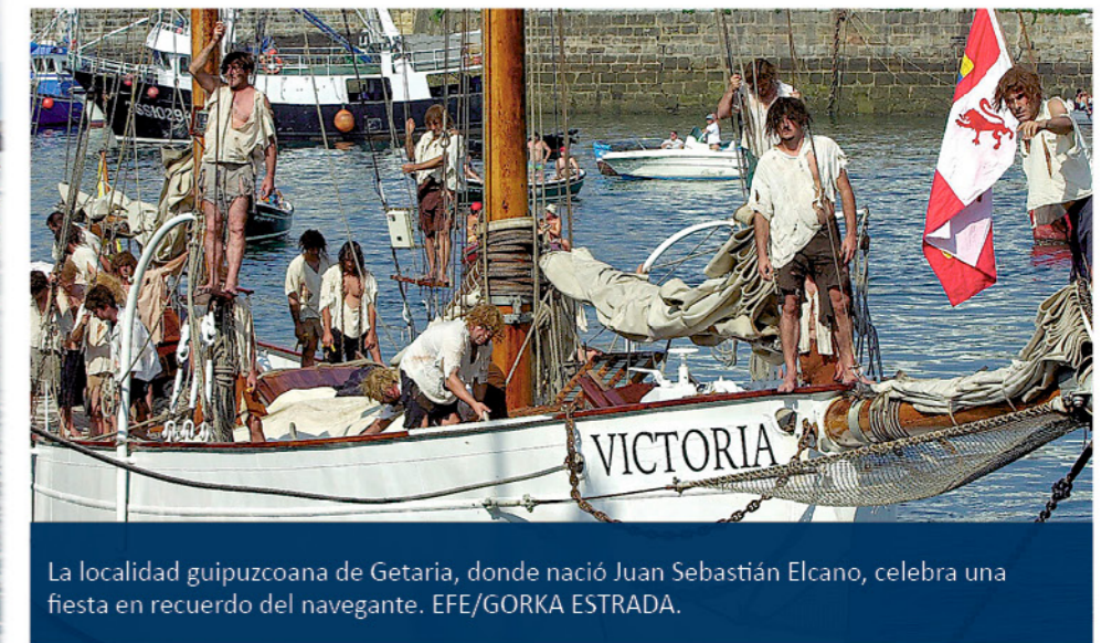
La localidad guipuzcoana de Getaria, donde nació Juan Sebastián Elcano, celebra una fiesta en recuerdo del navegante.