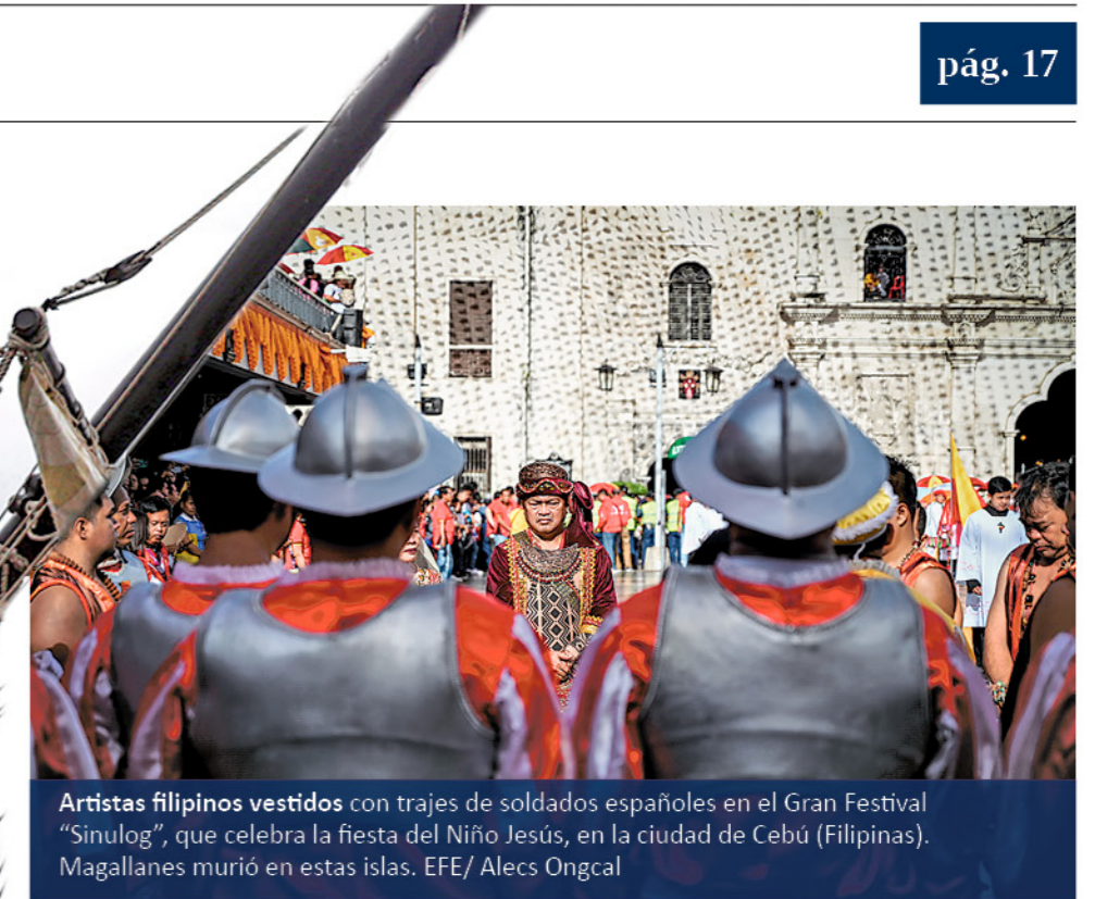
Artistas filipinos vestidos con trajes de soldados españoles en el Gran Festival "Sinulog", que celebra la fiesta del Niño Jesús, en la ciudad de Cebú (Filipinas). Magallanes murió en estas islas.