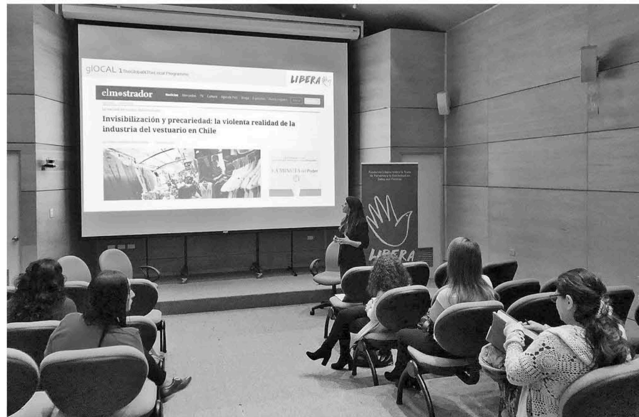
TALLERES ESPECIALIZADOS dictados en Concepción por la Fundación Libera en torno a la Trata de Personas.