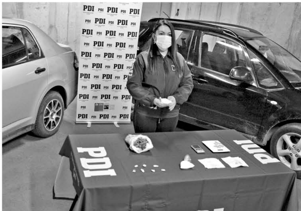
SEGÚN MANIFESTÓ PERSONAL DE LA PDI, con este procedimiento se retiró una importante cantidad de droga en circulación.

Más de seis millones de pesos en droga, dos autos y cuatro detenidos, fue el resultado de un procedimiento policial realizado por personal de la Brigada Antinarcóticos y contra el Crimen organizado (Brianco) de Los Ángeles.