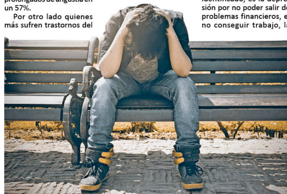
LA ENCUESTA COMPLETA en www.cadem.cl

Otro dato es que la depresión, que es muy común que alguien declare que tiene esta enfermedad, se ubicó como el sexto padecimiento de salud mental que más se presenta: un 40 por ciento