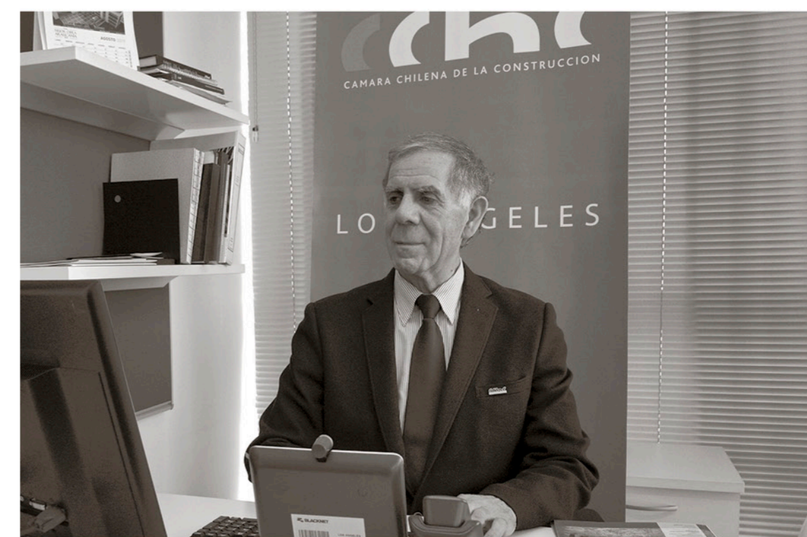
Instalado en su nueva oficina relató a La Tribuna su vida personal y profesional.

Fue ahí, que con la empresa en marcha, volvió a las aulas. Esta vez en Los Ángeles, en el Colegio Teresiano. Un reemplazo de seis meses, como Inspector General. Finalmente, estuvo dos años y renunció para asumir un cargo similar en la Escuela Isla del Laja, perteneciente al sistema municipal. Tres años después, fue trasladado a la escuela 2, en la ciudad, frente al hospital. Su empresa ya estaba consolidándose y los tiempos escaseaban. Por tanto, renunció para dedicarse 100% a su negocio. “Ya teníamos varios proyectos, obras, propuestas, pero me faltaba algo”.