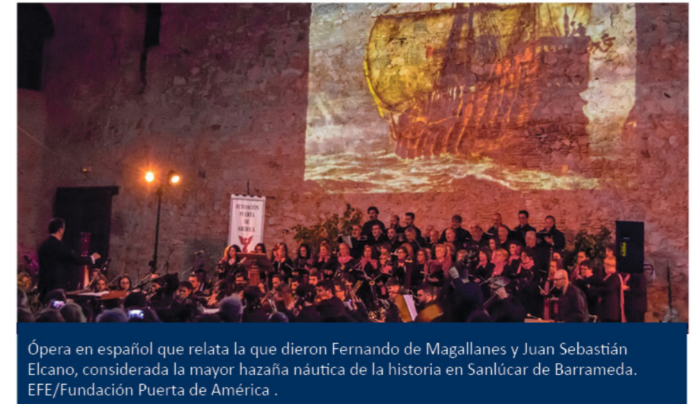
Ópera en español que relata la que dieron Fernando de Magallanes y Juan Sebastián Elcano, considerada la mayor hazaña náutica de la historia en Sanlúcar de Barrameda.

Así de extrema era la situación que Elcano evitó hacer escalas en el viaje de vuelta. Más cuando se decidió a abordarla por el Océano Índico. Solo in extremis se atrevió a hacer una parada, ya en Cabo Verde, y ante la falta total de alimentos. Fue entonces cuando los portugueses encarcelaron a doce hombres de la nave Victoria, que tras ser perseguida logró escapar.