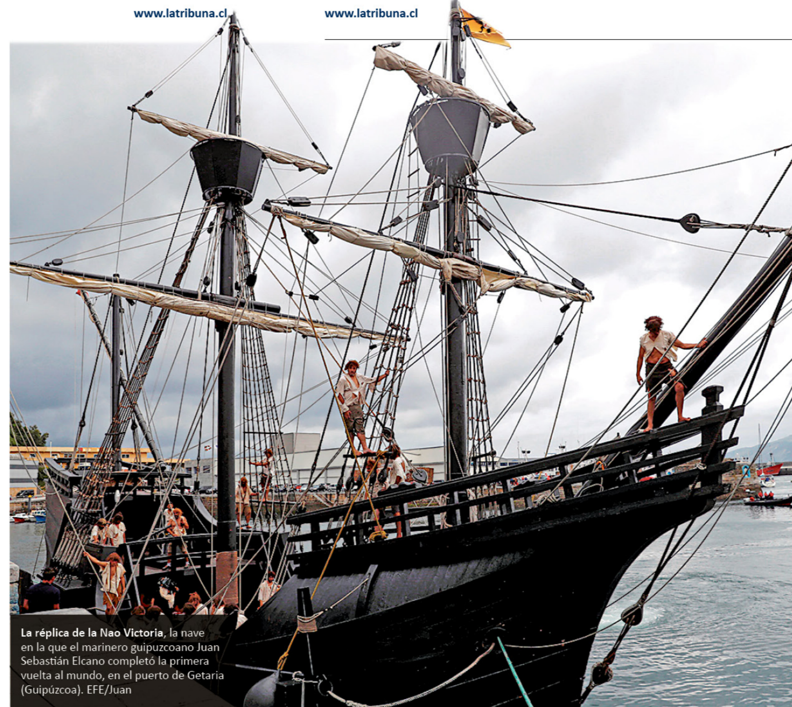
La réplica de la Nao Victoria, la nave en la que el marino guipuzcoano Juan Sebastián Elcano completó la primera vuelta al mundo, en el puerto de Getaria (Guipúzcoa).

Coinciden las crónicas en resaltar como el soberano luso recibió al hasta entonces