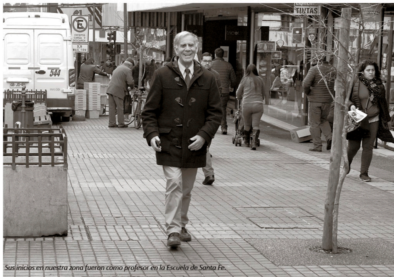
Sus inicios en nuestra zona fueron como profesor en la Escuela de Santa Fe.

como una ciudad limpia, amable, acogedora con los visitantes, con muchos espacios cívicos para la expresión de la gente, una ciudad verde, ecológica”. En esta misión, a un rol activo de la ciudadanía y de quienes hoy lo acompañan en tu tarea como presidente de la Cámara Chilena de la Construcción. “Invito a toda la ciudad, a toda la provincia a que nos sumemos. Hagamos que esta provincia que es tan rica en Energía, en el área Forestal y en las personas, sea un referente nacional de crecimiento y desa-