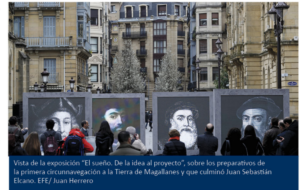
Vista de la exposición "El sueño. De la idea al proyecto", sobre los preparativos de la primera circunnavegación a la Tierra de Magallanes y que culminó Juan Sebastián Elcano.