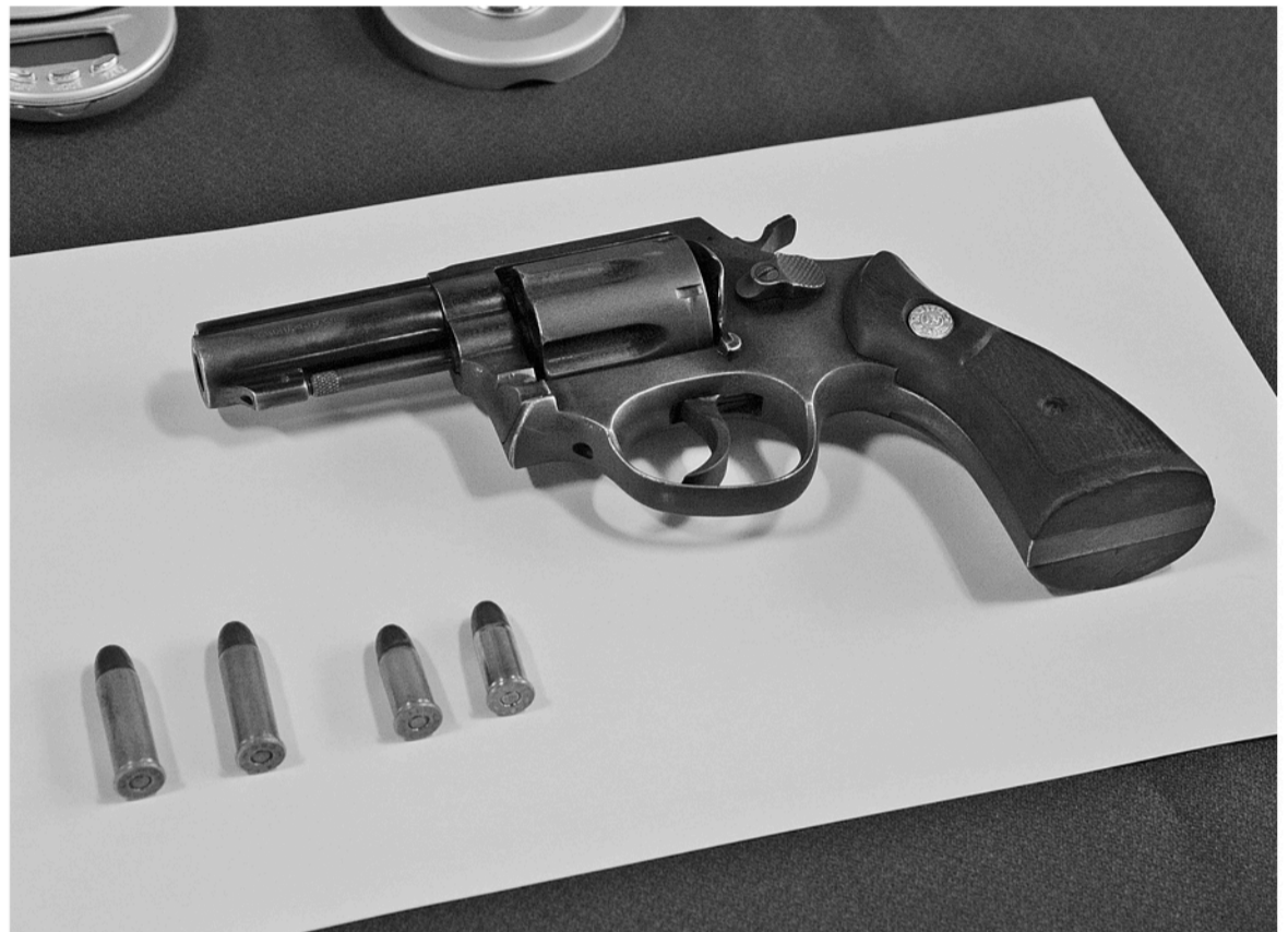
TODAS LAS ARMAS que estén circulando o se encuentren en una vivienda deben ser debidamente inscritas de lo contrario significa una falta. (Fotografía de contexto).

Hay que destacar que la otra alternativa de sumar el retiro de armas ilegales se lleva a cabo por medio de los procedimientos poli-