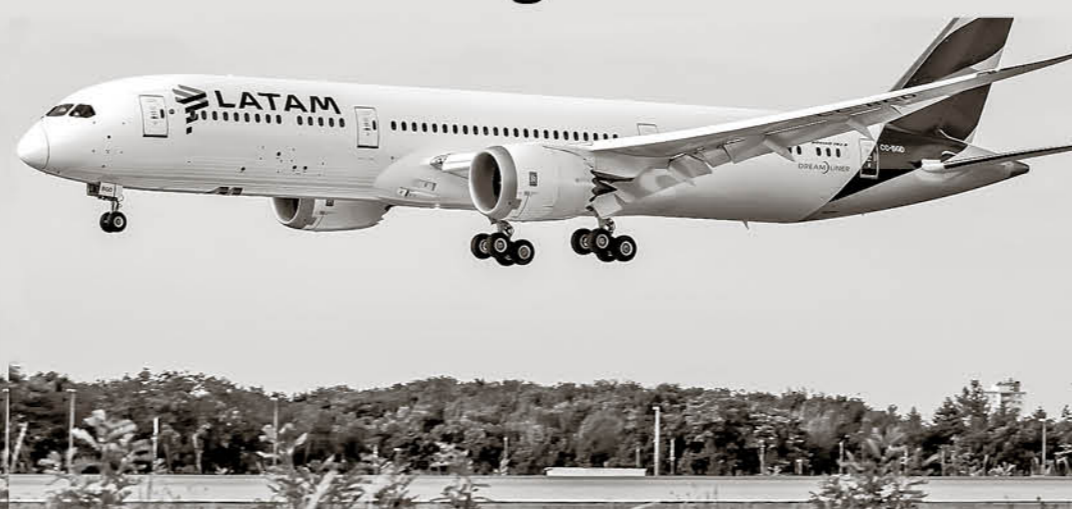
LATAM aparece por primera vez en la ruta de María Dolores.

quien comentó que se trabajó el tema de la demanda por pasajes que se podría dar desde nuestra provincia: "se mostró de forma preliminar la demanda comercial que existe actualmente por parte de los viajes que se efectúan en cada una de las comunas hasta la capital nacional. Y con las mismas aerolíneas