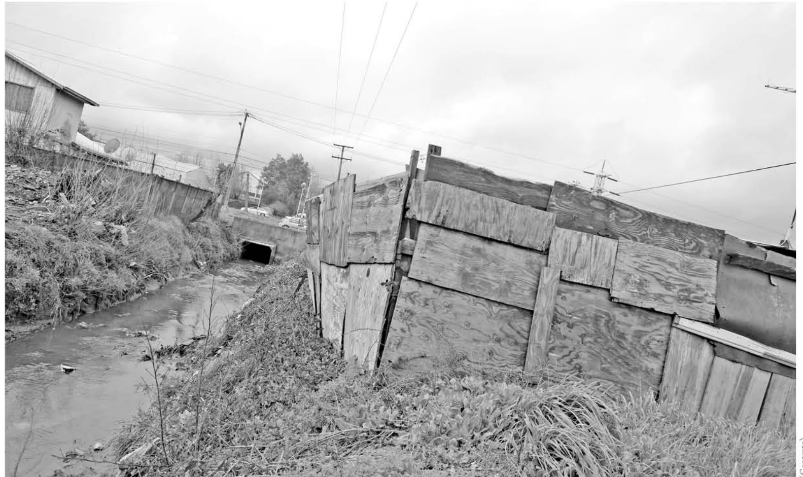
EMBLEMÁTICO CAMPAMENTO EL TRIÁNGULO en la comuna de Los Ángeles fue erradicado y se encontraba al final de la avenida Ricardo Vicuña.