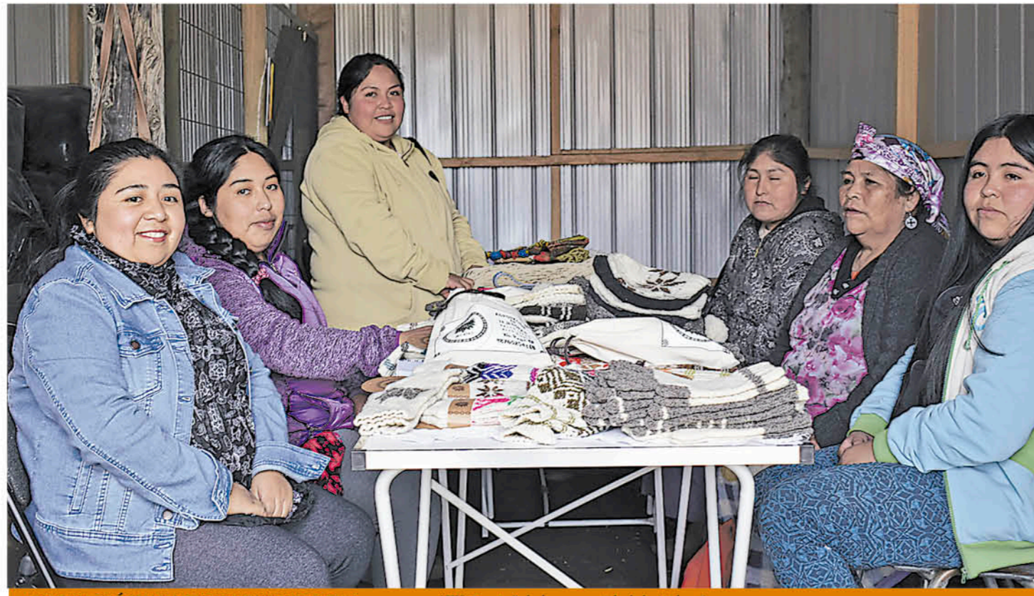
AGRUPACIÓN DE MUJERES TEJEDORAS y artesanas "We Rayin" de la comunidad de Ralco Lepoy.

La alta cordillera de Biobío es conocida por sus hermosos paisajes. Montañas, ríos, vegetación y un sinfín de atractivos hacen que cada visitante que llegue al territorio se maraville con sus bondades. Distante a un poco más de una hora de Ralco, se encuentra la comunidad de Ralco Lepoy, por la ribera del río Biobío, en la que viven familias pehuenches de esfuerzo, las que día a día luchan por vencer las adversidades y sacar adelante a sus seres queridos. La distancia del territorio con los centros urbanos, la escasez de oportunidades laborales y la vulnerabilidad son algunas de las limitaciones a lo que deben hacer frente estas familias. Las mujeres de la comunidad debido a los obstáculos decidieron agruparse y dar vida a un emprendimiento denominado "We