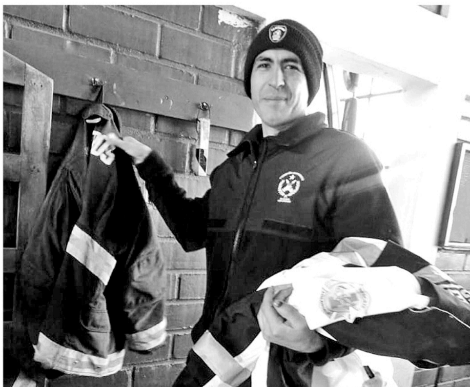
LA BÚSQUEDA SE REALIZÓ por diferentes medios de comunicación y plataformas informativas.