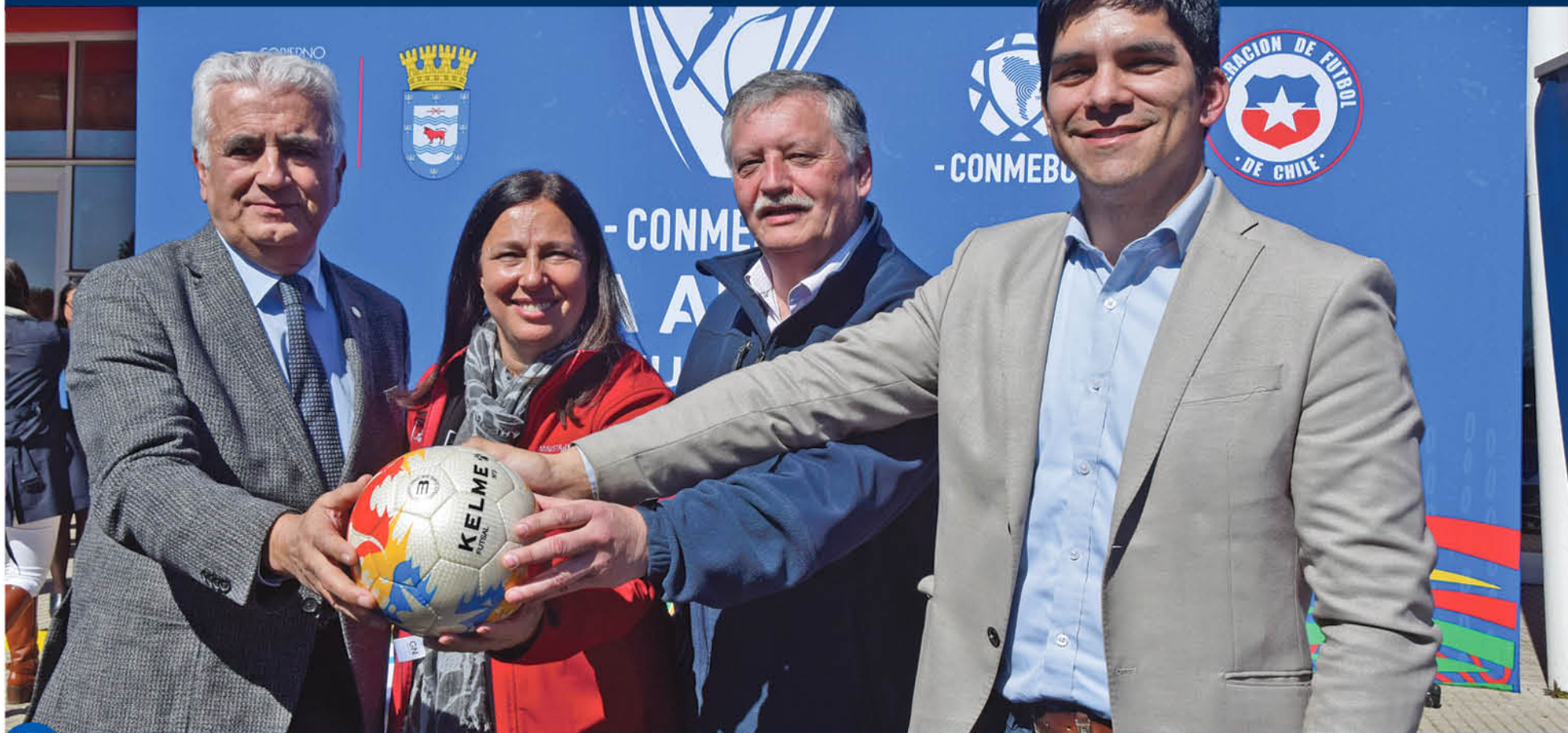
ESTE 26 DE SEPTIEMBRE se realizará el sorteo oficial de la Copa América para conocer como estarán divididos los grupos y cuáles serán los rivales de la "Roja" del fútbol.