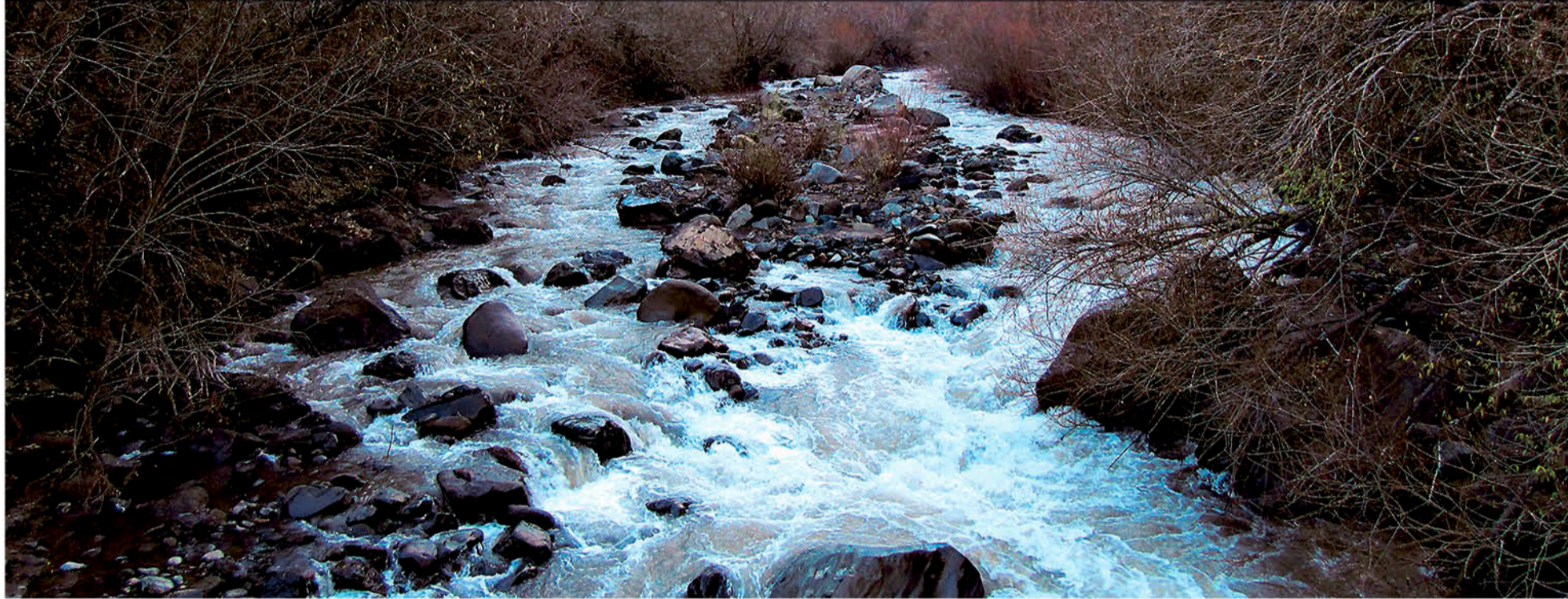
SE PROPONE REALIZAR OBRAS de canalización en el río Queuco. El primer tramo transportaría agua desde la región de Biobío hasta la región Metropolitana.