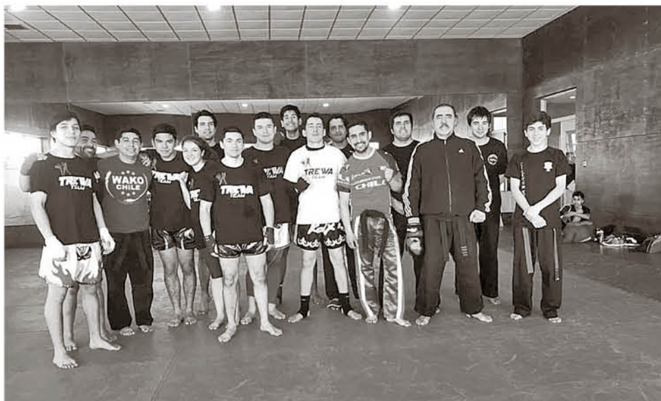
EL KICK BOXING en de Team Trewa está logrando captar incluso alrededor de cuarenta personas por clase.

Lo que permitirá una mayor descentralización en cuanto a los procesos deportivos que generalmente debían ser efectuados en Santiago y servirá como apoyo para otras instituciones deportivas de la Provincia de Bío Bío, que requieran realizar procesos federativos sin la necesidad de tener que viajar hasta la capital nacional.