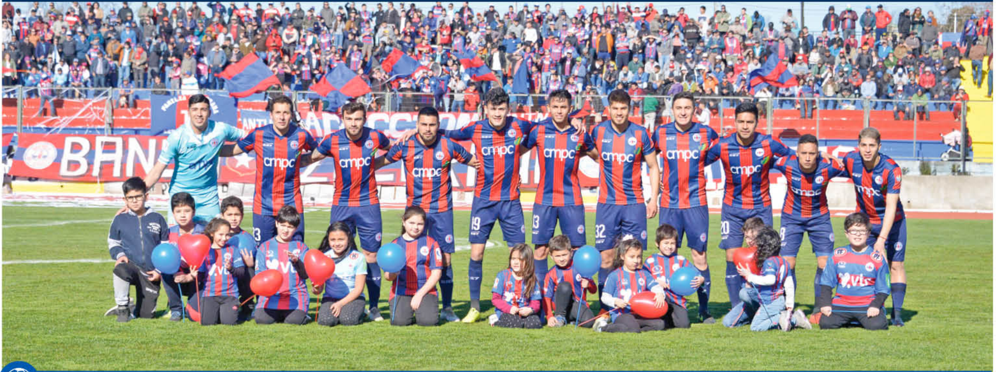
DEPORTES IBERIA disputará el primer encuentro de la liguilla por el ascenso en calidad de local contra San Marcos de ARICA.