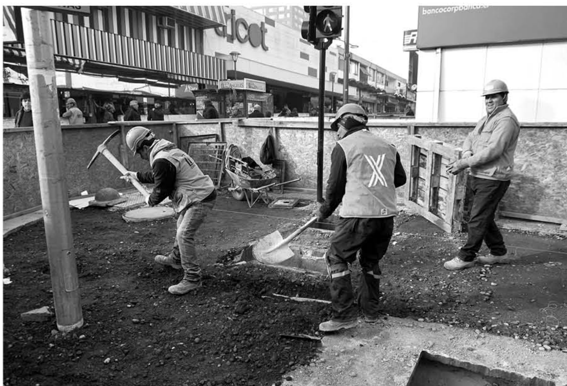
EL PROYECTO QUE BUSCA rebajar las horas de trabajo a 40 debe pasar a la sala para su votación, luego irá al Senado para su siguiente trámite legislativo