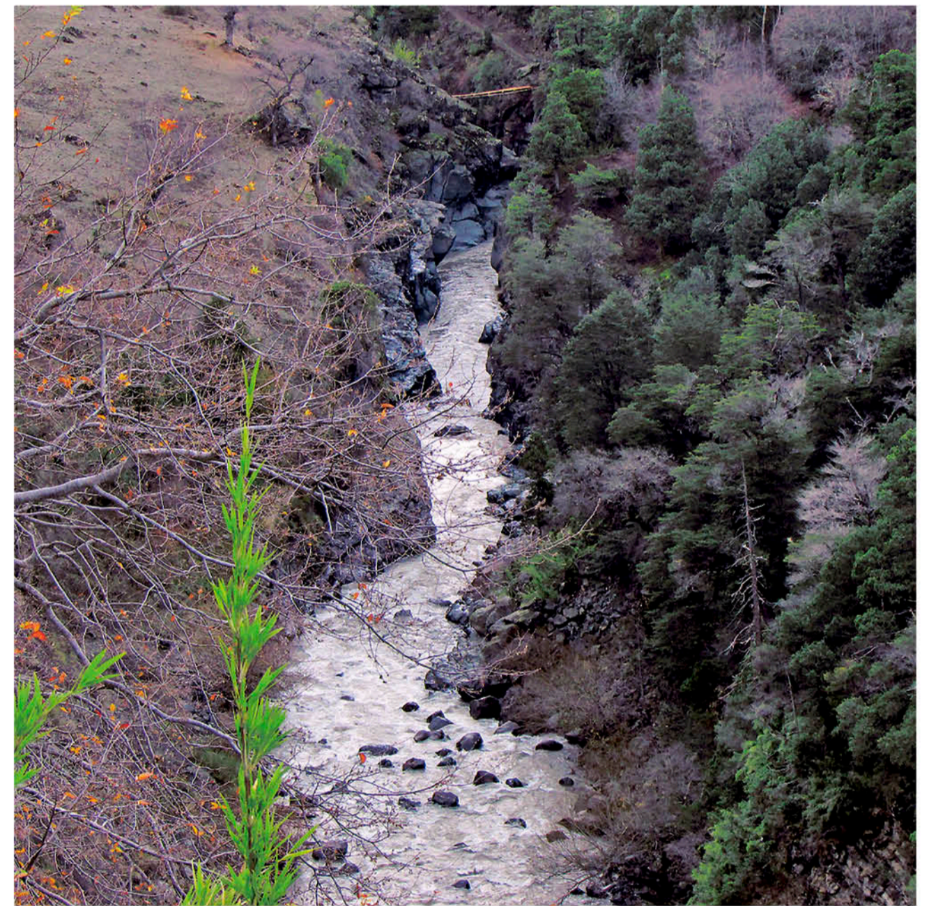
LA CARRETERA HÍDRICA CONSIDERA una longitud de 1.015 kilómetros y pretende regar 324.732 nuevas hectáreas agrícolas en 71 comunas de la zona central del país.

Además de pregunta para quién será el agua, citando un reciente estudio encargado por Corfo, en el marco de los proyectos de carretera hídrica, que determina la disposición a pagar por el agua, en la eventualidad de que se trasladan recursos hídricos desde el sur hacia el norte del país. "Los resultados del estudio establecen que las empresas mineras y sanitarias podrían pagar, como valores promedios, un 600% más de lo que podrían pagar los agricultores", expresó. Ante este escenario, y considerando que la inversión en una carretera hídrica la realizará un privado y, por tanto, debe rentabilizarse, "queda muy claro que el agua que se proyecta extraer desde las cuencas del sur se destinará principalmente a la explotación minera, por consiguiente, no es creíble que las aguas podrían utilizarse mayoritariamente en el desarrollo agrícola de nuevas zonas del país. Me parece que decir que se va a duplicar la superficie agrícola de Chile, con un proyecto de carretera hídrica, es sólo la justificación para aprobar socialmente una obra que busca otros intereses".