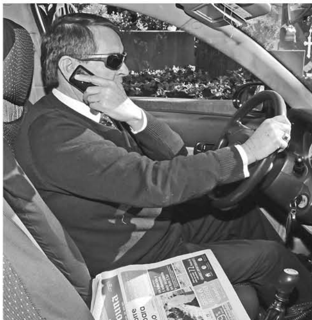
LA PUBLICACIÓN FUE DESMENTIDA con el paso de las horas por medio de diferentes redes sociales.

Durante la jornada del miércoles por diversas redes sociales circuló un aviso donde se daba a conocer el proceso de regulación que se aplicaría desde el 4 de septiembre.