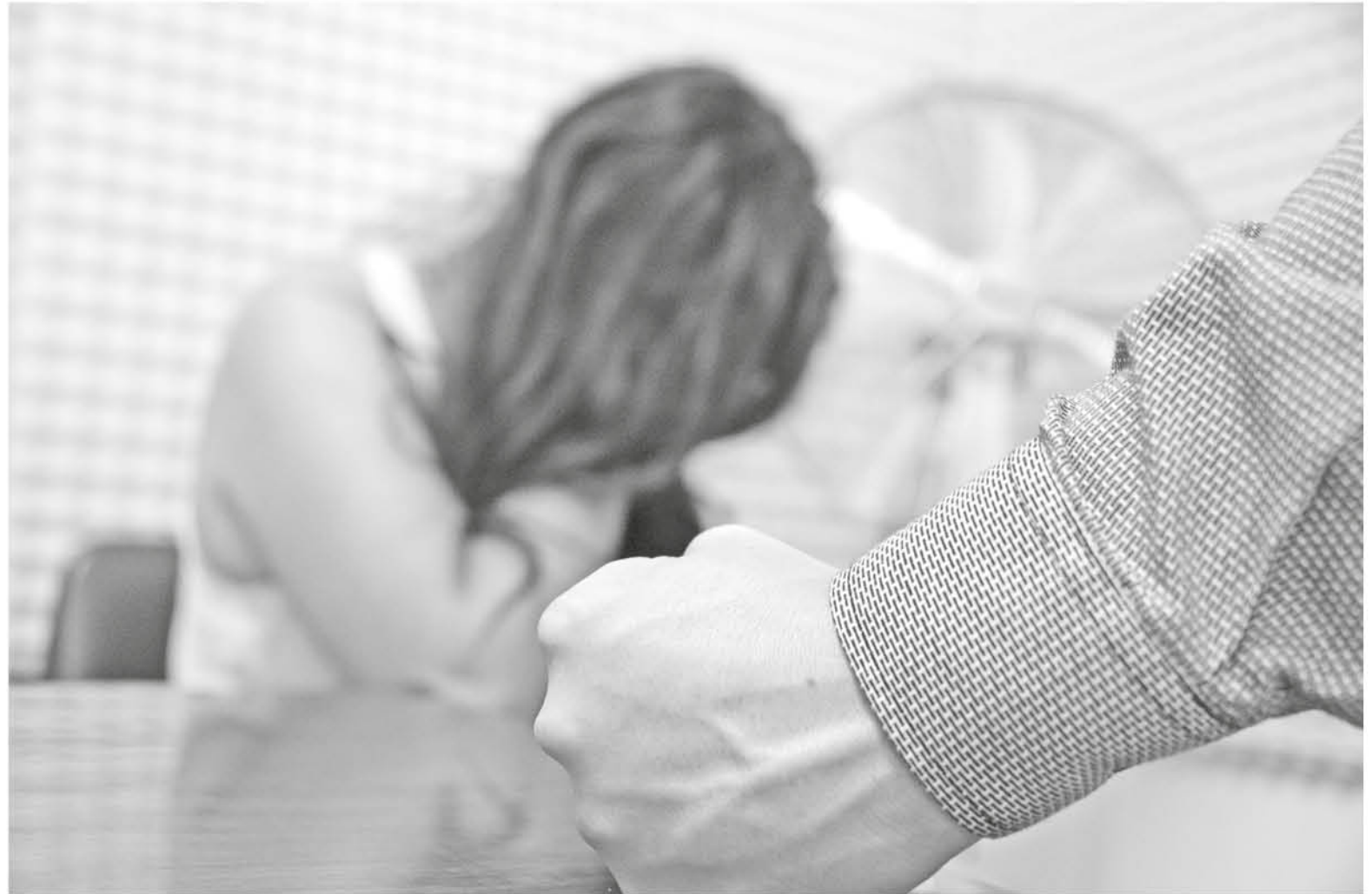
LOS DELITOS SEXUALES marcaron el mayor número de ingresos seguido de los robos violentos, homicidios y lesiones.

atención en el pasaje Los Cóndores 197 por la avenida Ricardo Vicuña, cuenta con un equipo multidisciplinario de profesionales, que entrega asistencia a las víctimas.