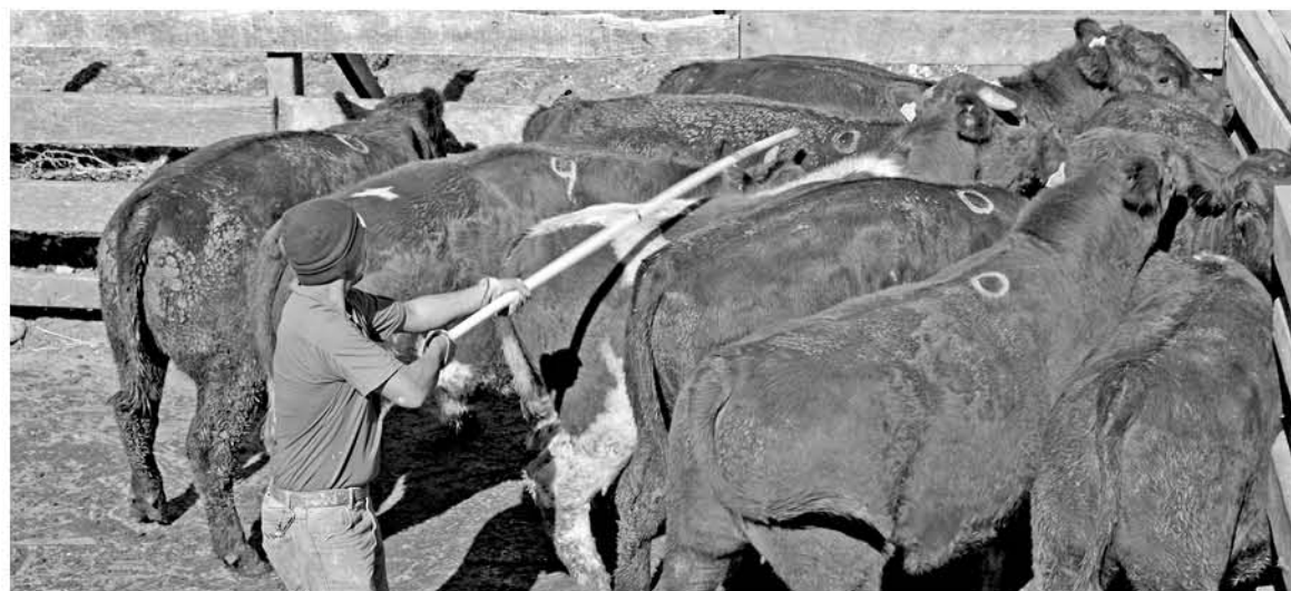
LAS FISCALIZACIONES van a aumentar en las siguientes semanas.

El SAG, en tanto, durante todo el 2018 realizó un total de 146 fiscalizaciones, 69 en Biobío, 45 en Concepción y 32 en Arauco; cursando 15 infracciones, 10 de ellas en Biobío, 1 en Concepción y 4 en Arauco.