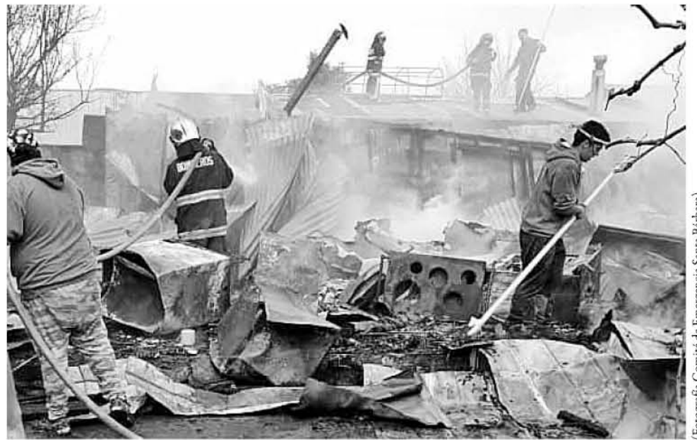
HASTA EL MOMENTO las personas afectadas en su mayoría acudieron donde familiares.

Salamanca agregó que “quiero agradecer a Bomberos y Carabineros que estuvieron