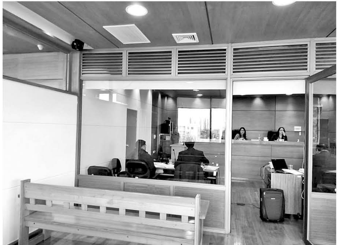
EL LAZO ENTRE LA MENOR dada a luz y su padre se determinó por medio de pruebas de ADN.

“El tribunal acogió las peticiones del Ministerio Público y condenó al imputado, luego de las pruebas ente un informe pericial que estableció la discapacidad mental de la víctima quien no podía consentir un acto sexual y el contexto familiar de la