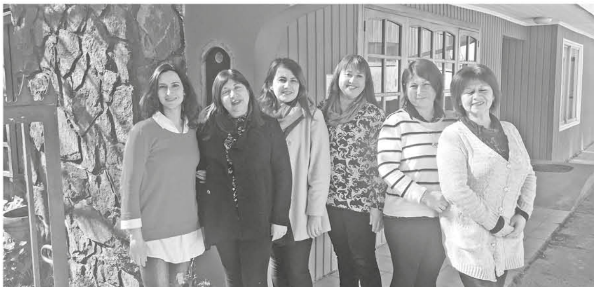
EL EQUIPO DE ATENCIÓN asiste a los y las denunciantes con un equipo multidisciplinario de profesionales, que responde a las atenciones por demanda espontánea o derivaciones.

"Se recomienda que las víctimas tomen esta alternativa gratuita, que se otorga por parte de la Subsecretaría de Prevención del Delito y acceder a estos servicios, con un apoyo integral para las víctimas de delitos violentos", añadió.