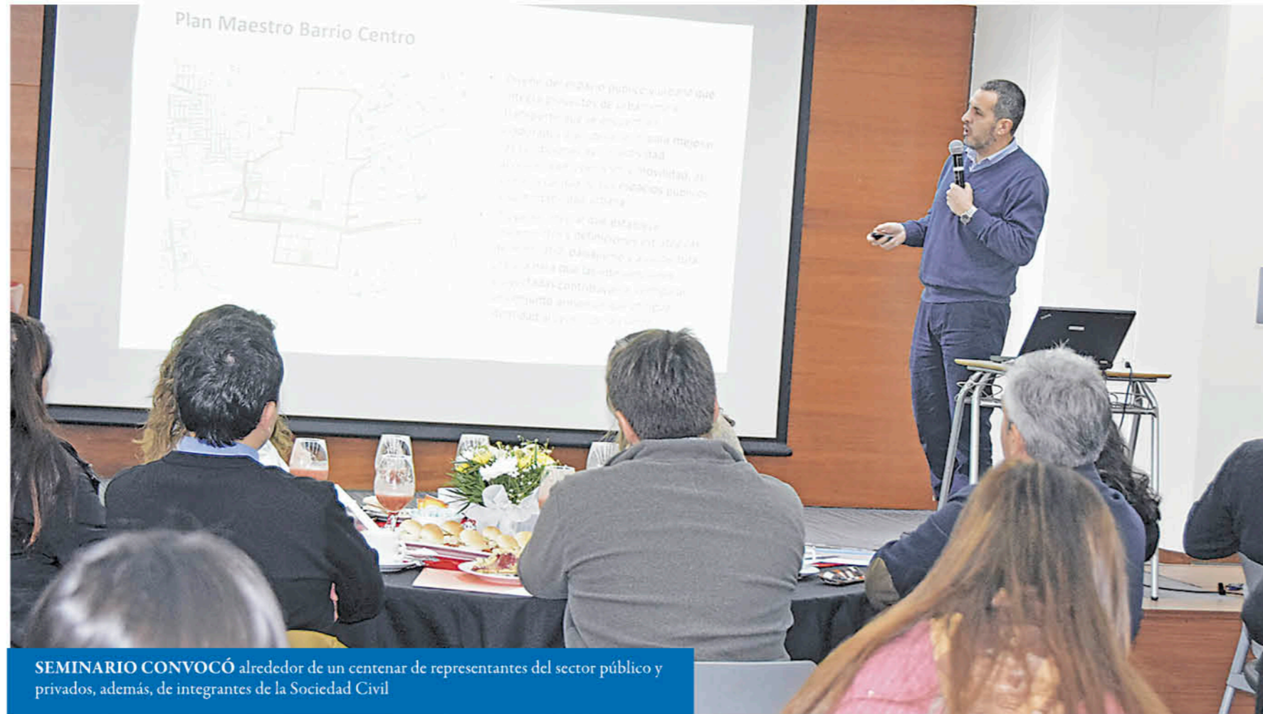
SEMINARIO CONVOCÓ alrededor de un centenar de representantes del sector público y privados, además, de integrantes de la Sociedad Civil

les, Universidad de Concepción, Inacap, Serviu, CMPC, y Diario La Tribuna; quienes en conjunto realizan un trabajo sostenido, desde el año 2018, en pro del desarrollo de nuestra comuna. En este marco, se realizó ayer la instancia académica – participativa que convocó a actores públicos y privados e integrantes de la sociedad