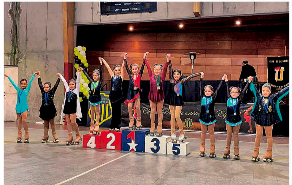
A LA COMPETENCIA ORGANIZADA por el Club Deportivo Lo Espina, asistieron 15 destacadas organizaciones del país.

angelino destacó el progreso de las pequeñas, ya que "han mejorado bastante, sobre todo por la confianza que