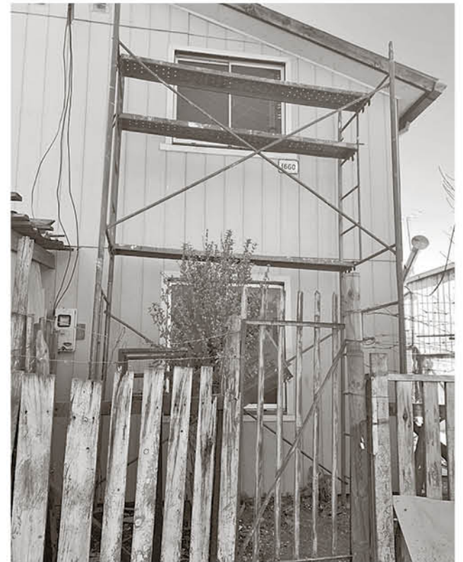
MEJORAS A LAS VIVIENDAS que actualmente son habitadas por adultos mayores en la provincia de Biobío. Las reparaciones se están realizando en la fachada, ventanas, baños, y paredes en general.

Este tipo de viviendas corresponden a condominios y se enmarcan en un convenio entre el Servicio Nacional del Adulto Mayor, Senama, y el Ministerio de Vivienda. Otorga casas adecuadas para personas mayores, proporcionando apoyo psicosocial y comunitario con la finalidad