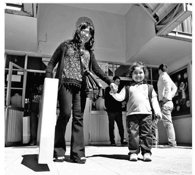
LOS MENORES de la escuela El Saber fueron los primeros beneficiados.