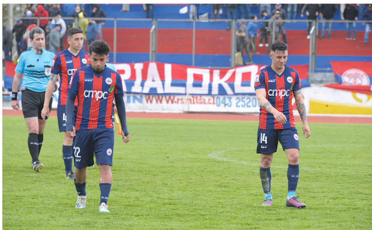
ESTA DERROTA es la primera de la escuadra azulgrana en su carrera por el ascenso.

segunda mitad del partido, Deportes Iberia entró al campo de juego con las revoluciones bajas, en contraste a su desempeño en el primer tiempo. Esta desconcentración de la escuadra azulgrana fue aprovechada por Deportes Colchagua, que atacó en reiteradas ocasiones el arco local, logrando incomodar a la defensa, que no logró contener de forma adecuada las arremetidas del rival.