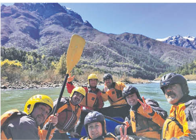
DESCENSOS EN RAFTING guiados bajo los más altos estándares de seguridad también son unos de los puntos altos de este destino turístico.

Estas actividades incrementan la producción de la serotonina u hormona de la felicidad, e inhiben la del cortisol, relacionado con el estrés. El ejercicio al sol posibilita que el cuerpo sintetice las cantidades de vitamina D necesarias para que estructuras como los huesos se encuentren en condiciones óptimas.