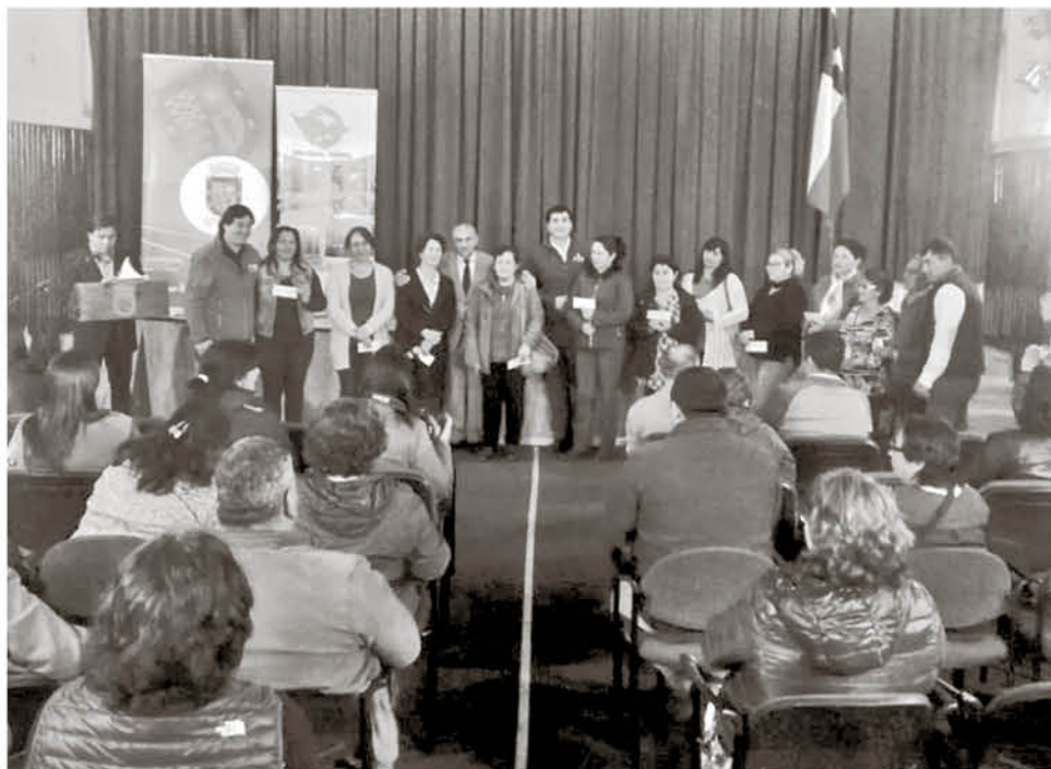
DIFERENTES EMPRENDIMIENTOS resultaron beneficiados con este proyecto.

Cabe recordar que la ayuda se invertirá en la compra de materiales para construcción de invernaderos de policarbonato, maquinaria apícola como estampadora de cera, construcción de bodega para almacenaje de productos agrícolas, motocultivadores, compra de frutales, materiales de riego y chancadoras para alimento.