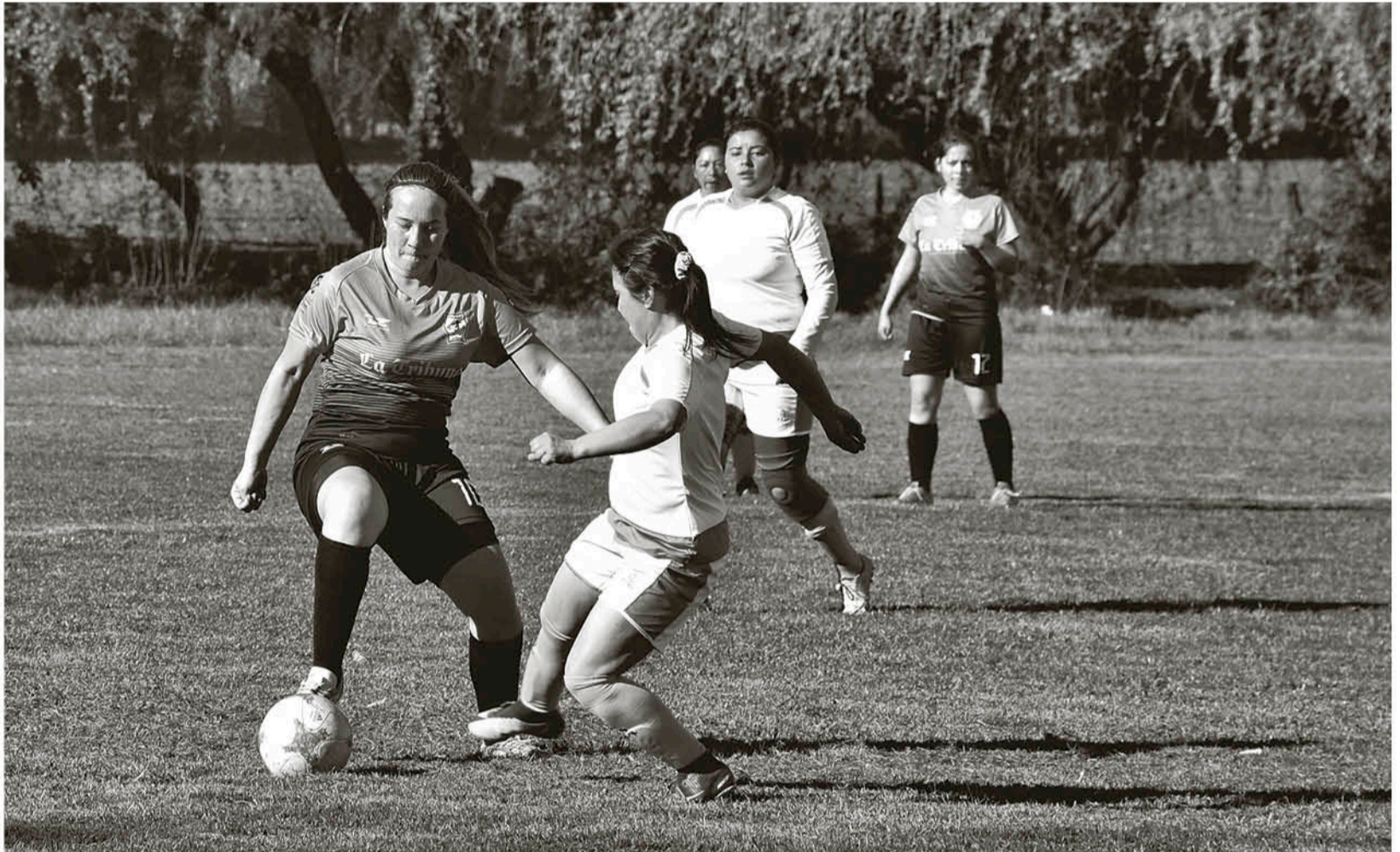
VERMUT FUE A LA VICTORIA a ganar por 3-1 para mantener el liderato del grupo B de la Liga Femenina de Los Ángeles.

Sebastián Carrizo A. prensa@latribuna.cl