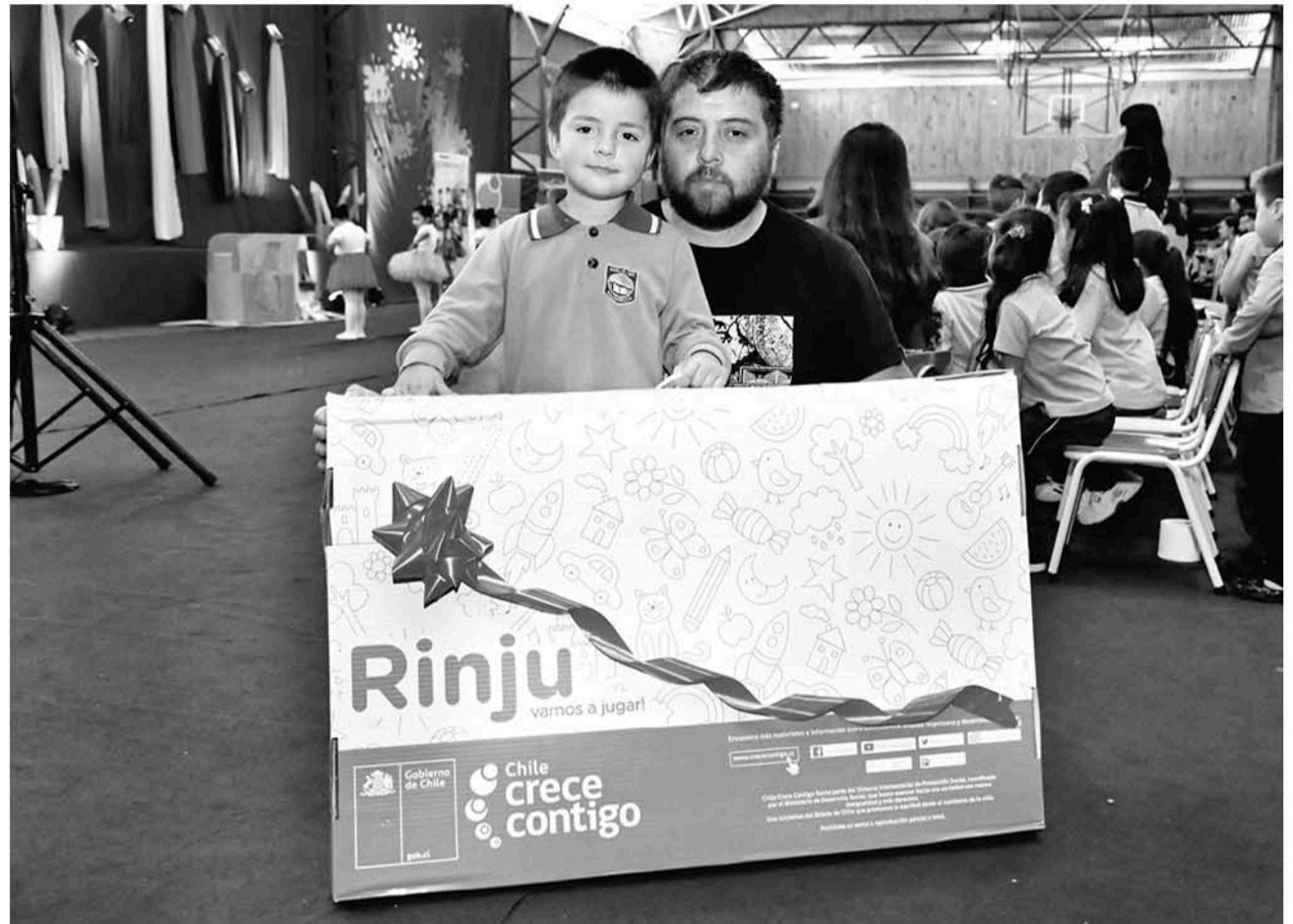
GRACIAS A ESTOS ESPACIOS, los menores pueden crecer conociendo diferentes ámbitos.

Cada implemento de este espacio se encuentra sustentado con evidencia que per-