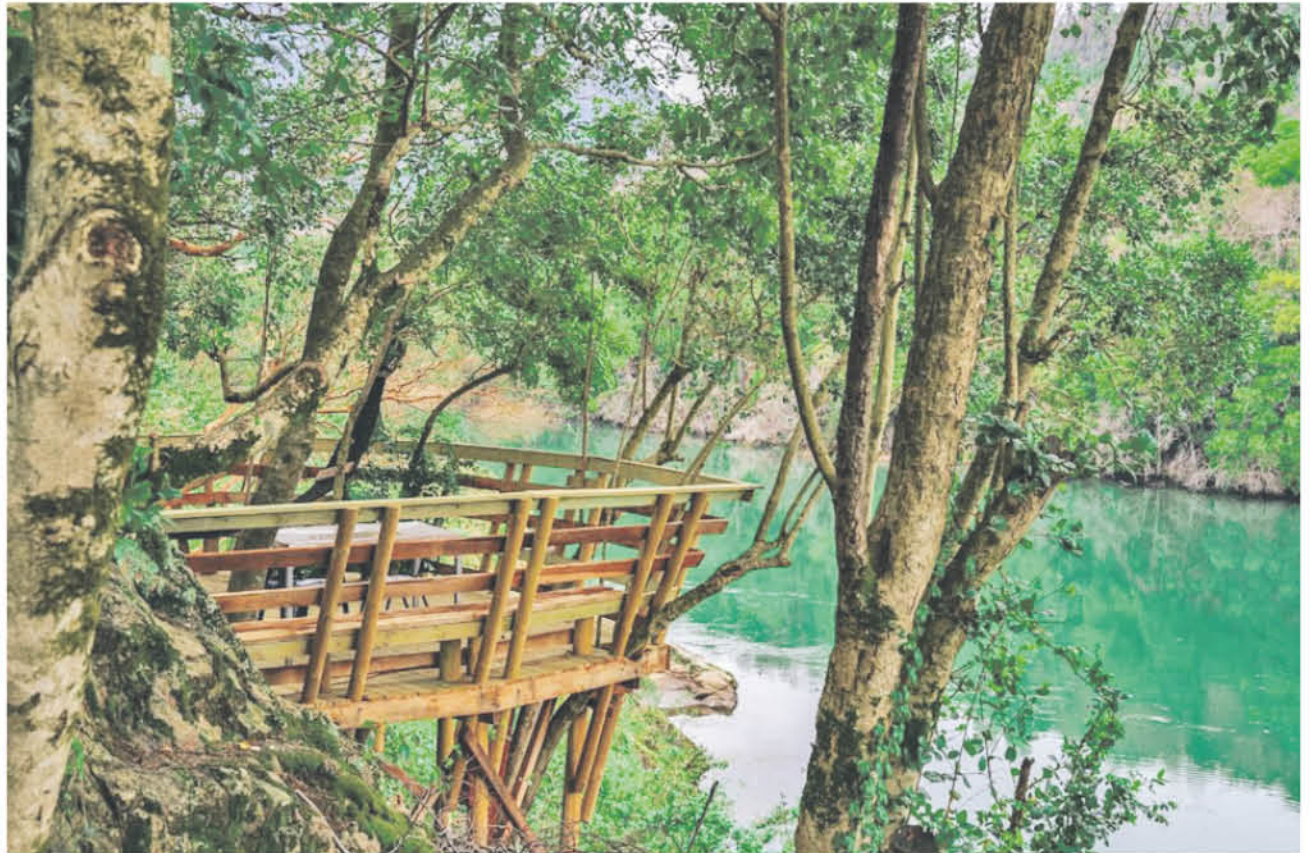
ESTE EMPRENDIMIENTO ha logrado posicionarse como uno de los destinos predilectos; está ubicado camino a la localidad de Alto Biobío, específicamente en el sector de Aguas Blancas.

Y para quienes busquen una experiencia única, Cabañas El Mirador del Biobío también cuenta con descensos en rafting guiados bajo los más altos estándares de seguridad, y también el remo de carácter más deportivo con paseos en kayak, el cual logra una cercanía total con