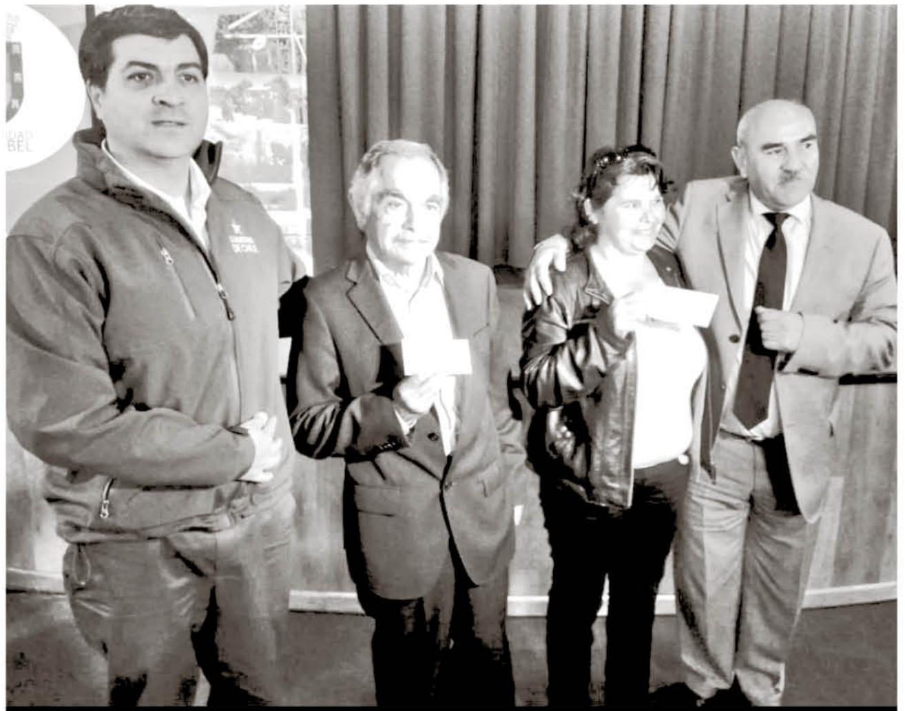
LA CEREMONIA fue oficiada por diversas autoridades de esta índole.

Hay que destacar que el monto total de esta entrega se desglosa en una entrega