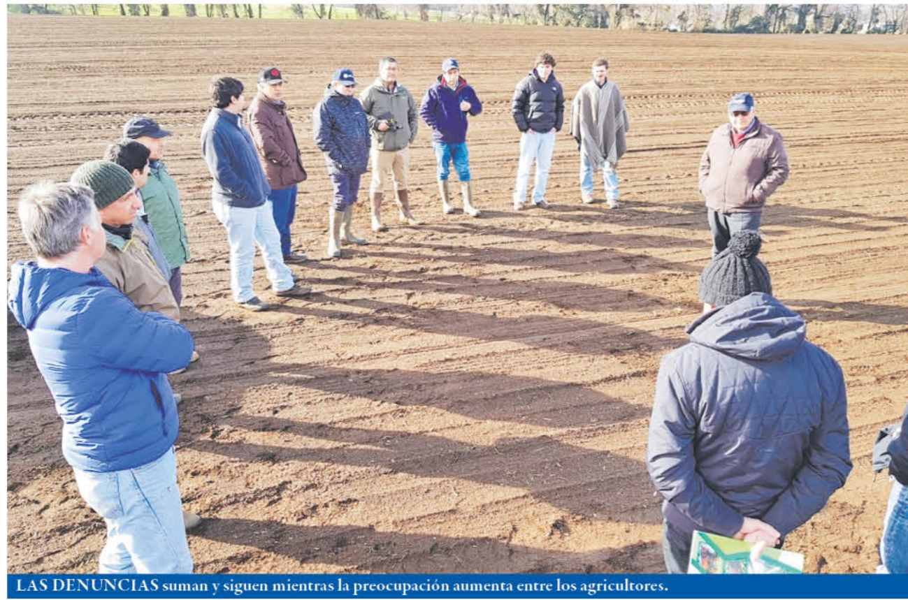
LAS DENUNCIAS suman y siguen mientras la preocupación aumenta entre los agricultores.

La frecuencia de estos robos es periódica. El ingreso a bodegas y predios para delinquir es una situación permanente que afecta desde a un pequeño agricultor al que le roban unos pocos sacos de fertilizante gestionados a través de Indap o su yunta de bueyes, que es su única herramienta de trabajo, hasta a agricultores de mayor volumen de siembra o plantaciones, mayoritariamente empresas pyme.