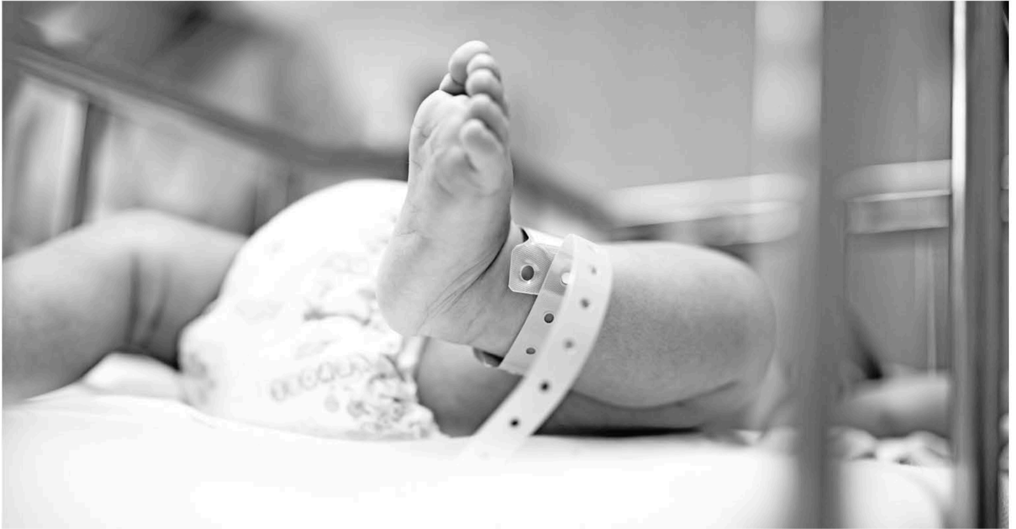
POR EL MOMENTO SE ESPERA la determinación de los respectivos tribunales para conocer el futuro de esta pequeña.