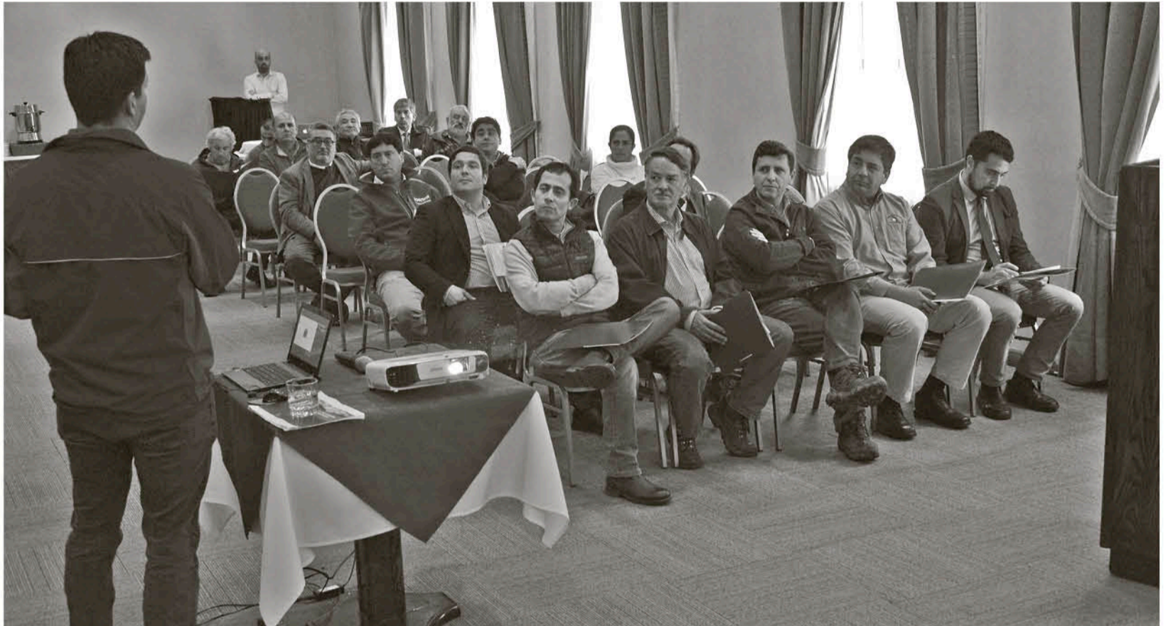
ESTA INICIATIVA TIENE EL OBJETIVO de aumentar la eficiencia en la gestión de los recursos hídricos.

Juan Villalobos Pérez prensa@latribuna.cl