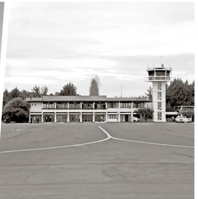
VOLAR SIGUE SIENDO una de las ideas de este gobierno, por eso se confirma que los trabajos a María Dolores continuarán.

“Hay que considerar que este presupuesto corresponde al 7 por ciento del presupuesto general de la región y cuando hablamos de Pichachén, de la Autopista Nahuelbuta, cuando hablamos del aeropuerto, son platas sectoriales que no se mezclan con las platas regionales, por lo tanto, darle la tranquilidad a la gente, que esos son recursos que no se verán afectados para estas