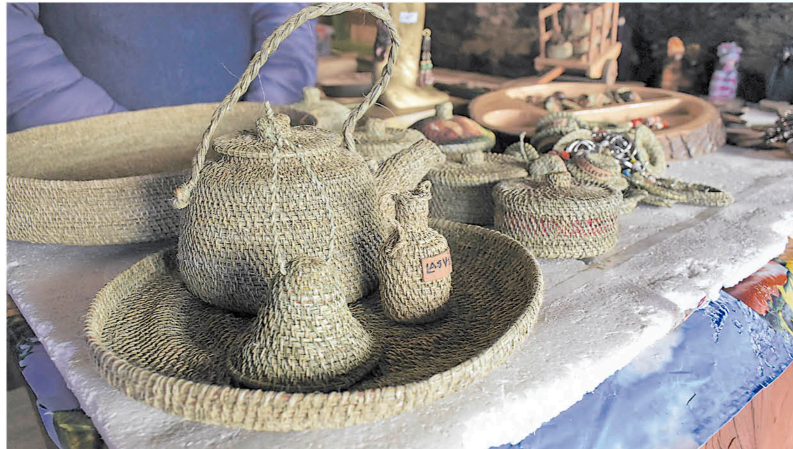
TODO ESTE TRABAJO, la artesana lo realiza para solventar su ingreso familiar.

"Yo creo que este emprendimiento viene desde mi abuela, mi mamá lo practicaba haciendo chupallas, aunque como nosotros éramos nueve hermanos fue algo bien complejo. Entre tanto niño me imagino que era poco lo que podía hacer", manifiesta como una anécdota esta mujer, quien ha hecho de un material natural algo realmente increíble.