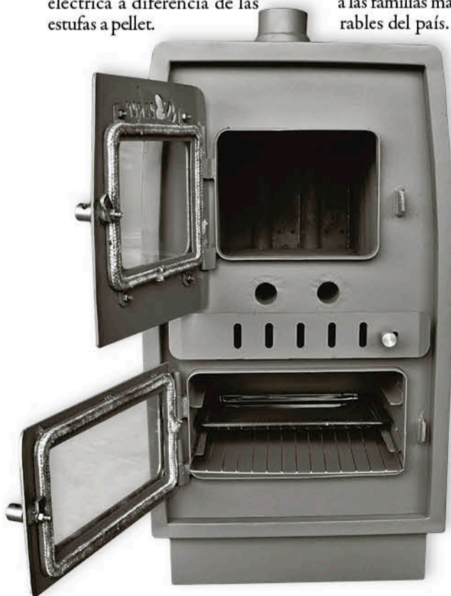
ESTE CALEFACTOR ESTÁ HECHO con una jaula tubular que calienta el hierro y los tubos producen un trabajo de tiraje que mueve el aire, sin necesidad de electricidad.

Para el científico, como proyección, en diez años más la madera seguirá teniendo un costo 10 veces menor que el gas y otras alternativas, ya que se ajustan a los cambios de mercado. De tal manera que a futuro el 80% de la gente va a seguir usando leña como principal opción, por lo que esta estufa que de forma eficiente no emite humo visible y genera calor eficiente, es la solución para la eficiencia y baja contaminación.