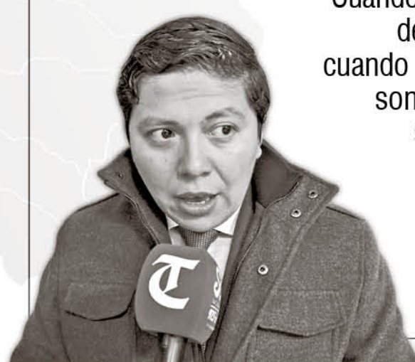
Ignacio Fica, gobernador.

“Cuando hablamos de Pichachén, de la Autopista Nahuelbuta, cuando hablamos del aeropuerto, son platas sectoriales que no se mezclan con las platas regionales, por lo tanto, darle la tranquilidad a la gente, que esos son recursos que no se verán afectados”.