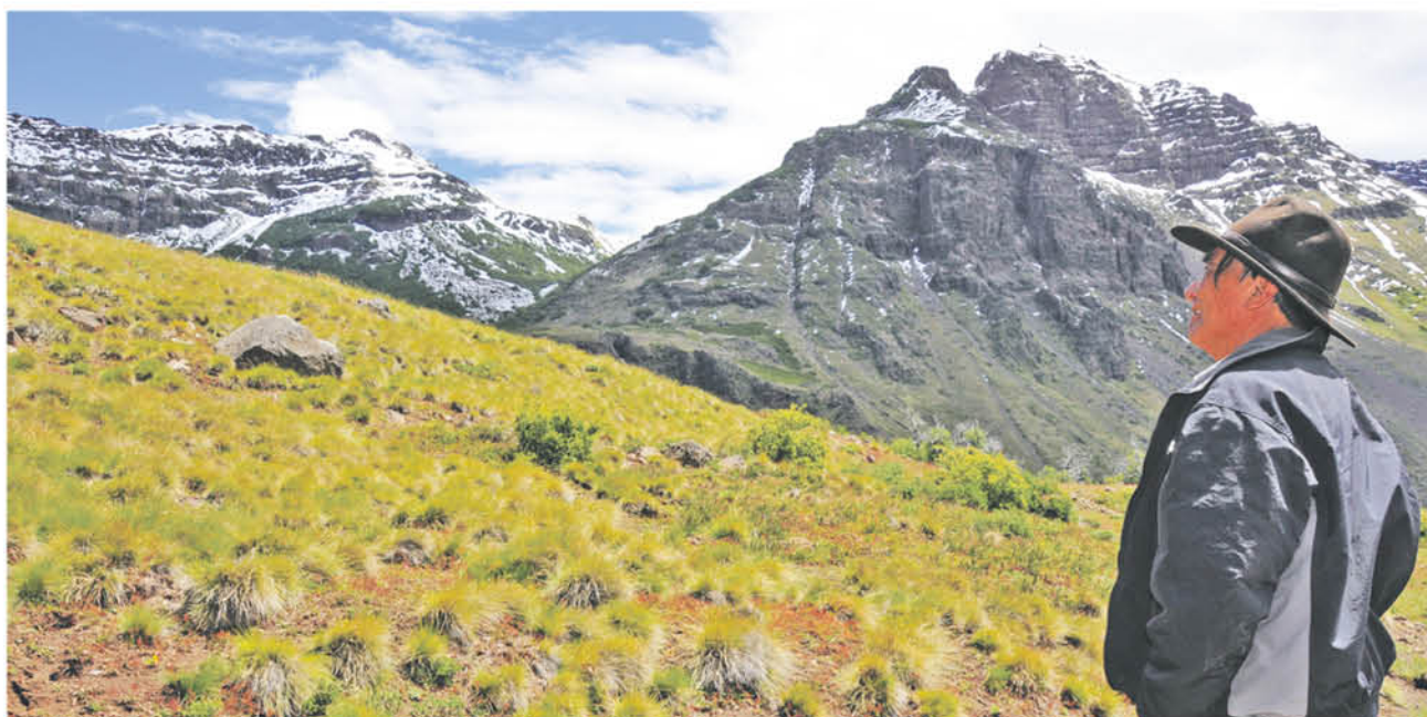
EL VOLCÁN COPAHUE es monitoreado desde 2012, pero hay registros de sus erupciones desde la llegada de los españoles.

Sobre las formas de comunicarse, fue el gobernador Fica el que reaccionó: “Nos preocupó el tema de comunicaciones. Existe sólo un sistema de radios que está en las postas. Nosotros ya presentamos un proyecto al Ministerio del Interior para mejorar este tema y se espera que esta contingencia nos ayude de a lograr eso”.