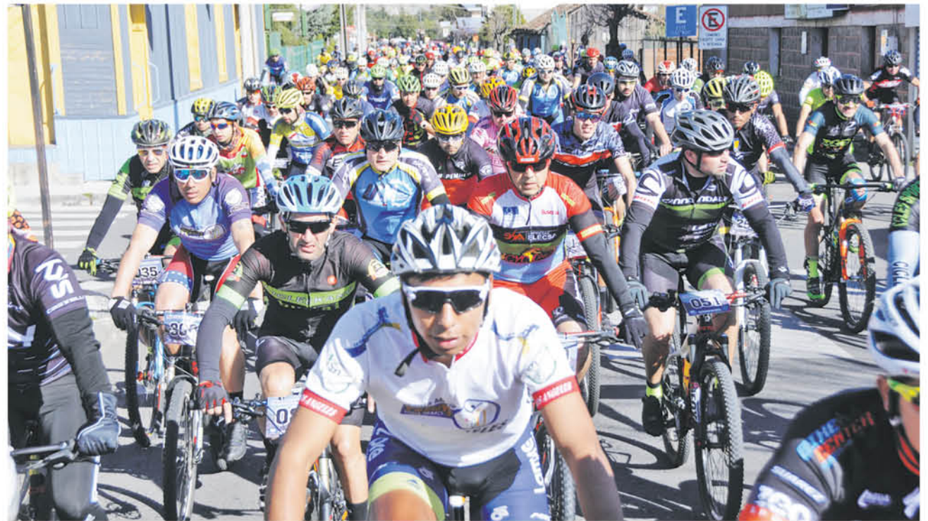
LAS INSCRIPCIONES se extenderán para todos los que deseen participar en la conclusión de todo un ciclo raid a la provincia de Biobío.

“Vamos a ir en modo de entrenamiento y carrera, pero no puedo optar a podio porque había un mínimo de carreras corridas, por lo tanto, pelear las categorías está difícil pese a que he ido a cuatro carreras encontrándome prácticamente tercero