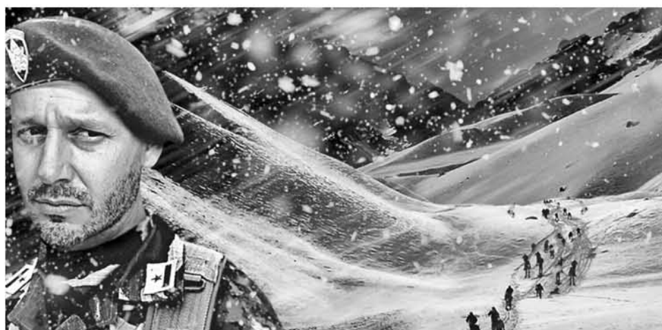
LA PELÍCULA rescatará la tragedia que conmocionó al país en mayo de 2005.

Entre las locaciones, se consideran los refugios “Los Barros” y “La Cortina”, tramos entre los que pretendían marchar los jóvenes conscriptos, que murieron junto al único