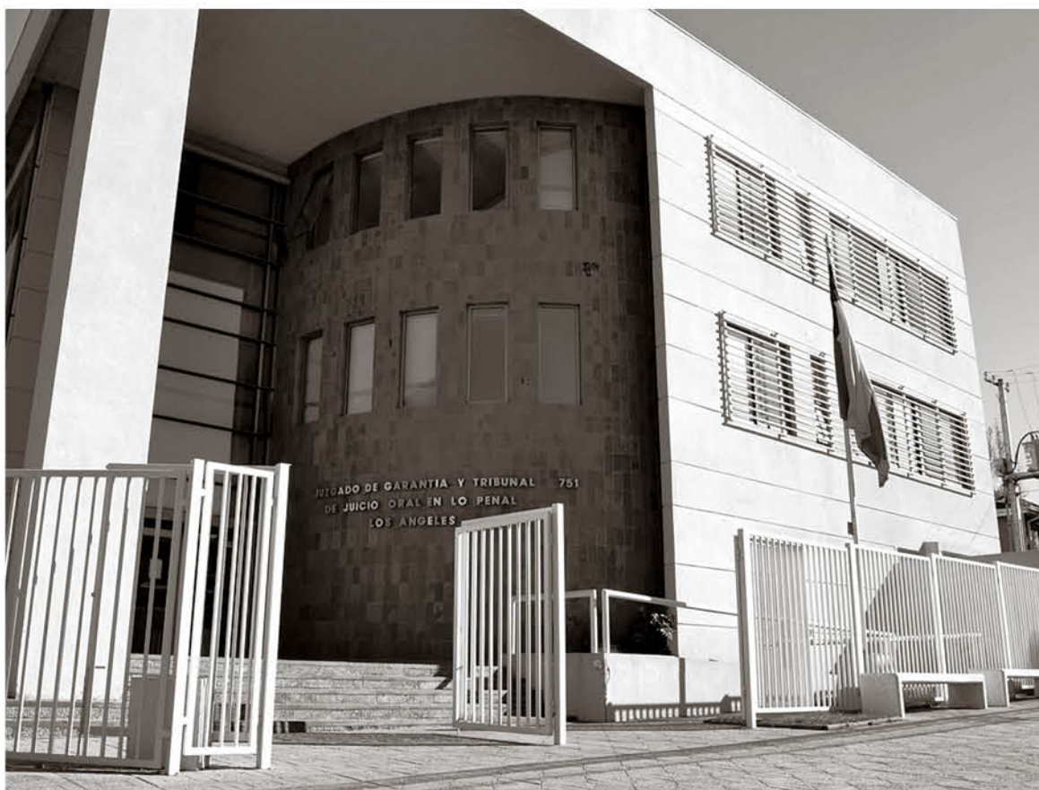
LOS IMPUTADOS FUERON llevados a juicio por el robo que afectó a un dueño de casa que residía en villa Génesis.

ción que derivó en que el tribunal recalificara el delito. “No se pudo contar con la declaración ni participación de la víctima ni el testigo ya que se encontraban atemorizados, no quisieron declarar, no obstante las gestiones que se realizaron por parte de la Unidad de Víctimas de la Fiscalía Local de Los Ángeles”, indicó la fiscal. Ante la recalificación jurídica que decidieron los jueces, la pena que arriesgan ambos condenados es similar a la solicitada en un principio por la Fiscalía, esto es ocho años de presidio para cada uno. La sentencia será dada a conocer por el Tribunal el próximo sábado.