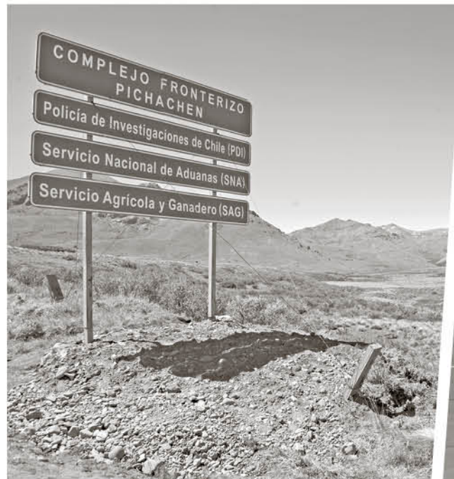
LAS GRANDES OBRAS seguirán adelante. Pichachén es un sueño provincial pendiente.

“Muy contento con el aumento de presupuesto. No conforme porque uno siempre quiere un poco más de presupuesto para la región y por supuesto para nuestra