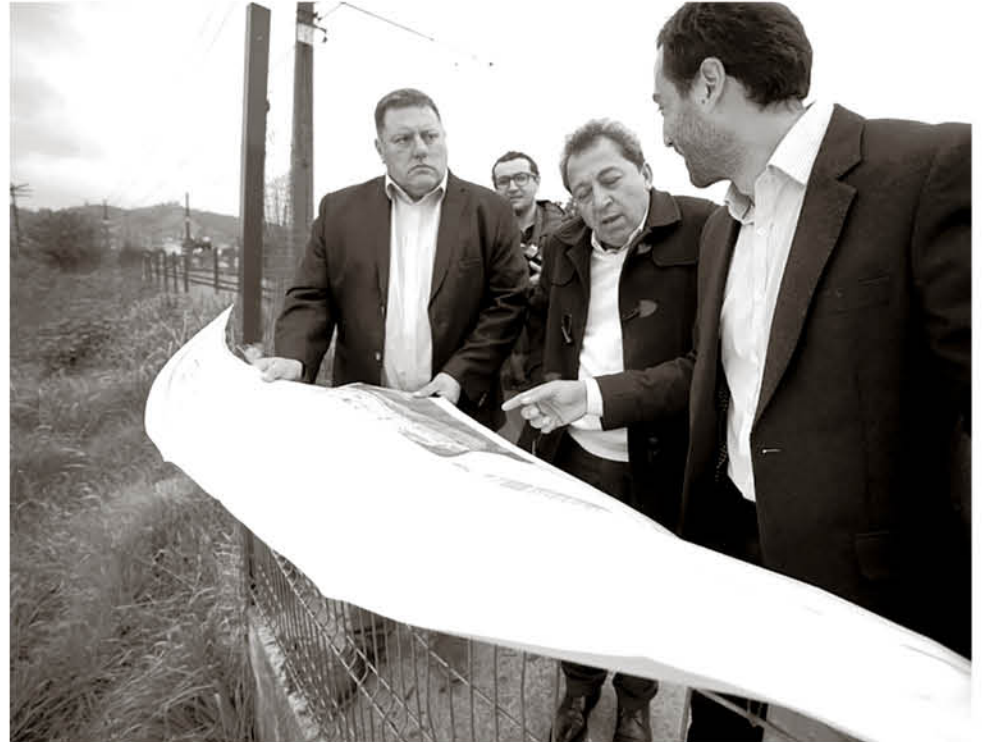
LA IDEA ES CONSTRUIR la circunvalación peatonal en toda la orilla de la laguna.