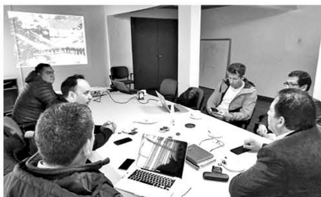
EL EQUIPO DE PRODUCCIÓN se reunió con el alcalde de Antuco, confirmando las grabaciones para el segundo semestre del 2020.

De acuerdo a lo manifestado por el alcalde y el equipo de producción, se realizará a fines de este año una nueva reunión, que considerará realizar un recorrido por los lugares que darán vida a la producción audiovisual.