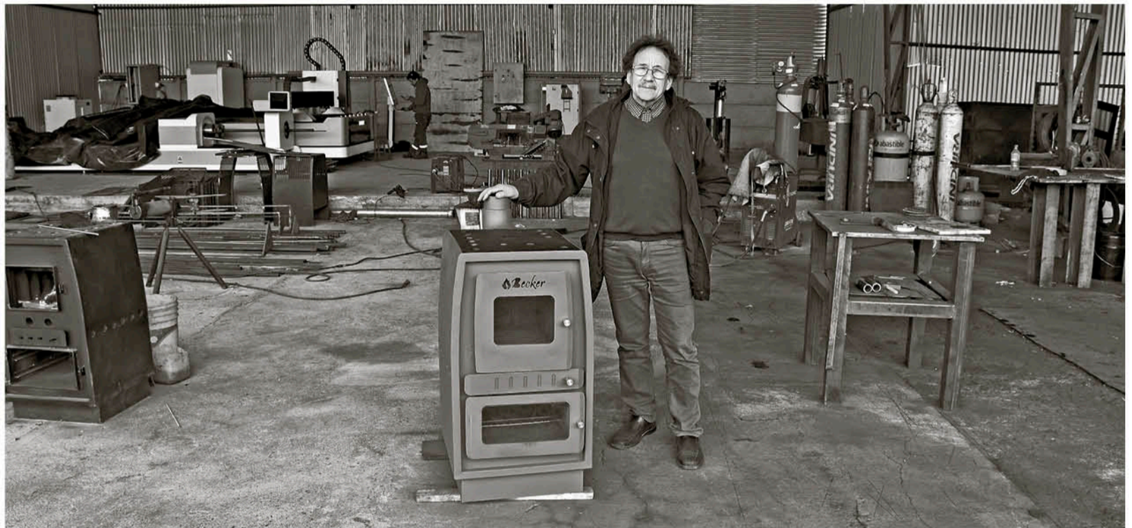
EL CALEFACTOR DISEÑADO CON UN HORNO EN SU PARTE BAJA, es capaz de hervir una olla de cinco litros de agua en seis minutos al igual que cocinar medio kilo de pan a una en 20 minutos.

Uno de los principales objetivos respecto a la producción de esta estufa es poder ser licitada por el Estado, para ser entregado a las familias más vulnerables del país.