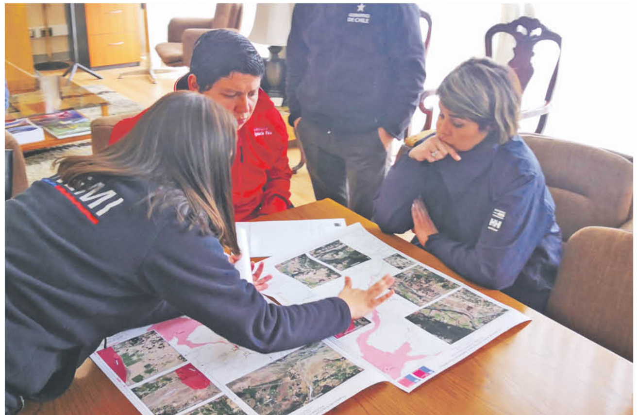
EL GOBERNADOR FICA será el responsable de coordinar el trabajo de todos los servicios mientras dure la alerta naranja.

“No sabía que el intendente iba a estar acá, qué bueno que vino. Vino el gobernador, vino el seremi y los directores de servicios para tener esta conversación y por eso yo partí diciendo, que bueno que