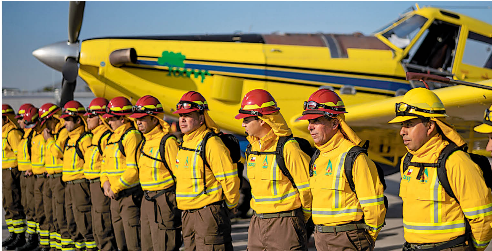
EL PRESIDENTE ANUNCIÓ más de 120 mil millones de pesos para esta temporada de incendios forestales.