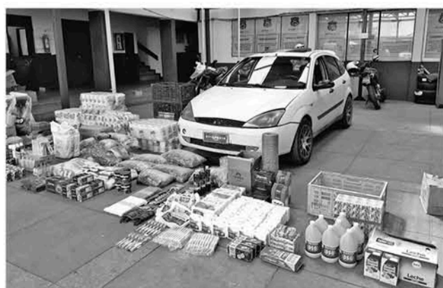
ESPECIES RECUPERADAS por Carabineros tras un robo ocurrido la semana pasada a una empresa de transporte angelina.

Tras esta situación, Carabineros logró dar con el paradero de los implicados. “Se logró dar con el domicilio, en donde estas personas guardaban las especies, por lo que tenemos a dos personas detenidas, un hombre y una mujer. El hombre mantenía una orden de detención pendiente y se logró la recuperación de casi la totalidad de las especies más un vehículo que tenemos la certeza de que participó ese día en este robo” explicó el prefecto de Biobío, coronel Miguel Ángel Iribarra.