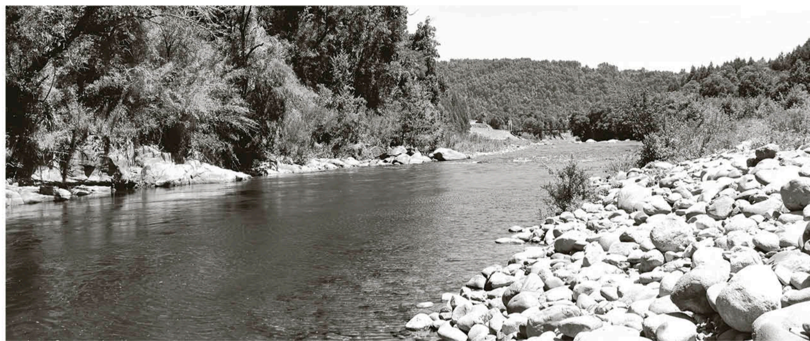
EL RÍO BIOBÍO compromete diversas actividades productivas, recreativas, deportivas y económicas, entre otras.

Entre los desafíos del plan se considera el acompañamiento al proceso de formación legal