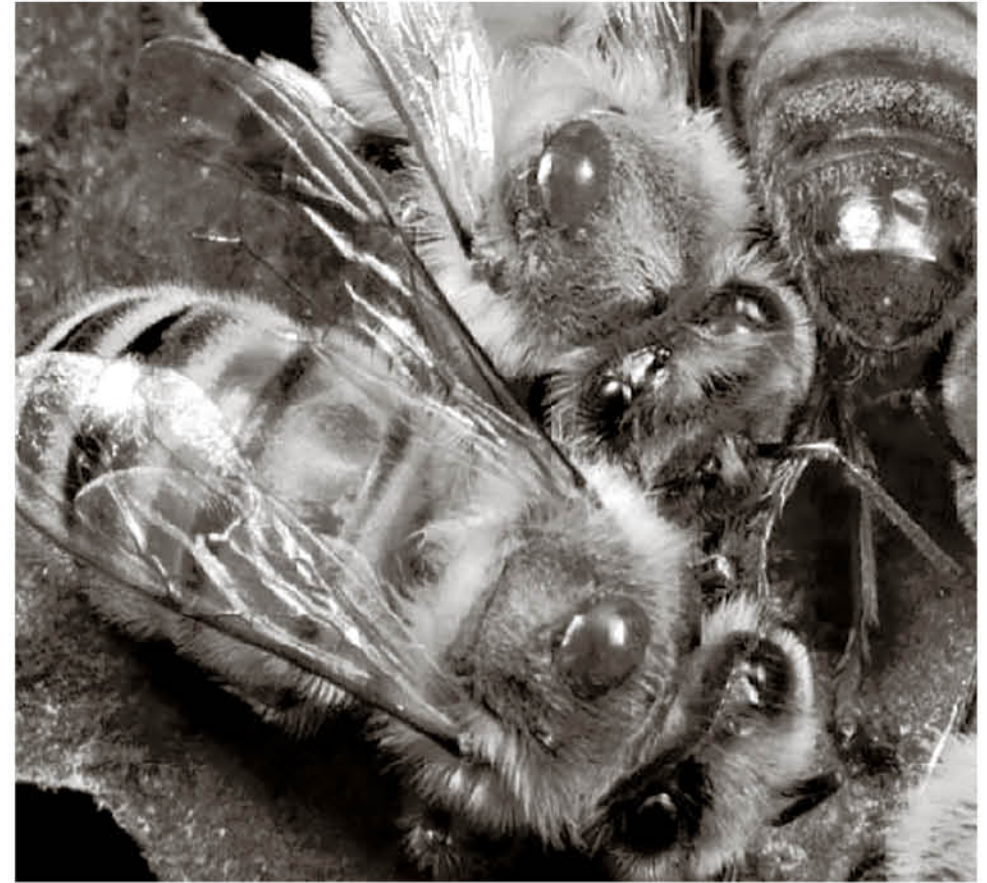
LA VARROASIS ES LA ENFERMEDAD más grave de las abejas a nivel mundial. Afecta tanto a las abejas adultas como a sus crías, generando alta mortalidad en las colonias sin tratamiento oportuno.

En nuestro país, actualmente existen 4 medicamentos autorizados más otro con permiso especial para el control de varroasis, "el gran problema es que aquí en Chile de los cinco principios químicos autorizados a nivel mundial, en Chile existen 2 principios activos. Entonces si nosotros pensamos que el problema se soluciona desde el punto de vista de los