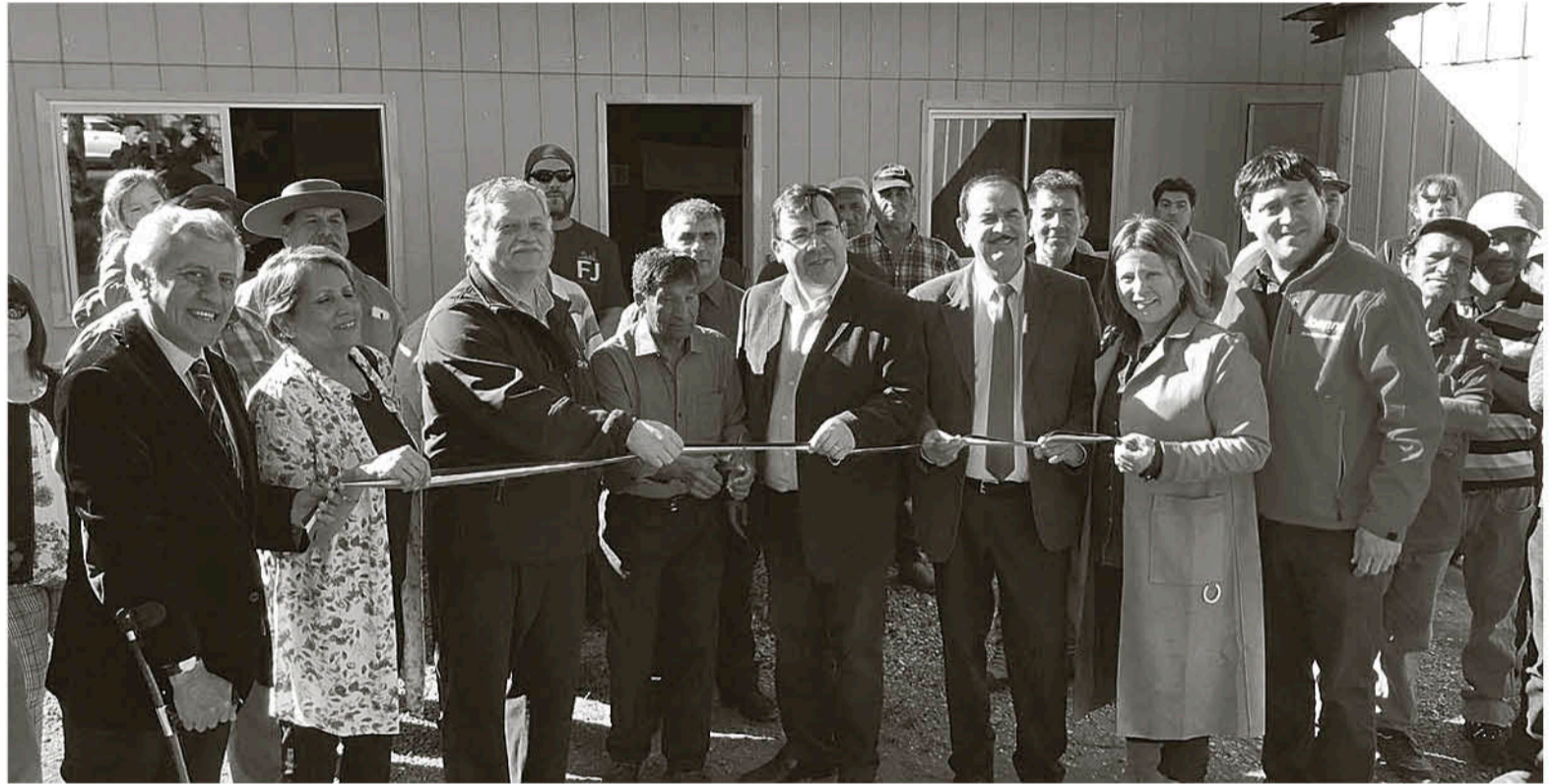
LOS COMPROMISOS DE RAYUELA jugados en la capital de Biobío inician a las 10:30 aproximadamente.

Esta inauguración deja entrever que palabras del alcalde de Los