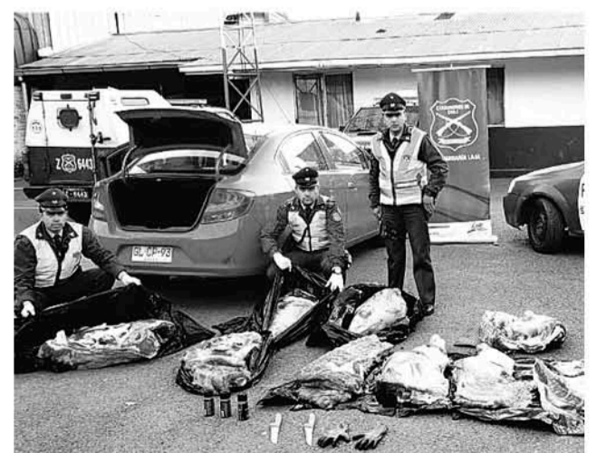
LA CARNE ENCONTRADA al interior del vehículo fue de aproximadamente 200 kilos.

comercialización también es parte del ilícito, al no haber un traslado de la carne que cumpla con la normativa. Los detenidos quedaron a la espera de citación por parte del tribunal.