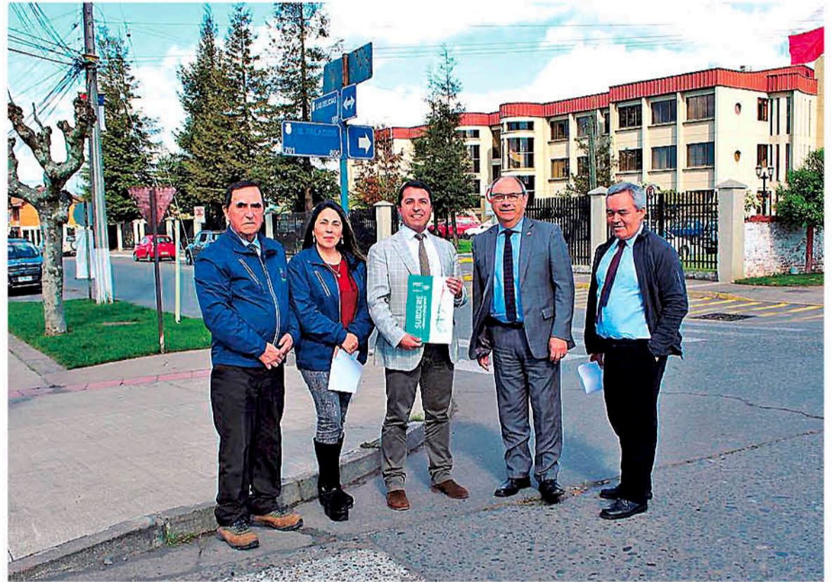
ESTE PROYECTO CORRESPONDE a una línea del Programa de Mejoramiento Urbano con un tope de hasta 60 millones de pesos.

Es una fuente de financiamiento y apoyo a la comunidad que facilita el Ministerio del Interior, a través del equipo de la división de municipali-