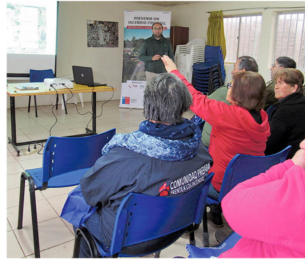
LOS VECINOS SERÁN parte fundamental en la prevención de los siniestros, luego que Conaf los capacitará durante el invierno.

Es sabido que más del 95 por ciento de los incendios son provocados por el ser humano, pero no se trata de apuntar a quienes encienden el fuego, sino a negligencias que van desde botellas de vidrio abandonadas, hasta una parrilla mal apagada.