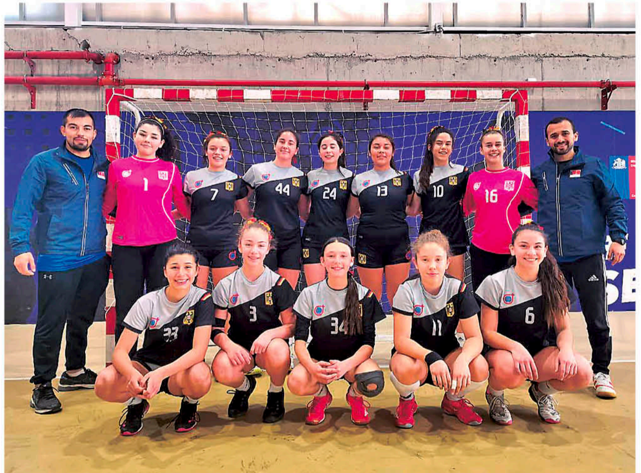
EL SELECCIONADO SUB 14 DE BALONMANO perteneciente al Liceo Alemán del Verbo Divino, tiene como principal objetivo volver a obtener el título de campeonas nacionales de la disciplina.

El equipo cuenta en sus filas con grandes promesas deportivas que han participado del proceso de la selección nacional de la disciplina, cabe destacar que en la última etapa de pruebas para integrar el plantel chileno la preselección dejó un total de