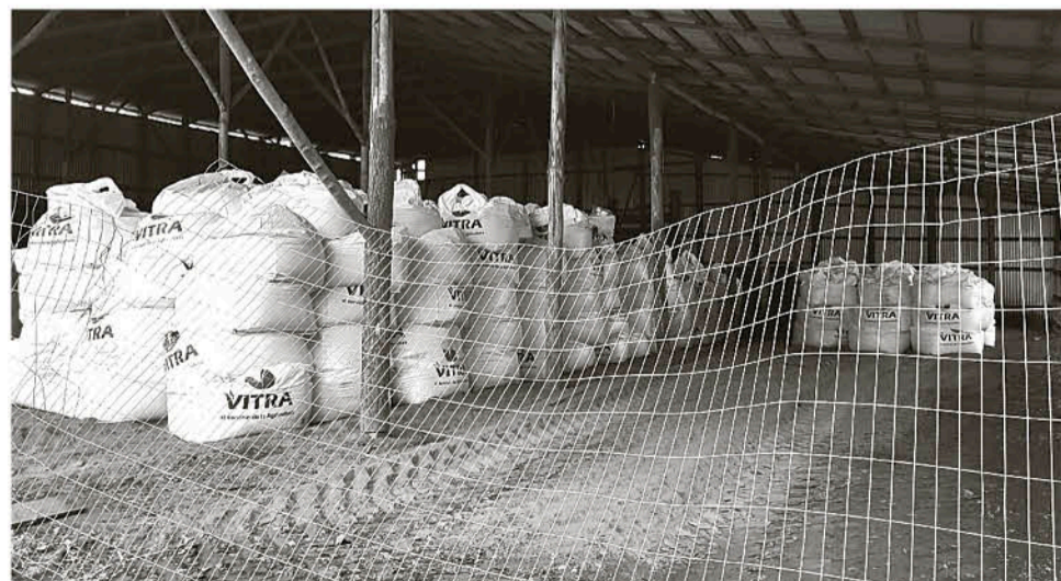
LA INCORRECTA MANIPULACIÓN de agroquímicos podría provocar severo impacto en la salud de las personas sin considerar eventuales secuelas en el medioambiente.

A los últimos hechos, se suma la acción de desconocidos, que faenaron una yegua de raza árabe, encontrada sumergida en el río, quedando vestigios del hecho, que fue catalogado como repudiadable, en suceso ocurrido en el fundo Santa Ana de Pile, en Mulchén.