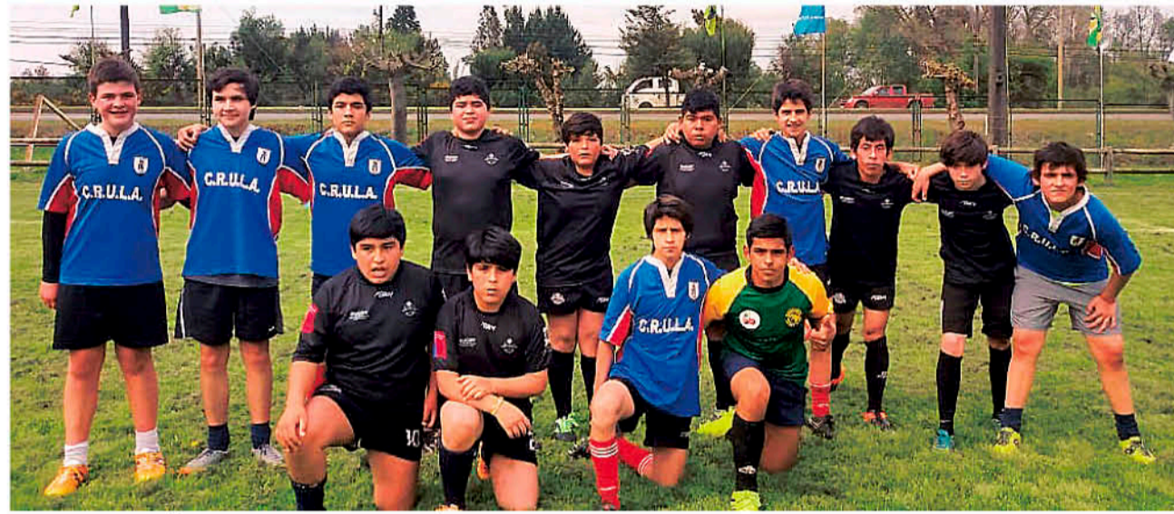
LA AGRUPACIÓN DEPORTIVA DE LOS ÁNGELES organizará a mediados de noviembre un festival de rugby que espera congregará más de 200 asistentes.