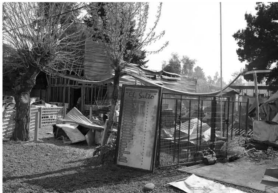
ESTE ES el actual panorama de ambos locales, "EL Parroncito" de Leonardo Paredes y comida rápida, "El Salto" de Nieves Escobar y su esposo.

Todo esto en el sector municipal Los Coyuche, donde van a ofrecer a los interesados, música, baile, platos típicos y otras sorpresas, porque a sus vecinos como señalaron nos los van a dejar en el olvido.