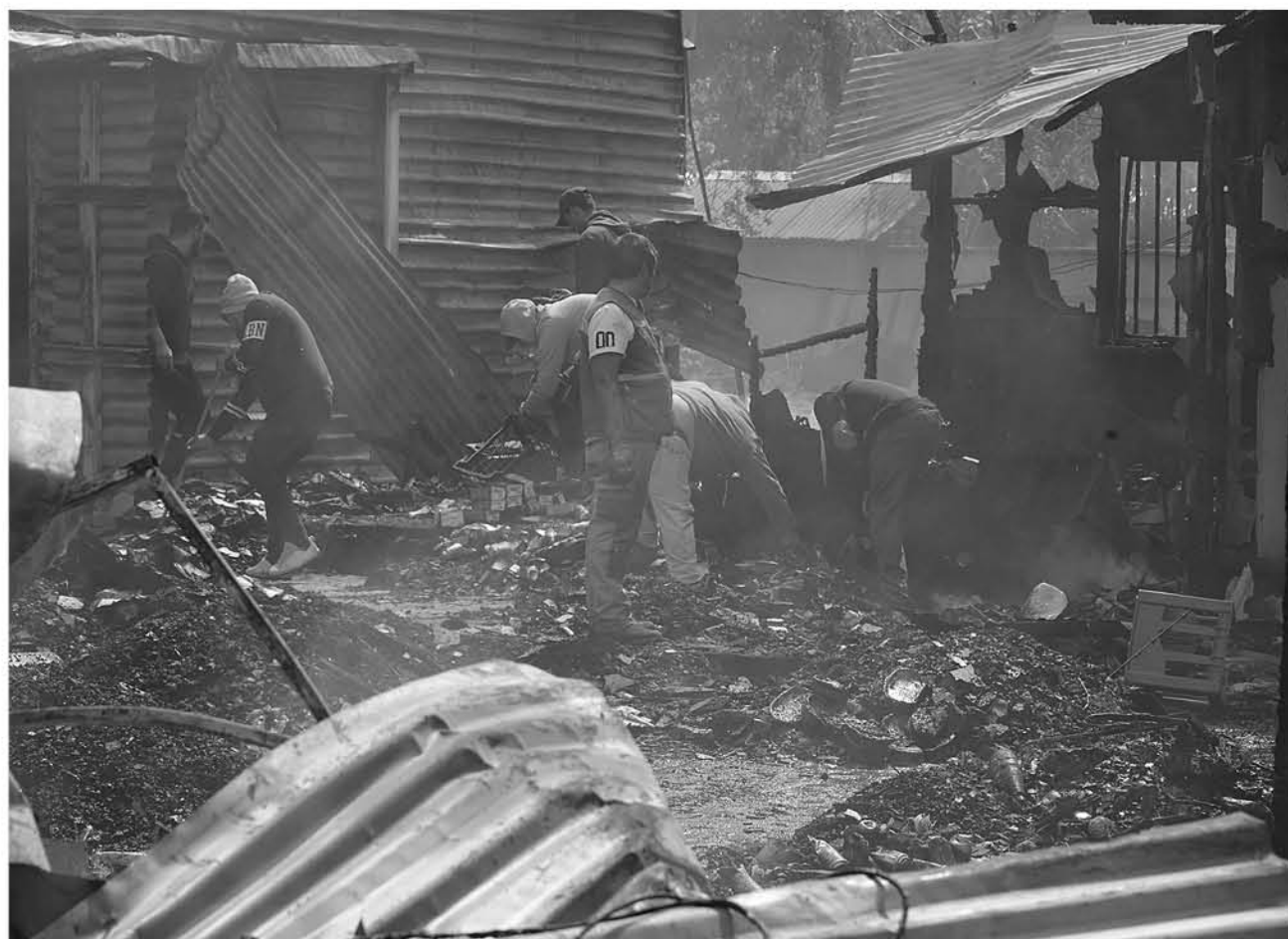
VECINOS EN CONJUNTO a personal municipal trabajaron todo el día martes removiendo escombros.

"Si los bomberos hubieran llegado más temprano, toda esta tragedia se habría evitado, el traslado es muy extenso. Hace poco realizamos una reunión con Bomberos para realizar un comité de prevención de incendios,