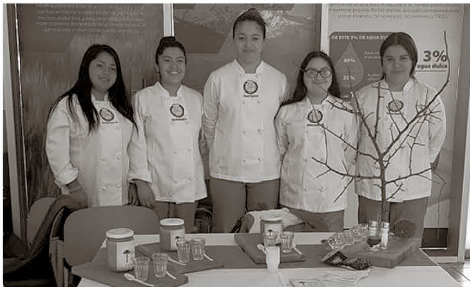
LAS ESTUDIANTES de Santa Bárbara presentaron su propuesta innovadora.