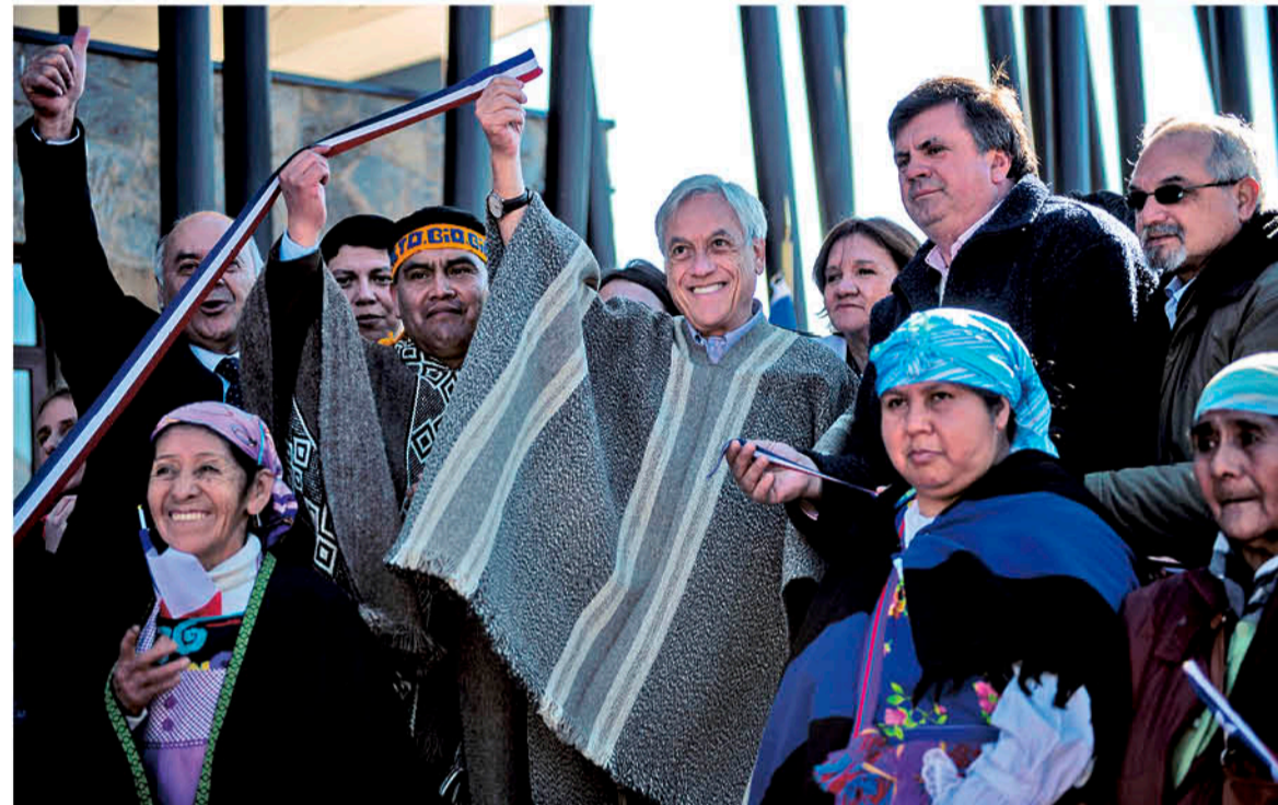
EL PRESIDENTE DE LA REPÚBLICA SEBASTIÁN PIÑERA inauguró un Cesfam que costó al Estado más de 3 mil millones de pesos.

sitio municipal se lee que tras esa cita "otra buena noticia es que las postas de Cauñicú, Callaqui y Pitril ahora están conectadas a la red del Ministerio de Salud, usando fibra óptica, por lo que tienen teléfono, Internet, ficha médica electrónica y pronto podrán ver sus exámenes en línea, sin necesidad de viajar a Ralco. También se gestionó la entrega de dos sillones dentales nuevos, uno para la posta de Trapa Trapa y otro para la de Malla Malla".