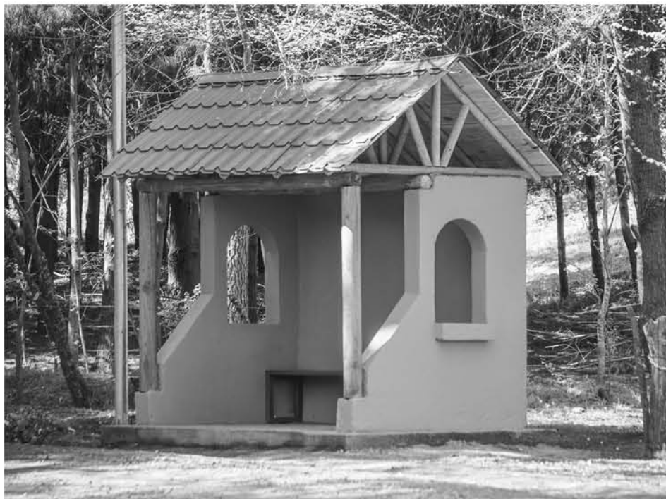
LOS PARADEROS rurales de Laja cuenta, incluso, con iluminación LED.

Los paraderos fueron construidos en los sectores de: Curaco y Rucahue Ruta Q-250, Rucahue Ruta Q-246, Peñablanca Ruta Q-246, Picul y Apelahue Ruta Q-46, Los Corcolones Ruta Q-234, La Aguada Ruta Q-250, Las Ciénagas Ruta Q-238, Rucahue Ruta Q-238.