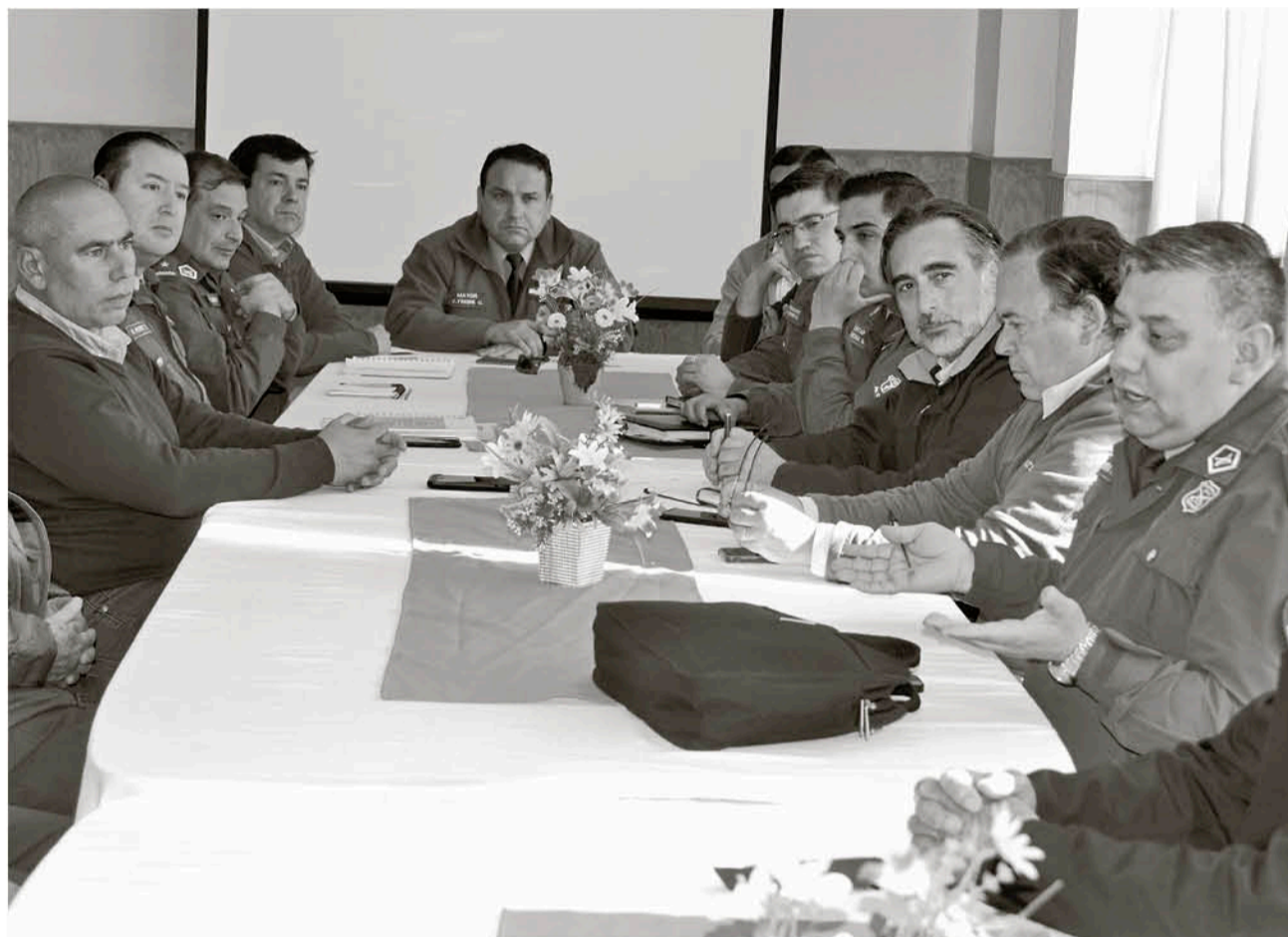
EN LA JORNADA DE AYER se definió un Plan Rural de Seguridad.