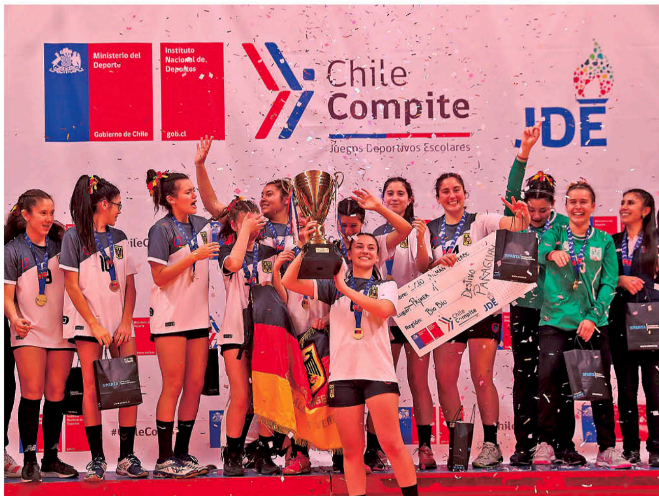
PARA LOGRAR DESTACAR A NIVEL NACIONAL E INTERNACIONAL, las damas del elenco angelino de balonmano, entrenan arduamente cinco o seis veces a la semana.

El instructor del equipo comentó sobre lo que se ave-