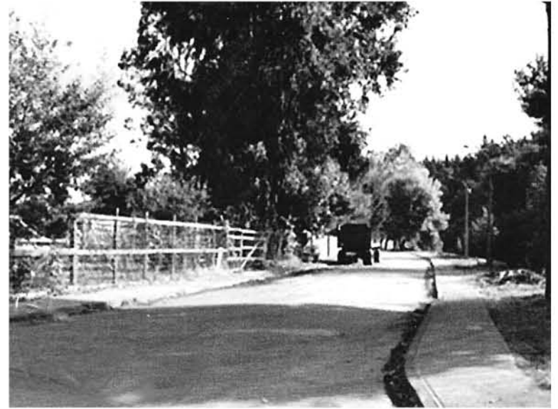
ESTAS FOTOGRAFÍAS CORRESPONDEN a los documentos presentados ante el tribunal, por dicho espacio en disputa.

Por otro lado, la solicitud de subdivisión presentada por el recurrente no acompañó todos los antecedentes que exige la ordenanza para ese tipo de solicitudes, la cual le fue devuelta, de lo que se concluye que ningún