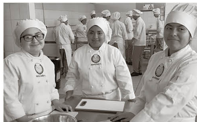
En el Liceo Cardenal Antonio Samoré se imparte la especialidad.