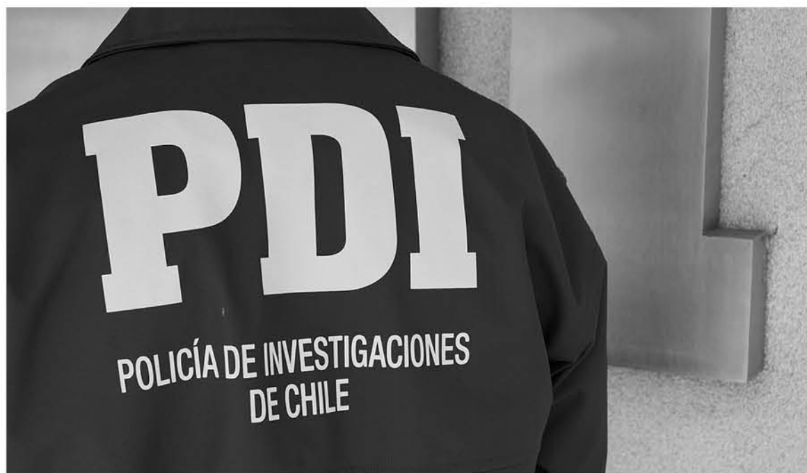
HASTA EL MOMENTO no se conocen las causas exactas de muerte de este adulto mayor.

Sobre dichas indagaciones, el comisario agregó que “a petición del Ministerio Público se acudió a un domicilio de Población Las Américas, donde se constató el fallecimiento de este adulto mayor, quien tendría alrededor de 75 años, quien habría muerto hace aproximadamente 3 a 4 días”.