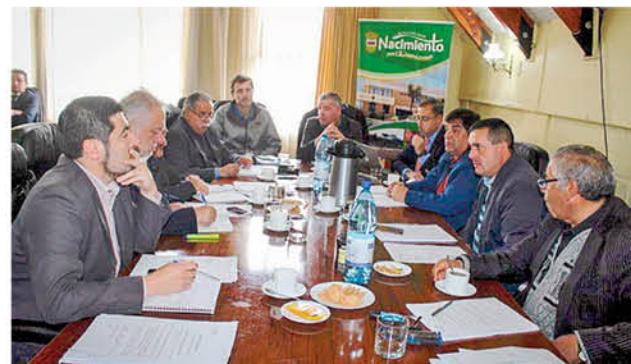
SE DESTACÓ el impacto del proyecto que permitirá a los estudiantes elegir carreras técnico profesionales.

El instituto profesional cuenta con 18 sedes a nivel nacional y en el Campus Nacimiento destacará el sistema de formación dual, es decir, formación en aula y en las plantas Santa Fe -ubicada en esa comuna- y Laja de CMPC; también contará con progra-