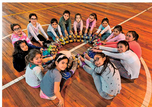
PATINAJE ARTÍSTICO SANTA MARÍA DE LOS ÁNGELES, tiene en sus objetivos ser un club competitivo a nivel federativo.

La institución pretende a largo plazo acercar esta práctica deportiva a toda la provincia de Biobío.