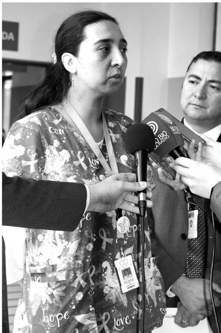
AUTORIDADES DEL ÁREA DE SALUD hicieron un llamado a las familias a acompañar a los pacientes que sufran una enfermedad terminal y acudir a la unidad de cuidados paliativos en forma instantánea si es necesario.

sector de la Vega Techada en Los Ángeles, se dirigirá a Santa Bárbara donde realizará también las mismas atenciones dentales a la ciudadanía de esa comuna cordillerana por un lapso de tiempo de alrededor a 3 meses.