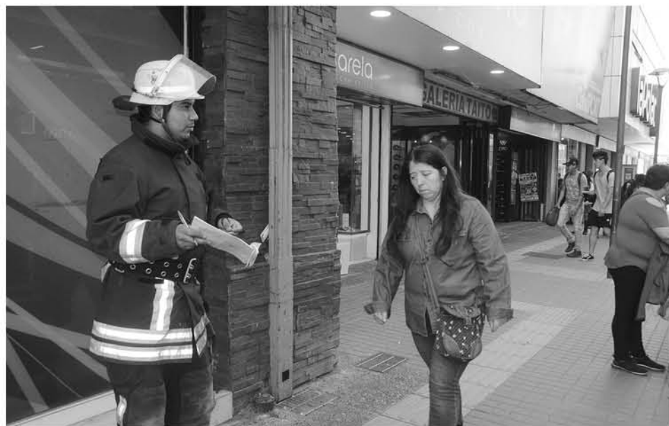
ESTE AÑO la rifa busca alcanzar los 90 millones de pesos que irían en directo beneficio de Bomberos.

“Por el momento se están realizando diligencias complementarias con el Servicio Médico Legal y Fiscalía Local, para dar cuenta de este suceso”, sentenció el comisario de la Brigada de Homicidios.