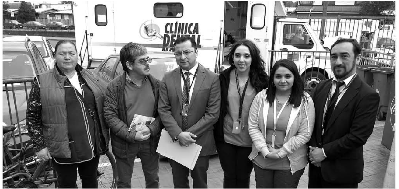
LA CLÍNICA DENTAL MÓVIL estuvo cerca de tres meses en el sector de la Vega Techada en Los Ángeles realizando diferentes prestaciones y atendiendo a locatarios y trabajadores.

dente de Comivela se refirió a la presencia que tuvo esta clínica en el sector de la Vega Techada, manifestando que “este es el tercer año que podemos contar con esta clínica y estamos muy agradecidos por este servicio hacia nues-