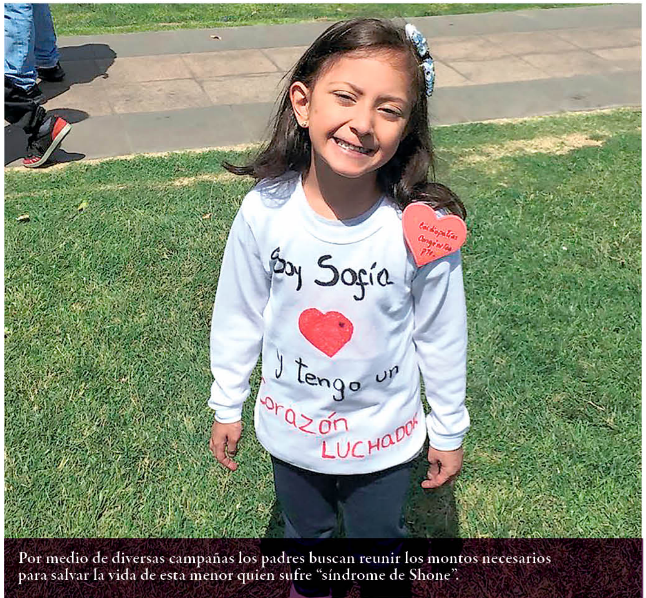
Por medio de diversas campañas los padres buscan reunir los montos necesarios para salvar la vida de esta menor quien sufre “síndrome de Shone”.