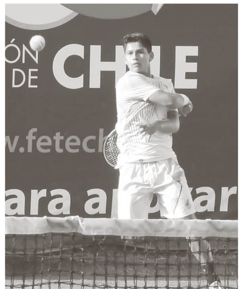
EL PROYECTO tiene como objetivo fomentar la práctica del tenis, sobre todo llevarlo a los niños que recién están descubriendo lo entretenido del deporte blanco.