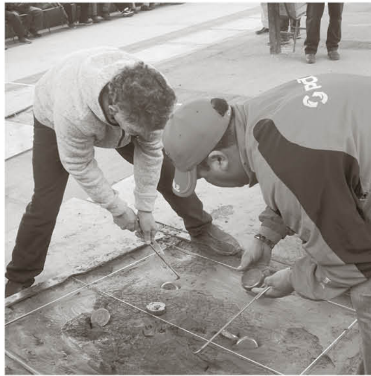
EL TRADICIONAL campeonato rayuelero de Los Ángeles se encuentra en tierra derecha para encontrar a su campeón.

elenco de El Esfuerzo no pudo contra los punteros y perdió la oportunidad de poder escalar desde la parte baja de la tabla quedándose en el décimo lugar del torneo rayuelero que ya se acerca a su fin.