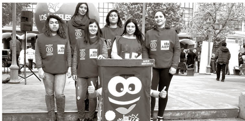
LOS ENCARGADOS DE AIEP serán los responsables de entregar plantas a quienes lleven sus cosas para reciclar.