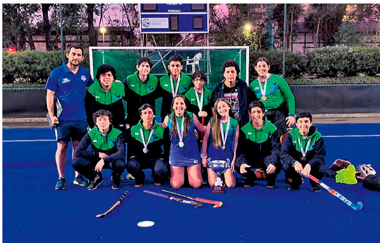
LOS CLUBES CONTARON CON EL APOYO de jugadores de los "Diablos y "Diablas de la Roja" para sus encuentros.

"Hoy hemos puesto a Los Ángeles en el mapa, demostrado que pese a ser una ciudad pequeña, tenemos grandes deportistas junto a profesionales trabajando sobre el