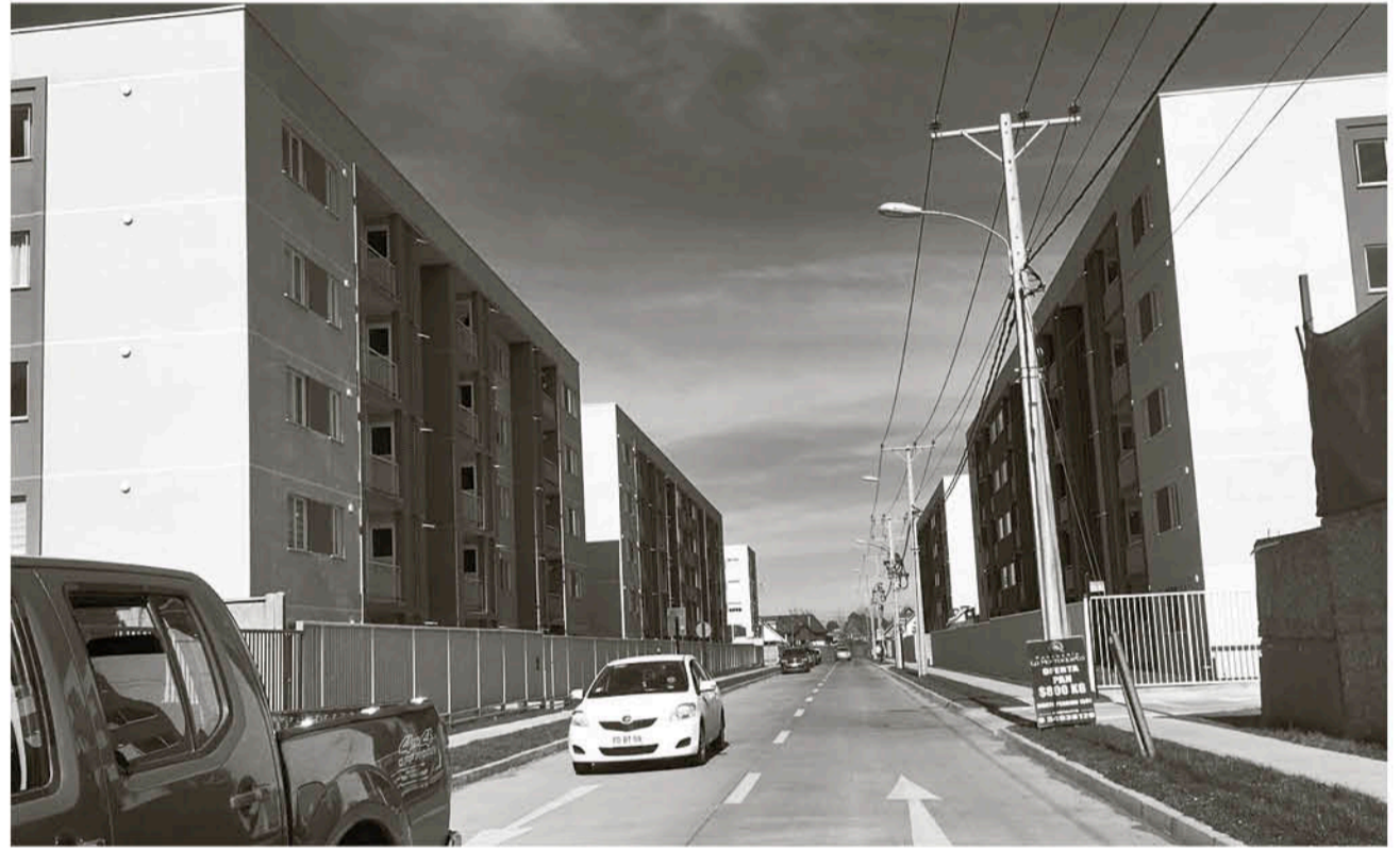
LOS VECINOS DENUNCIAN que el conjunto habitacional se realizó por etapas para evitar someterse a evaluación ambiental.

“Nosotros queremos que se revoque la autorización de impacto ambiental que se dio porque consideramos que tiene demasiados vicios, aspiramos a que se realice de manera efectiva la participación ciudadana. Los vecinos de la primera etapa también realizaron reclamos