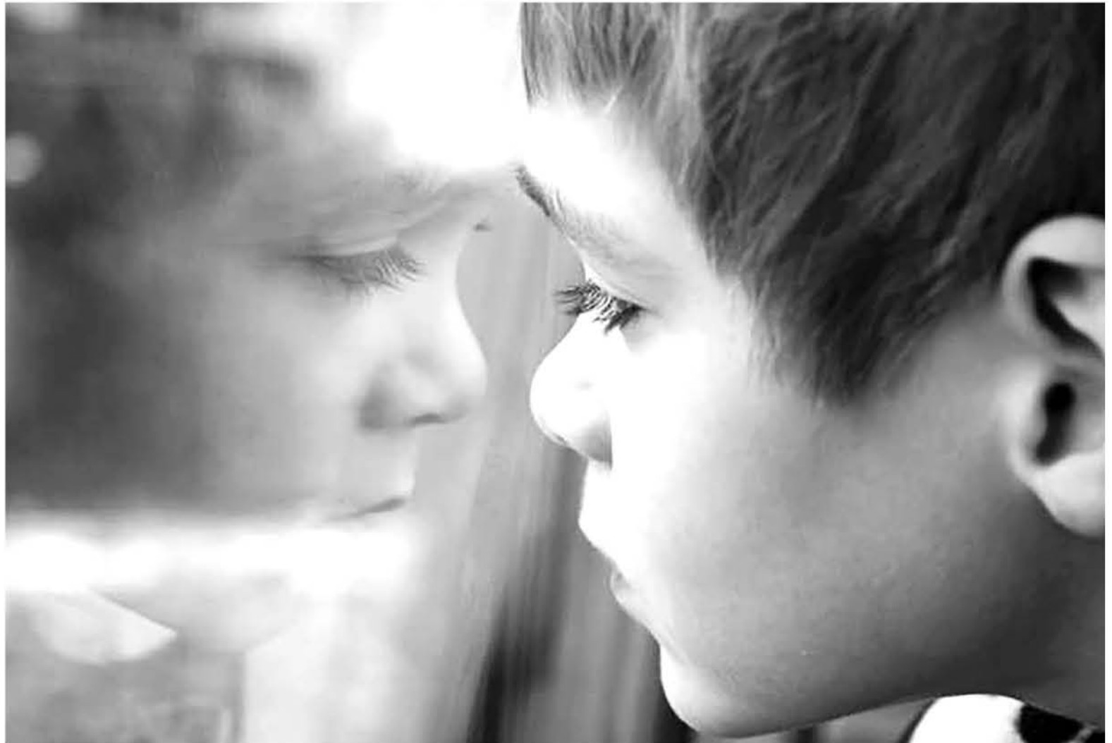
LAS PERSONAS QUE PADECEN Asperger tienen dificultades para comunicarse y son limitados en sus intereses.