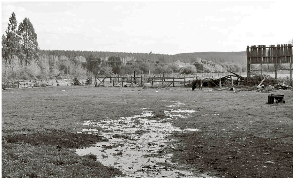
EN EL SECTOR DE SAN ANTONIO ya se construyó un pozo y se licitará otro con un costo de 450 millones de pesos para el Estado.

El tema en cuestión es que ya conocida la escasez hídrica, los efectos de las plantaciones forestales sobre las napas de agua y particularmente la ejecución de dos proyectos de agua potable en el área, uno ya realizado en Rinconada y otro en proceso de licitación para su ejecución en el mismo sector, hacen temer que a poco andar los pozos profundos sientan disminución de su caudal por efecto de estas plantaciones.