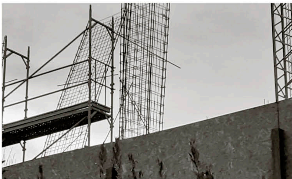
LA ACTUAL ETAPA en construcción perteneciente al proyecto.