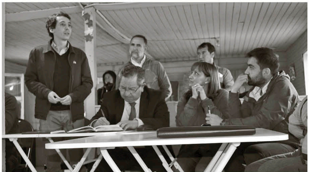
EL ALCALDE DE SANTA BÁRBARA garantizará que los acuerdos entre los vecinos y la empresa se concreten.

Los vecinos de San Antonio han comenzado gestiones y reuniones con todos los actores involucrados y junto a Forestal Arauco son protagonistas de un momento histórico, donde la industria maderera se reúne con ciudadanos para compartir un