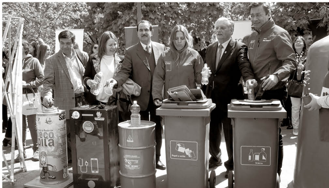
EL FESTIVAL POR LA ACCIÓN CLIMÁTICA fue presentado oficialmente en la Plaza de Armas angelina.