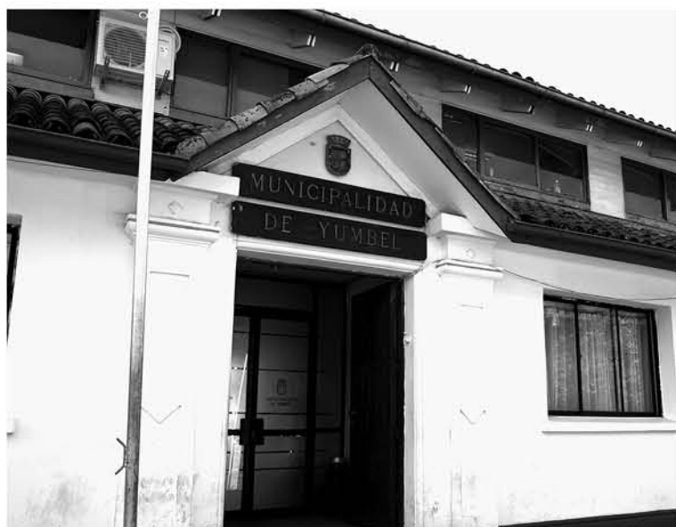
DESDE LA DIRECCIÓN DE EDUCACIÓN de Yumbel sostuvieron que no se van a referir al tema porque el joven no pertenece al sistema educativo municipal.

Existen escasos estudios epidemiológicos de este trastorno; pero se estima que es mucho más frecuente que el autismo. El síndrome de Asperger fue descrito por primera vez en 1944 por el pediatra austriaco Hans Asperger, a partir de la observación de un grupo de niños caracterizados por ser niños socialmente extraños, ingenuos, desconectados unos de otros con una buena gramática y vocabulario extenso, un discurso fluido pero literal y pedante, con una comunicación verbal empobrecida e interesados por temas específicos. Su inteligencia es promedio o superior, pero con dificultad en aprender tareas convencionales.