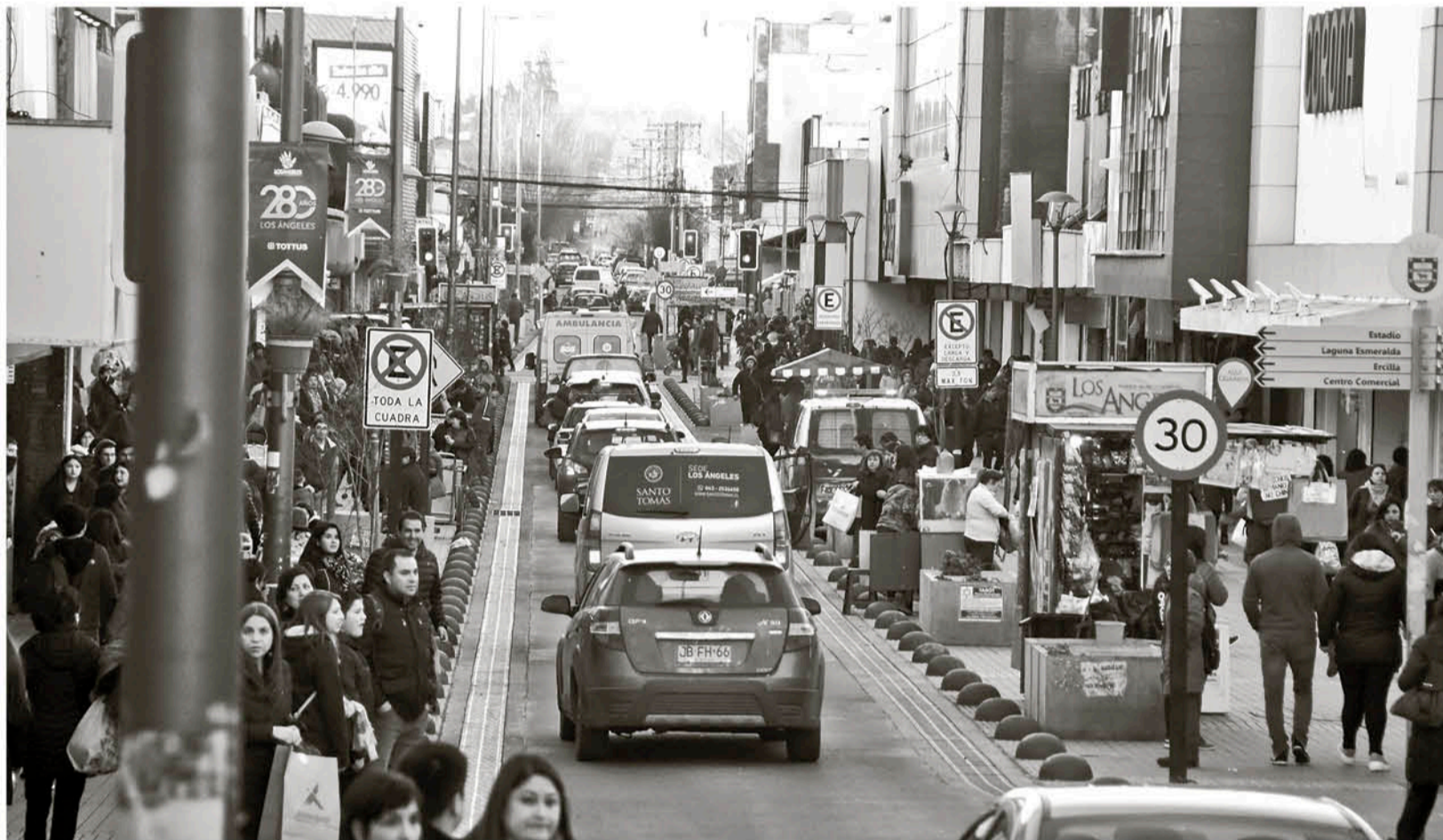
SEGÚN ESTIMACIONES DE LA CÁMARA DE COMERCIO, en Los Ángeles este rubro está funcionando en un 85%.