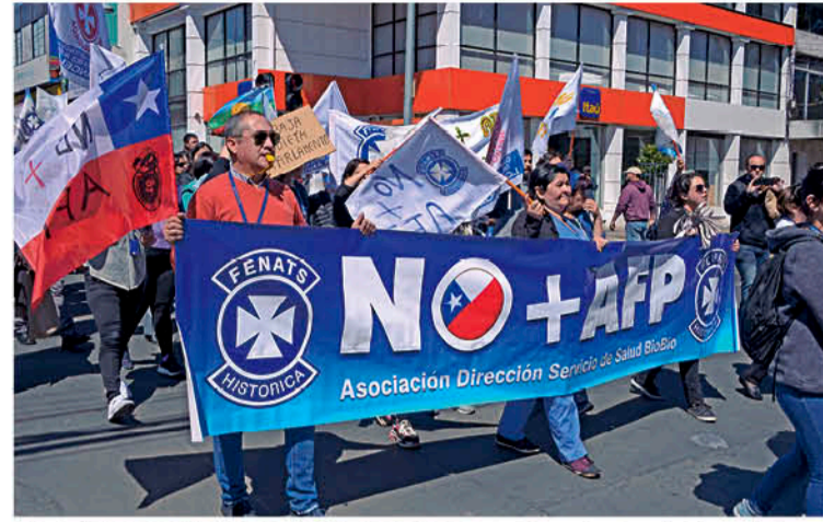
LOS FUNCIONARIOS DE LA SALUD marcharon hacia a la Plaza de Armas.