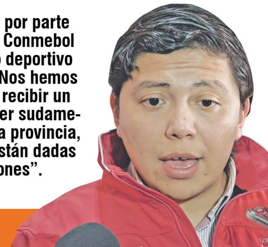
Ignacio Fica Gobernador

decisión sin consultarnos y la forma de resolver genera más molestia en la comunidad de Los Ángeles".