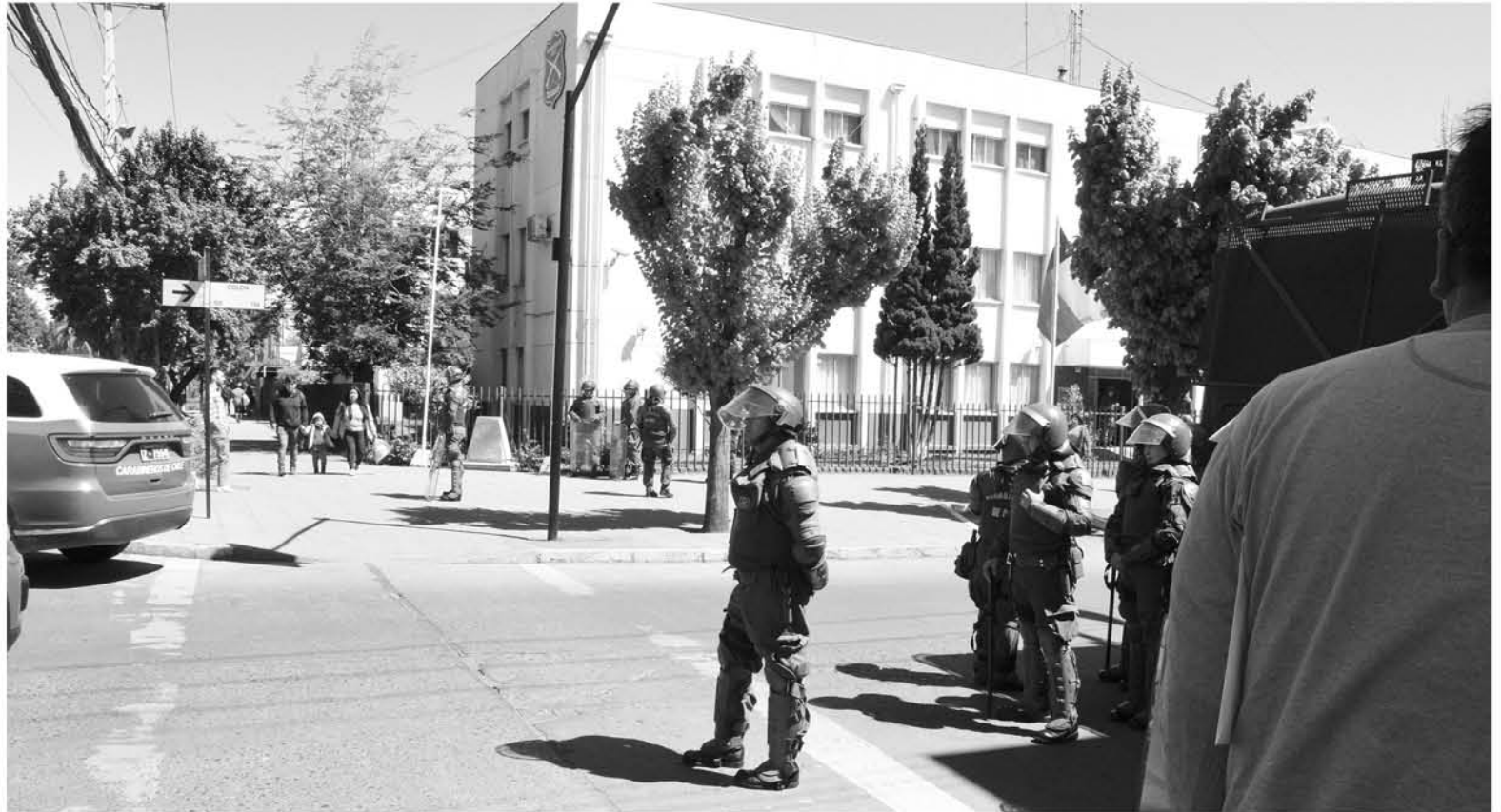
DURANTE LA CUARTA JORNADA se mantuvo contingente policial preparado, ante eventuales disturbios.

Sobre el balance de la tercera jornada, entre los hechos más destacados se encuentran el ingreso a dependencias de oficinas Movistar, ubicadas en calle Valdivia, donde tres sujetos fueron detenidos, continuando con el intento de robo en oficinas de oficinas