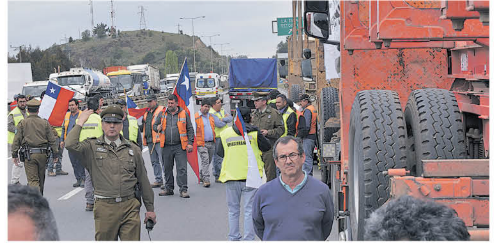
SE PODRÍAN RETOMAR las manifestaciones en Los Ángeles por parte de los trabajadores del transporte forestal.

Acotó que el panorama actual en el país dice relación con las desigualdades “no se olviden que todo este estallido social tiene que ver con los privilegios que ha tenido el mundo de la política, especialmente el mundo de los parlamentarios, que están totalmente desconectados del mundo civil. Totalmente desconectados”. En este