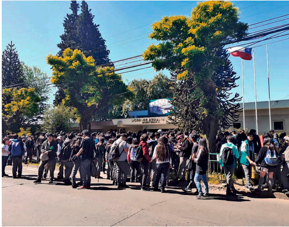
LLEGADA al liceo Bicentenario.

Claudia Robles Maragaño prensa@latribuna.cl