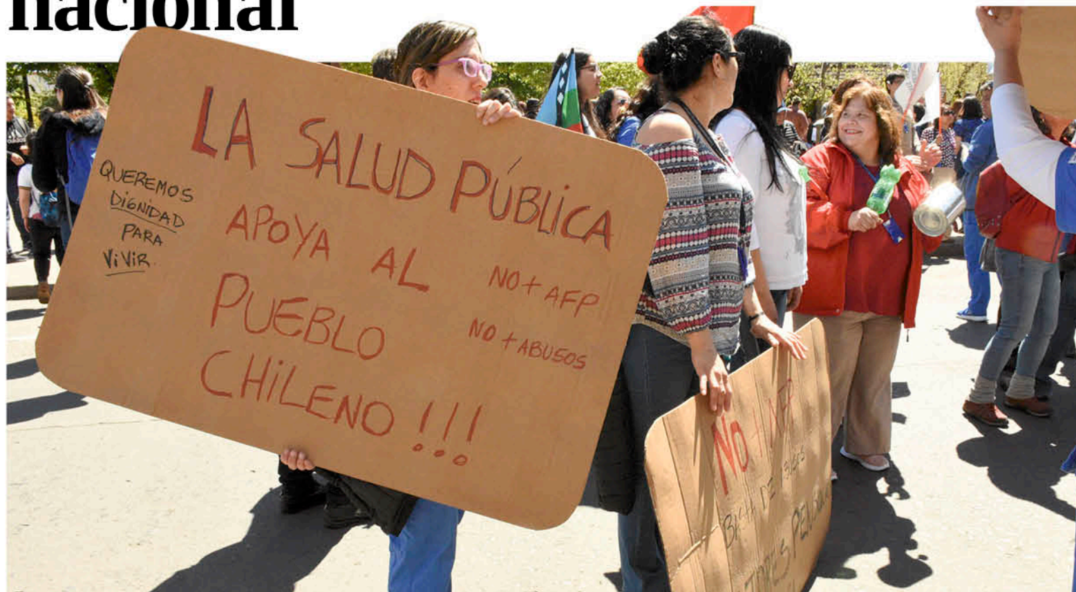
LOS FUNCIONARIOS MANIFESTARON diferentes demandas en esta primera actividad del área de la salud.

rra a los centros asistenciales cuando realmente lo requiera y así podamos de esa manera, privilegiar las atención de aquellos más necesitados y de aquellos que pudieran diferir en algún momento su atención por no presentar una real gravedad en su condición de salud".