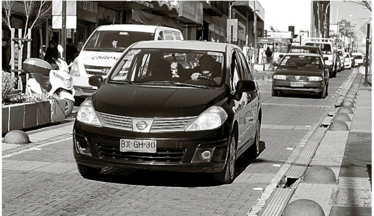
EL RUBRO DE LOS TAXISTAS DIJO que si a nivel nacional se unen a la movilización en Biobío también lo harán.

El agricultor sostuvo que nunca se imaginaron que esta situación de las manifestaciones sociales iba a llegar tan lejos. “Yo creo que a la comunidad común y corriente, que está en sus trabajos nunca se les pasó por la mente que pudiéramos llegar a ser una sociedad tan violenta, aquí hay componente que puede ser minoritario pero que claramente ha generado todo este impacto de destrucción que ha terminado con la armonía del país. Creo que hay que hacer un análisis mucho más pro-