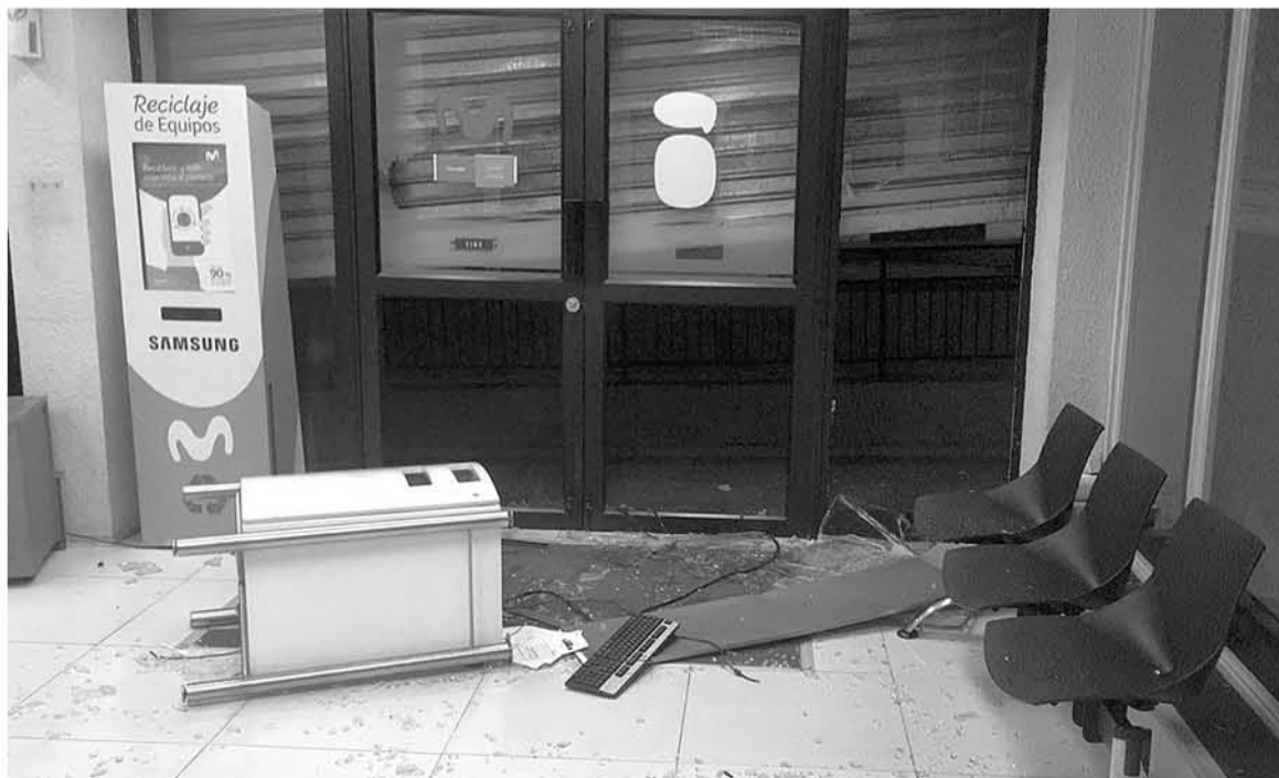
PARTE DE LOS DAÑOS registrados en sucursal telefónica de Los Ángeles.

Sobre el cuarto día de manifestaciones, pasadas las 18:30 horas, hasta el cierre de esta edición no se registraron daños en la provincia, siendo la nueva manifestación caracterizada como una jornada pacífica tal como estimaban las autoridades y como hasta el momento ha exteriorizado la comunidad.