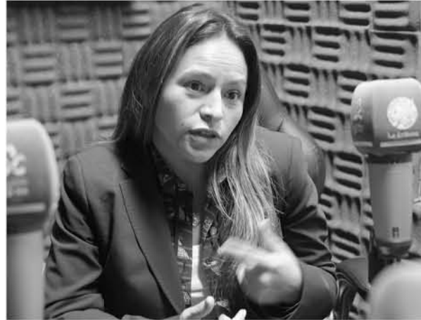
Joanna Pérez, diputada DC

"No sólo los sueldos de los parlamentarios, porque eso lo voté. Yo creo que acá hay que hacer una revisión de todos los altos sueldos que se pagan con las platas del Estado. Yo hice un cálculo, acá en el Congreso hay personas que no son parlamentarios y que ganan 12, 13, 14 millones de pesos, mucho más que un parlamentario, que son los secretarios de ambas instancias".