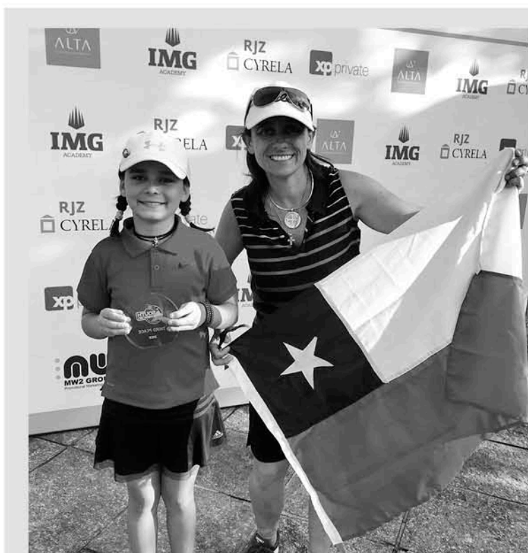
LA JOVEN GOLFISTA DESTACA como una de las promesas en la disciplina con más proyección del continente.