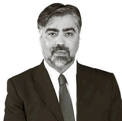
Giovanni Calderón Bassi Director Ejecutivo Agencia de Sustentabilidad y Cambio Climático

Si bien nuestro país sólo representa el 0,25% de las emisiones globales de gases de efecto invernadero al 2016, se sitúa dentro de los diez más afectados por riesgos climáticos. Estudios científicos advierten además que los fenómenos meteorológicos extremos generados por el