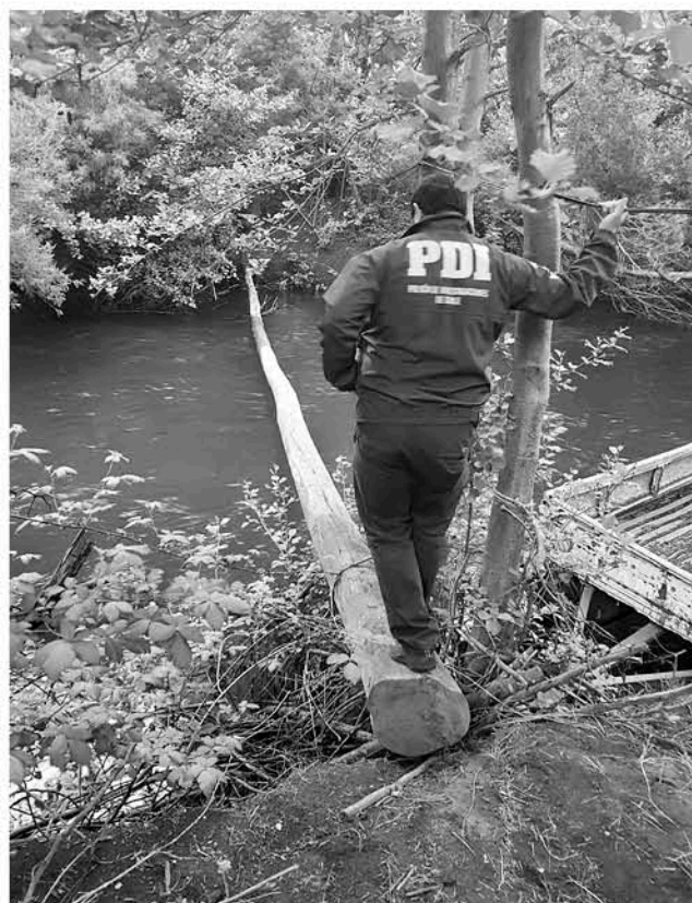
FUNCIONARIOS SE ENCUENTRAN investigando este fatídico hallazgo.

Sobre el proceso investigativo, el comisario agregó que “ahora bien las diligencias complementarias de esta brigada en forma conjunta con la fiscalía local continuarán a fin de establecer la identidad de este cadáver y su real causa de muerte”, finalizó.