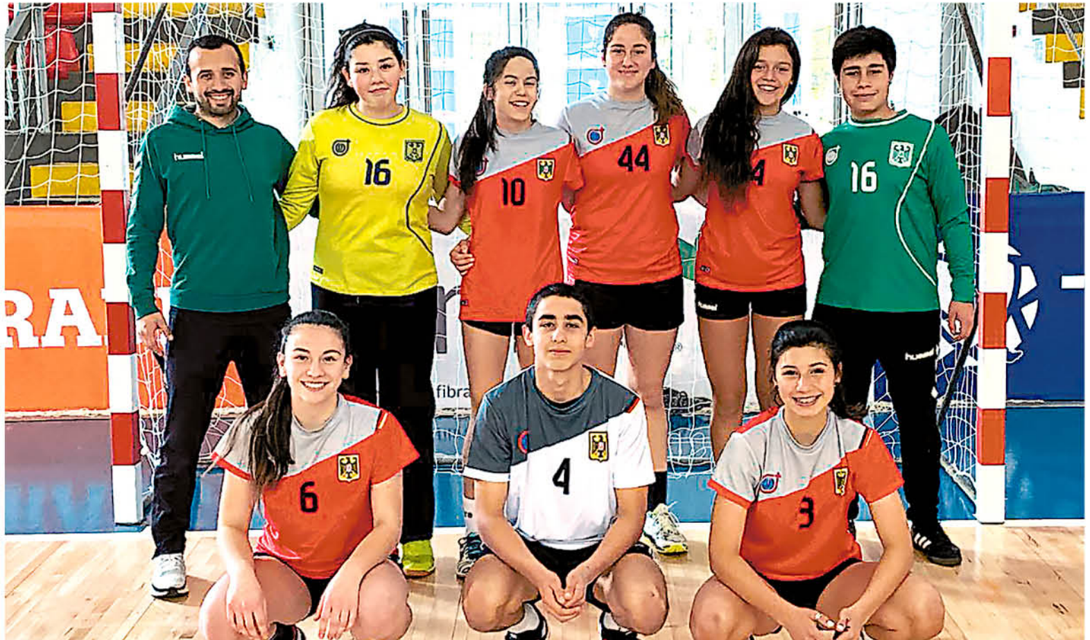
SON 8 LOS JÓVENES DEPORTISTAS con los que Cubla aporta a la selección nacional de balonmano infantil.

Cabe destacar que esta talentosa facción de jugadoras dio sus primeros pasos en la disciplina deportiva, formándose en el Liceo Alemán del Verbo Divino, donde gracias a su gran desempeño continuaron su crecimiento deportivo en Cubla.