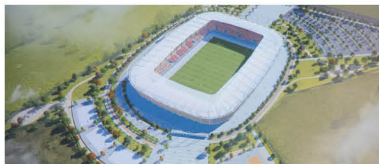
PRIORIZAR LOS PROYECTOS financiados para 2020 podría detener la construcción del Estadio de Los Ángeles.

Para confirmar sus dichos explicó que “hemos hablado sobre la priorización de la cartera, no hemos hablado de un proyecto en particular, entonces le pedimos a los alcaldes en general, a los 14 alcaldes, que pudieran mirar sus proyectos financiados, lo mismo le pedí al equipo del gobernador para poder generar las conversacio-