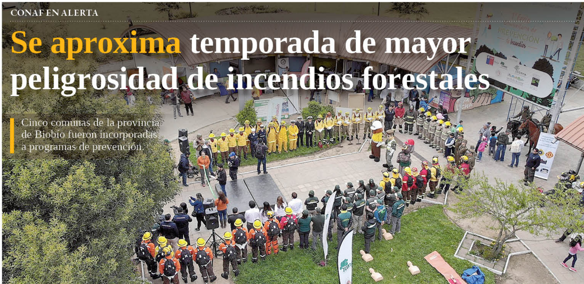
UNA DE LAS ACTIVIDADES MASIVAS realizadas recientemente fue la Primera Feria Comunitaria de Prevención de Incendios Forestales, en San Pedro de la Paz, organizada junto a Corma, Red de Prevención Comunitaria y el municipio, dando el vamos a la campaña de prevención en Biobío.

Cinco comunas de la provincia de Biobío fueron incorporadas a programas de prevención.