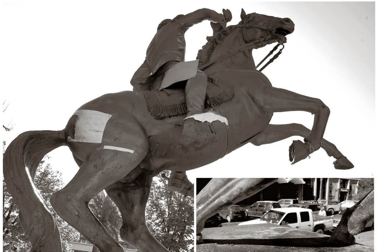
LA ESTATUA NO SUFRIÓ, a simple vista, daños de consideración luego de que se le prendiera fuego a la base del monumento, emplazado en la Plaza de Armas. Ayer, así lucía el tradicional caballo de O'Higgins.

Asimismo, llamó a la ciudadanía a conocer más de la historia —dijo— del Libertador Bernardo O'Higgins. “O'Higgins lideró un proceso de