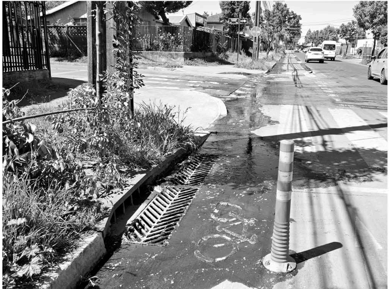
ESTE ES EL ESTADO de la calle que indican los vecinos afectados.

A pesar de la dura caída, la afectada agregó que a pesar del dolor se logró poner de pie y regresar a su casa para dirigirse a Urgencias, donde una radiografía reveló una fractura en una de sus rodi-