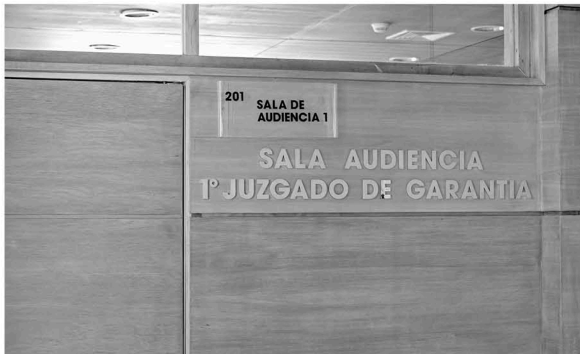
EL PRESUNTO RESPONSABLE fue trasladado en horas de la tarde hasta un recinto penitenciario.