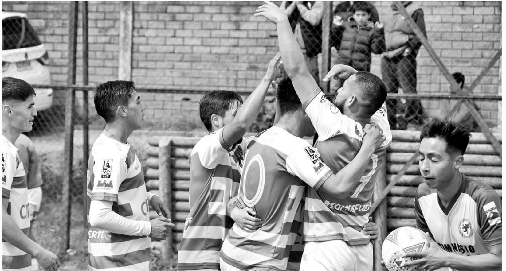
CON UNA VICTORIA ANTE DEPORTES TOMÉ, Nacimiento CDSC, lograría quedar en lo alto de la clasificación.

El actual líder de esta clasificación, que corresponde al