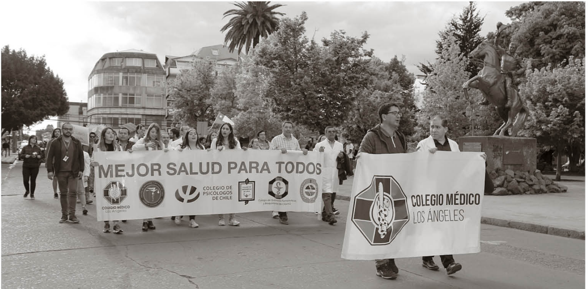
REPRESENTANTES DE LOS GREMIOS de la salud marcharon desde el hospital a la Plaza de Armas de Los Ángeles, exigiendo reconsiderar el presupuesto para el 2020.