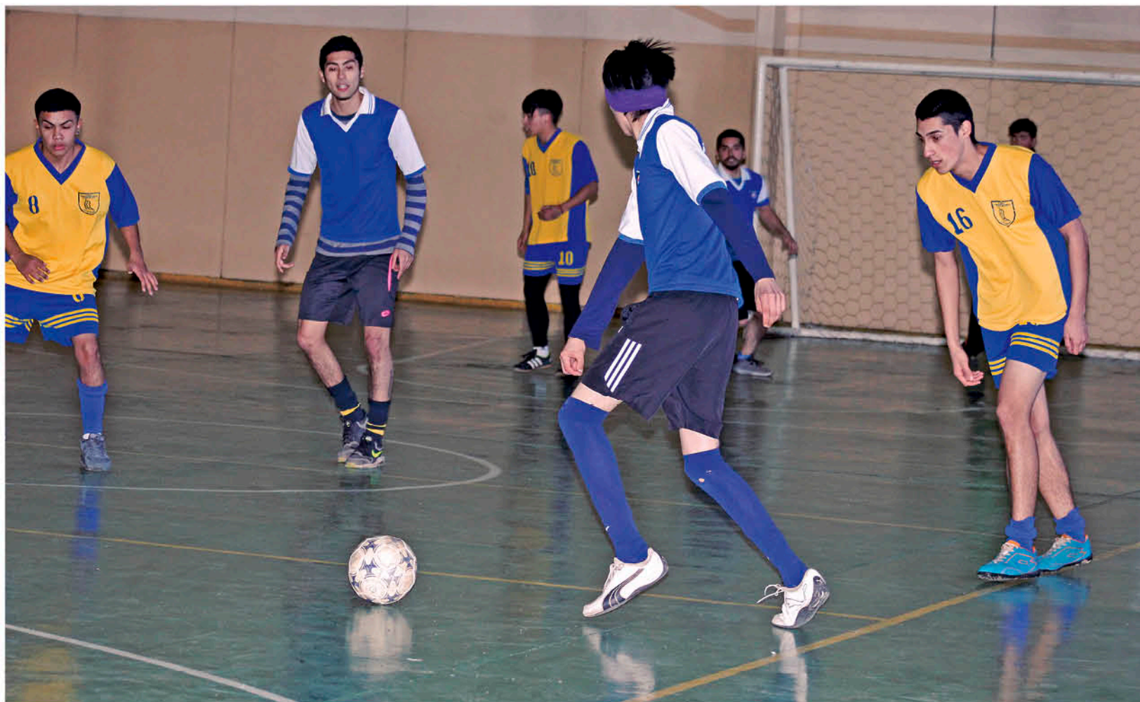
EL EVENTO BUSCARÁ CONTRIBUIR de forma dinámica, creativa y variada a la rehabilitación de distintos pacientes a lo largo del país. (Foto de contexto)