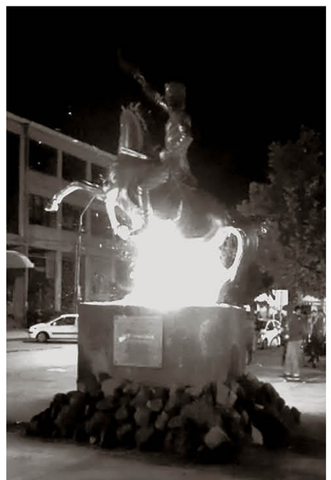
LAS ALARMAS SE ENCENDIERON el lunes por la noche cuando por redes sociales circulaban videos y fotografías que daban cuenta del ataque al tradicional monumento.

“O'HIGGINS LIDERÓ UN PROCESO DE REVOLUCIÓN CONTRA UNA DICTADURA QUE ERA EN ESE MOMENTO LA MONARQUÍA. DEJAR EN CLARO, SU VÍNCULO Y BUENA RELACIÓN CON EL PUEBLO, siempre su pensamiento y su lucha estuvo en contra de los mismos abusos que generaba la aristocracia, el pensamiento o'higginiano tiene que ver con eso”.