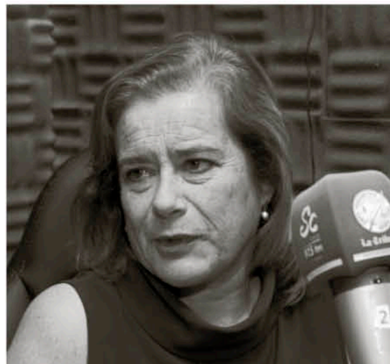
WEISSE TAMBIÉN ES PARTE de la disidencia de la UDI, tal como Alvarado, lo que ha debilitado el poder de JVR, al interior del gremialismo.

"A la Subdere le va a tocar enfrentar dos temas: uno es la reparación y construcción en las comunidades que han tenido daños por las manifestaciones callejeras y segundo manejar, asesorar y llevar adelante la reformulación del fondo común municipal".