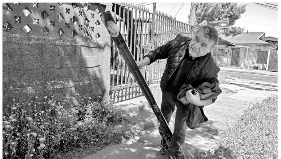
OTRA SITUACIÓN EXPUESTA por los vecinos en un recorrido por la calle denunciada, donde un poste se encuentra en plena vía de peatones.