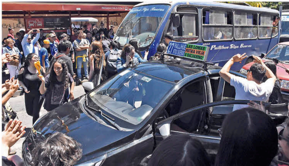
"EL QUE BAILA PASA" se replicó en el centro.