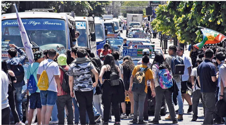
POR MOMENTOS los manifestantes ocuparon la calle Valdivia con Colo Colo.