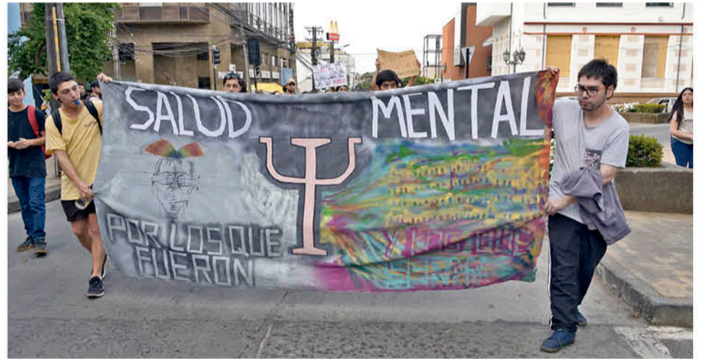
SE RECUERDA A QUIENES han sido víctimas en medio de las protestas ciudadanas.