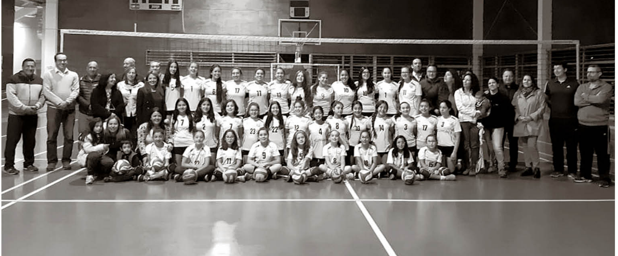
EL EQUIPO ANGELINO ha logrado destacar a lo largo del semestre deportivo como uno de los mejores equipos del país en la disciplina.

En lo que va de año el representativo local ha cosechado destacados resultados en sus últimos torneos posicionándose dentro de los mejores elencos del país.