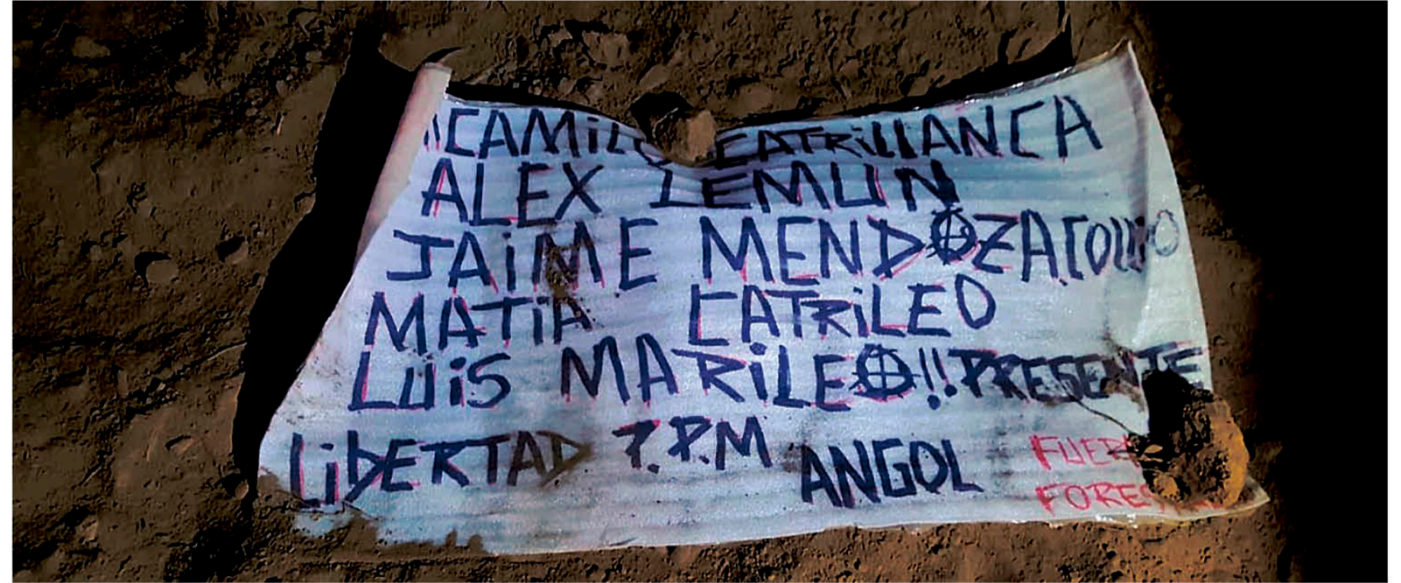
ESTAS FUERON LAS CONSIGNAS encontradas en el lugar de los hechos.

"los antecedentes fueron puestos a disposición del Ministerio Público, que también dispuso la concu-