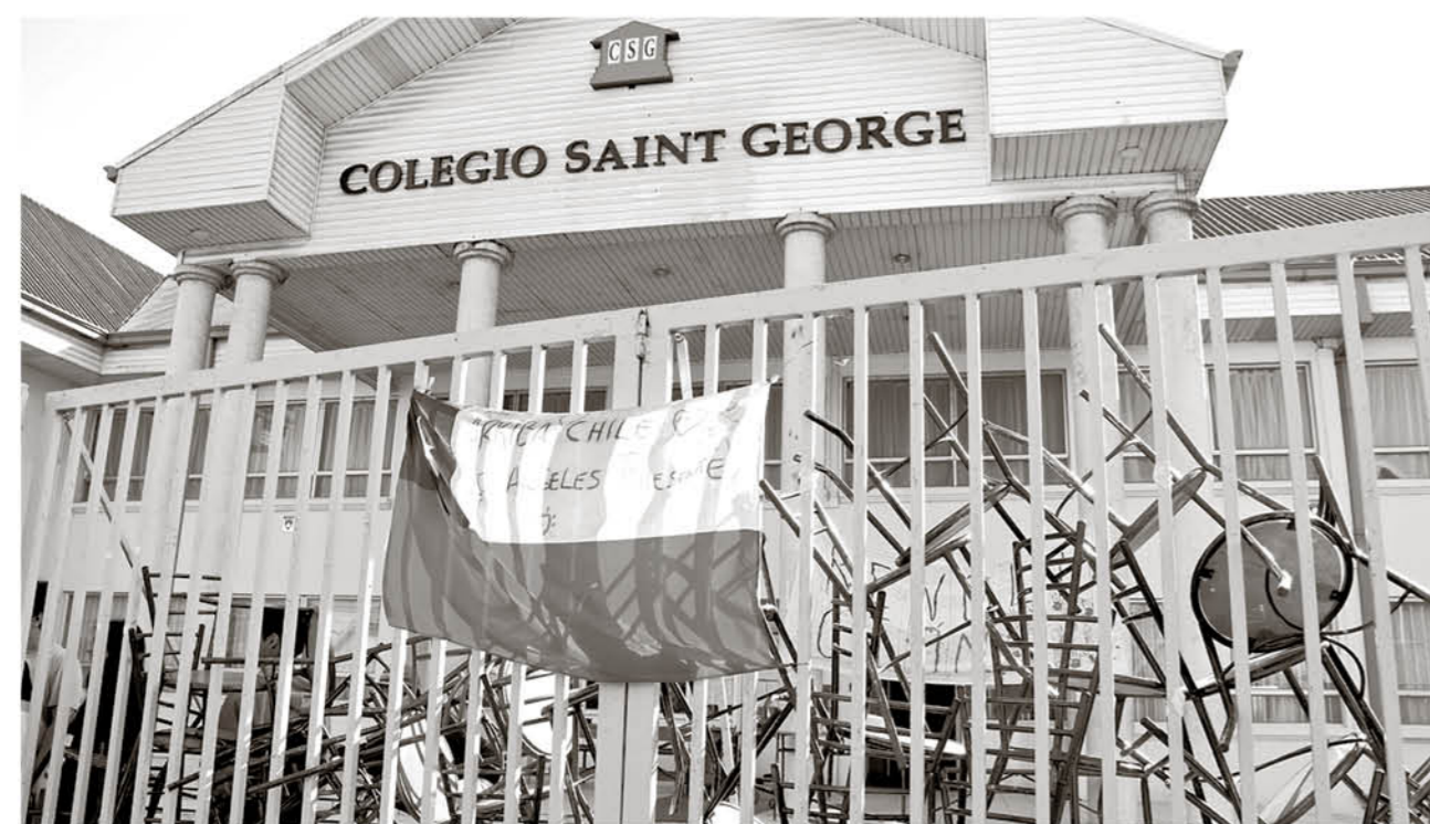
LAS PROTESTAS ESTÁN condicionadas a la respuesta que reciban los estudiantes.