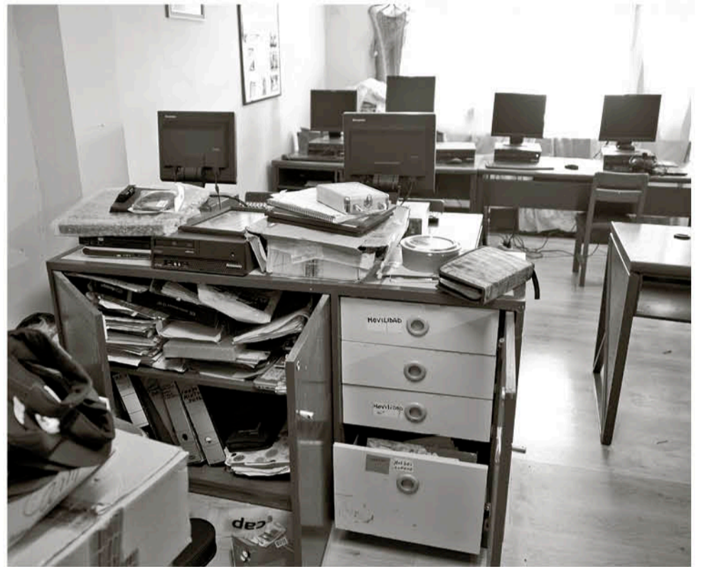
EN ESTA DEPENDENCIA los involucrados revisaron todo el espacio para realizar el robo.

"Yo quiero hacer un llamado a la comunidad para que no compre estos computadores si los ve en algún lado, para nosotros estos equipos eran muy importantes, por ello, les digo que se pongan la mano en el corazón", dijo este hombre que