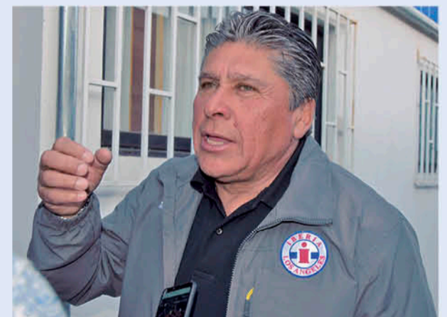
EL ESTRATEGA AZULGRANA comentó con anterioridad que mantiene conversaciones con la dirigencia de Iberia para su permanencia en el plantel el 2020.

Ahora el cuadro de la "I" deberá enfrentar a Colchagua en la próxima fecha. Inicialmente el duelo estaba programado para este sábado 16 de noviembre en Rancagua, pero en la tarde de ayer miércoles la ANFP anunció que la fecha de Primera División, Primera B y Segunda División se suspende hasta nuevo aviso por el momento que vive el país.