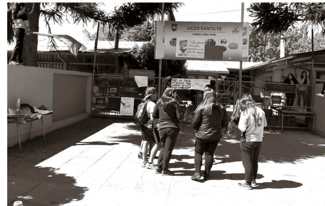
EN SANTA FE se acata la toma del liceo.