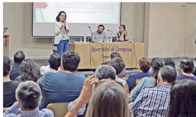
EN LA UDEC SE REALIZÓ el conversatorio "Hablemos de nuestra Constitución".