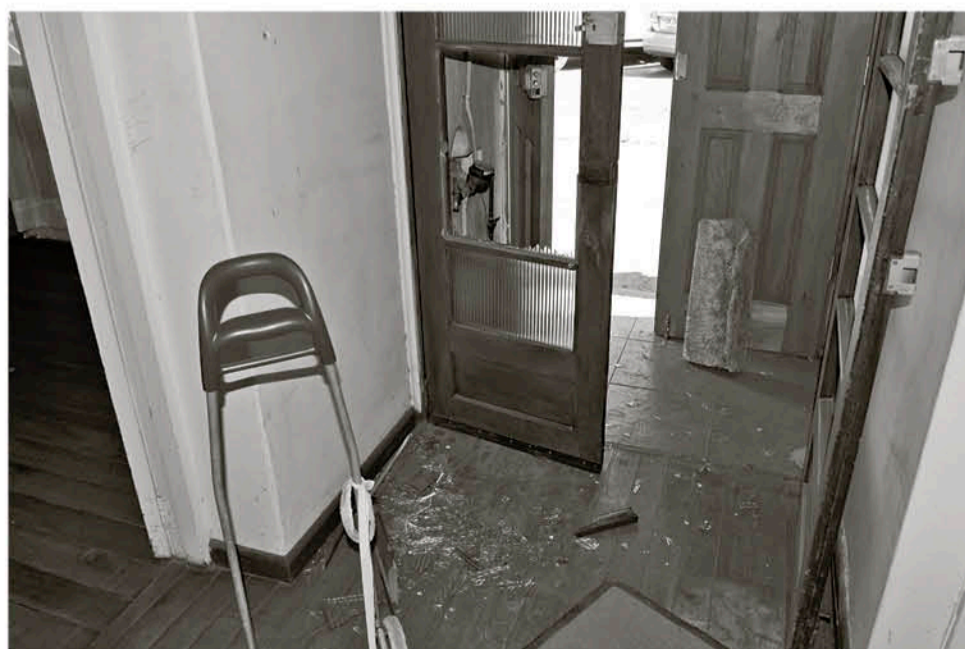
INGRESO POR EL QUE REALIZARON el robo y el posible retiro de las especies.

"Acá hemos desarrollado diferente proyectos que nos benefician, yo llegué porque tengo baja visión el 2006, ayudo y también me duele porque vemos todo el esfuerzo de la familia que ha hecho por sacar este espacio adelante se ve dañado por personas sin escrúpulos", quien además agrega que ojalá este hecho no quede en el olvido.