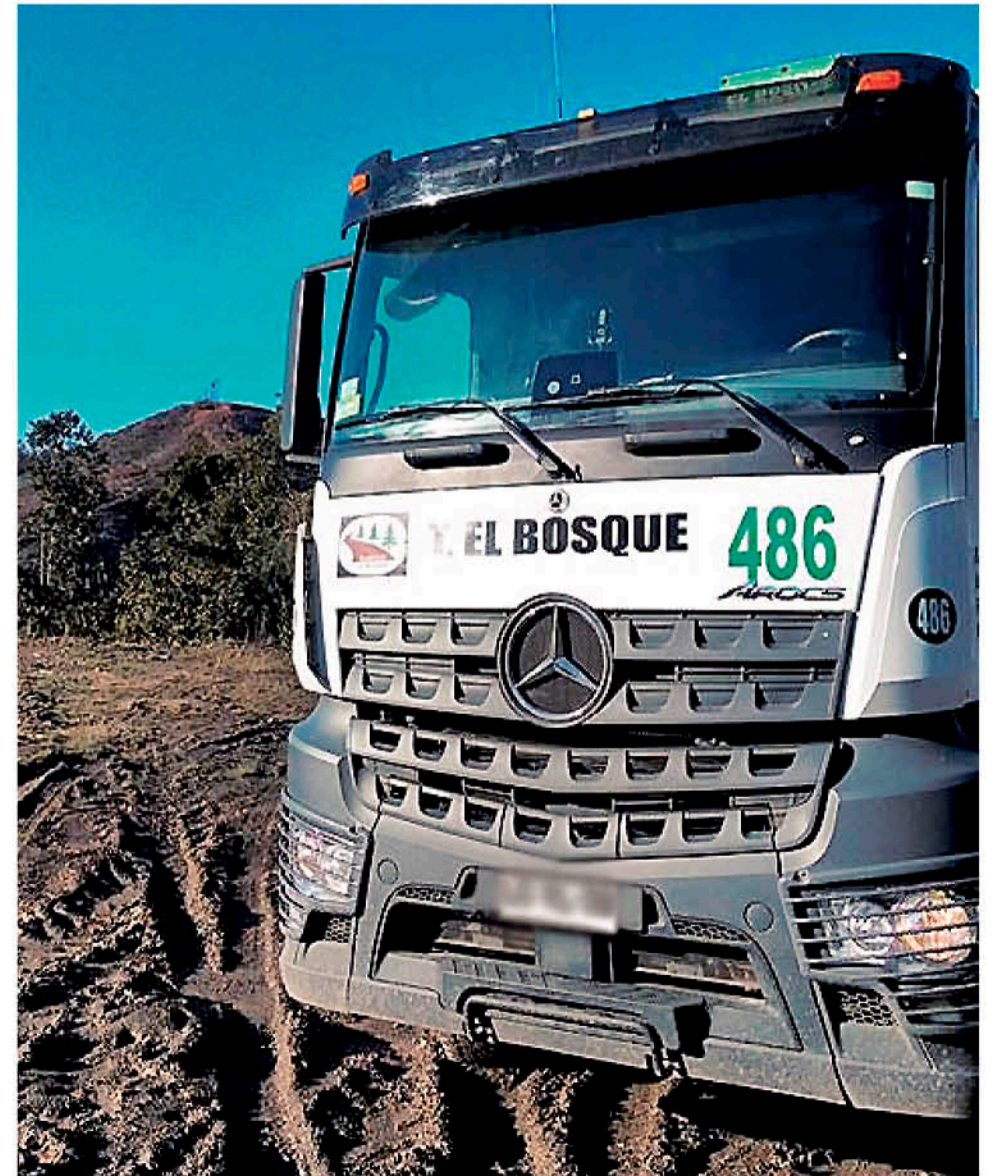
ESTE FUE UNO DE LOS CAMIONES incinerados por los atacantes encapuchados.