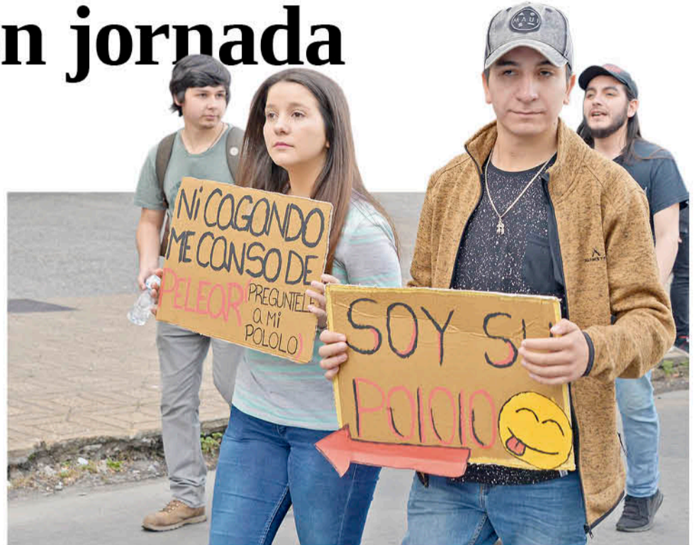
LAS DEMANDAS SOCIALES se repiten en todo el país.

ta dentro de los llamados cabildos multiestamentales, se consideró la participación de moderadores, como parte del conversatorio, que busca reflexionar sobre la carta fundamental y sus alcances en la vida de los chilenos. En dicha instancia, se consideró la participación de representantes de la Oficina de Apoyo