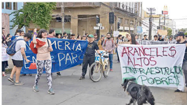
LA MARCHA SE MANTIENE de manera ininterrumpida desde el 19 de octubre en Los Ángeles.