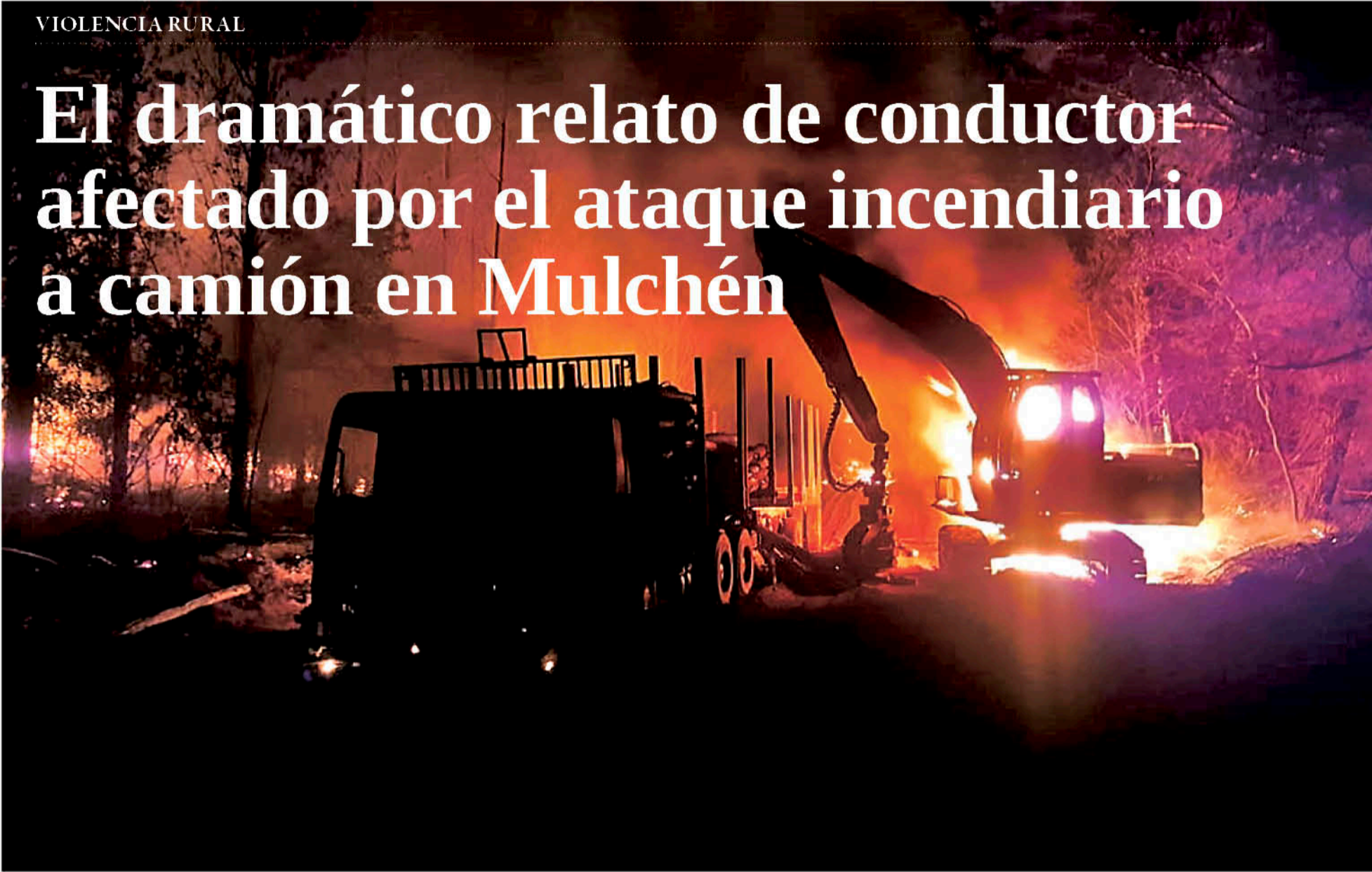
LA EMERGENCIA FUE CONTROLADA por personal de Bomberos de la comuna bureana.

El trabajador relató a La Tribuna cómo fue el atraco, donde seis hombres lo tomaron por sorpresa en medio de su jornada laboral.