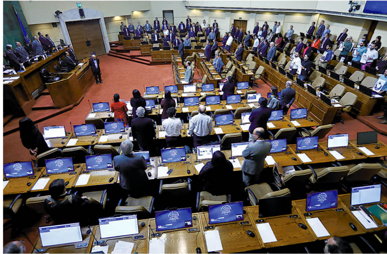
TRAS EL ESTALLIDO SOCIAL, el Congreso ha dedicado su trabajo a una agenda que responde, en parte, a las demandas sociales.

Con ello, Monsalve explicó que se trata de "una norma que está acorde con las señales que se requieren para recuperar las confianzas en las instituciones políticas, en el gobierno y en el parla-