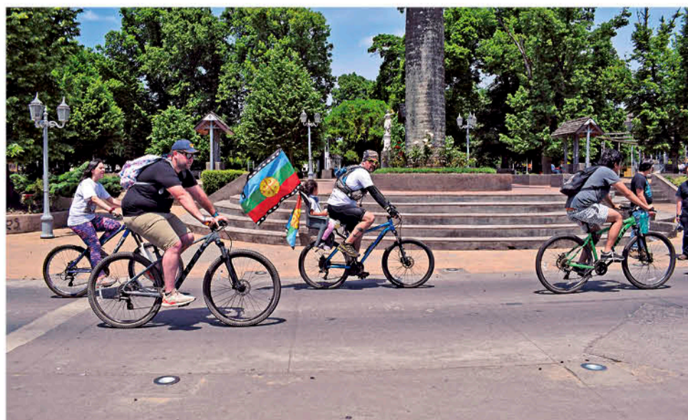
PERSONAS DE TODAS LAS EDADES participan en estos recorridos.