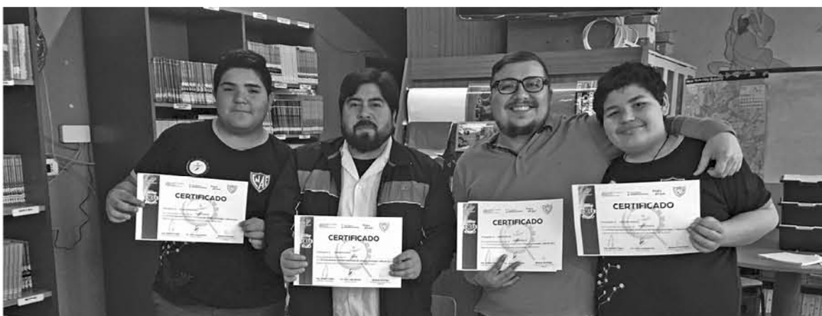
PARA LLEGAR A PARAGUAY, los mulcheninos ganaron en 2018 un concurso nacional en Concepción.