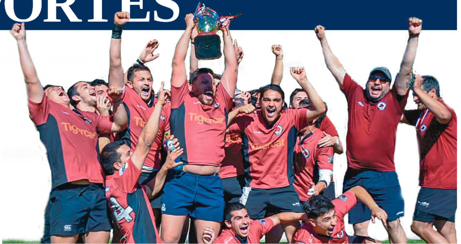
ESTA VICTORIA impulsará al club de rugby angelino, que busca nuevos exponentes para que defiendan al "Rino".