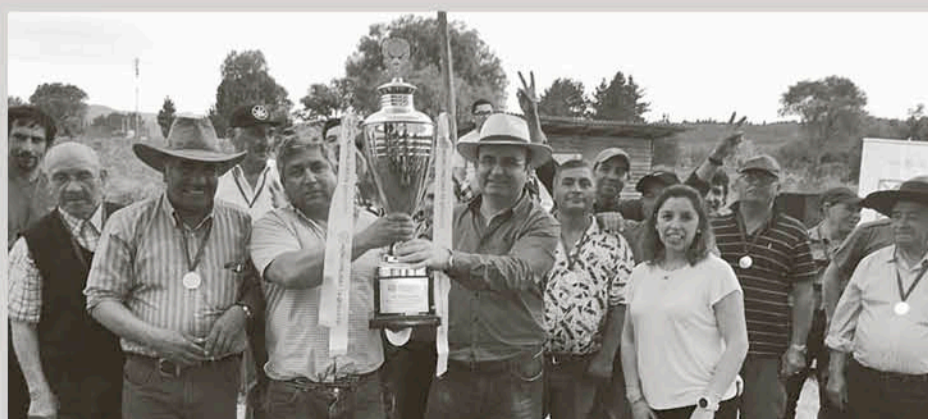
PARA EL PRÓXIMO AÑO se trabajará en un torneo de apertura y clausura de este deporte nacional.

La asociación destacó con su precisión lanzando el tejo, en un torneo que destacó por el compañerismo y la sana competencia dentro de la comuna cordillerana.