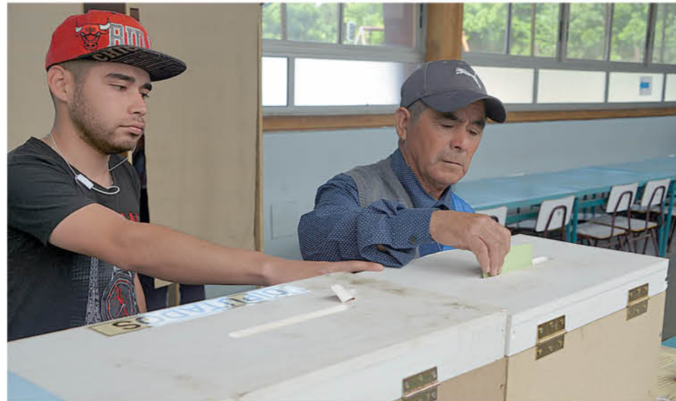
LA DIPUTADA JOANNA PÉREZ ha insistido en la necesidad de volver al voto obligatorio para dar estabilidad al sistema político.