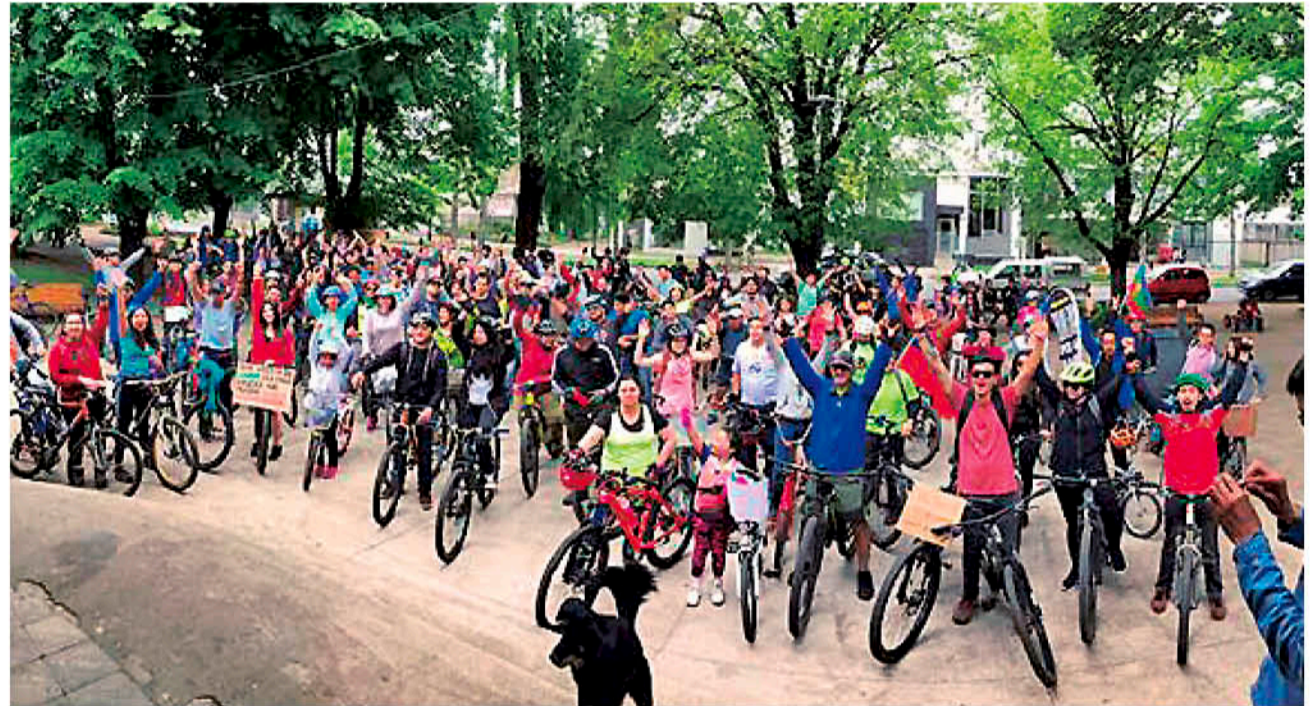
EN ESTA INICIATIVA, los ciudadanos han compartido diferentes experiencias y promueven el uso de este medio de transporte.