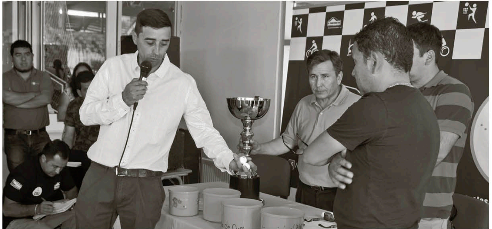
AGRADECIDOS DEL AUSPICIO DE COOPELAN, la liga busca más interesados en apoyar al emblemático torneo provincial.

El magno campeonato de balompié disputado en Biobío, compuesto por cuatro ligas, ingresó los nombres de sus 32 conjuntos e hizo girar la tómbola para organizar las disputas válidas por la Copa y Re-Copa de Campeones, las que comenzaron el pasado fin de semana.