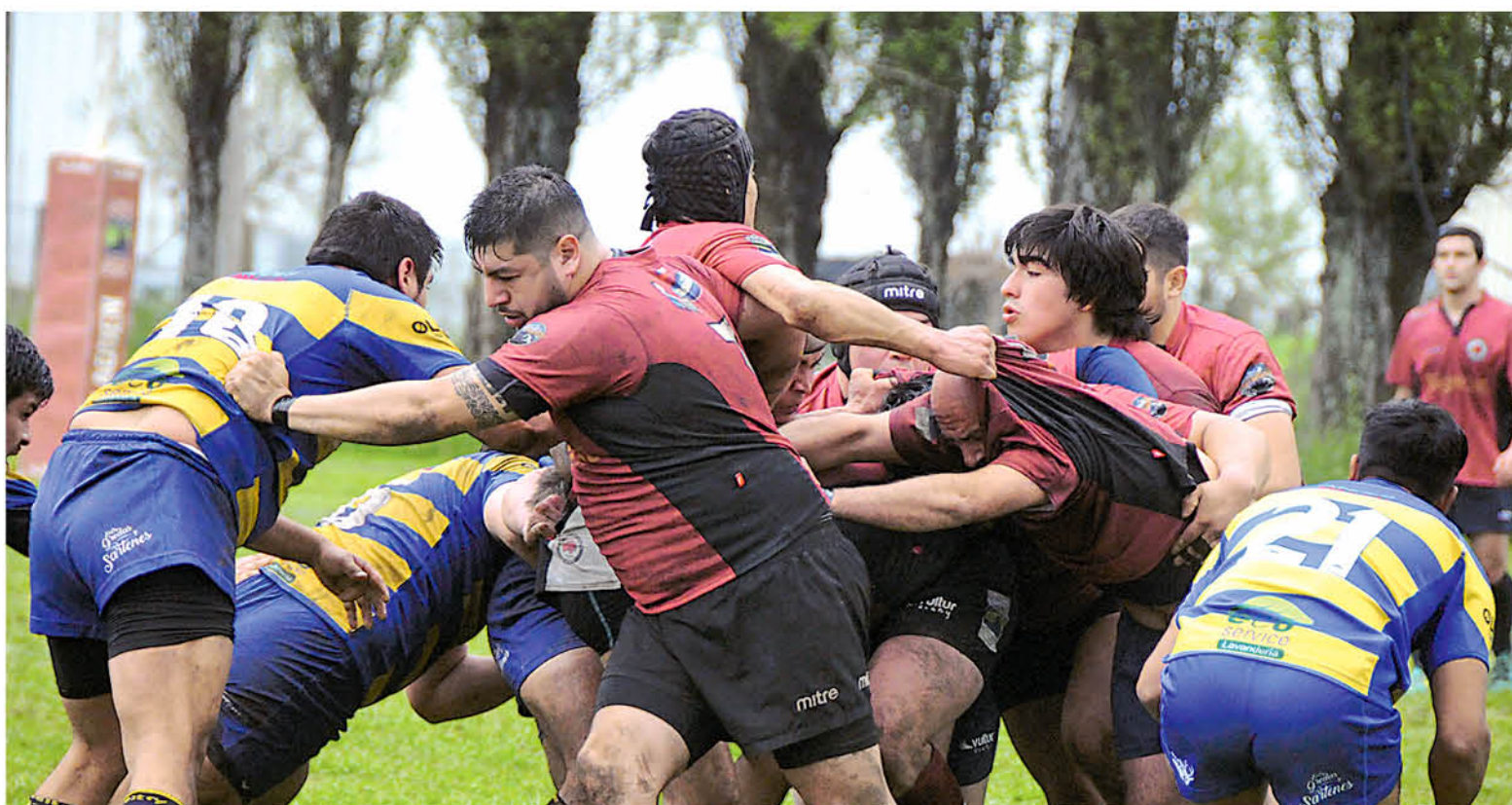
DURANTE EL CAMPEONATO 2018, Callaquén obtuvo el pase a la final tras derrotar a UdeC en condición de local. Hoy son los monarcas vigentes.