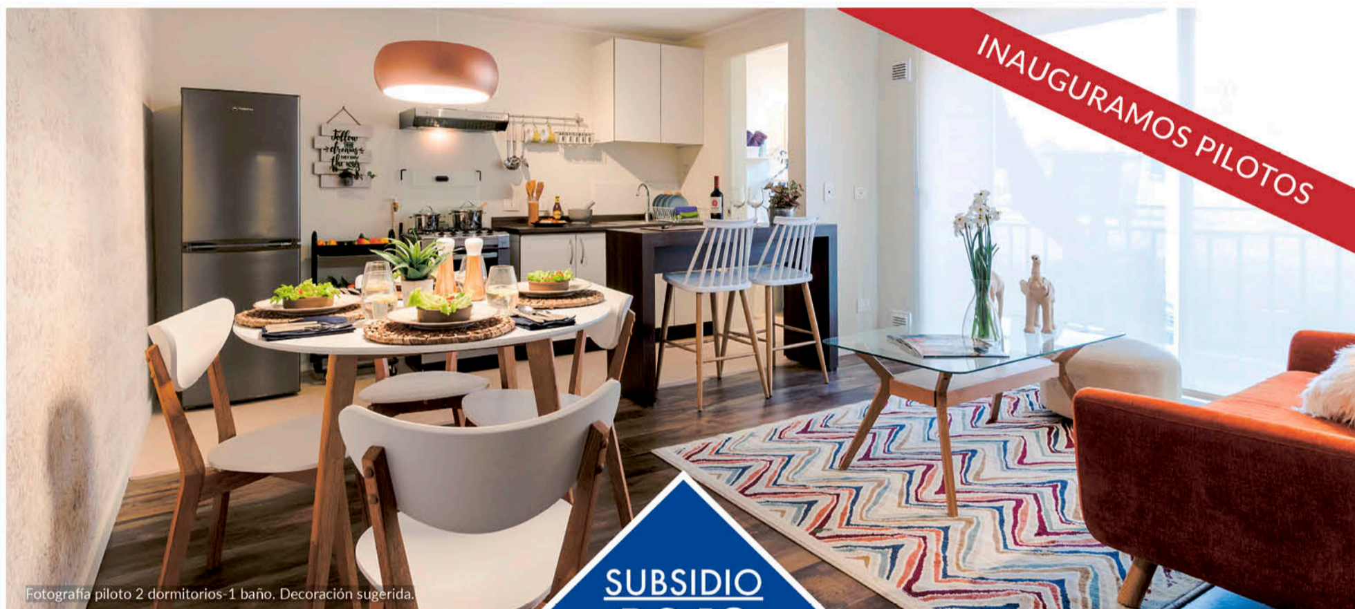
Fotografía piloto 2 dormitorios-1 baño. Decoración sugerida.