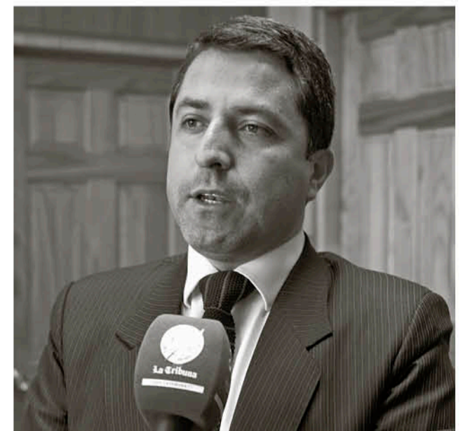
EL ALCALDE MARIO GIERKE dijo que destinará el dinero de la fiesta a la compra de una ambulancia.