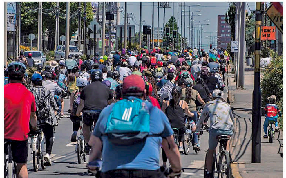
ESTAS AGRUPACIONES SE MANIFIESTAN por diferentes arterias de la ciudad.