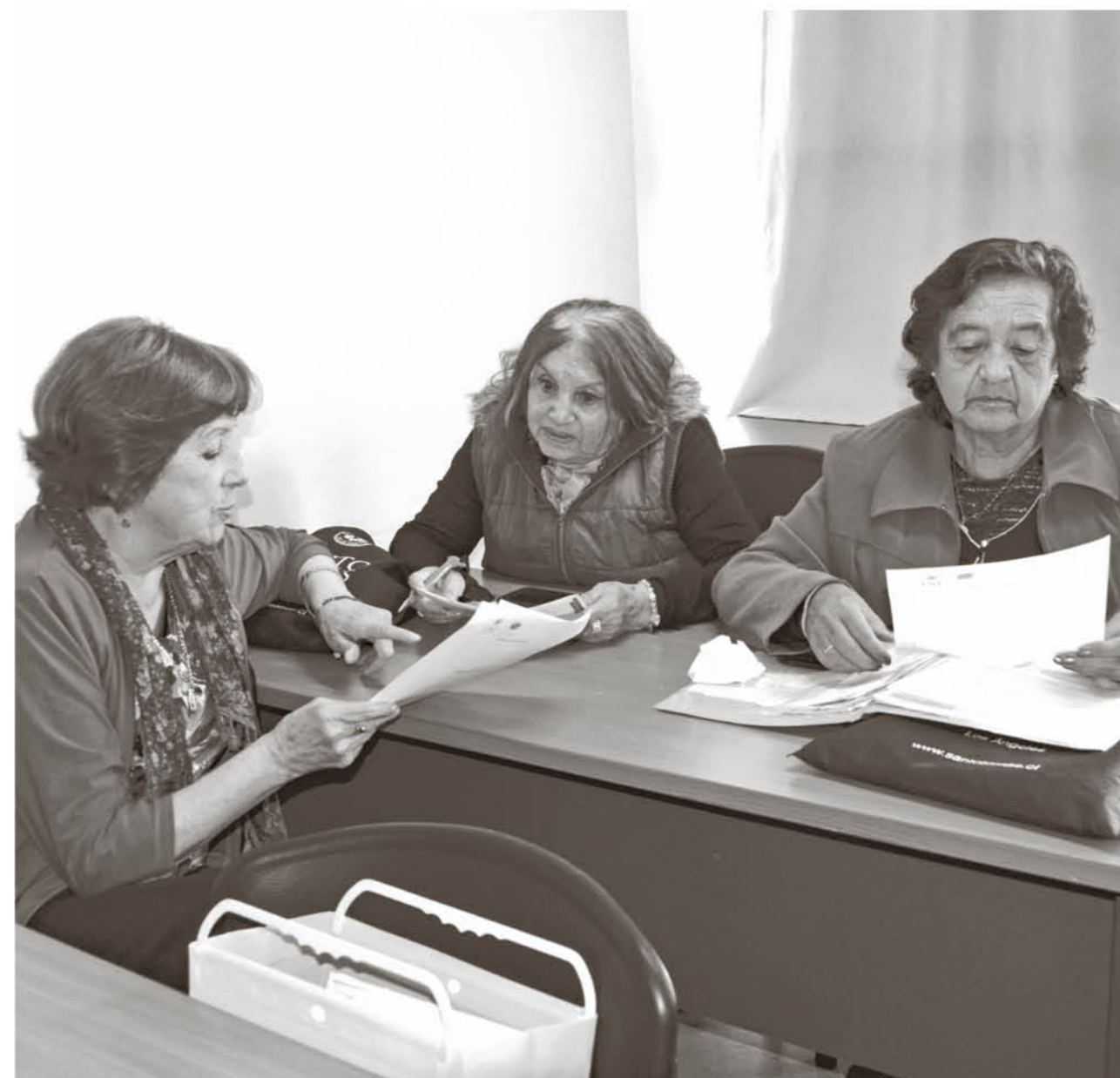
ESTA GENERACIÓN egresará en noviembre de este año, luego de aprender diversas materias y experiencias.

de adultos mayores llegó para dar un giro a sus vidas, ya que como ellos mismos destacaron, la gente quiere sentirse hoy en día más importante.