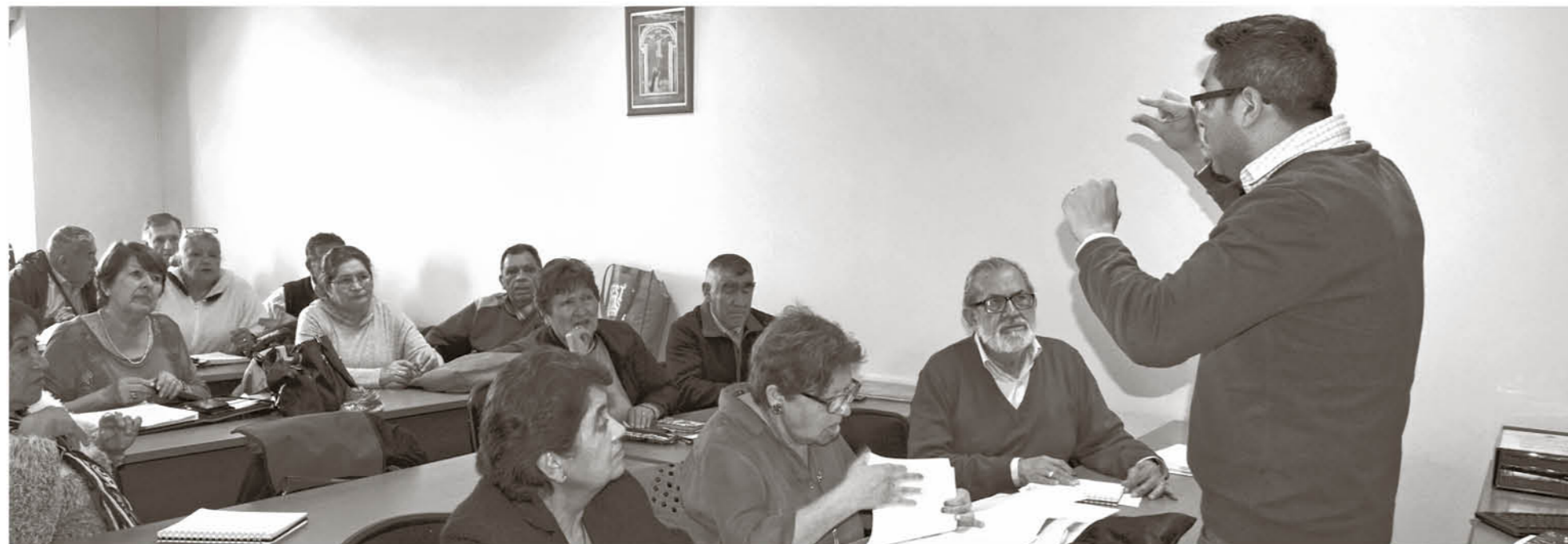
LOS ESTUDIANTES además forman parte activa de diversos grupos sociales de diferentes comunas.

Diario La Tribuna conversó con dos estudiantes, quienes dieron a conocer su experiencia, coincidiendo en que estas experiencias hoy los hace personas más felices.