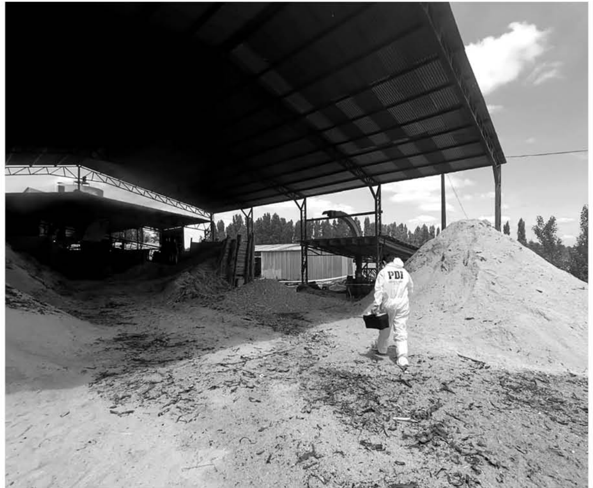
LA POLICÍA DE INVESTIGACIONES trabaja para dilucidar las circunstancias en las que ocurrió el fatal hecho.

Ahora, efectivos de la Policía de Investigaciones, en conjunto con el Servicio Médico Legal y el Ministerio Público, deberán determinar las circunstancias que derivaron en este trágico accidente. Por su parte, la Unidad de Salud Ocupacional de la Seremi de Salud de Biobío deberá instruir un sumario sanitario.