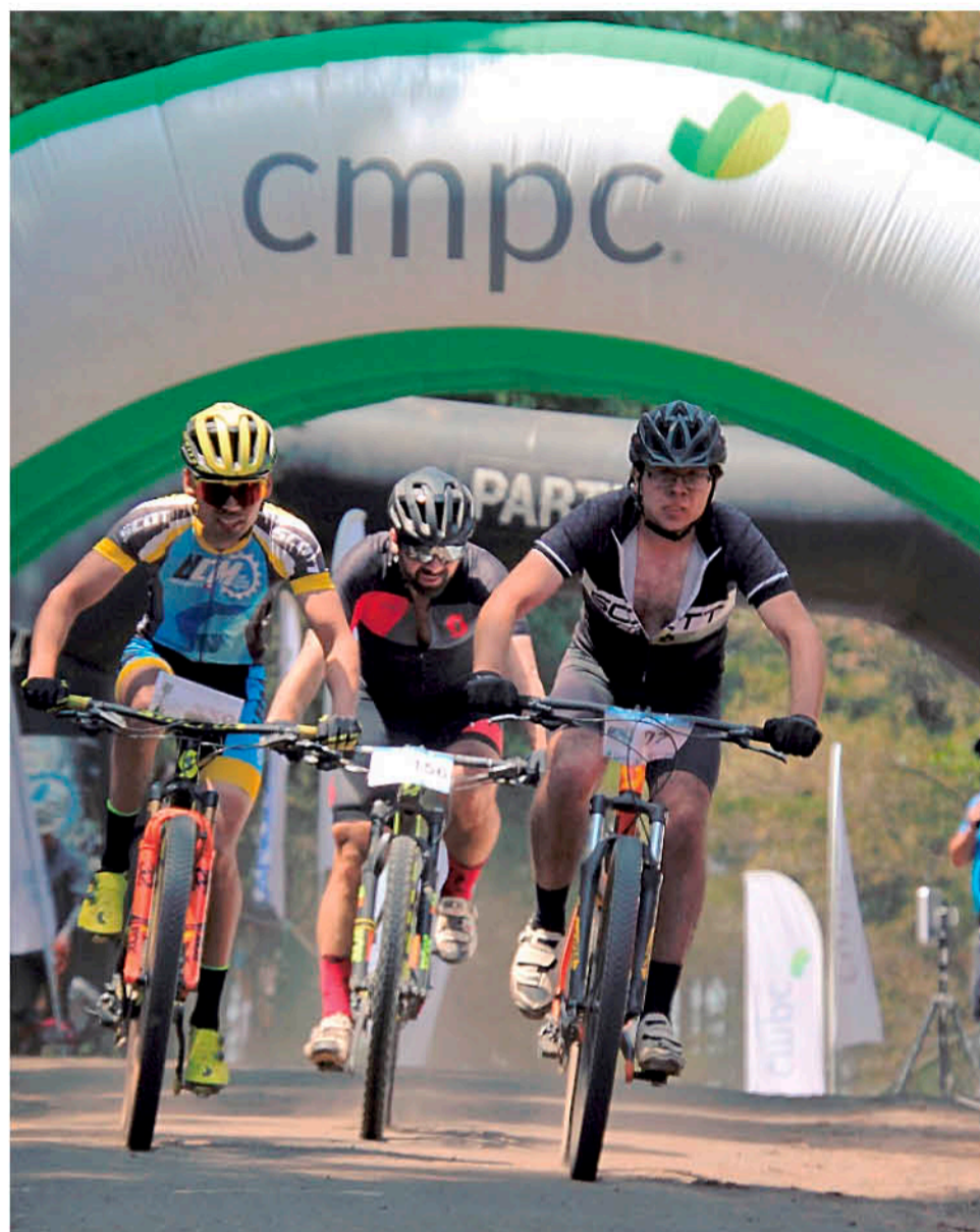
MUCHOS PEDALEROS ASISTIERON a la competencia organizada por la asociación angelina, como una gran previa a desafíos venideros en sus rutas competitivas.

Referente al título del "Feña", manifestó que "me sien-