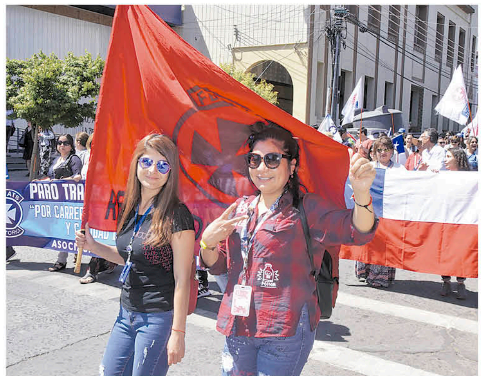
LOS TRABAJADORES y trabajadoras de la salud se plegaron a la movilización.