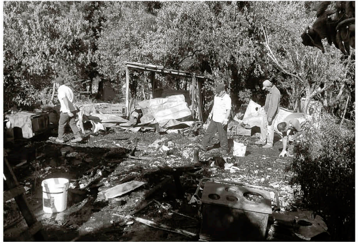
VECINOS QUE HABITAN EN EL MISMO PREDIO, pero en distintas casas, colaboraron en el rescate de algunos enseres.

En la vivienda residía una mujer de más de 80 años junto a dos de sus hijos, quienes resultaron damnificados a raíz de la emergencia. Algunos de los vecinos que habitan en el mismo predio, pero en distintas casas, colaboraron en el rescate de algunos enseres. Carabineros también trabajó en el lugar del incendio.