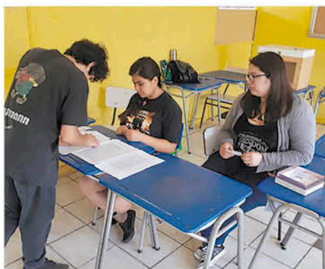
EN EL LICEO CO EDUCACIONAL Santa María de Los Ángeles se votó por continuar o deponer la toma.