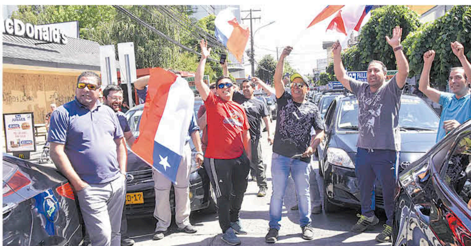
LA MANIFESTACIÓN de los colectiveros se llevó adelante en completa calma.