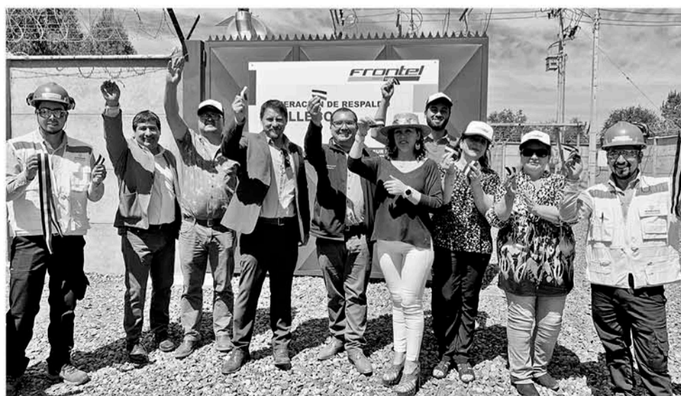
VECINOS BENEFICIADOS junto a las autoridades celebran la llegada del generador.

Con esta inversión serán más de 850 familias las que podrán ver restablecido su servicio ante la eventualidad de cortes masivos.