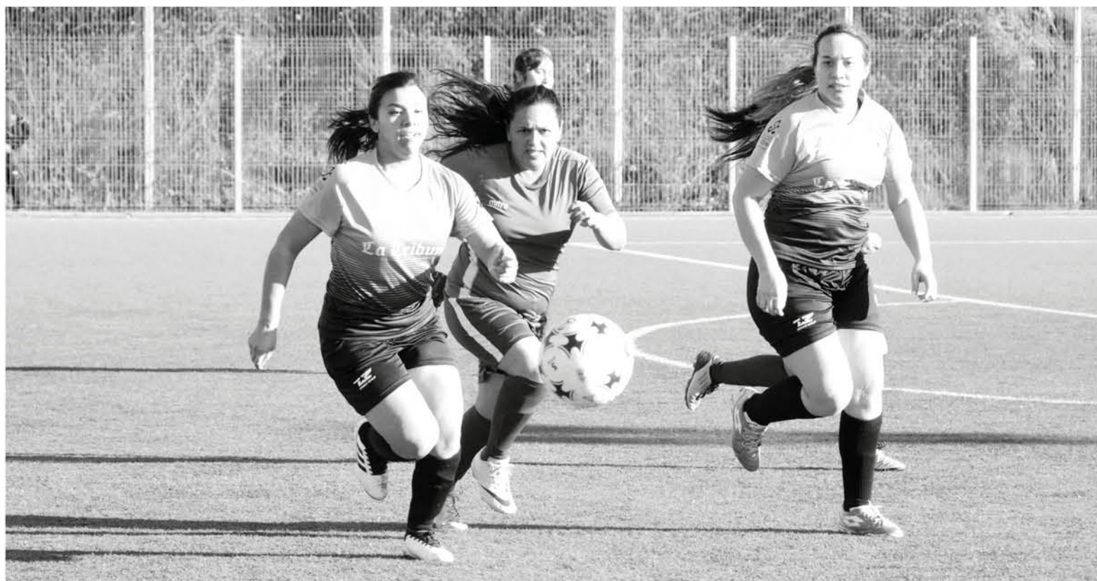
EL FÚTBOL FEMENINO ha logrado gran representatividad, en la provincia de Biobío, convirtiéndose en una de las competencias más grandes de la región.

Ya en recta final el campeonato local ha demostrado un gran nivel competitivo por parte de las aguerridas deportistas, que dan vida al principal torneo de fútbol femenino en la provincia.