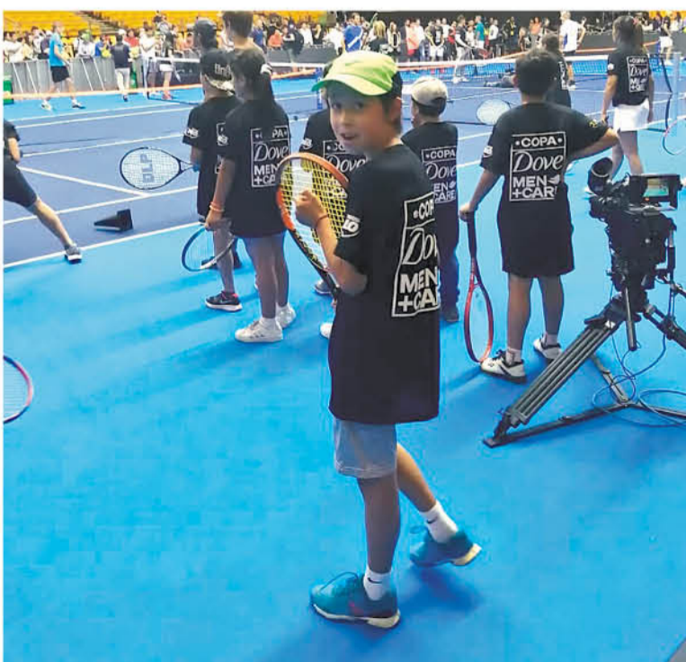
LA PEQUEÑA RAQUETA ARRIBÓ A LA CAPITAL para conocer a la estrella del tenis global, representando a la Asociación de tenis del Bío Bío.