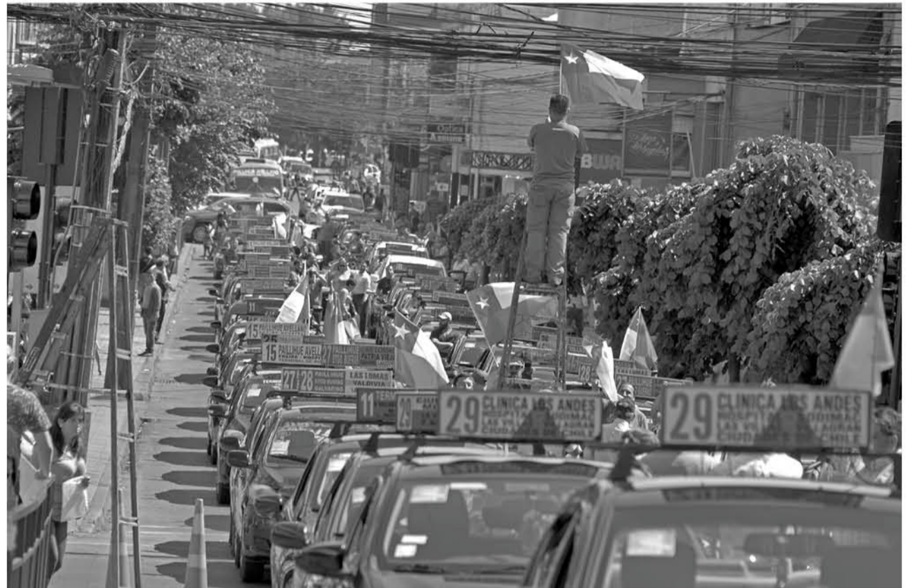
LA CONVOCATORIA ES LA MÁS MULTITUDINARIA que se recuerde en la ciudad de Los Ángeles.