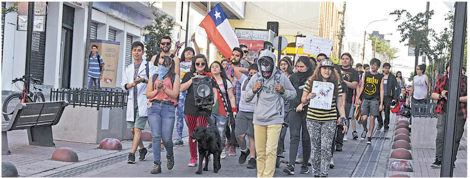
EN LA TARDE, UNA TREINTENA de jóvenes y estudiantes dieron vida a la ya tradicional marcha pacífica de las 18:00, la cual se ha mantenido prácticamente ininterrumpida durante el mes de protestas callejeras.

Pese a que no fue la más masiva de las manifestaciones, el 20 de noviembre de 2019 quedará en la retina como el día en que diversas agrupaciones sociales y de trabajadores se tomaron las calles del centro para protestar pacíficamente. Colectiveros, estudiantes, gremios de la salud, profesores y trabajadores de servicios públicos hasta tuvieron que esperar su oportunidad en determinada calle para poder utilizarla. Ocurrió, por ejemplo, al mediodía en Ricardo Vicuña, donde el grupo liderado por la Fenats Histórica tomó la cuadra entre Villagrán y Almagro, seguidos a metros por un grupo de colectiveros que tocaban la bocina.