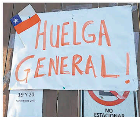
ALGUNOS GRUPOS DE LOS TRABAJADORES del sector público se sumaron a la huelga.