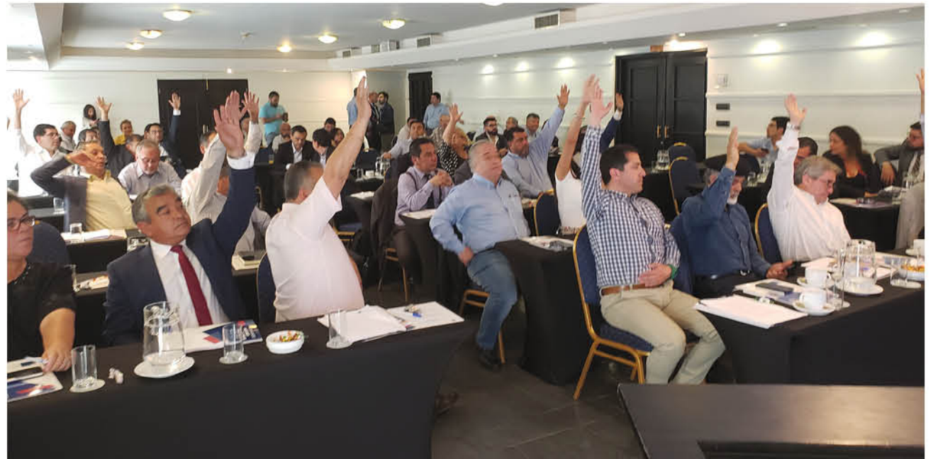
EL COMITÉ EJECUTIVO de la ACHM acordó a mano alzada realizar la Consulta Ciudadana el próximo 15 de diciembre.

Para la instancia se trabajará con un padrón electoral de 2017, pero también podrán votar todos los chilenos que tengan desde 14 años de edad. Para constituir las mesas se pedirá ayuda a las organizaciones sociales y habrá voto electrónico y tradicional.