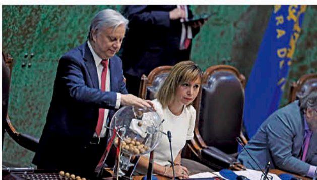
LA COMISIÓN INVESTIGADORA quedó compuesta por tres diputados de oposición y dos del oficialismo que fueron elegidos por la tómbola.

La instancia fiscalizadora del Poder Legislativo sobre el Ejecutivo estará compuesta por un socialista, un comunista, un demócratacristiano, una representante de RN y un gremialista.