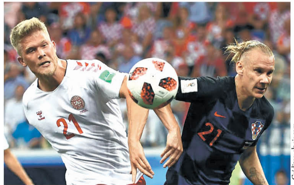
ENTRE OTRAS CONCLUSIONES DEL ESTUDIO, se pudo determinar que los jugadores más altos se encontraban en Serbia, en tanto, los más bajos se encontraron en Perú.

La investigación del experto angelino se encuentra a disposición de la comunidad, para todos los interesados en sacar sus propias conclusiones sobre la influencia de la estatura en el desempeño futbolístico.