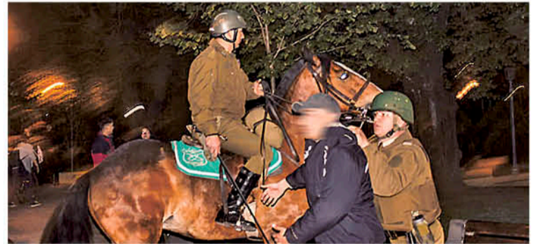
ESTA COMISIÓN TIENE CUARENTA Y CINCO DÍAS para someter su informe a votación en la Cámara de Diputados.

La Comisión Investigadora que fiscalizará el decreto y las consecuencias del Estado de Excepción fue solicitada el 24 de octubre bajo la firma de 68 representantes distritales, cuenta a partir de este miércoles (ayer) con 45 días para evacuar su informe y someterlo a la sala.