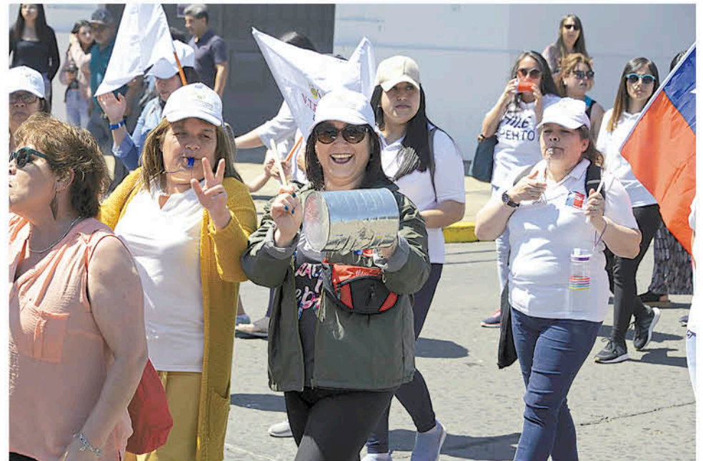
EL GRUPO MARCHÓ POR LAS CALLES del centro de Los Ángeles, topándose con otros movimientos cerca de la Plaza de Armas.