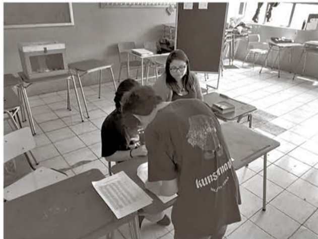
SE HABILITÓ UNA SALA donde los estudiantes participaron del proceso de votación.

taciones pacíficas. "No somos simplemente los mocosos que no tienen idea lo que está pasando. Tenemos nuestras demandas y solidarizamos con el petitorio nacional. Estamos insertos en esa realidad y la única forma de deponer la movilización es a través del voto. La opinión se hace valer mediante la participación en este plebiscito",