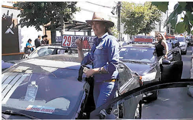
LOS COLECTIVEROS NO LLEVARON pasajeros durante una hora y media en el centro de Los Ángeles. Exigen el fin del impuesto específico a las gasolinas.