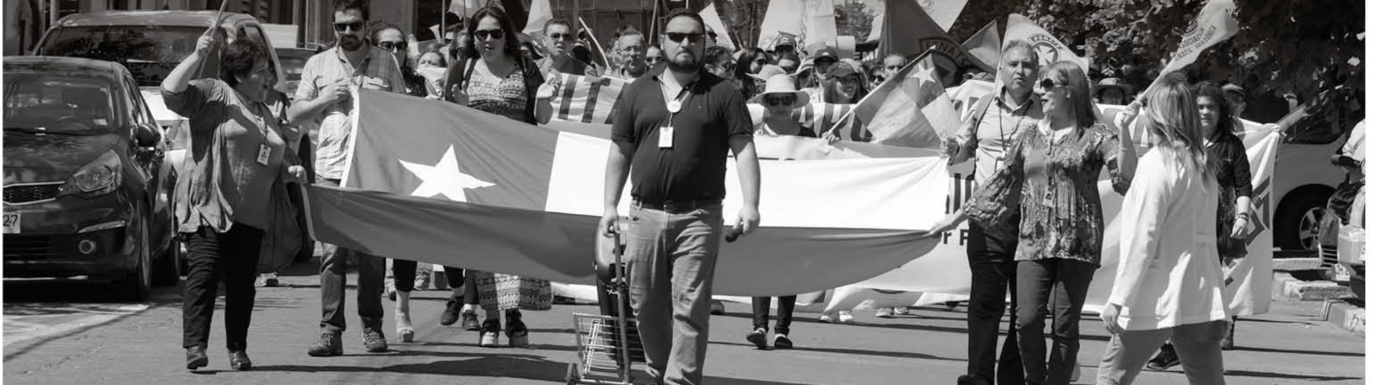
DISTINTOS GREMIOS marcharon hasta la Plaza de Armas para luego sumarse a una manifestación por el centro de la ciudad.

Profesores, funcionarios de la salud y trabajadores del sector público marcharon por el centro de la ciudad, de manera simultánea a las movilizaciones ciudadanas que se mantienen en Los Ángeles desde el pasado 19 de octubre.