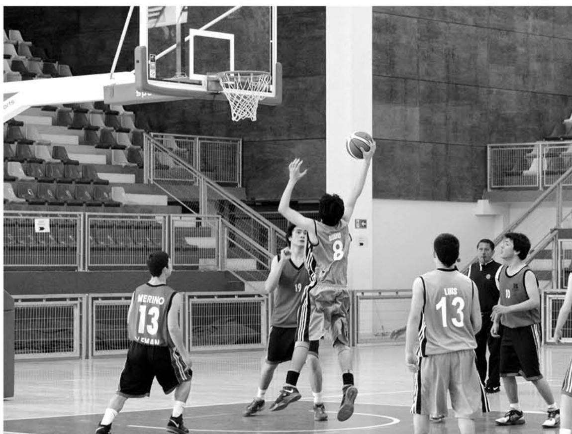
EL BÁSQUETBOL EN BIOBÍO ha crecido en el último tiempo gracias al semillero deportivo potenciando a las jóvenes promesas.

Respecto a la categoría más competitiva de la liga la cual corresponde a todo competidor, donde se mantiene un nivel semi e incluso profesional, son ocho elencos en damas y varones los que compiten semana