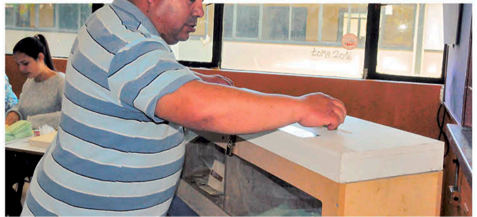
DOSCIENTOS DIEZ de los 330 asociados a la ACHM participarán de la Consulta Ciudadana.

Cuando la ACHM resolvió realizar la consulta ciudadana, sabía que los municipios se enfrentarían a un problema de logística, por lo mismo en las comunas de nuestra provincia se trabaja intensamente para definir los locales de votación, los horarios de las mismas y la composición de las mesas, para lo que se pediría la