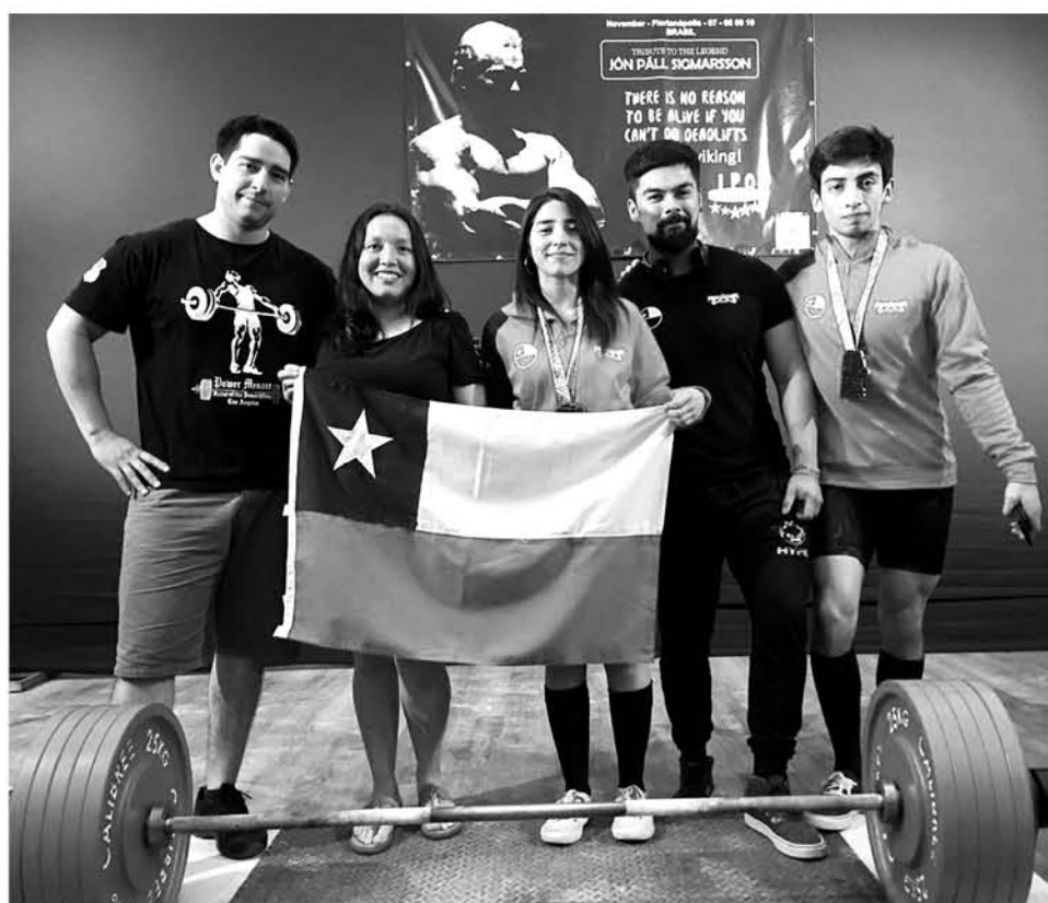
EL TORNEO organizado por Power Menace, espera seguir ratificando el nivel demostrado por los clubes locales a lo largo del semestre deportivo.

Cabe señalar que en el transcurso del año los representantes locales Vikingos y Power Menace, afianzaron su nivel culminando con una actuación sólida en la máxima cita de la disciplina a nivel mundial, el Campeonato Mundial Power Lifting Bench Press, Push-Pull y Deadlift, realizado en Florianópolis Brasil. Destacando de gran forma en los podios mundialistas.