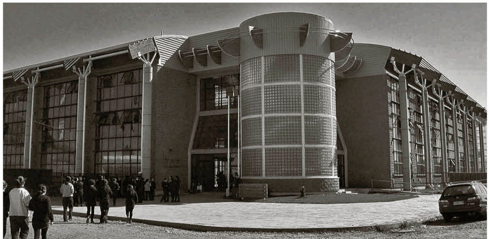
EL LICEO JUANITA FERNÁNDEZ SOLAR, que cuenta con una matrícula superior a los mil estudiantes, clasificó entre más de 300 establecimientos educacionales.

Este año, por primera vez en el proceso se incorporó a establecimientos en todas las modalidades: humanista, científica, técnico-profesional y artística.