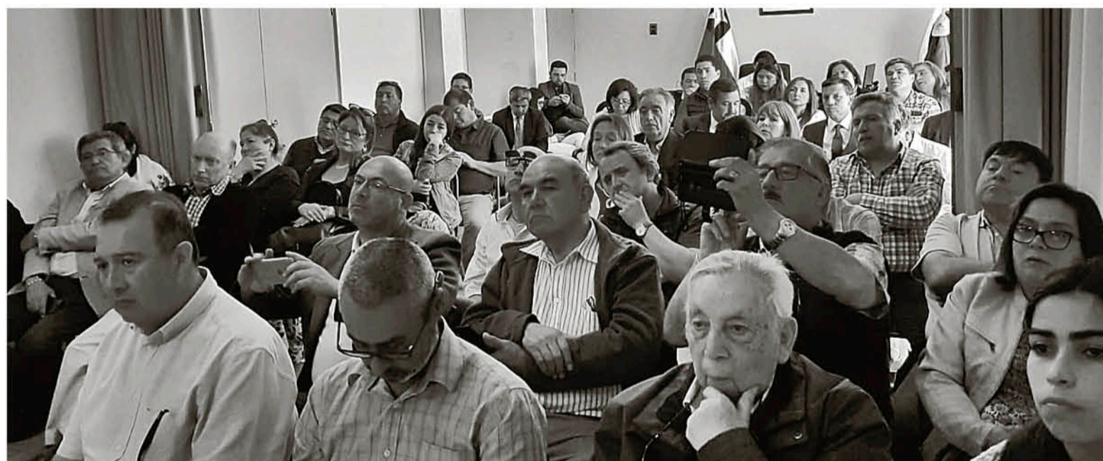
EL GOBIERNO PRESENTÓ A LAS PYMES LOCALES sus medidas para apoyarlas tras la merma que han sufrido en medio del estallido social.

En la Gobernación, el Ejecutivo presentó a las pymes de la Provincia de Biobío las medidas económicas que irán en ayuda del sector, que se ha visto dañado en medio de la crisis social.