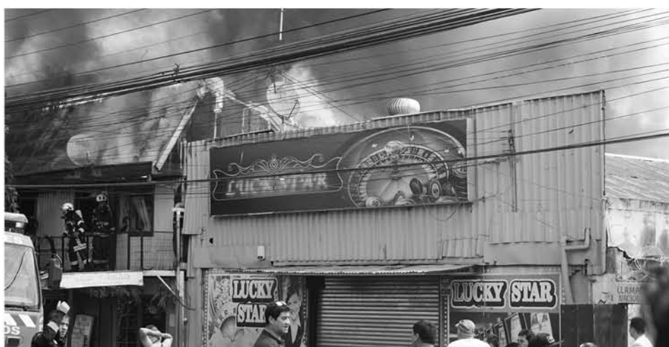
LUEGO DEL INCENDIO ocurrido en el sector de la Vega los locatarios piden por medidas de contención ante posibles desgracias.

Con el fin de evitar desgracias mayores, y para dar seguridad tanto a comerciantes del sector como a vecinos y clientes las asociaciones de trabajadores presentaron una carta en Essbio para que exista pronto un grifo de incendio.