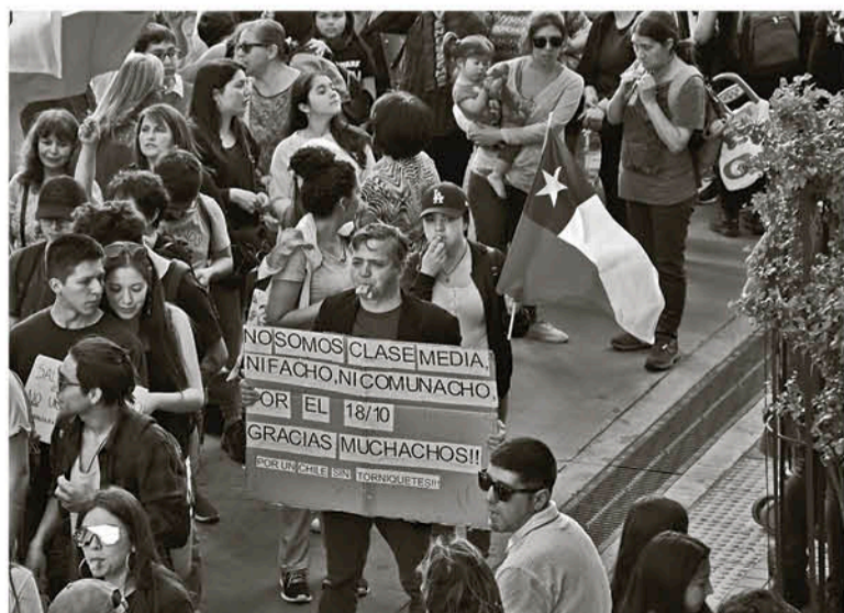
LAS MARCHAS EN LOS ÁNGELES han obligado al comercio a cerrar más temprano, lo que ha hecho caer sus ventas hasta en un 60%.