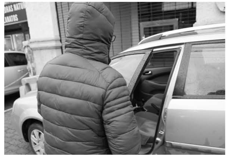
FOTOGRAFÍA DE CONTEXTO, (Archivo Diario La Tribuna).

Para prevenir esta situación y los inconvenientes que acarrea a la población, Carabineros está tomando medidas tales como servicios preventivos focalizados en los lugares y horarios donde se han presentado más casos delictivos, el estudio de las cámaras de vigilancia que se encuentran dispues-