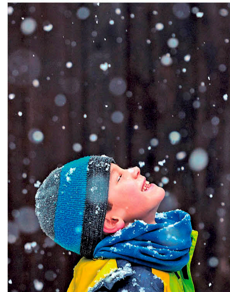
EN ESTAS FECHAS FESTIVAS hay que saber claramente los límites que no pueden sobrepasar los niños para una buena convivencia.