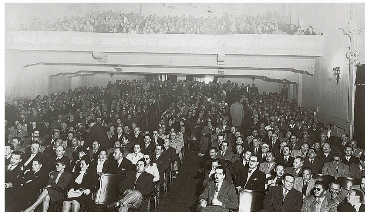
Teatro Municipal, hoy Casa de la Cultura, años '50.

La llegada de la magia del cine en Los Ángeles fue todo un acontecimiento que se remonta a la segunda década del siglo XX y fue, por años, uno de las mayores distracciones para los residentes de la ciudad en ese tiempo.