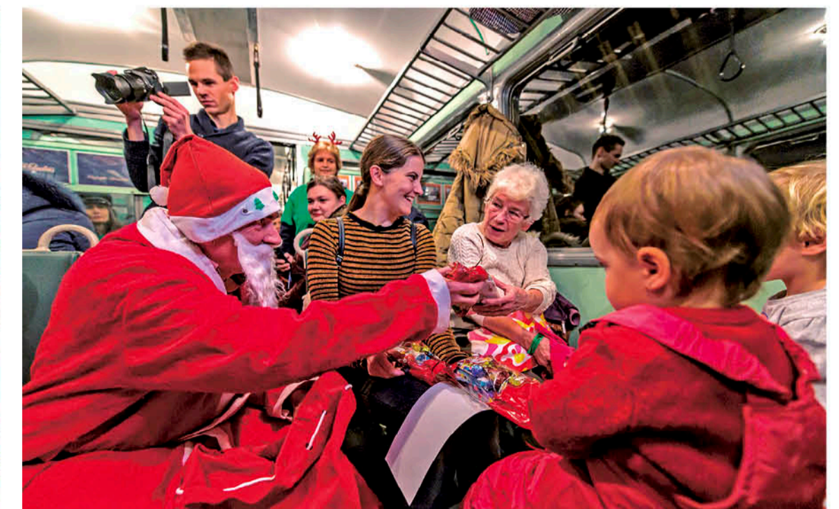
CUANDO EL CONFLICTO SE ESTANCA, algunas parejas optan por pasar las navidades por separado, cada uno con su respectiva familia.

“Es imprescindible centrarse en lo que es realmente importante, en lo que nos aporta la relación en el día a día, más que en un día especial o extraordinario, porque lo que da valor a una pareja es día a día”, concluye la psicóloga.