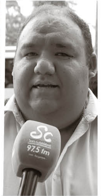
LA UDI, DECIDIÓ CONGELAR su participación en Chile Vamos agudizando aún más la crisis en La Moneda.

presencia de los pueblos originarios y la de los independientes.