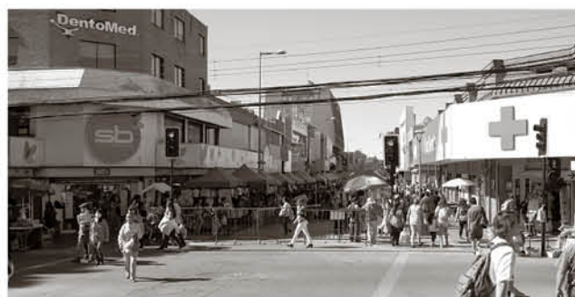
Las tres principales cadenas farmacéuticas se coludieron para fijar precios de medicamentos según este fallo de primera instancia.

Finalmente, se indica que “el Sernac solicitará al tribunal que se establezcan mecanismos automatizados utilizando los registros que tengan las empresas de las personas que compraron en el período de colusión, u otras alternativas expeditas que también permite la legislación”.