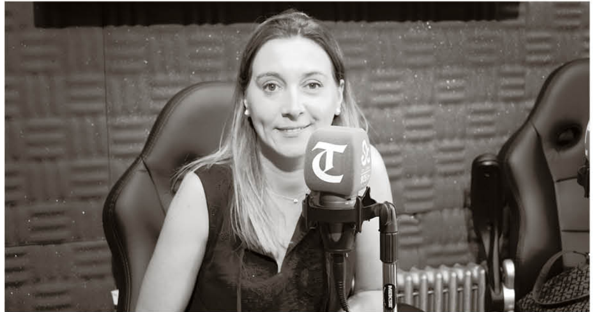
PARODI ASEGURÓ que no habrá impunidad para delincuentes y menos para los uniformados que abusaron de la fuerza

-¿Cómo se puede tomar la salida del ministro del Interior, Andrés Chadwick, del subsecre-