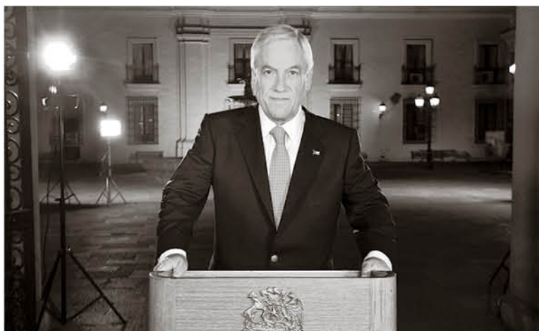
LA SEREMI DE GOBIERNO acusó manejo político de las herramientas constitucionales.

Respecto al proceso constitucional, el gobierno se abre a llamar a un plebiscito para que sean las personas las que deciden. Estamos ante una tremenda oportunidad y aquí no sólo en base a lo que estamos construyendo desde Desarrollo Social, sino también ser capaces de recoger los documentos que dejó la Presidenta Bachelet con una propuesta para una nueva Constitución. Como gobierno damos las garantías que será un proceso democrático y transparente además de que vamos a convocar con mucha fuerza la participación ciudadana.