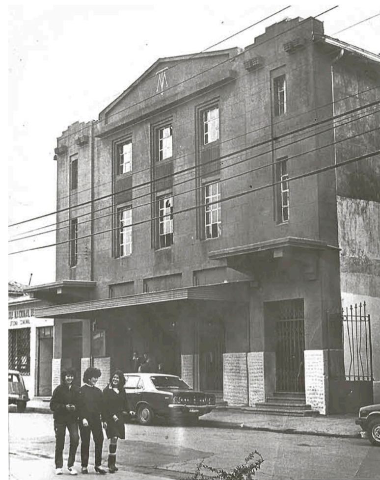
Fachada del Teatro Municipal, década del '80, ahora Casa de la Cultura.

ciones de cine. También el escenario habitual de presentaciones de compañías teatrales que recorrían el país presentando obras como "Dantón", "Carmen", "La Bota del Invasor", "Los Tres Mosqueteros" y "Los Cuatro Jinetes del Apocalipsis".