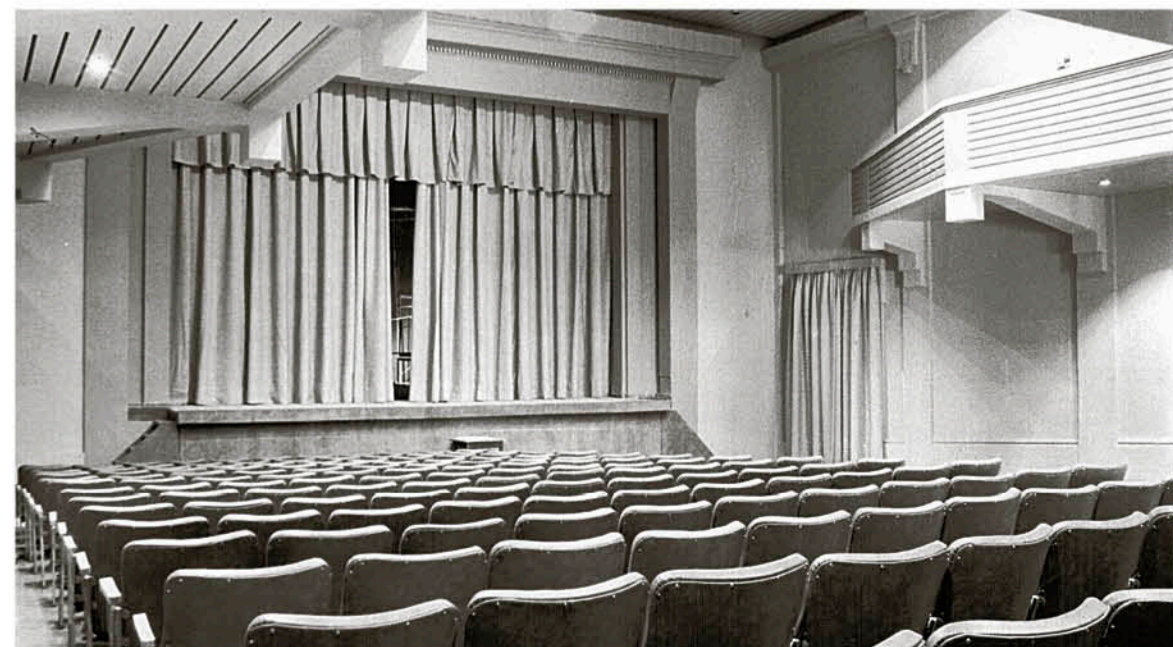
Butacas del Teatro Municipal, ahora casa de la Cultura.

Después que a fines de los 90 prácticamente desaparecieron las salas en Los Ángeles – por el cierre definitivo de los cines Imperio y Municipal –, la actividad retornó con fuerza a contar de marzo de 2003 con la apertura de un multi-cine en el mall Plaza de esta ciudad.