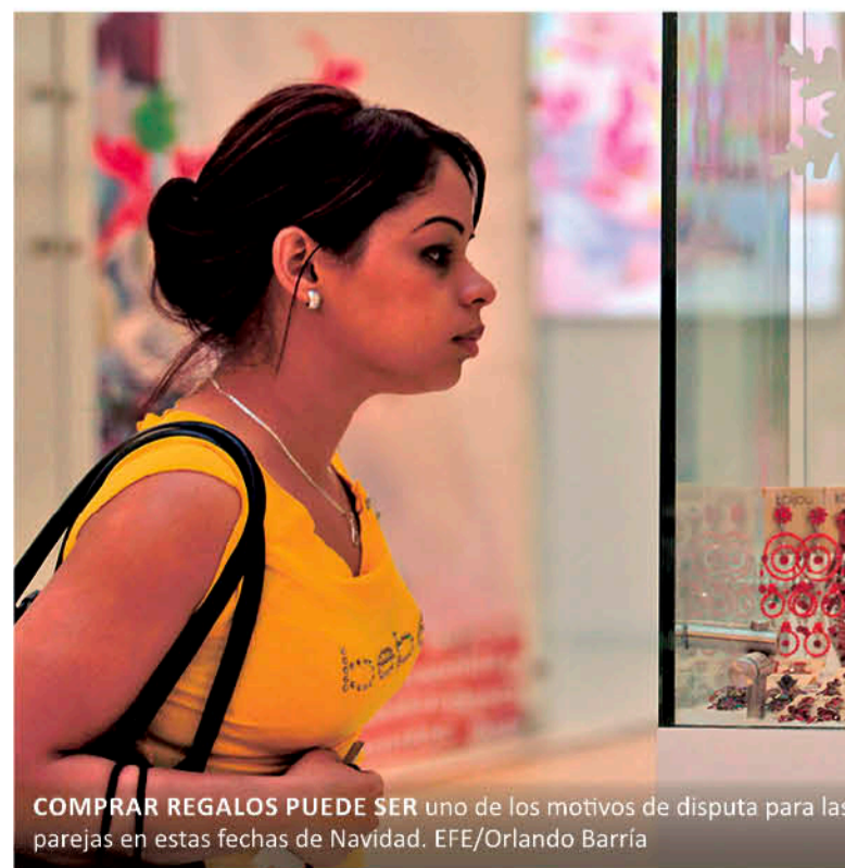
COMPRAR REGALOS PUEDE SER uno de los motivos de disputa para las parejas en estas fechas de Navidad.

También apunta que es frecuente “que ambas partes defiendan a su familia utilizando como arma arrojadiza cualquier deta-