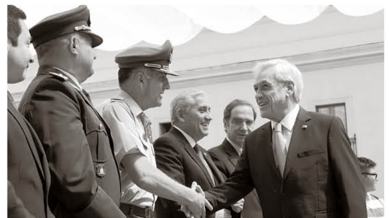
PESE A LO CUESTIONADO QUE ESTÁ el general director de Carabineros, Mario Rozas seguirá en el cargo hasta que Piñera lo diga.