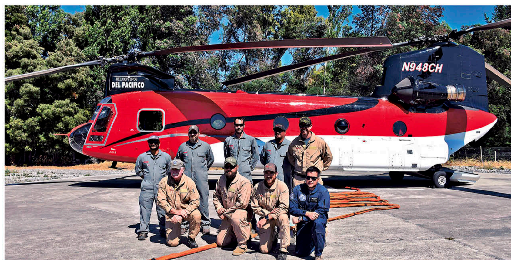
ENTRE LOS HELICÓPTEROS SE ENCUENTRAN EL CHINOK que es el helicóptero más grande que hay en servicio, un megahelicóptero de 10.000 litros de agua de lanzamiento.

Más de 1.300 brigadistas, 21 aeronaves, entre aviones y helicópteros, equipos terrestres y una central de monitoreo, minuto a minuto, son parte de los recursos dispuestos por CMPC para el combate de incendios forestales la presente temporada.