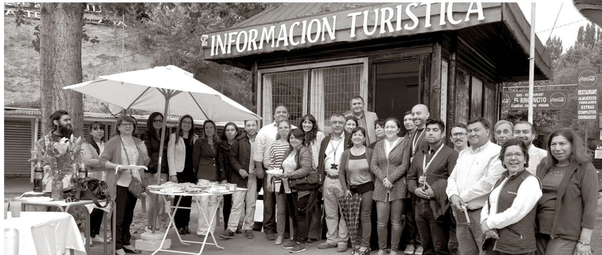
"Autoridades, dirigentes, empresarios y público durante la ceremonia de presentación de este nuevo proyecto y de las nuevas instalaciones de la oficina de turismo".

El proyecto de Fortalecimiento de las acciones, infraestructura y redes de la Cámara de Turismo consiste en entregar elementos que respondan a las necesidades referentes al gremio turístico lajino y, además, permite hacer un uso estratégico de la oficina de información turística a ubicada a pocos metros del puente del Salto, la que fue cedida en comodato por la municipalidad de Los Ángeles.