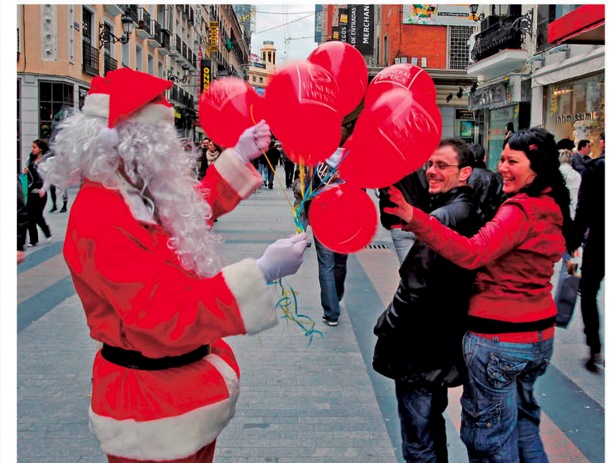
ES TRASCENDENTAL que los dos miembros de la pareja estén dispuestos a ceder para llegar a un equilibrio.

“En ocasiones, las tareas relacionadas con los preparativos de cenas y comidas con familia y amigos pueden dar lugar a disputas, si no se tienen bien definidas las tareas y tiempos para que todo salga bien”, comenta.