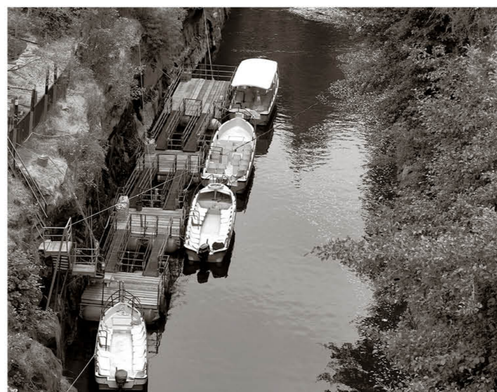
"El acceso inclusivo mediante un túnel vertical que lleva a los paseos en lancha será la gran novedad de este verano".

de acuerdo a las impresiones de los visitantes. Mejorar el funcionamiento de esta oficina tiene también directa relación con una estrategia de ordenamiento territorial que ayudaría a combatir el comercio informal y el acoso de