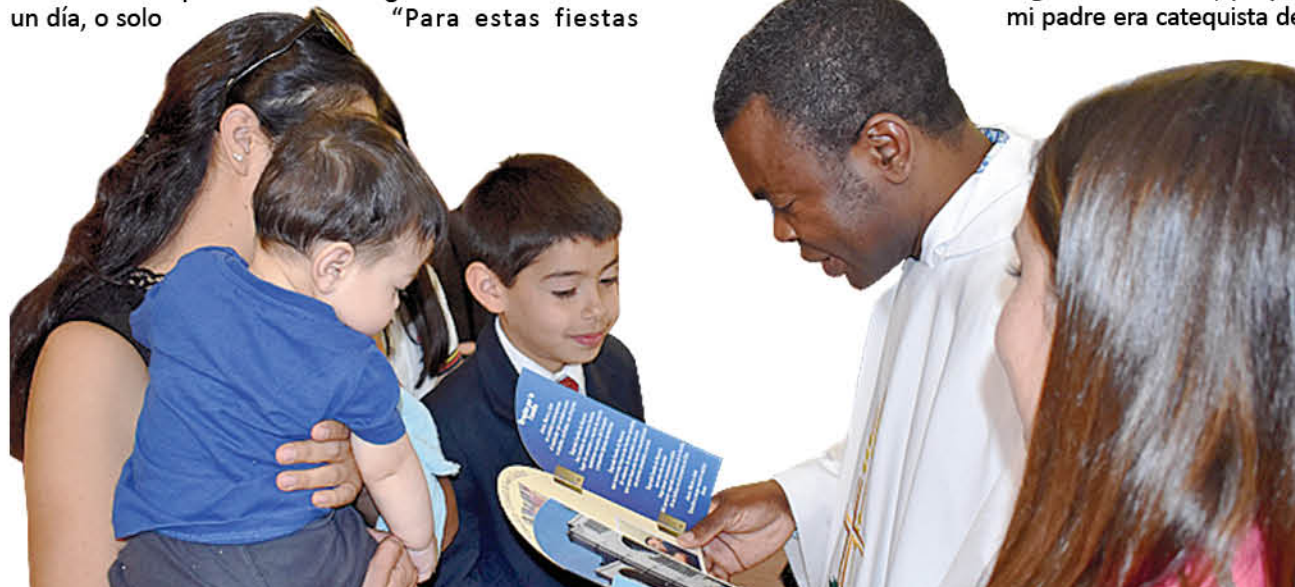
EL PADRE ha animado a los niños y niñas a conocer y seguir a Jesús dentro de las distintas actividades que ha realizado en Yumbel.

Para cerrar, consultado por sus apreciaciones sobre Chile, aseveró que le impresionó porque su llegada al país coincidió con el arribo masivo de inmigrantes a éste, entre ellos haitianos, peruanos y venezolanos, asegurando que pese a las distintas opiniones sobre el tema “para mí es un país que abre las puertas a todos, siendo un país muy acogedor, donde los que llegan encuentran oportunidades”.