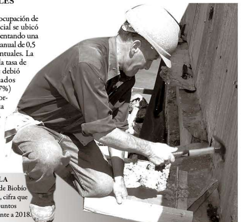
LA TASA DE LA PROVINCIA de Biobío se situó en 6,5%, cifra que disminuyó 1,6 puntos porcentuales frente a 2018.