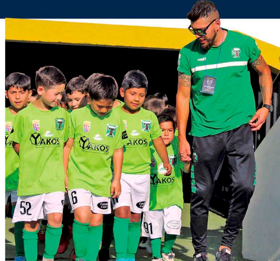
EN LA ESCUELA PODRÁN PARTICIPAR todos los niños y niñas que sientan amor por el deporte y sean responsables con los entrenamientos.

Cabe recordar que concierne al trabajo en la