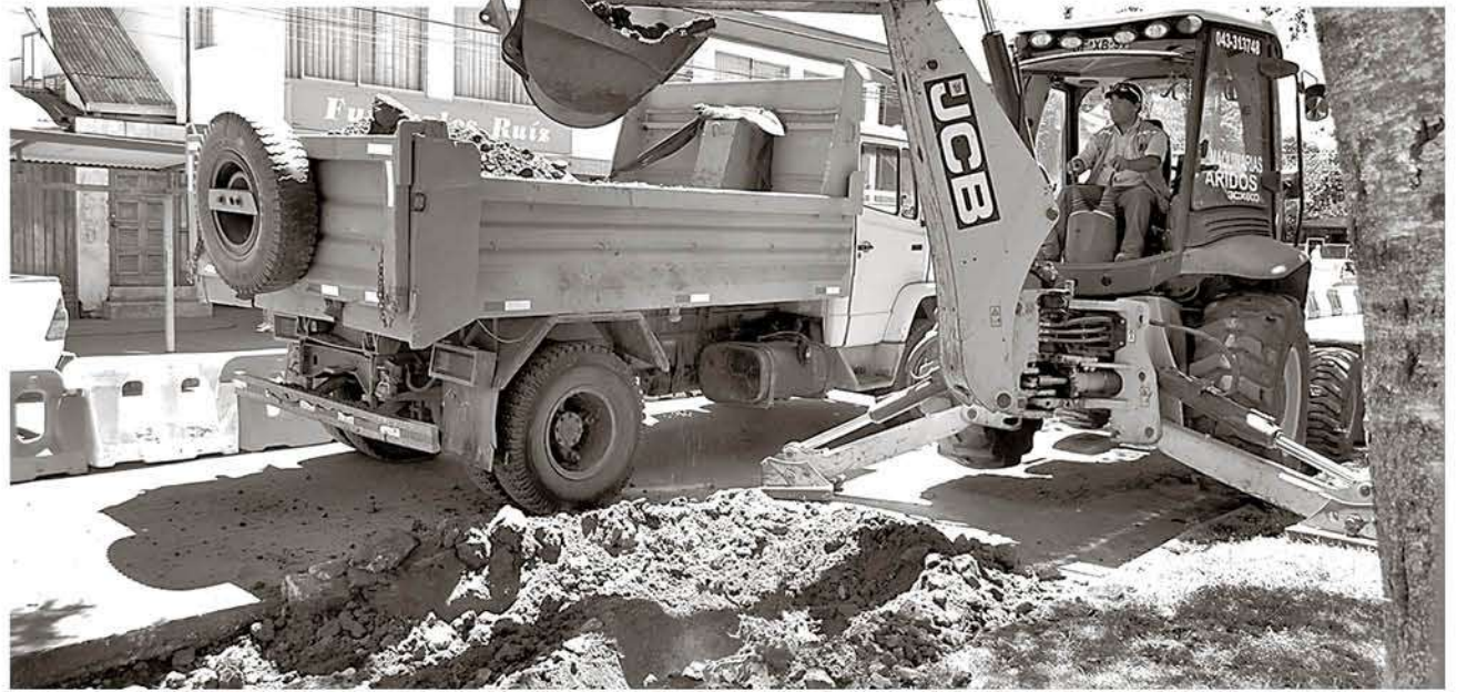
A NIVEL REGIONAL en el alza de los ocupados incidieron, principalmente, los sectores transporte (15,5%), industria manufacturera (4,5%) y administración pública (6,1%).

En el caso de las personas sin trabajo (en este caso se refiere a todas las personas en edad de trabajar, que no estaban ocupadas durante la semana de referencia, que habían llevado a cabo actividades de búsqueda de un puesto de trabajo durante las últimas cuatro semanas -incluyendo la de referencia- y que estaban disponibles para trabajar en las próximas dos semanas -posteriores a la de referencia-) se consigna que los desocupados se estimaron en 11.972 personas, lo que significa un descenso interanual del 21,3%.