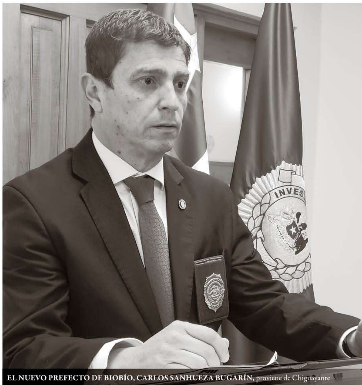
EL NUEVO PREFECTO DE BIOBÍO, CARLOS SANHUEZA BUGARÍN, proviene de Chiguayante

El nuevo mandamás de la prefectura de la Policía de Investigaciones en la provincia de Biobío está afinando los últimos detalles para radicarse en Los Ángeles y asumir este nuevo desafío el próximo 7 de Enero.