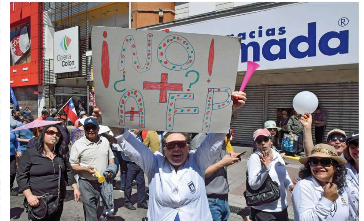
EL SISTEMA HA SIDO CUESTIONADO durante las marchas en medio del estallido social.