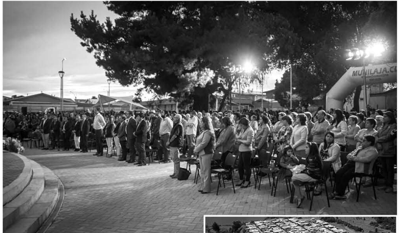
EL PARQUE FUE INAUGURADO ante mil lajinos que ahora cuentan con un centro recreativo inclusivo.

A través de un texto, la municipalidad indica que: el financiamiento para esta etapa del parque fue aprobado el 7