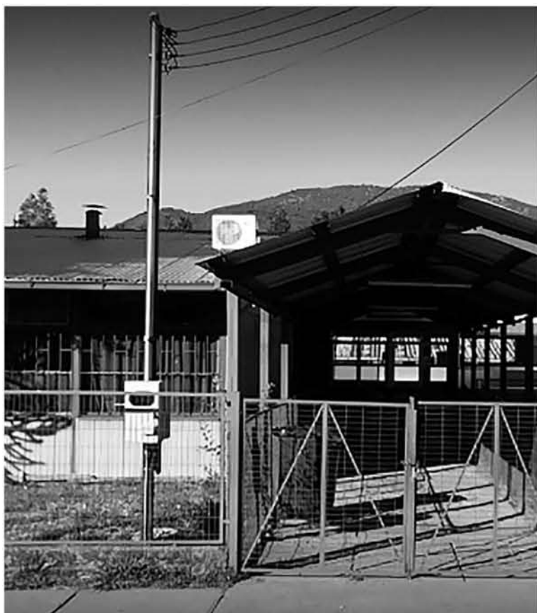
FUE LA ÚNICA EN LA REGIÓN del Biobío en solicitar cupos extra para a su comunidad y no correr el riesgo que tengan que ir a otras localidades más alejadas.

refiere al plazo para informar las estructuras de cursos y el otro que se refiere a la aprobación de las solicitudes de aumento de capacidad. En ambos casos el plazo para estos trámites vencía en la fecha de reporte de cupos (13 de julio) y ahora se faculta al subsecretario de Educación para que, en casos excepcionales, mediante resolución fundada, otorgue un nuevo plazo para informar estructuras de cursos o solicitar aumento de capacidad. Recordemos, que el reglamento del Sistema de Admisión Escolar establece una serie de restricciones respecto a la presentación y aprobación de solicitudes de aumento de su capacidad autorizada, lo que corresponde al número de alumnos nuevos en relación a la infraestructura con que cuenta el establecimiento, o la creación de nuevos cursos.