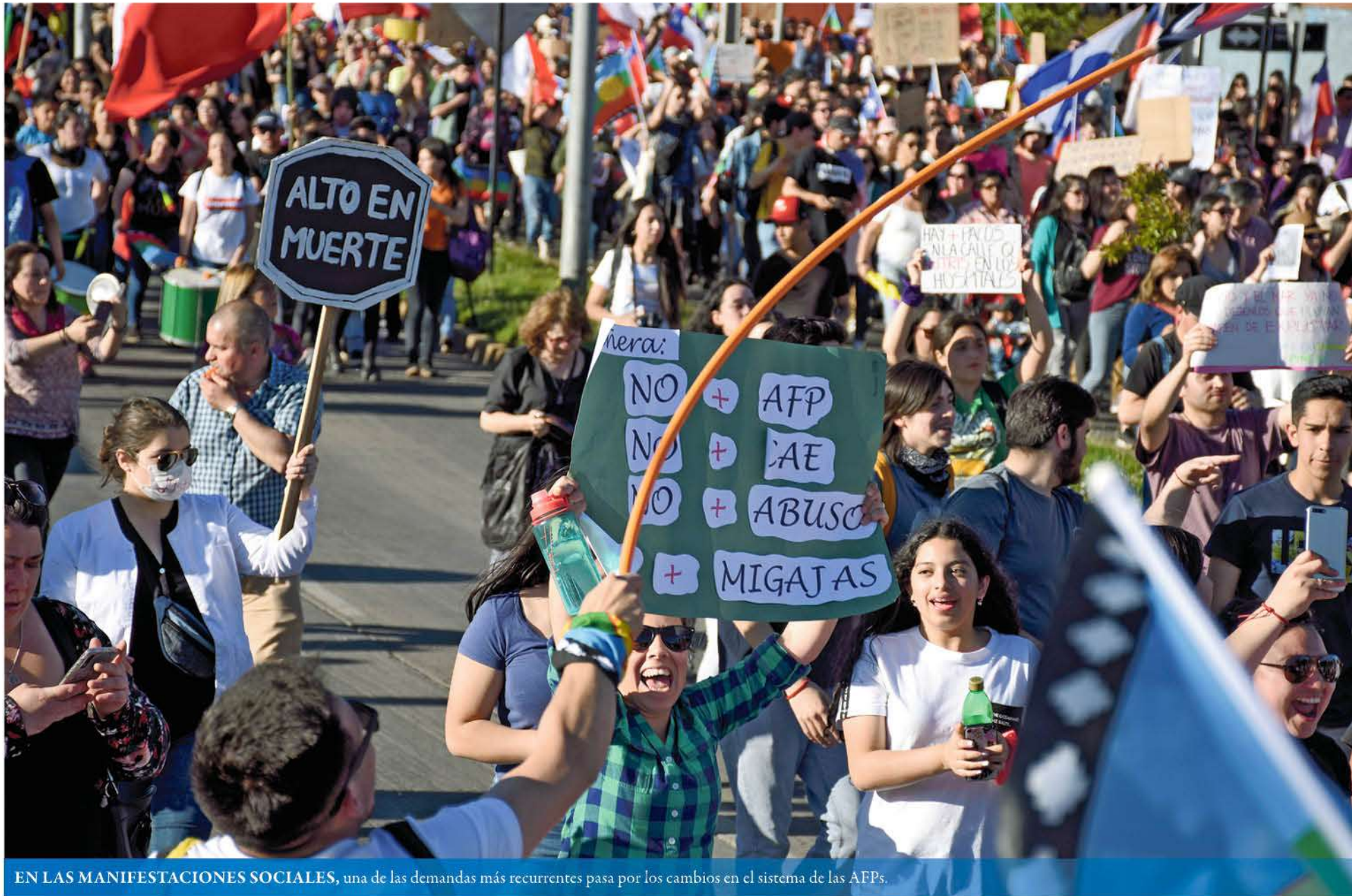
EN LAS MANIFESTACIONES SOCIALES, una de las demandas más recurrentes pasa por los cambios en el sistema de las AFPs.