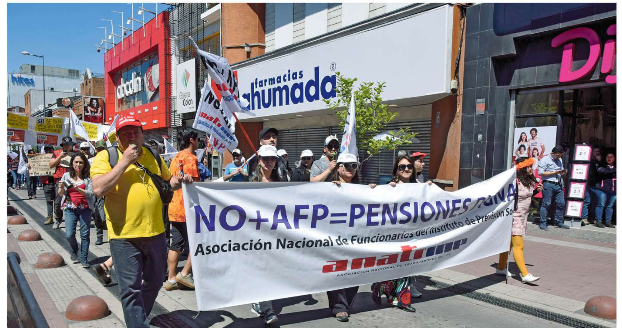
EN LOS ÁNGELES el tema ha sido considerado entre las prioridades ciudadanas.