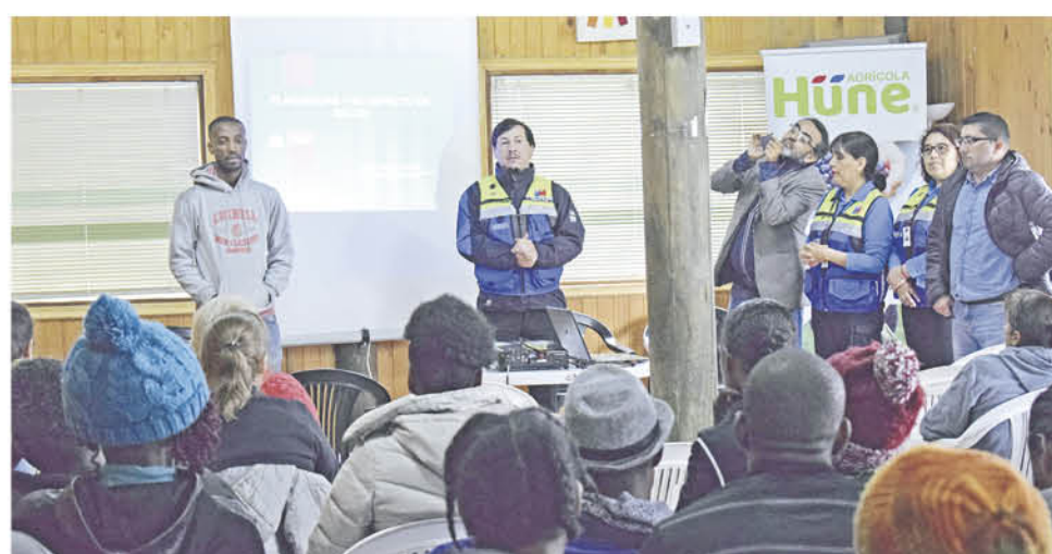
CON APOYO DE UN TRADUCTOR en creole se desarrolló la actividad en la mañana de ayer en Los Ángeles.

En materia de trastorno músculo esquelético de extremidad superior, durante 2019 las inspecciones en la región llegaron a 25, mientras los sumarios a 14; y en la provincia del Biobío las inspecciones alcanzaron las 6, todas terminadas en sumario sanitario.