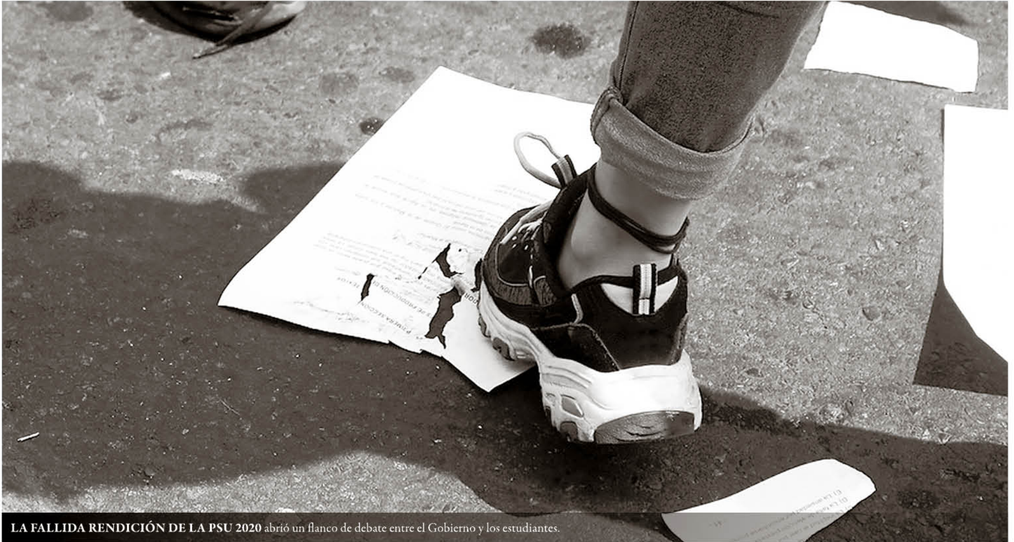
LA FALLIDA RENDICIÓN DE LA PSU 2020 abrió un flanco de debate entre el Gobierno y los estudiantes.