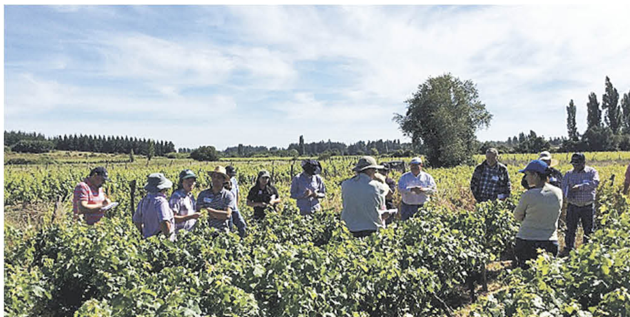
EN LA REGIÓN es la provincia de Biobío la que concentra la mayor cantidad de empresas agrícolas.

Muñoz precisó que mediante la labor del Departamento de Salud Ocupacional se orientan planes de acción hacia los trabajadores, en este caso de las empresas agrícolas relacionadas al área de packing y uso de plaguicidas, con recomendaciones que se acentúan a través de las charlas que se imparten a través del organismo regional. “En virtud de que la agricultura es el área de trabajo que más empleo genera, después de la minería y el comercio, y que nuestra región tiene diversas zonas agrícolas, es que estamos desarrollando esta campaña, que a través del fortalecimiento de un proceso formativo, de promoción de la salud, prevención y control, busca contribuir a la reduc-