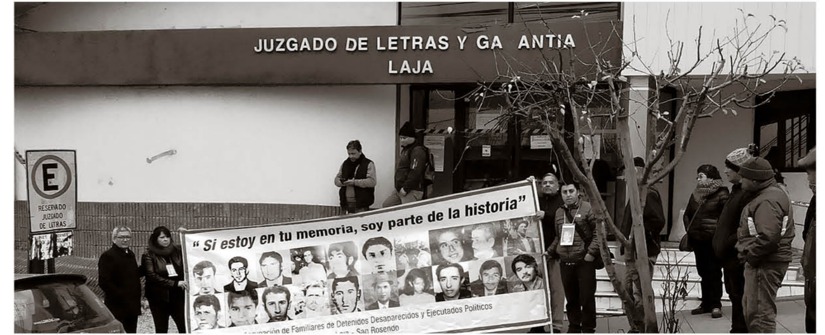
AGRUPACIÓN DE FAMILIARES de detenidos desaparecidos de Laja.