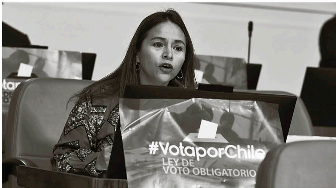
PÉREZ LAMENTÓ que se postergara la votación, la que se realizará la próxima semana.

La parlamentaria de la DC apuntó directamente al Gobierno y a la UDI, responsabilizándolos de hacer caso omiso a las demandas ciudadanas que se conocen tras el estallido social del 18 de octubre.