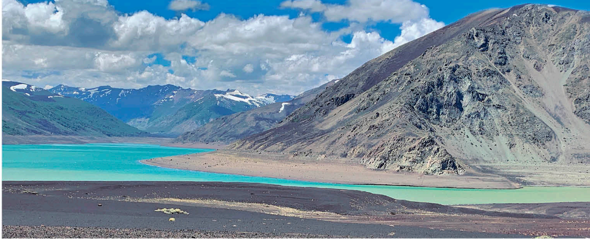
SEGÚN EL SENADOR VARELA, la propiedad del lago Laja, en su mayoría es del Estado.