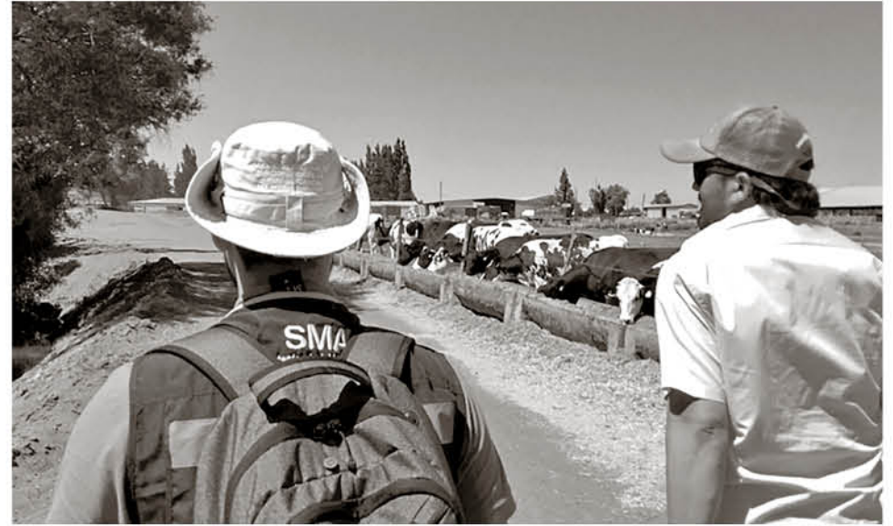
LAS DENUNCIAS CIUDADANAS se constataron en terreno por parte de fiscalizadores de la Superintendencia del Medioambiente.