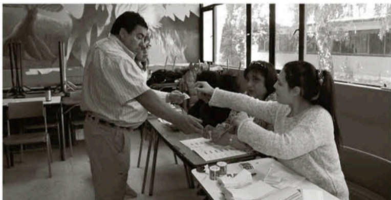
VOLVER AL VOTO OBLIGATORIO, a juicio de la parlamentaria, daría legitimidad a los procesos políticos.