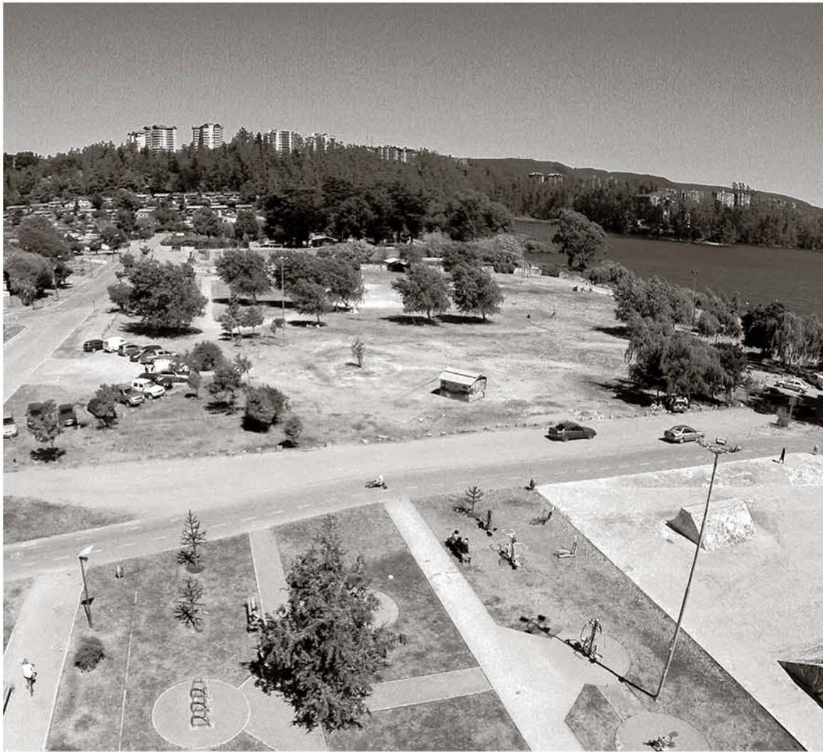
EL SÁBADO 25 DE ENERO se realizará el Campeonato Nacional verano de Cross Country – San Pedro de La Paz 2020.

Las filas del corazón provincial buscarán arribar hasta la capital penquista, que será sede tanto de la prueba regional junto a la máxima nacional en la especialidad pedestre.