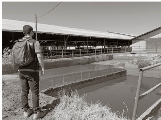
SE ANTICIPÓ UNA NUEVA inspección por parte de los funcionarios de la Superintendencia.