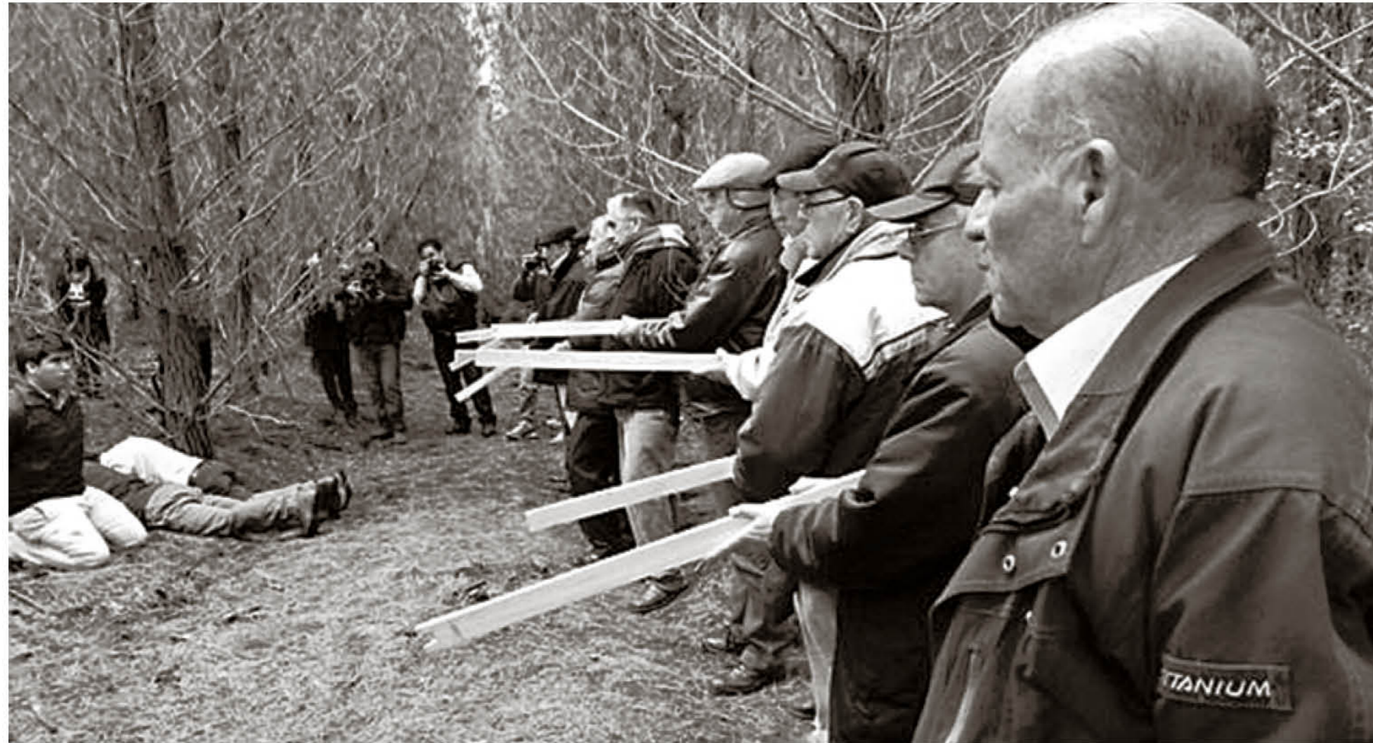
RECONSTITUCIÓN DE ESCENA con algunos de los carabineros que participaron en la masacre.

A POCO DE CUMPLIRSE MEDIO SIGLO DEL CRIMEN