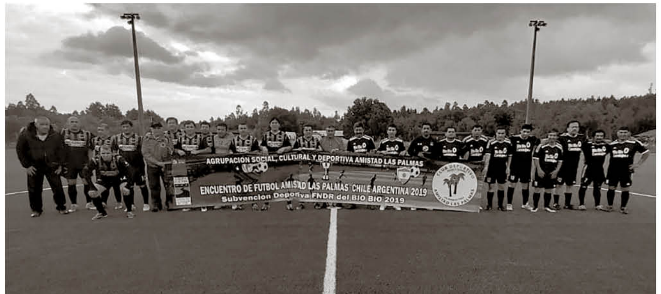
LA INSTANCIA SE PUEDE llevar a cabo, gracias a las gestiones del club angelino junto al apoyo de distintos actores.

se jugará el evento futbolístico válido por su versión número 28 en instalaciones del Complejo Deportivo de Reinaldo