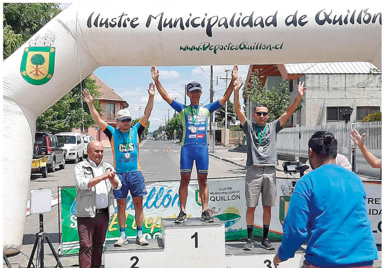
PESE A QUE LAS FILAS del combinado ciclista angelino se reducen, siempre hay debutantes que pueden aprender de los vigentes maestros constructores.

Evidenciando que el deportista jamás descansa, el pedaletero de Team el Constructor comentó que entrenarán enérgicamente durante la temporada estival con el fin de mejorar su rendimiento a través de trote y pesas para fortalecer la musculatura de cara al semestre