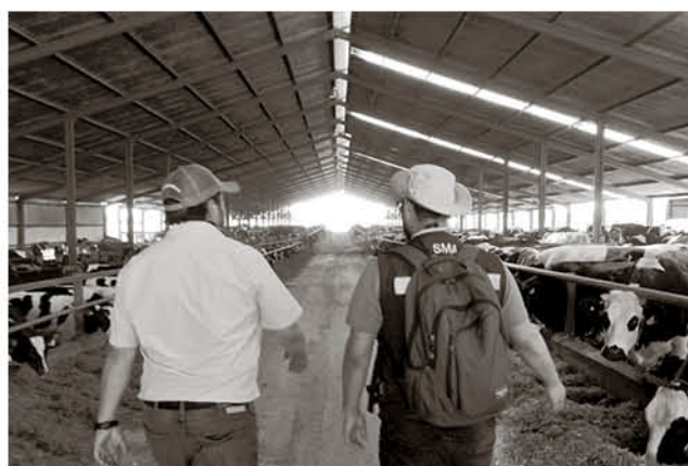
ASÍ COMO EN LOS ÁNGELES, existen otras investigaciones en curso luego de las denuncias presentadas en contra de distintas empresas de la provincia.