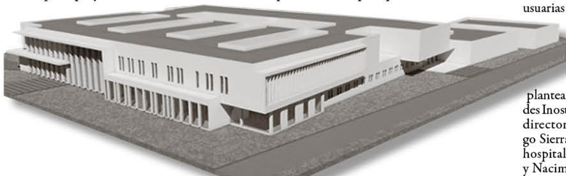
LA MAQUETA VIRTUAL evidenciando cómo se vería el hospital de Nacimiento una vez construido.

Finalmente, el titular del SS.BB. descartó cualquier clase de rumor en torno a que el proyecto hubiera estado en duda en algún momento luego de ocurrido el estallido social a nivel nacional. “Estos proyectos son de inversión, están dentro del Plan Nacional de Inversiones en Salud, y también forman parte del programa de inversiones del Presidente Sebastián Piñera, y están hoy día completamente asegurados, dentro de los plazos, en los trámites finales para iniciar la licitación”.