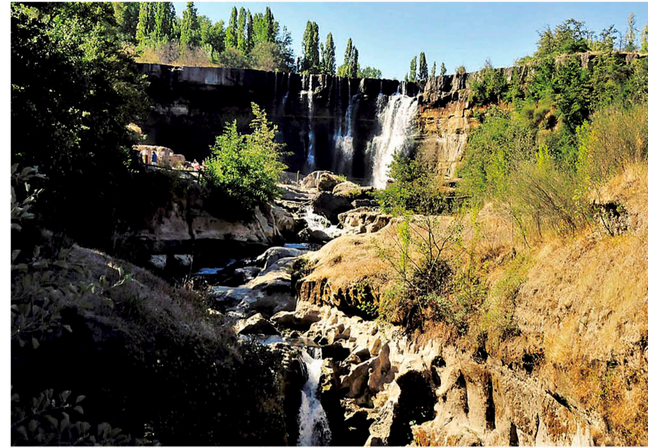
LOS PROBLEMAS DE ESCASEZ son tan evidentes que se pueden observar en una de las bellezas naturales de nuestra provincia.

El discurso de los 24 senadores que votaron a favor de que el agua sea un bien natural de uso público se