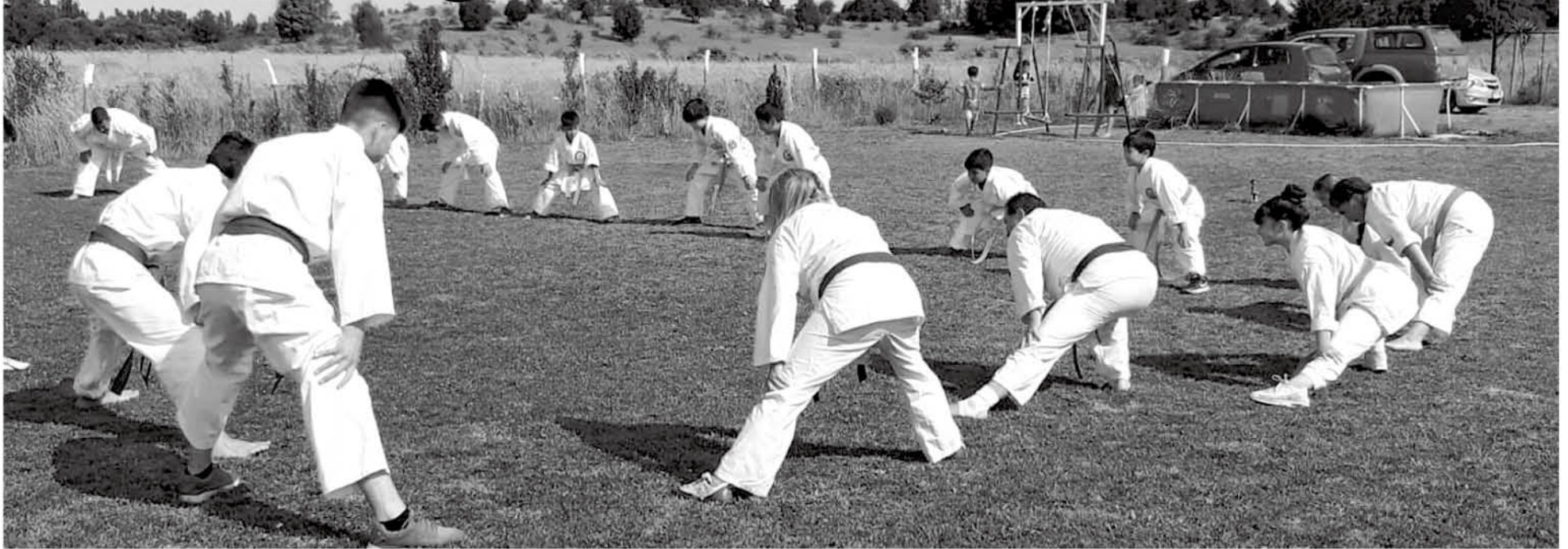
LOS GLADIADORES DE AMB preparan su participación en la Liga Nacional (WKF) durante abril, donde se espera que una de las fechas tenga lugar en Los Ángeles.

Karatecas y practicantes de kickboxing pertenecientes a la asociación, dejaron por una jornada el dojo para realizar un entrenamiento especial de cara al semestre competitivo 2020.