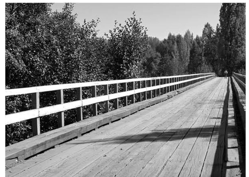
LOS PUENTES DE MADERA serán reemplazados por viaductos de hormigón (foto de referencia).