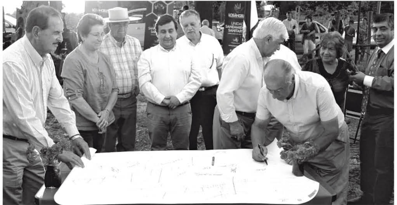
LOS PLANOS DEL PROYECTO, así como dibujos de los niños del sector, fueron depositados en la cápsula de los sueños.

La esperanza de los habitantes de Santa Laura, Tucumán, Santa Matilde, San Gerardo, Santa Clara, Villa Paulonio y Las Lozas, pasa principalmente por contar con un abastecimiento estable de agua que no dependa