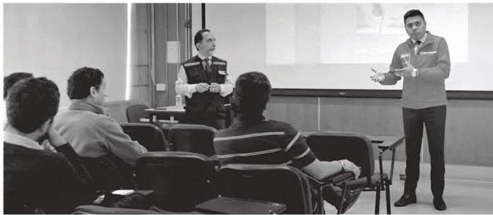
LA IDEA ES BAJAR aún más las estadísticas que ya vienen disminuyendo desde 2018.

Durante el 2018, en la región del Biobío se registraron 13 accidentes relacionados con la industria del gas y tres personas fallecidas; este número descendió considerablemente el 2019 con solo seis accidentes y se espera que siga bajando este 2020.