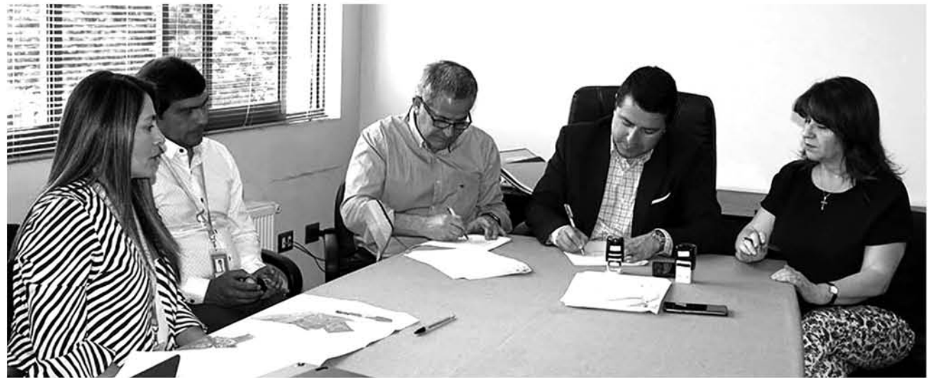
POR TRES AÑOS se extenderán los estudios para elaborar un nuevo plan regulador de Cabrero.

De hecho, se estima que la comuna podría contar incluso con un aeropuerto de carga de exportaciones,