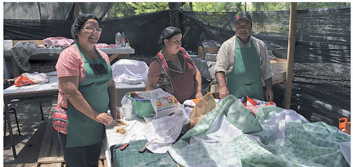
LOS PRODUCTORES LOCALES valoran el evento como una forma de promocionar sus productos.