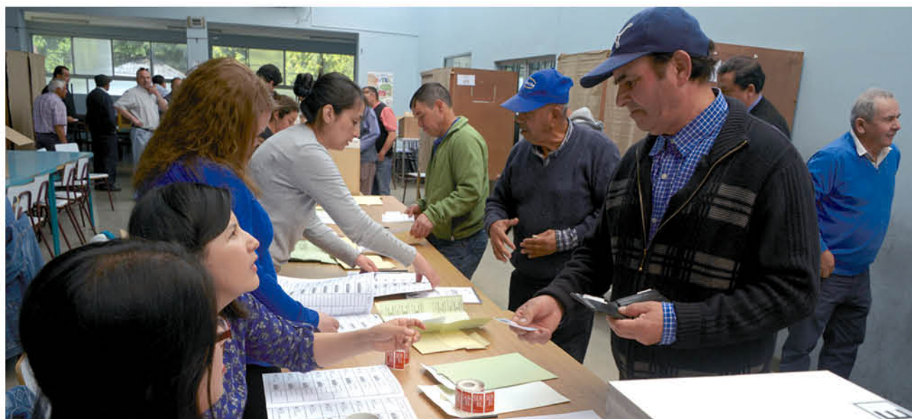
LAS ELECCIONES DE GOBERNADOR son el 25 de octubre y compartirán papeleta con alcaldes y concejales.

En cuanto a la figura del actual intendente del Biobío, debe ser descartada para las elecciones del 25 de octubre, pues pese a que era la carta de la presidenta de la UDI, Jacqueline van Rysselberghe,