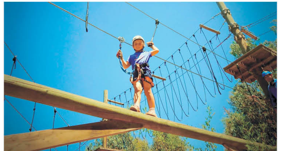
LAS ACTIVIDADES QUE PUEDEN ofrecer los emprendedores podrían tomar como referencia los circuitos del Parque Aventura en Santiago.

El lugar se encuentra ubicado en uno de los cerros más transitados de Santiago, el San Cristóbal, donde cabe destacar que las normas de seguridad, junto a la organización –para dar una idea a quienes deseen arribar con