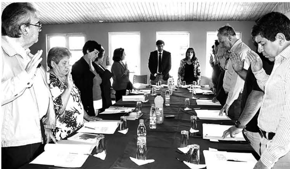
EL COSOC ESTÁ CONFORMADO por 12 ciudadanos que juraron trabajar por la comunidad.

El Cosoc es de carácter consultivo y puede incidir en el diseño, ejecución y evaluación de las políticas públicas comunales, sectoriales y municipales. El actual Cosoc funcionará desde 2020 hasta 2024.