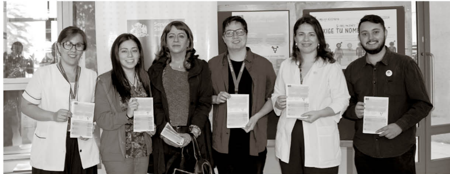
A PARTIR DEL DÍA viernes se implementó oficialmente el protocolo de atención para que las personas trans puedan ingresar al sistema de salud provincial con su nombre social.

Si bien existían documentos emanados desde el Ministerio de Salud (Minsal) desde hace años, por ejemplo dos circulares, una del año 2007, y otra más específica con fecha de junio del año 2012, en las que se indica que todas las personas trans debían ser tratadas en los servicios de salud utilizando el nombre social, es decir, aquel que tiene relación con la identidad de género de cada persona y no el nombre del carné de identidad, fue a partir del viernes recién pasado cuando comenzó oficialmente la puesta en marcha de los protocolos en la provincia de Biobío.