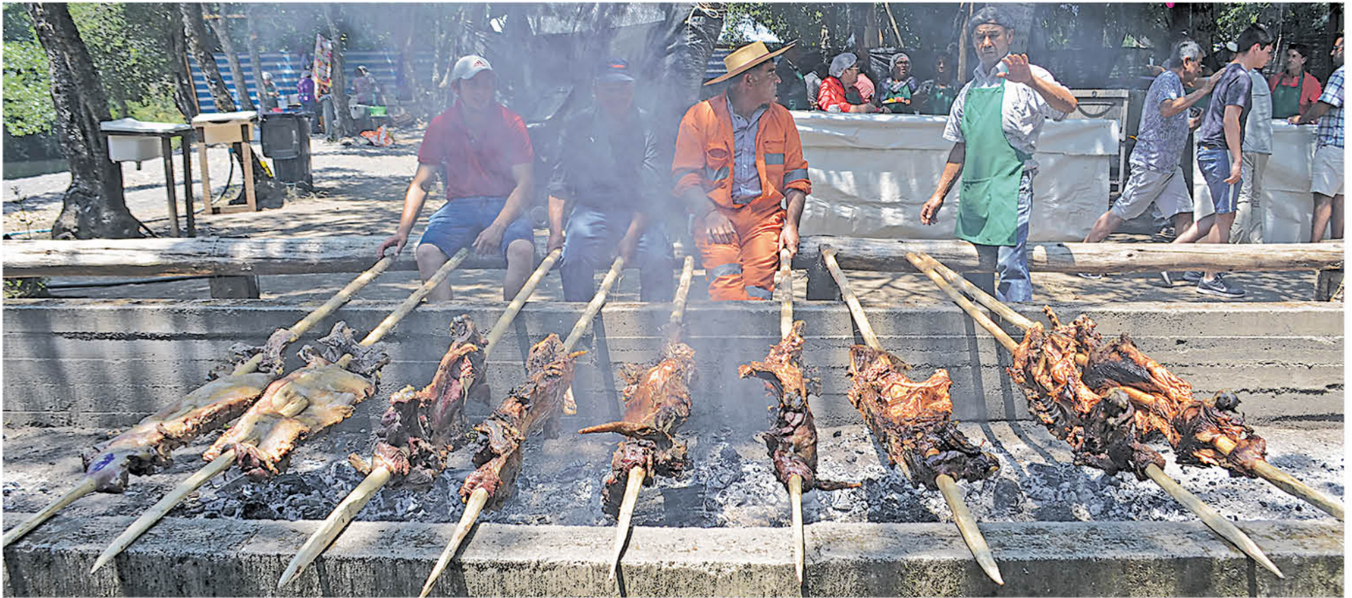
LA NOVENA VERSIÓN de la Fiesta del Cordero es una marca registrada de los productores locales de la comuna de Tucapel.

Una vez más, los productores y agricultores de la comuna de Tucapel organizaron una nueva Fiesta del Cordero.