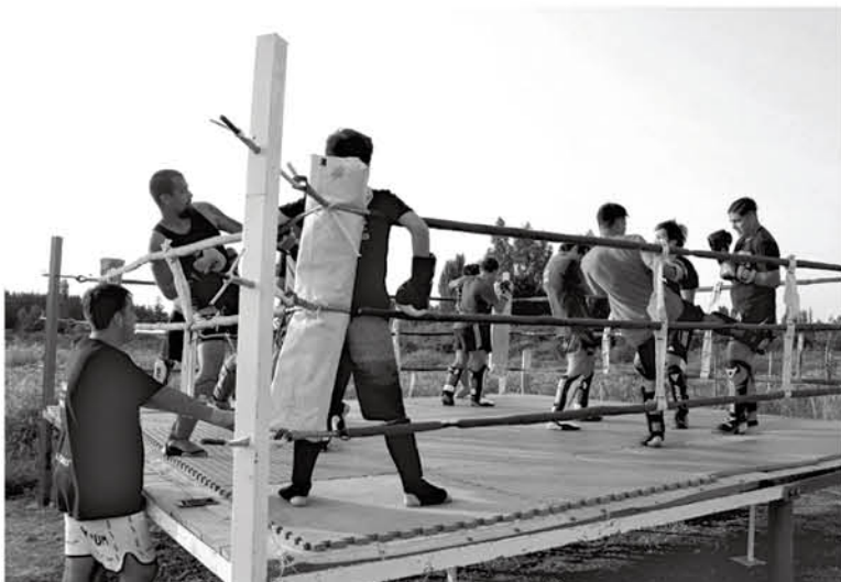
EL ENTRENAMIENTO de karate estuvo enfocado en distintas técnicas para mejorar la habilidad, gracias a la zona con césped del sector.

Una de ellas podría realizarse el 28 de enero en las mismas instalaciones que recibieron a casi medio centenar de alumnos de la academia para disfrutar el entrenamiento, donde cayó un gustoso sol hasta el ocaso junto a una brisa fresca para toda la familia marcial.