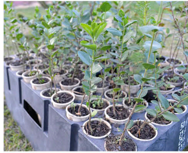
LOS TUBETES para las plantaciones forestales son algunas de las aplicaciones con que el bioplástico compostable puede colaborar con la industria.