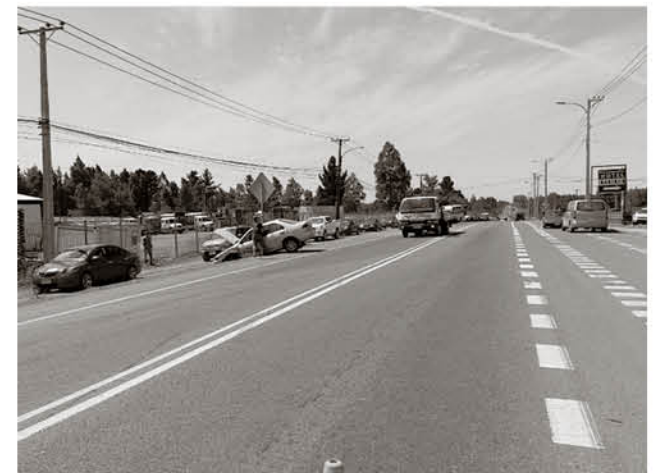
UN ASPECTO GENERAL del lugar que fue escenario del accidente de tránsito. En ese mismo punto ocurrió un accidente hace más de 20 años que causó una decena de víctimas fatales.