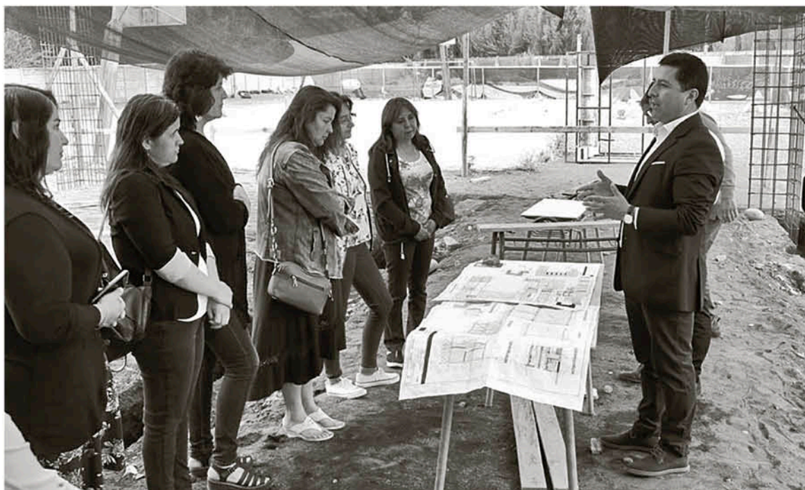
LOS PADRES Y APODERADOS DE LA ESCUELA visitaron e inspeccionaron los trabajos que se realizan para recibir el año escolar 2020.

“Como apoderada y madre estoy orgullosa y feliz de tener un liceo en una parte rural. Eso habla muy bien del colegio, acá tenemos excelencia académica. Esperamos tenerla en el liceo. Sentimos que tenemos un buen equipo de profesores, el director también. Hay mucho apoyo. Es gratificante y estamos felices de que la escuela ya tiene un liceo por abrir”, expresó.