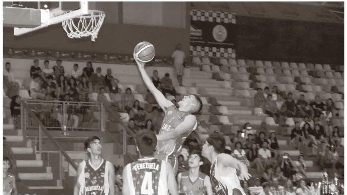
CON UN MARCO DE ASISTENTES que superó las 600 personas, se vivió la final del primer Campeonato Sudamericano realizado en la historia de la provincia de Biobío.

De esta forma, con un parcial final que rondó los 10 tan-