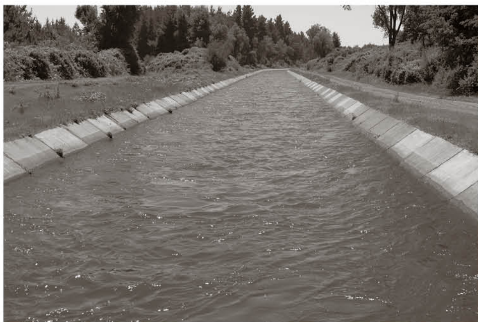
MÁS DE 120 MIL HECTÁREAS se riegan con las aguas del sistema Laja.