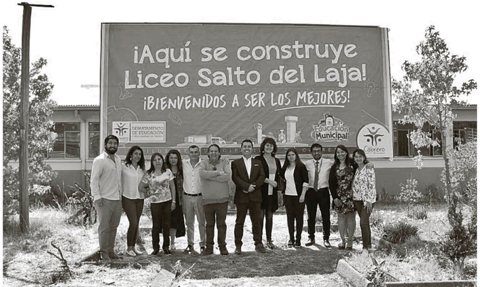
DESDE MARZO, la Escuela Saltos del Laja comenzará a recibir a alumnos a primero medio.

La dirección espera extender a ese nivel la excelencia académica que ya posee como escuela básica.