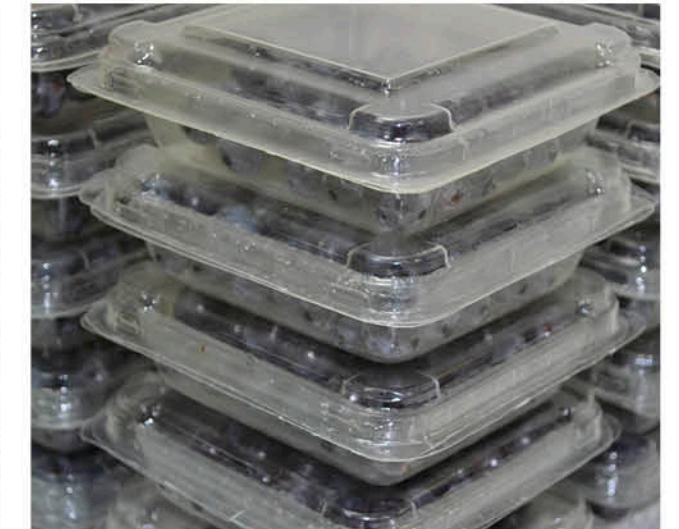
LOS ENVASES COMPOSTABLES se plantean como una alternativa que agrega valor a los productos.

tics PET, el material con que se fabrican las botellas desechables. Estos procesos tienen limitaciones debido a que el plástico debe estar limpio y ser de un solo tipo para que el material mantenga sus buenas características de calidad. Por lo anterior, el reciclaje mecánico solo alcanza a un 8% del total de los residuos plásticos del país.