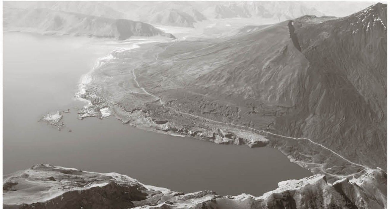
EL SISTEMA LAJA NACE con el lago situado en las faldas del volcán Antuco, alimentando al río del cual se surten.