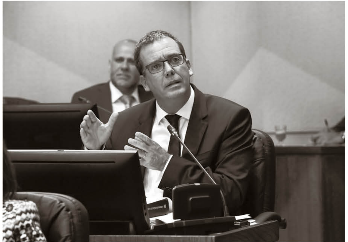
SENADOR FELIPE HARBOE.

Pongo ejemplos. Si en la comuna de Los Ángeles el alcalde autoriza un evento y cruzan objetos en la