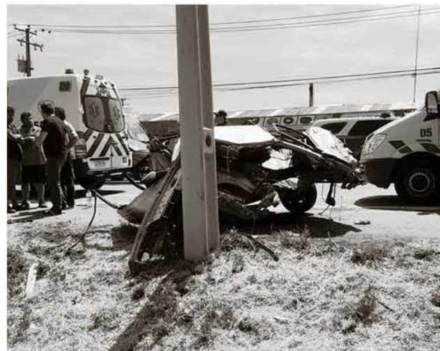
OTRA GRÁFICA DEL DAÑO con que quedaron los móviles participantes en la triple colisión.