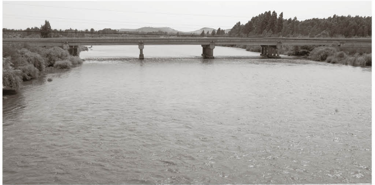
LAS AGUAS DEL RÍO BIOBÍO se volverán a usar para alimentar una central hidroeléctrica, esta vez en las cercanías de la localidad de San Carlos de Purén. La imagen muestra el antiguo puente sobre ese curso fluvial, que data de 1940.