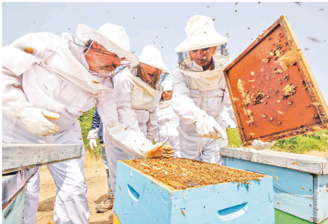
EL PROYECTO “APICULTURA COMUNITARIA” consiste en la reforestación mediante la utilización de especies nativas.

La profesional de la seremi de Agricultura de la región