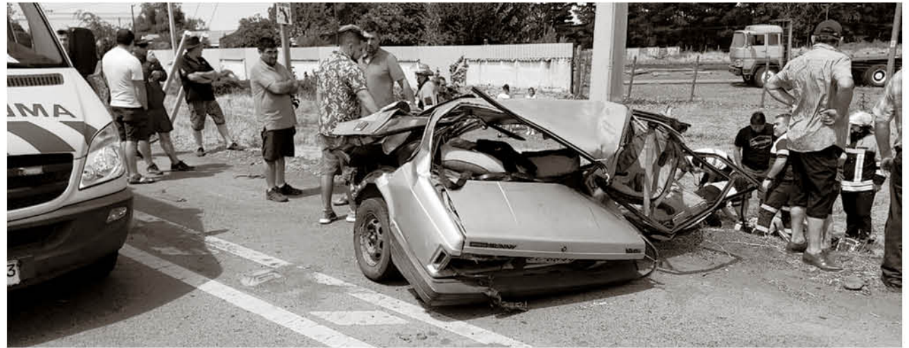
LA IMAGEN MUESTRA LA VIOLENCIA DEL IMPACTO que involucró a tres automóviles. Al fondo, personal de SAMU presta auxilio a uno de los heridos.

Sin embargo, a diferencia de lo que sucede en la actualidad, ese tramo correspondía a la ruta 5 Sur, que era una carretera con dos pistas, sin separaciones ni nada parecido. Ahora es una avenida cuyo límite de velocidad es de 80 kilómetros por hora.