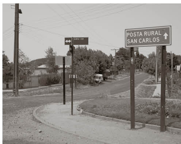
LOS VECINOS DE SAN CARLOS están expectantes por el inicio de obras de la Central Frontera.