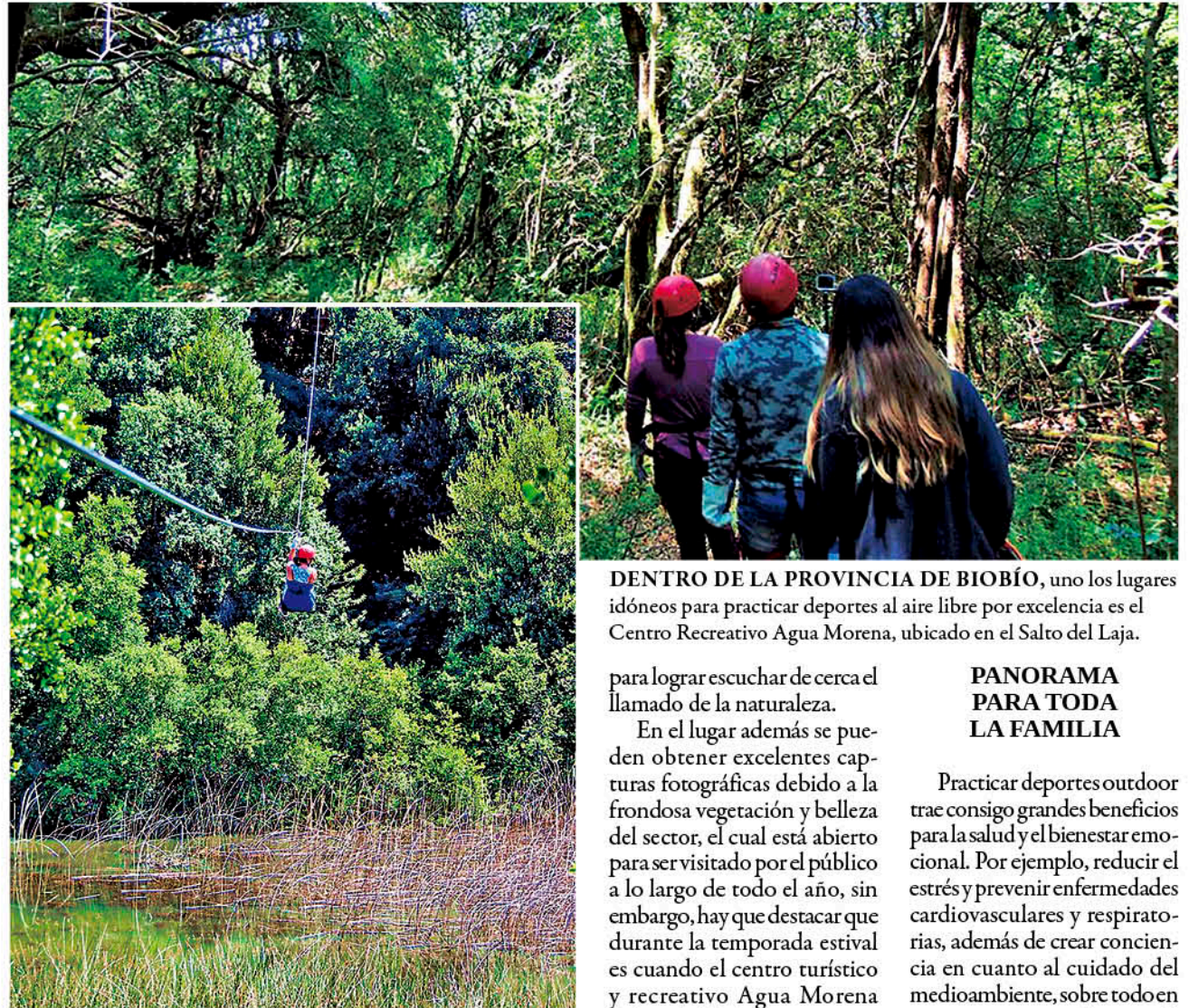
DENTRO DE LA PROVINCIA DE BIOBÍO, uno de los lugares idóneos para practicar deportes al aire libre por excelencia es el Centro Recreativo Agua Morena, ubicado en el Salto del Laja.