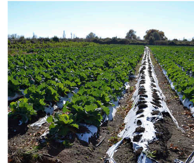
EL MULCH COMPOSTABLE reduce la basura agrícola y las emisiones al degradarse en 180 días.