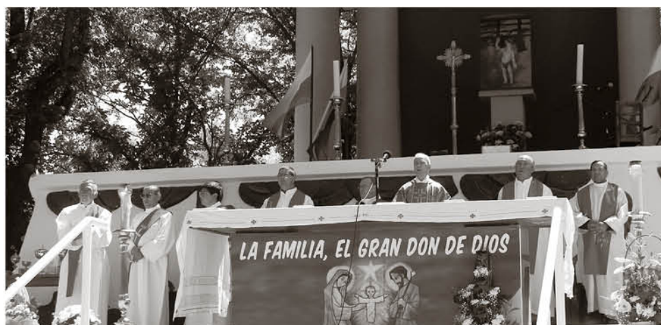
PARA ESTE 20 DE ENERO se espera la mayor concentración de fieles en la peregrinación de San Sebastián de Yumbel.

Este lunes se vive en la comuna santuario la tradicional festividad de San Sebastián.