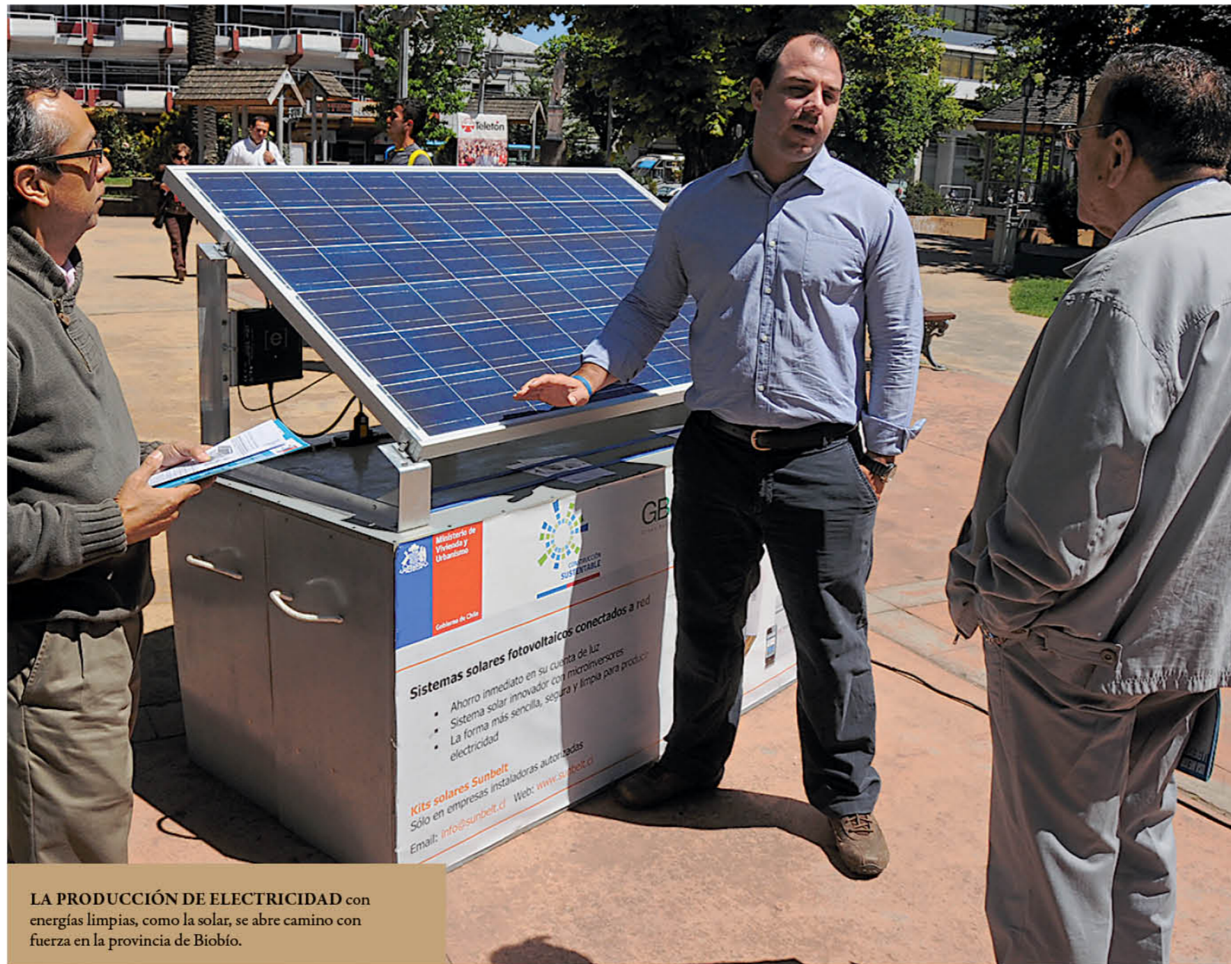
LA PRODUCCIÓN DE ELECTRICIDAD con energías limpias, como la solar, se abre camino con fuerza en la provincia de Biobío.

Aunque ya hay cinco parques solares con calificación ambiental favorable por parte del organismo competente, la mayoría se ingresó a tramita-