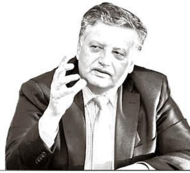
Esteban Krause Salazar Alcalde de Los Ángeles

En Educación y Salud, también hemos desplegado todas nuestras capacidades para extender y asegurar estos importantes derechos a los vecinos rurales. Veintitrés de las 46 escuelas se encuentran situadas en el