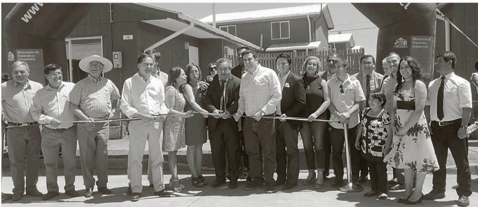
EL PROYECTO INAUGURADO EN SANTA BÁRBARA contempla viviendas para personas en situación de discapacidad.

En ambas comunas se invirtió de forma paralela en términos de equipamiento, específicamente en luminarias, áreas verdes, sede social, espacios comunes, juegos modulares, máquinas de ejercicio y una zona especial destinada a contenedores de reciclaje, lo que sumado a las casas, alcanza una inversión total de 6 mil 800 millones de pesos por parte del Ministerio de Vivienda y Urbanismo.