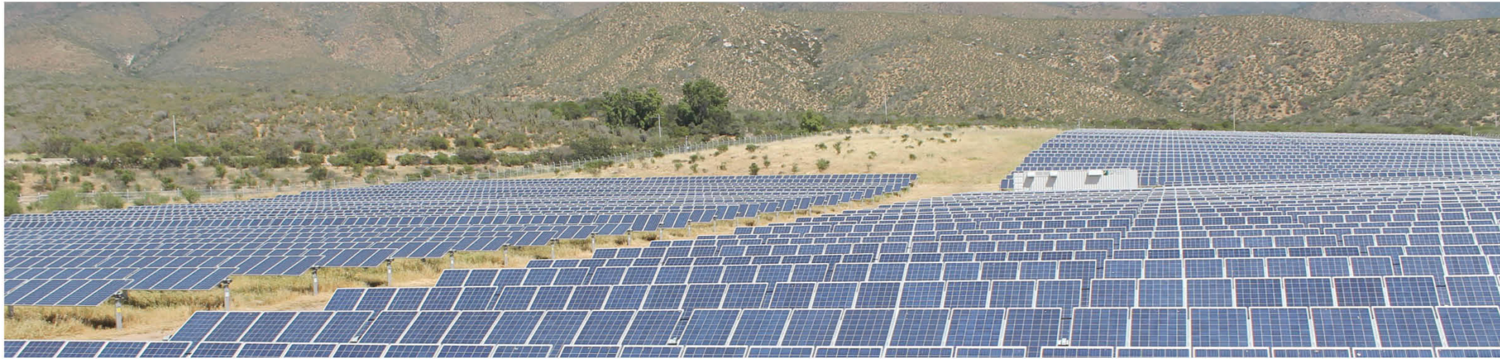
LA TOTALIDAD DE LAS INICIATIVAS DE LA REGIÓN SE CONCENTRAN EN LA PROVINCIA