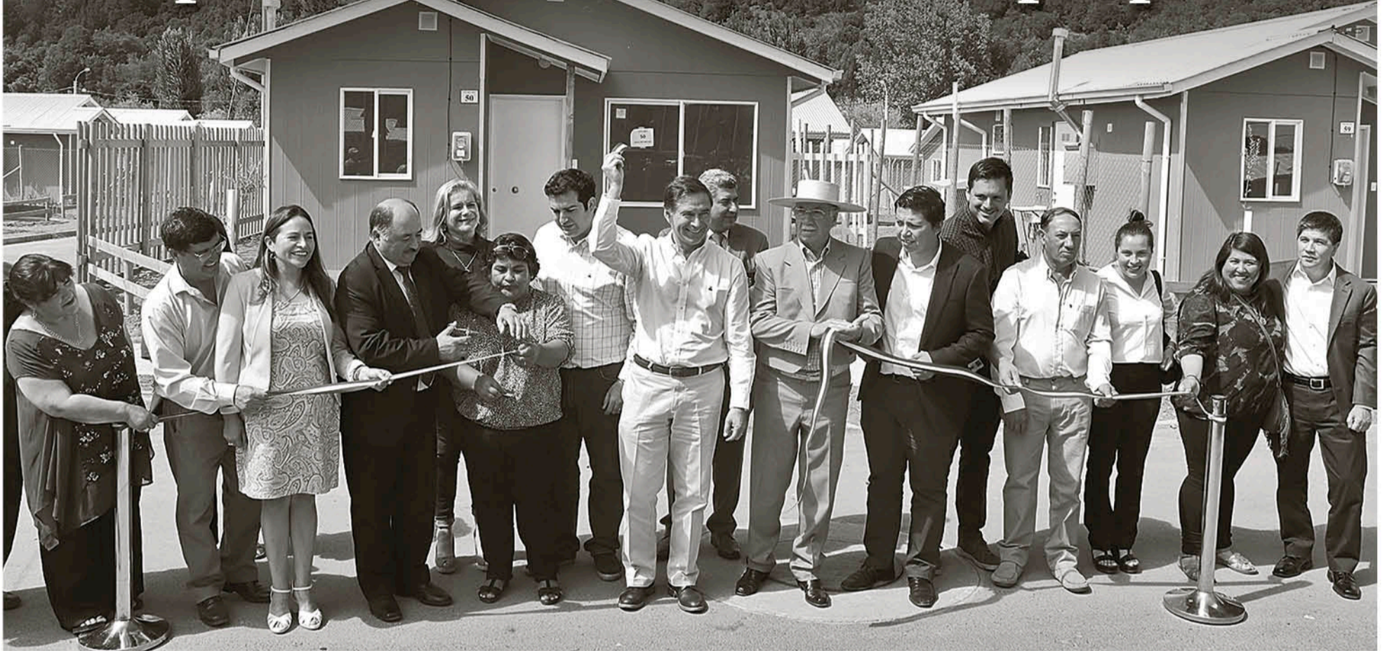
TRES MIL MILLONES DE PESOS invirtió el Minvu en este nuevo conjunto habitacional.

La inversión por parte del Minvu supera los 6 mil 800 millones de pesos y beneficia a más de mil personas.