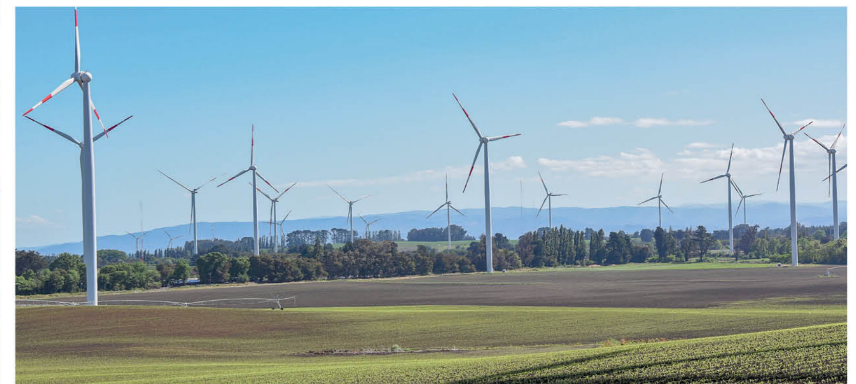
EN LA ZONA HAY UNA VEINTENA de proyectos eólicos en operación, en construcción o en tramitación ambiental.

Por lo mismo, sostuvo que es fundamental la implementación de planes gubernamentales para entregar mayores subsidios a las familias, especialmente las beneficiarias de viviendas sociales, para la instalación de dichos termos solares en sus hogares. “Así estaríamos dando un paso importante en la masificación de este tipo de nuevas tecnologías que no contaminan y resuelven problemas de las personas”, acotó.