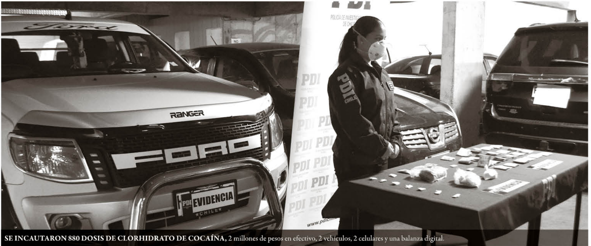
SE INCAUTARON 880 DOSIS DE CLORHIDRATO DE COCAÍNA, 2 millones de pesos en efectivo, 2 vehículos, 2 celulares y una balanza digital.