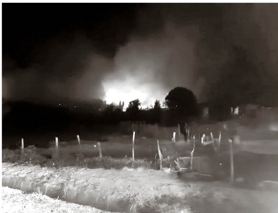
LA COMUNIDAD SE MANTUVO ALERTA la madrugada del sábado por temor a que el fuego alcanzara sus viviendas.

En la emergencia trabajaron cinco brigadas de Conaf y un helicóptero, además de recursos de Mininco y Arauco.