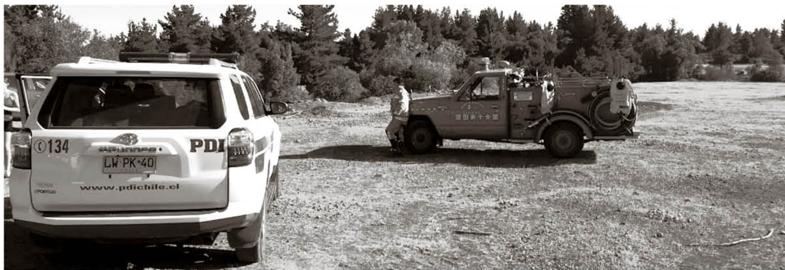
BOMBEROS, CARABINEROS, SAMU y la PDI trabajaron en el lugar de la emergencia.

El hecho se registró la tarde del sábado en La Aguada, específicamente en el sector Tricahuerras de la comuna santuario, cuando una mujer de 32 años, proveniente de la región Metropolitana, quedó atrapada en unos roqueríos y no pudo volver a salir por sus propios medios.