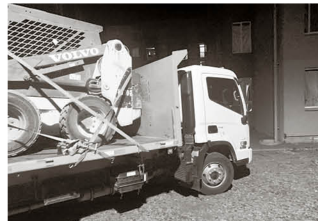
AÚN RESTA POR RECUPERAR una camioneta, que también fue sustraída como parte del botín.

Fue así como personal de la segunda comisaría de Concepción logró dar con el camión y el minicargador en esa zona de la región, gracias a los datos aportados por la SIP de la tercera comisaría de Nacimiento.