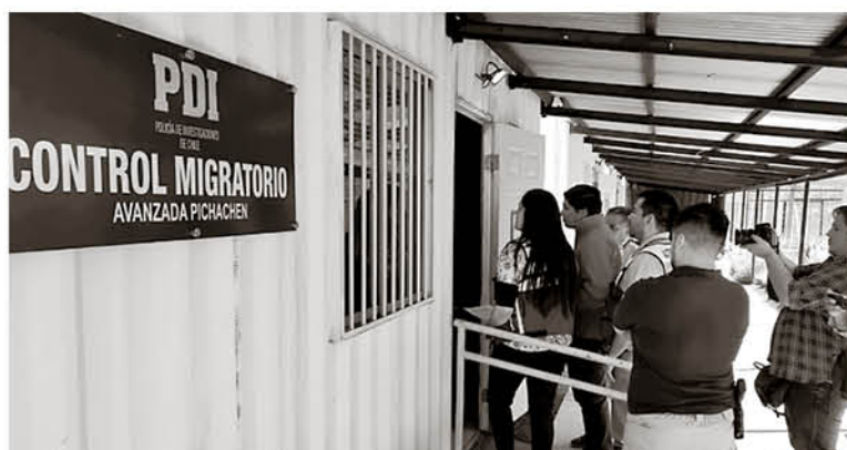
HASTA EL MOMENTO son más de 700 las muertes por coronavirus en China, por lo que es fundamental que la población sepa cómo cuidarse.