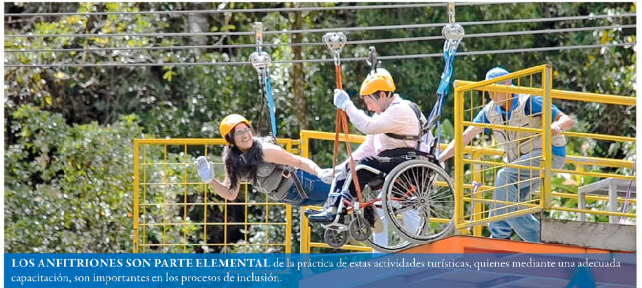
LOS ANFITRIONES SON PARTE ELEMENTAL de la práctica de estas actividades turísticas, quienes mediante una adecuada capacitación, son importantes en los procesos de inclusión.

Pese a que se busca ser más inclusivos en la sociedad y masificar el deporte, desde la