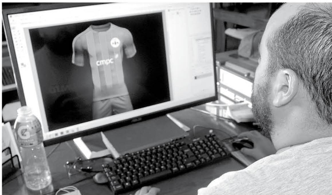
EL GANADOR AGRADECIÓ a su equipo de trabajo, familia, amigos, hermanos de iglesia y, por supuesto, la comunidad angelina que optó por su diseño.

Entre las inspiraciones para dar forma a la armadura que defenderá el equipo este 2020, el experto mencionó que quiso seguir la línea clásica del club en el diseño, pero realizando un leve, aunque trascendental cambio, específicamente en la parte inferior de la camiseta, para otorgar un poderoso significado inspirado en la capacidad del pueblo angelino para afrontar el panorama adverso, asegurando que