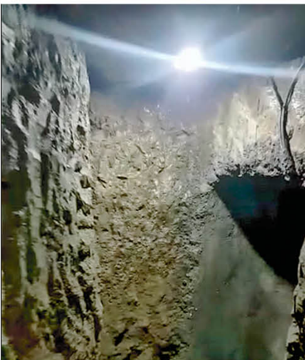
LA PROPUESTA DE SALTOS EL LAJA tiene una similitud con el Chiflón del Diablo, y tiene salida directa a los muelles del sector.

Para cerrar, enfatizó que son las familias quienes deben incentivar a sus hijos, aseverando que la educación también cumple un rol fundamental en motivar la práctica deportiva. "Me he dado cuenta de que tenemos falencias importantes y algunas vienen del colegio. A mí me da mucha pena cuando me llegan niños ciegos de 13 o 14 años donde ni siquiera saben lo que es trotar, por lo que me pregunto inmediatamente: ¿dónde está la educación física?"