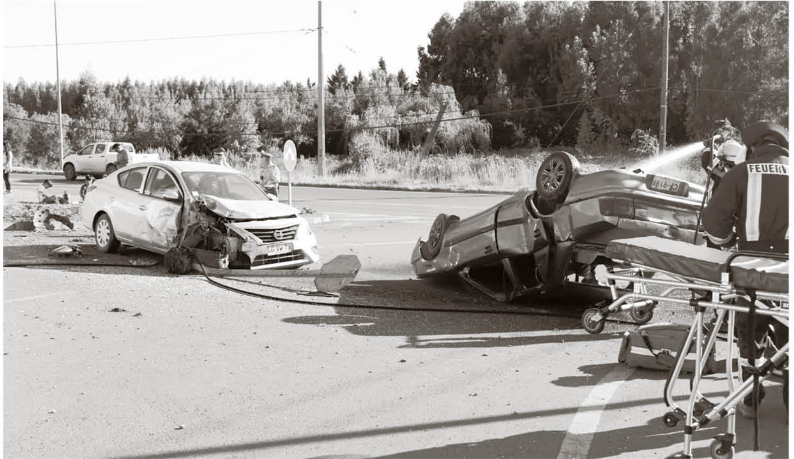
LOS HERIDOS SALIERON por sus propios medios de los automóviles, y luego fueron atendidos por SAMU y Bomberos.

Junto a Carabineros y SAMU trabajó una decena de voluntarios de la sexta compañía de Bomberos