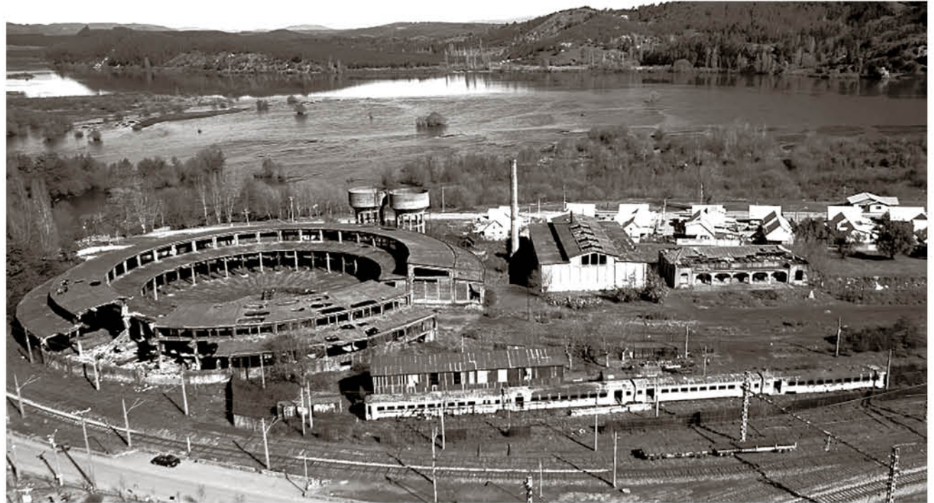
LA CONSTRUCCIÓN DE LA MAESTRANZA por la Empresa de Ferrocarriles del Estado data de 1929, sin embargo, antes de esa fecha ya existía una casa de máquinas, que debido al intenso trabajo de la estación, fue insuficiente para albergar a todas las locomotoras que llegaban a San Rosendo.

Sin embargo, según el alcalde, el actual directorio de EFE tiene una visión distinta. Están dispuestos a ceder a la municipalidad las 15 hectáreas del área correspondiente