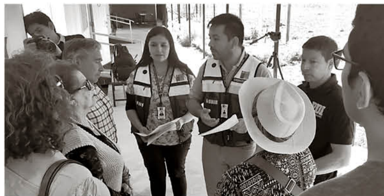
ESTA CAMPAÑA es un trabajo conjunto de la Seremi de Salud y la Gobernación, con apoyo de Aduanas, el SAG y la PDI.

Es necesario comentar que a este operativo se le va a sumar, durante