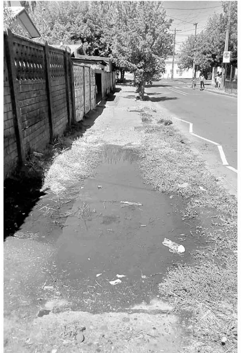
AL APOZARSE, el agua genera además, mal olor.

Diario La Tribuna se contactó con la empresa sanitaria, no obstante al cierre de esta edición aún no se ha recibido respuesta.