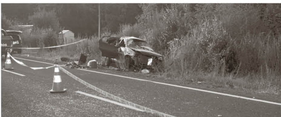
UN NUEVO ACCIDENTE DE TRÁNSITO con una víctima fatal ocurre en la provincia y alerta de las medidas de seguridad para evitar más víctimas.