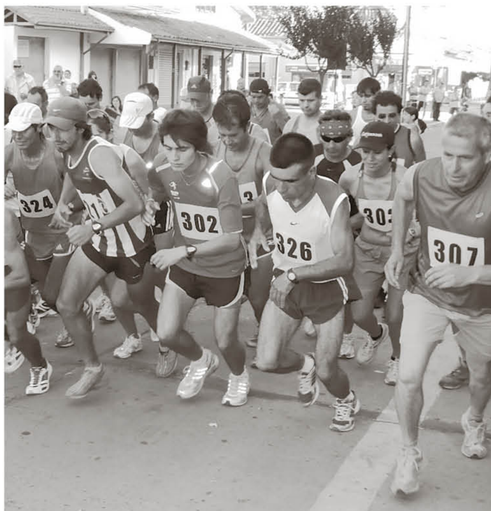
LOS PARTICIPANTES INSCRITOS de acuerdo a las bases recibirán una colación tras realizada la prueba.