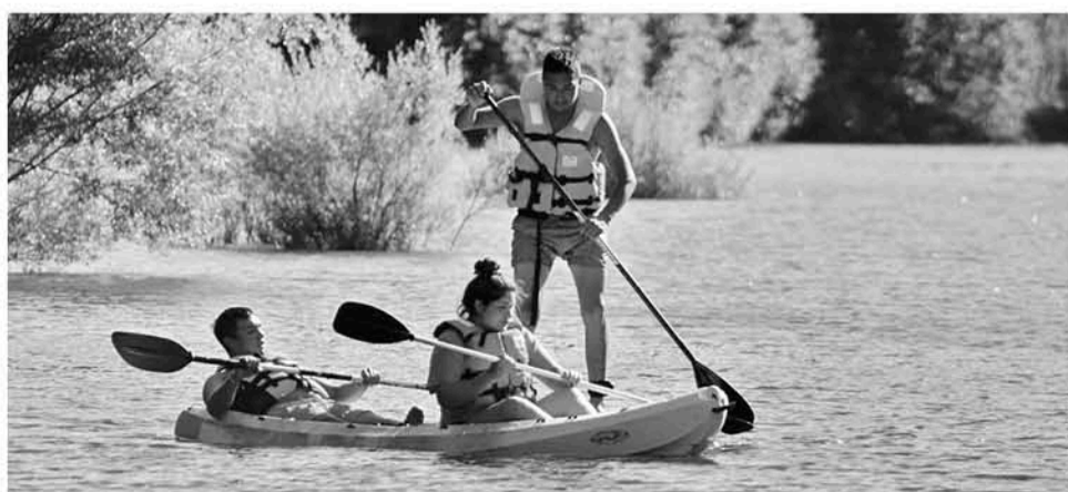
EL BIOBÍO, Y EL LAJA, son los ríos preferidos para la práctica de este deporte.

En dicho sitio web están disponibles aquellas empresas que se encuentran registradas en Sernatur, y que por tanto se someten a una fiscalización donde se verifica que cumplan con la normativa vigente. Quienes no realizan este trámite, no cuentan con dicho respaldo.