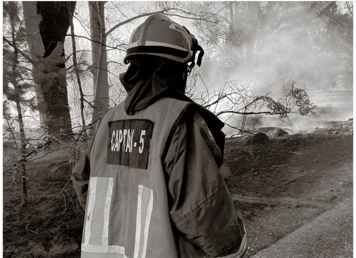
SE ESPERA QUE LAS CONDICIONES de altas temperaturas y viento no provoquen nuevos focos de incendio.

Además, se recomendó a los organismos pertinentes a reforzar la vigilancia de los sectores de mayor vulnerabilidad, esto en relación a las temperaturas y vientos que se esperan para los próximos días, condiciones que son propicias para la propagación de incendios forestales, esto a fin de mantener la vigilancia sobre áreas forestales vulnerables, para impedir, detectar y combatir oportunamente la ocurrencia de potenciales focos de incendios, orientando a la población de zonas adyacentes a pastizales, matorrales y bosques, para así evitar prácticas inapropiadas en el uso y manejo del fuego.