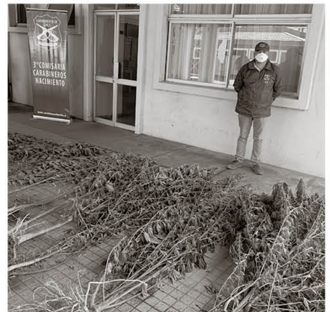
GRACIAS A DENUNCIAS se realizó el patrullaje que dio con esta plantación ubicada dentro de un inmueble del sector de Dollinco.

con las diligencias". Y añadió que "No obstante a ello, se dieron cuentas pertinentes al Ministerio Público y se está trabajando con alguna que otra situación que pudiera provocar en este sentido la Ley 20.000 de drogas".