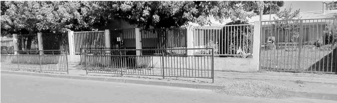
FRENTE A LA FUGA DE AGUA, está ubicado el jardín infantil 21 de Mayo.