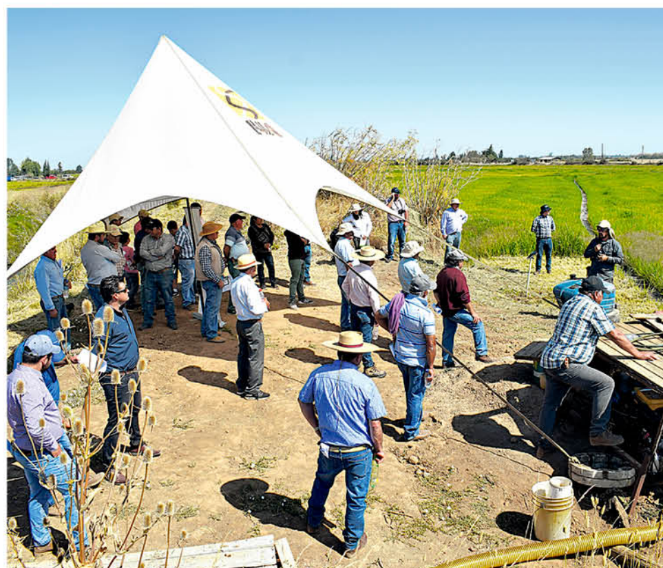
EN EL PROYECTO PARTICIPAN tres países con el apoyo de instituciones como el Centro de Agricultura Tropical (CIAT) y otros.