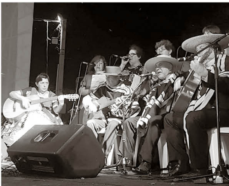
TRAS PRESENTARSE en el Parque Roosevelt, la agrupación de Biobío ya se prepara para ir a Paraguay en 2021.