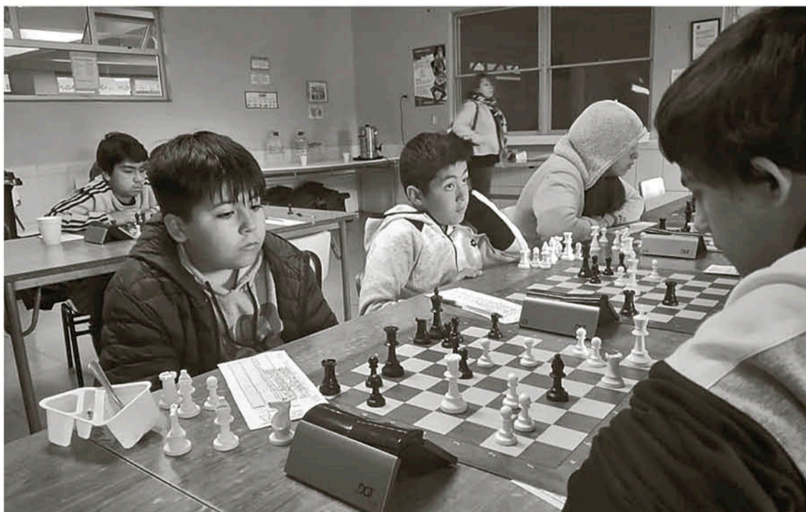
LA COMPETENCIA SUREÑA ANUAL contó con la participación de ajedrecistas de todas las edades, quienes compitieron en distintas categorías.

Para cerrar, el juez FIDE perteneciente a la capital de Biobío se refirió al calendario competitivo para los integrantes del Club Academia de Ajedrez Los Ángeles Biobío, puntualizando que tendrán una semana de descanso para iniciar las actividades con normalidad del circuito ajedrecista dentro de la provincia, donde los primeros movimientos del tablero serán en Cabrero el domingo 1 de marzo, durante la convocatoria válida por la cuarta versión del tradicional Torneo Ciudad de Cabrero, puntualizando que este "será un torneo de ritmo rápido por lo que invitamos a toda la comunidad de Biobío a estar atenta para participar, ya que informaremos a la brevedad las fechas y cómo participar".