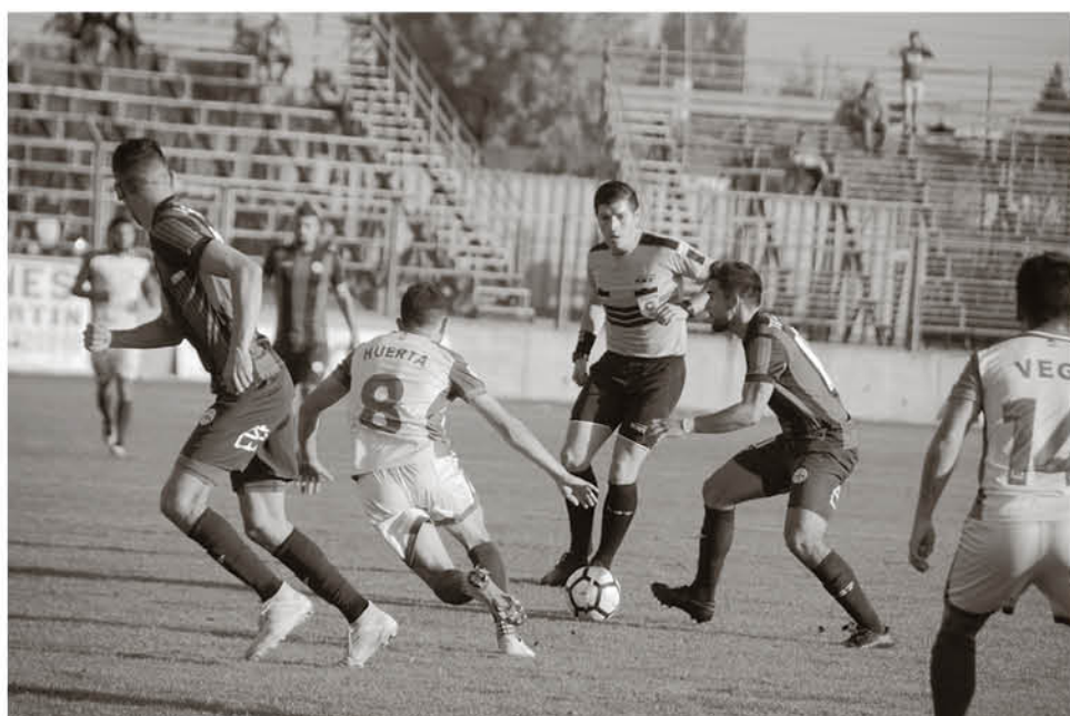
EL TORNEO DE LA CATEGORÍA BRONCE del fútbol nacional este 2020 tendrá tres descensos a Tercera A del balompié amateur y un ascenso a Primera B profesional.