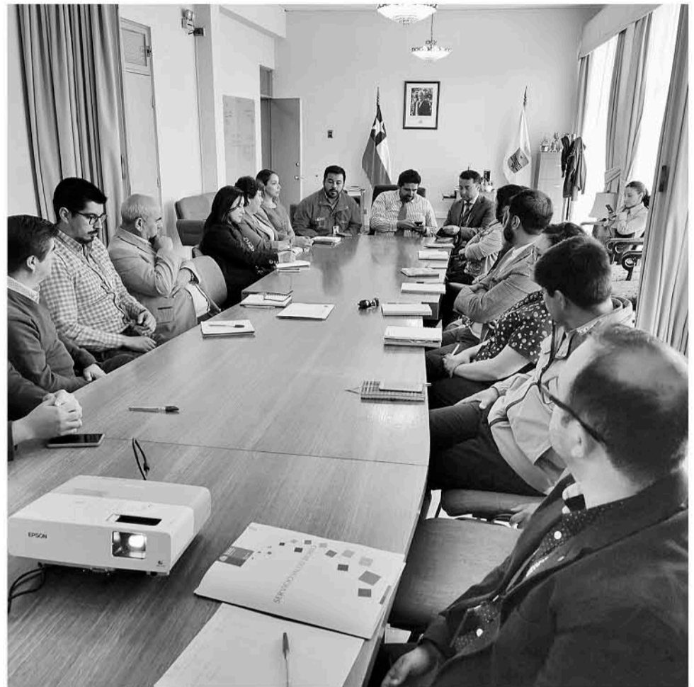
LOS CATORCE ALCALDES más sus respectivos jefes de Salud formaron parte de la reunión informativa por el coronavirus