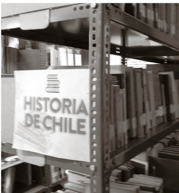
LA MEDICIÓN INCLUYÓ a 428 bibliotecas a lo largo del país.

Pantoja, destacó que “estamos hablando de que superamos bibliotecas maravillosas, que son hermosas con unos espacios de metros cuadrados que son grandes, con grandes mobiliarios como las de Santiago o la de Concepción que tiene un lugar precioso”.