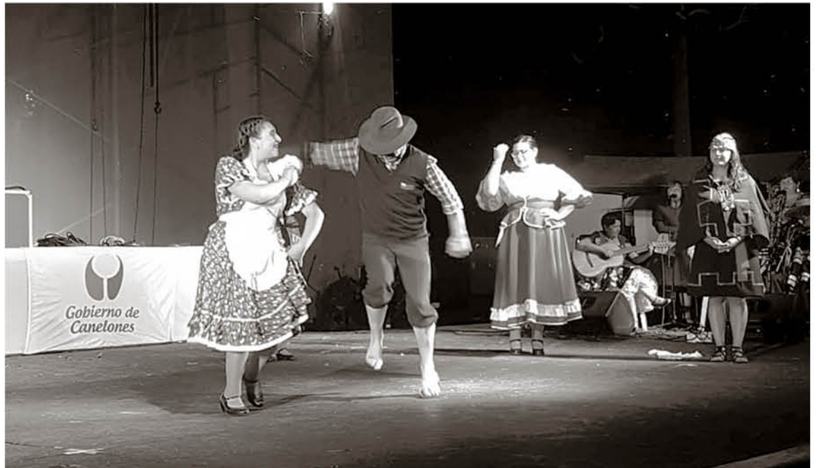
“SENDEROS DE MI TIERRA” de Santa Bárbara ha recorrido todo Chile mostrando su arte, además de Argentina y Uruguay.

Agregó, tras mostrar su arte que “nos sentimos en casa, es muy lindo el país. Sentimos el cariño de la gente, nos dimos cuenta que la