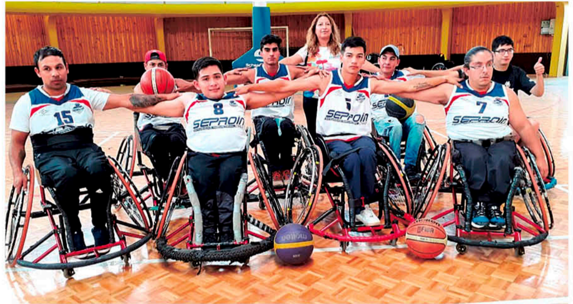
LOS REPRESENTATIVOS LOCALES se encuentran a un paso de formar parte de la primera división del baloncesto nacional.

Mientras que los representantes de la segunda división donde los locales de NBA Los Ángeles ya tendrían un pie adentro para subir de categoría serían, Puerto Montt (B), Valdivia y Coquimbo, estos últimos serían los rivales del equipo angelino quienes por la puntuación acumulada a lo largo de la competencia solo con un triunfo en este encuentro ya estarían en la serie profesional del