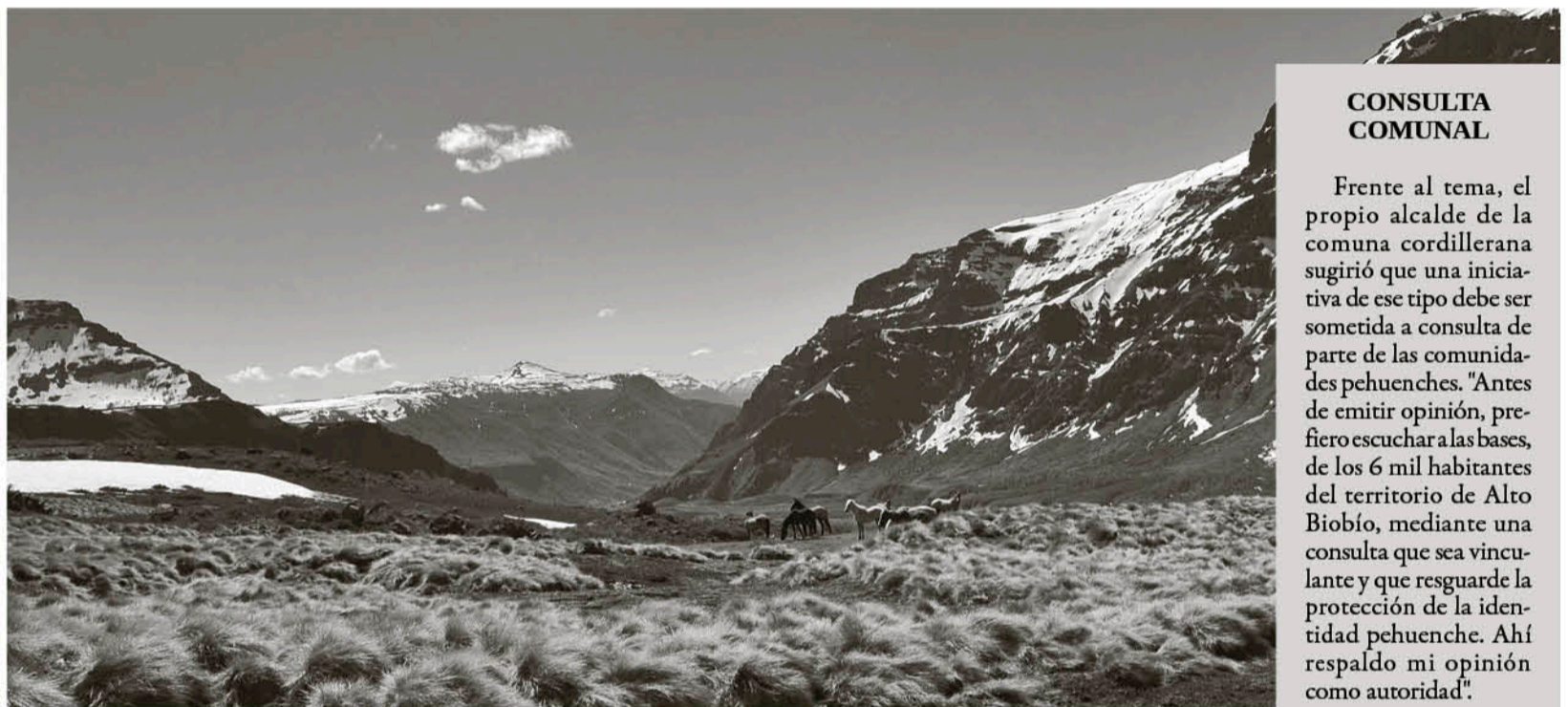
EN LA ZONA DE ALTO BIOBÍO se encuentran los pasos fronterizos de Copahue y Pucón-Mahuida.

A juicio del edil de Alto Biobío, antes de siquiera pensar en ese tipo de iniciativas, es necesario resolver necesidades que son prioritarias para los habitantes del