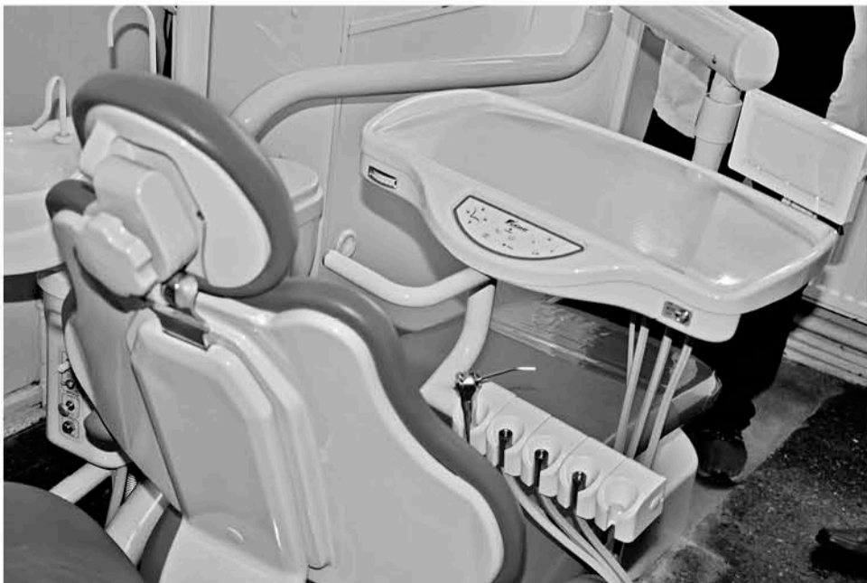
ESTOS SON ALGUNOS DE LOS SILLONES DENTALES que se implementaron en el centro asistencial.