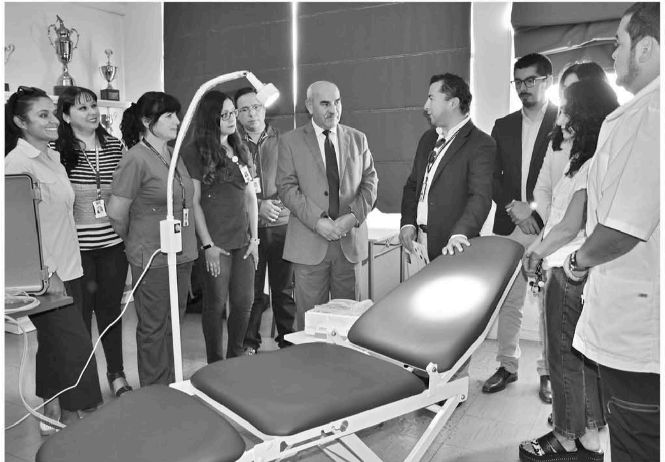
LAS AUTORIDADES RECORRIERON las diferentes inmediaciones del hospital comunal donde conocieron el manejo de estos equipos.

Además de esto, la autoridad agregó sobre estos implementos que "alos nuevos sillones dentales y equipo de rayos X que estamos entregando al hospital de Yumbel, se suma un sillón móvil dental que es un aporte de la municipalidad, contribución que agradecemos enormemente pues nos permi-