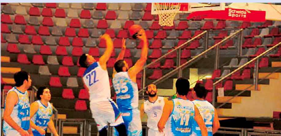
ACTUALMENTE LA COMPETENCIA de carácter semiprofesional se alza como una de las más completas del país.

La instancia deportiva pretende aportar al crecimiento deportivo en la provincia de Biobío.