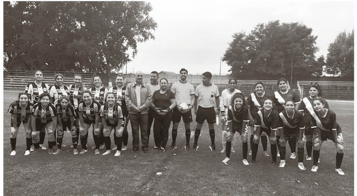
ESTE AÑO LAS CATEGORÍAS femeninas otorgaron al torneo un mayor realce y reunirán a toda la familia en torno al fútbol.