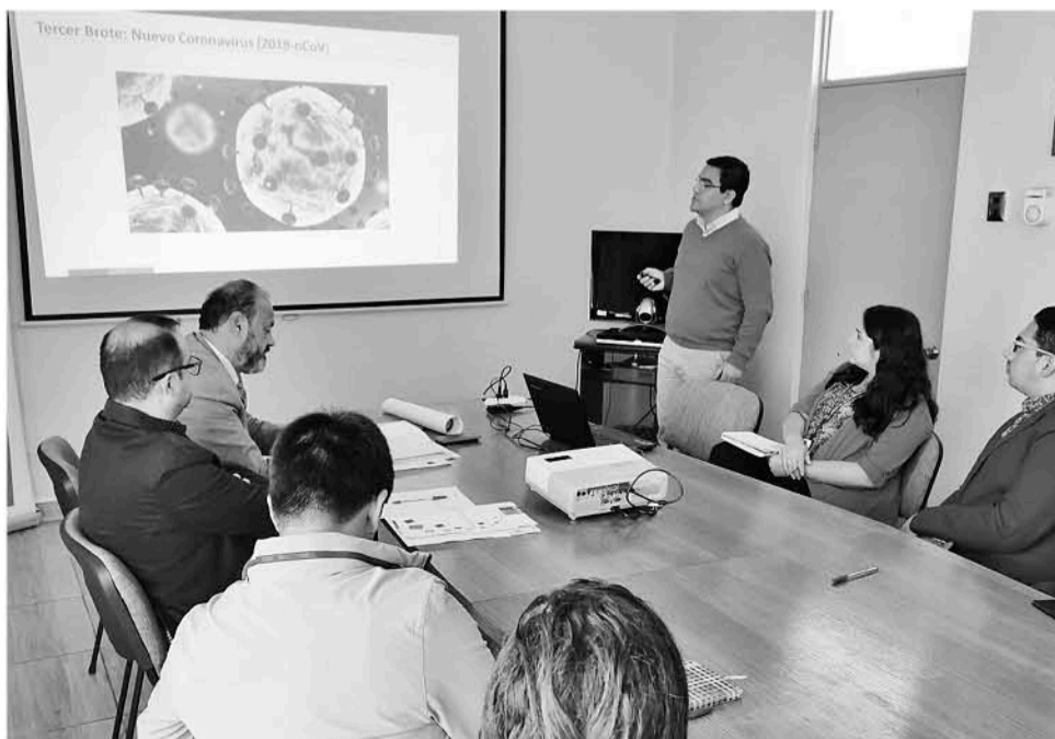
LA CITA SE CONCRETÓ en la Gobernación de Biobío y fue coordinada desde la Seremi de Salud.