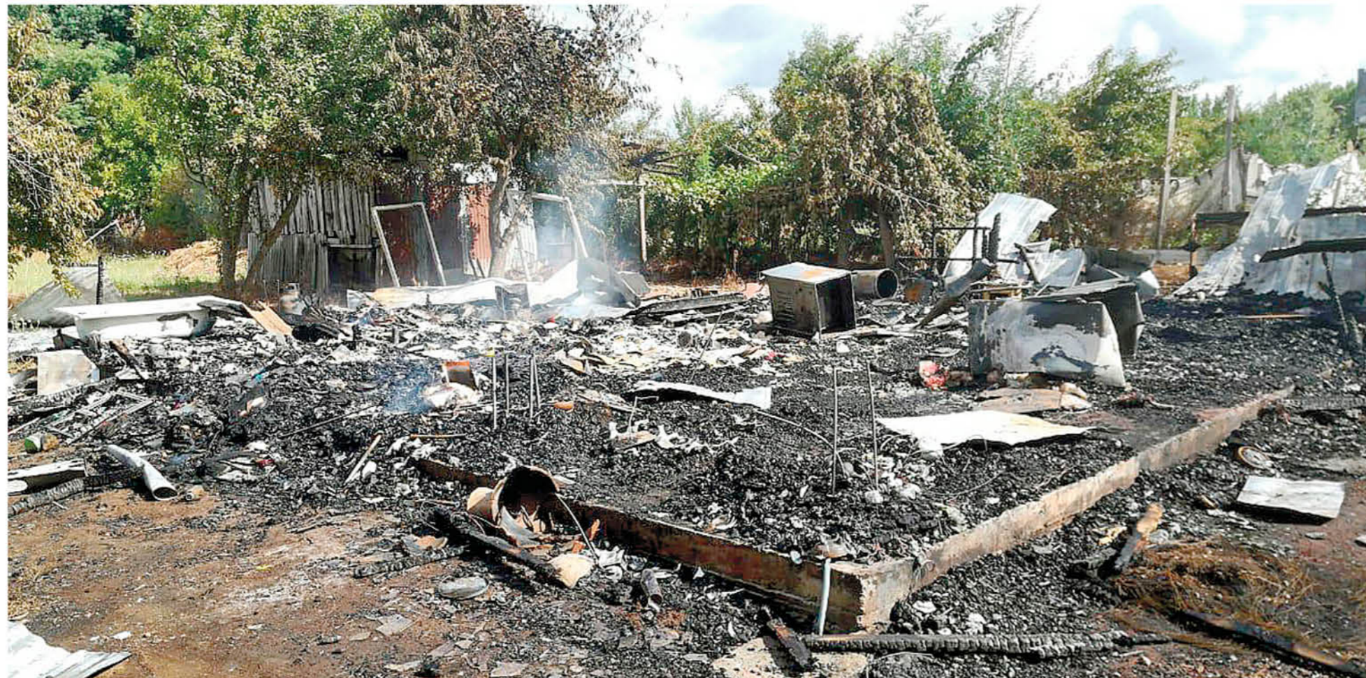
SE TRATARÍA DE UN FEMICIDIO, homicidio, incendio y suicidio, todo provocado por uno de los individuos que, posteriormente, falleció en el sitio del suceso ubicado en la parcela 6 del camino a Santa Adriana.

Femicidio y homicidio en Mulchén deja como saldo tres muertos calcinados y un inmueble totalmente consumido por las llamas.