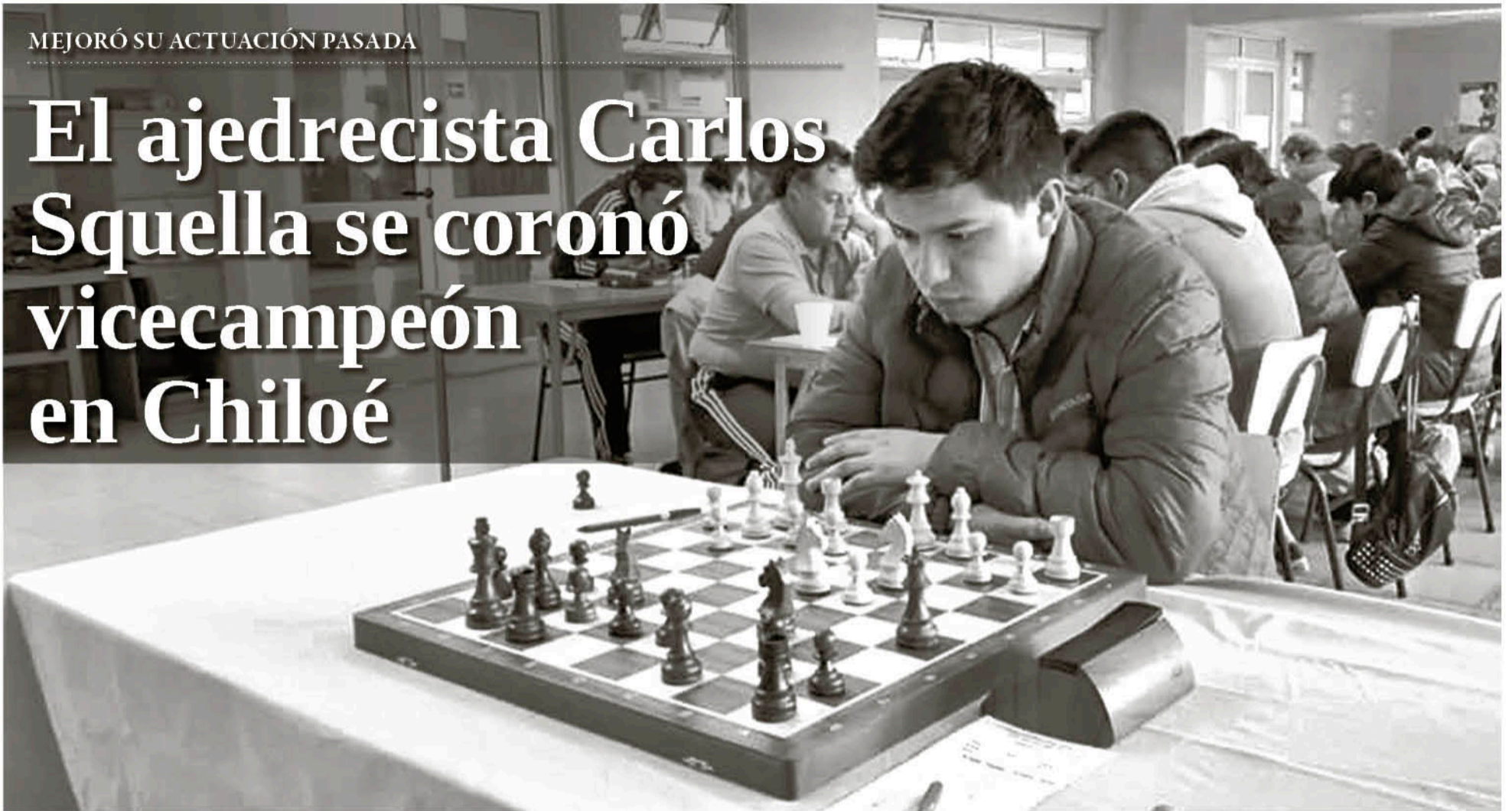
EL JOVEN AJEDRECISTA ANGELINO obtuvo la suma de 225 mil pesos en efectivo, junto a una meritoria copa.

Pese a que empató frente a su similar en el archipiélago, la figura deportiva angelina obtuvo un considerable premio en efectivo e importante experiencia de cara al semestre competitivo 2020.