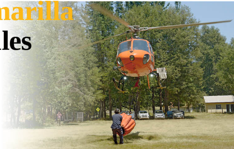
EL APOYO AÉREO ha sido vital para enfrentar los incendios forestales que volvieron a afectar la zona precordillerana entre Antuco y Quilleco.

En Alto Biobío se han originado seis focos en la última semana, todos ocasionados por la acción negligente de las personas. El combate de las llamas en ambos sectores se complica por difíciles condiciones de acceso.