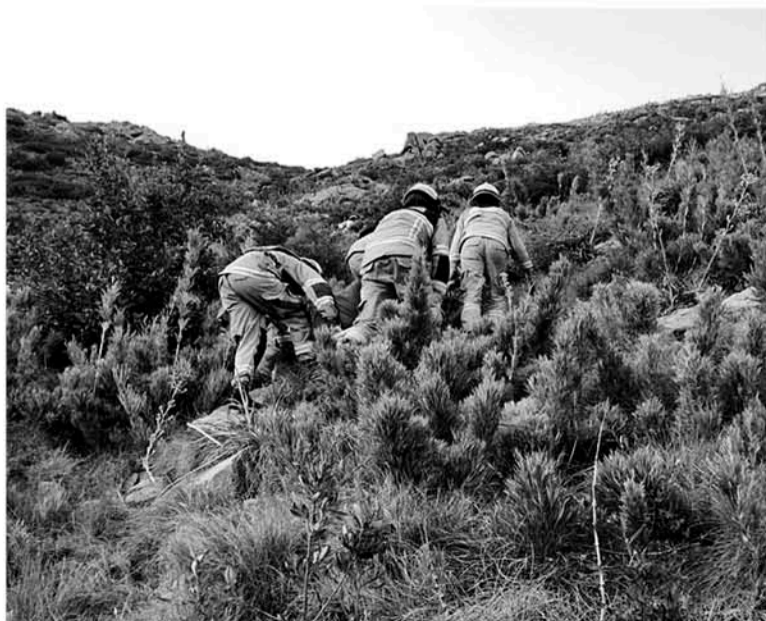
ALREDEDOR DE LAS 7:00 DEL SÁBADO, Bomberos encontró a los tres excursionistas cerca de un risco.