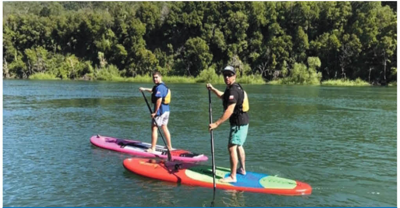
EL STAND UP PADDLE consiste en remar de pie sobre una tabla larga y ancha similar a la utilizada en el surf.

El destacado instructor también señaló que al tener una certificación otorgada