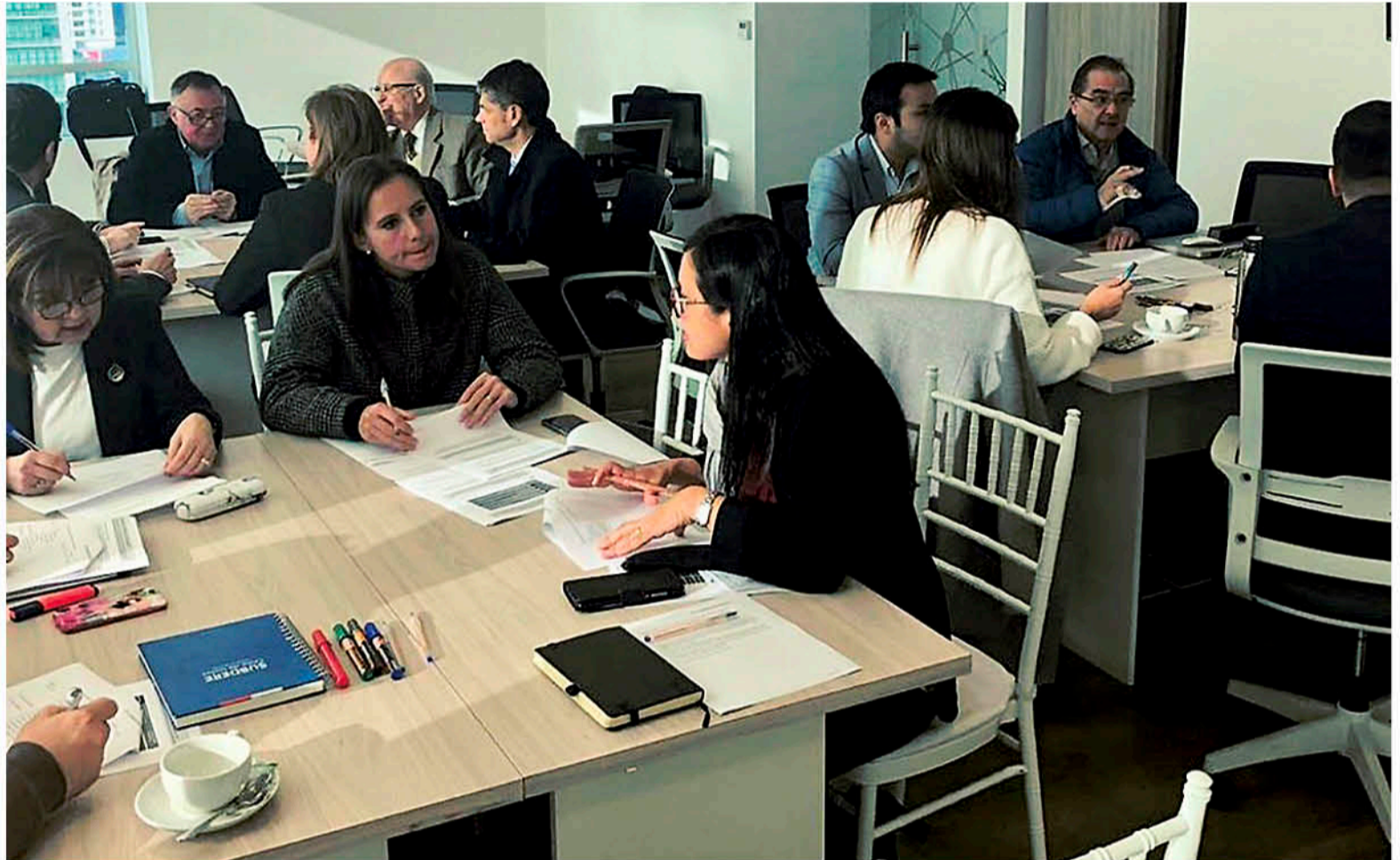
ACTORES PÚBLICOS Y PRIVADOS PARTICIPARON en talleres para analizar el estado actual en materia de internacionalización de la región del Biobío.