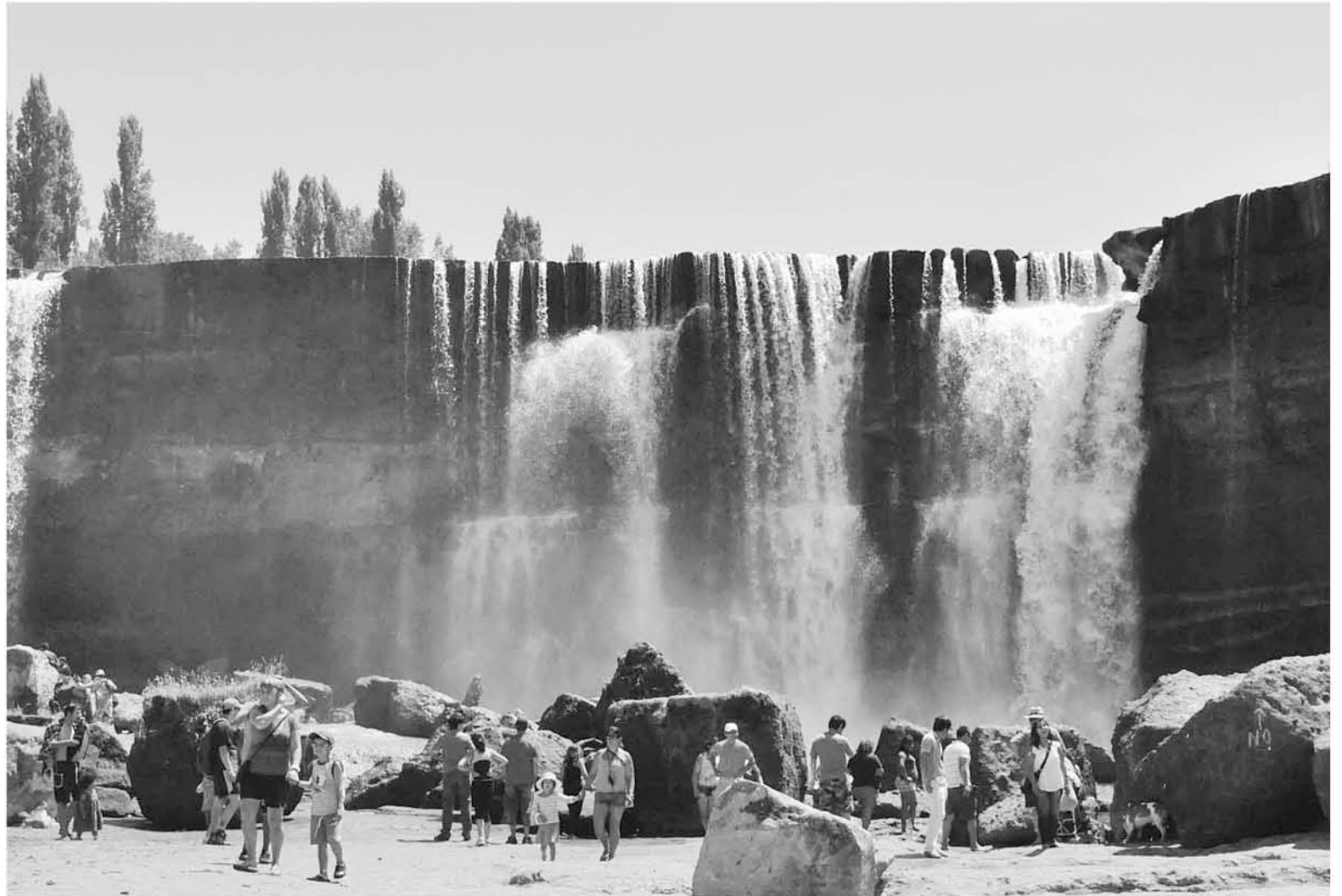
LA CASI DESAPARECIDA cascada de los Saltos del Laja es la postal de la sequía en la provincia de Biobío.

Es que en los primeros días de enero, en un encuentro también en la capital, se había llegado a un punto muerto en las negociaciones para consensuar los estatutos que articularían el trabajo de dicho instrumento, cuyo fin es hacer un uso racional de las aguas de la cuenca,