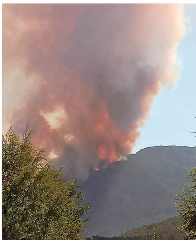
EN LOS CHENQUES, en Alto Biobío, el fuego avanzaba con rapidez.