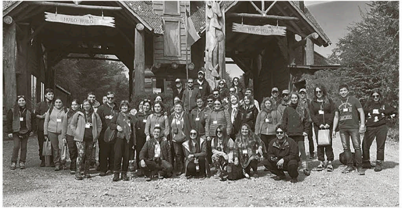
EL AÑO PASADO, la misma actividad la vivieron profesores de la región de Ñuble. Este año es el turno de la provincia de Biobío.

Para la profesora de Historia, la coyuntura actual que viven los docentes y alumnos es única y hace que muchas veces sea difícil lograr una conexión que permita el aprendizaje. "Este año, todos los alumnos que están en los colegios de Chile son alumnos nacidos en el tercer milenio, no hay ninguno del siglo XX, y todos los profesores son nacidos en el siglo XX. Con todo lo que ello implica. No hay ningún profesor menor de 20 años y no hay ningún