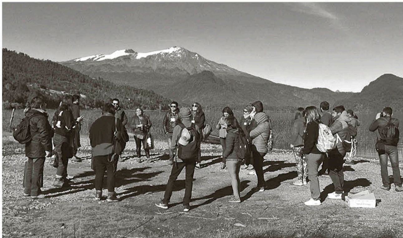
LAS DISTINTAS ACTIVIDADES, la mayoría en entorno natural, ayudan a entablar diálogo y motivan a los grupos a seguir en contacto luego de los tres días de experiencia.

La convocatoria se cierra este 20 de marzo. Los resultados se conocerán el 27 del mismo mes y el viaje comenzará el viernes 3 de abril desde la Plaza de Armas de Los Ángeles.