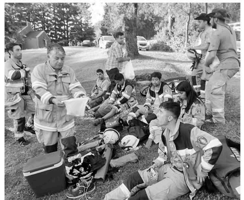
TRAS EL ESFUERZO, personal de Bomberos asistió a los rescatistas.