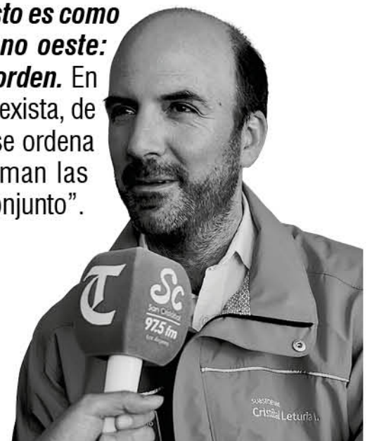
Cristóbal Leturia, ministro (s) de Obras Públicas.

“Antes de que exista una junta de vigilancia, esto es como estar en el lejano oeste: no rige ningún orden. En cambio, cuando exista, de ahí en adelante se ordena el tema y se toman las decisiones en conjunto”.