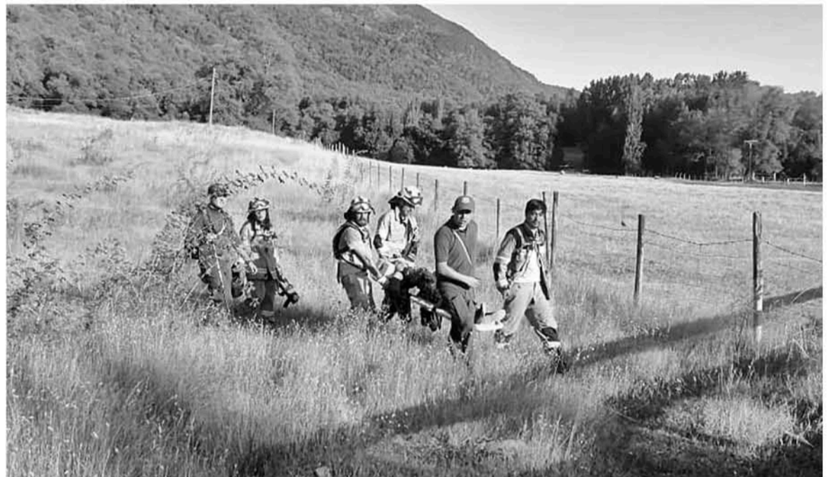
PASADAS LAS 19:00 HORAS DEL SÁBADO, bomberos de Santa Bárbara y carabineros llegaron hasta Aguas Blancas junto a los tres excursionistas rescatados.

Al hacer una evaluación de la situación, los voluntarios consideraron que una caminata de regreso sería muy extenuante para los tres deportistas y los ocho voluntarios, por lo que solicitaron rescate aéreo a sus superiores. Allí Faúndez se comunicó con la Gobernación Provincial, donde le respondieron que era la ONEMI