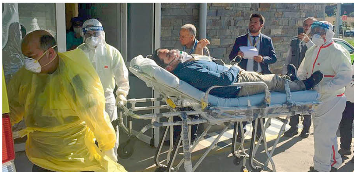
UN ASPECTO DEL SIMULACRO realizado en el hospital de Los Ángeles por coronavirus.

Por último, desde la Autoridad Sanitaria se aseguró que "se han tomado todas medidas necesarias para entregar seguridad a la población".