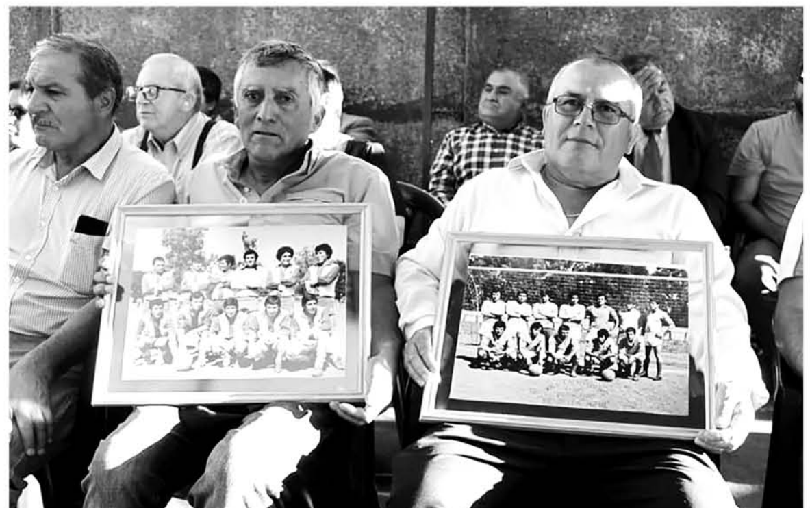
LA INSTITUCIÓN es una de las más antiguas en la provincia de Biobío.

Cabe destacar que en dicha ceremonia estuvieron presentes autoridades parlamentarias de la zona, como asimismo consejeros regionales de la región del Biobío, concejales, invitados especiales, y el directorio en pleno de "Estrella Azul" además de las distintas series de la institución.