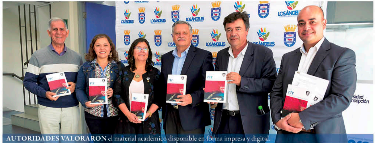
AUTORIDADES VALORARON el material académico disponible en forma impresa y digital.

En relación a lo que significa el ser parte del Comité Consultivo de Creasur,