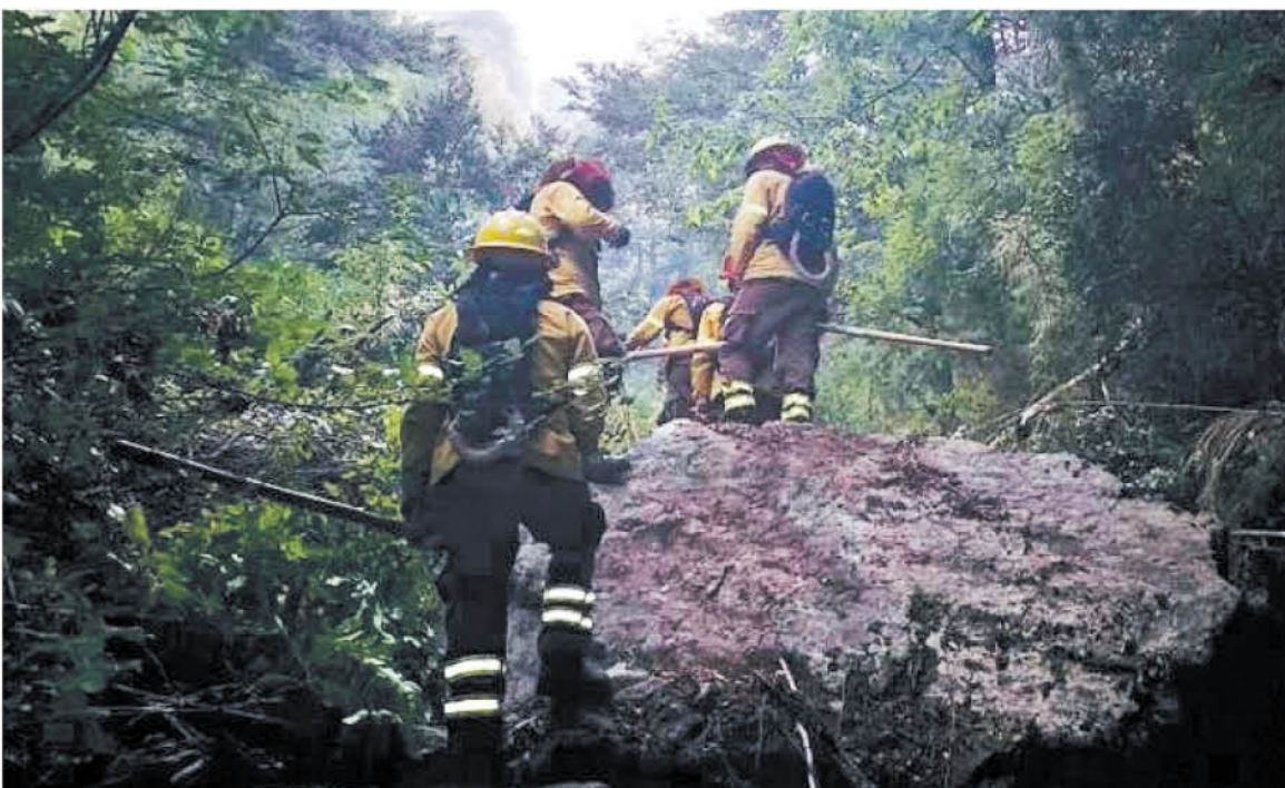
LO ESCARPADO DEL TERRENO ha complicado las labores de siniestro en la zona cordillerana.

En tanto, los helicópteros habituales tienen un costo promedio de operación de 1,8 millones por hora.