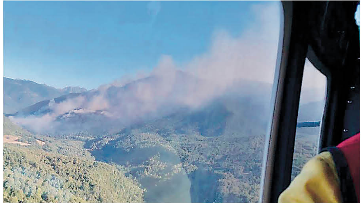
UNA VISTA GENERAL del incendio forestal en Los Chenques, comuna de Alto Biobío.

De acuerdo a las estimaciones de Muñoz, a más tardar el viernes se podría tener completamente conte-