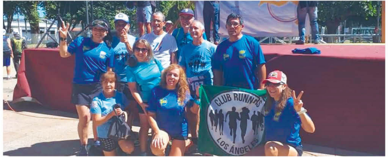
EL TALLER DE ACONDICIONAMIENTO físico y competición deportiva se realizará en conjunto al club Runners de Los Ángeles, y cada sesión durará 60 minutos.

Para conocer algunos detalles sobre los trabajos que realizarán los expertos enseñando la especialidad pedestre, consultamos con el especialista en carrera de larga distancia y campeón absoluto de Chile de 10000m el cual impartirá las clases sema-