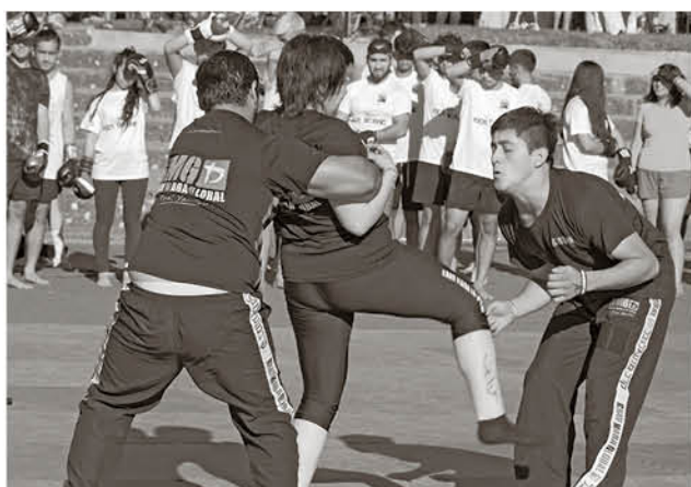
EL KRAV MAGA ES una forma de combate cuerpo a cuerpo que incluye métodos de defensa contra uno o varios atacantes, en respuesta a una amplia y variada gama de agresiones.

En tanto, desde la organización Aravena también hizo el “mea culpa” aseverando que “tenemos que evaluar bien, nosotros nos juntaremos mañana –jueves– a evaluar la actividad, donde veremos cuáles fueron los pro y contra”.