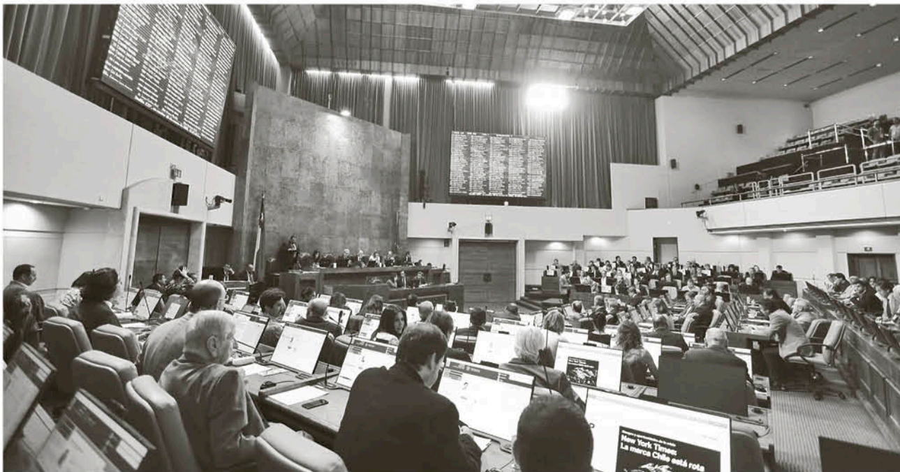
EL PROYECTO DEBE SER ahora legislado en el Senado para convertirse en ley.

Por último, el diputado Norambuena valoró que la iniciativa "haya tenido un apoyo transversal en esta oportunidad y espero que en el Senado tenga una rápida tramitación, para que el personal de Bomberos pueda trabajar con tranquilidad y se sancione a aquellos que de manera incomprensible los atacan, cuando los voluntarios y voluntarias ya ponen en riesgo su vida para salvar la de otros".