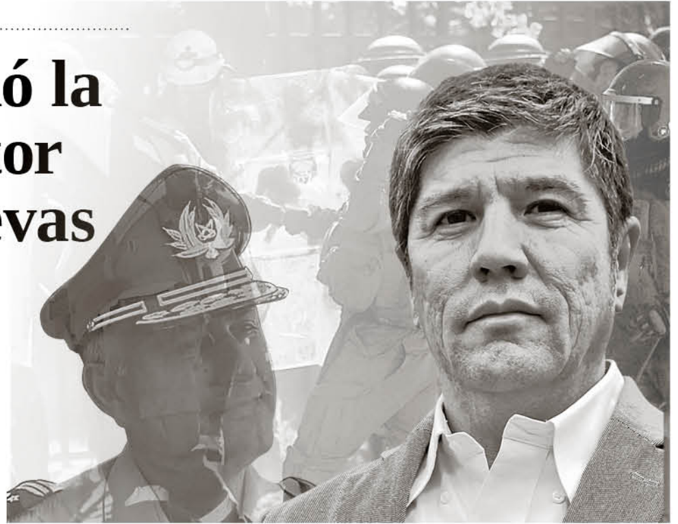
LA VIOLENCIA VIVIDA en las últimas semanas y el actuar de Carabineros ha hecho que el socialismo pida la salida del general director, Mario Rozas.

El actuar de Carabineros de Chile provocó tras el estallido social dos acusaciones constitucionales, la primera que sacó del Ministerio del Interior a Andrés Chadwick y la segunda que se frenó por la votación correspondiente