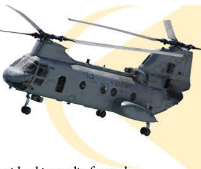
nido el incendio forestal.