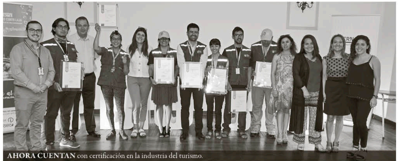
AHORA CUENTAN con certificación en la industria del turismo.

“Se trata de quienes culminaron exitosamente un proceso de implementación y apoyo para la certificación