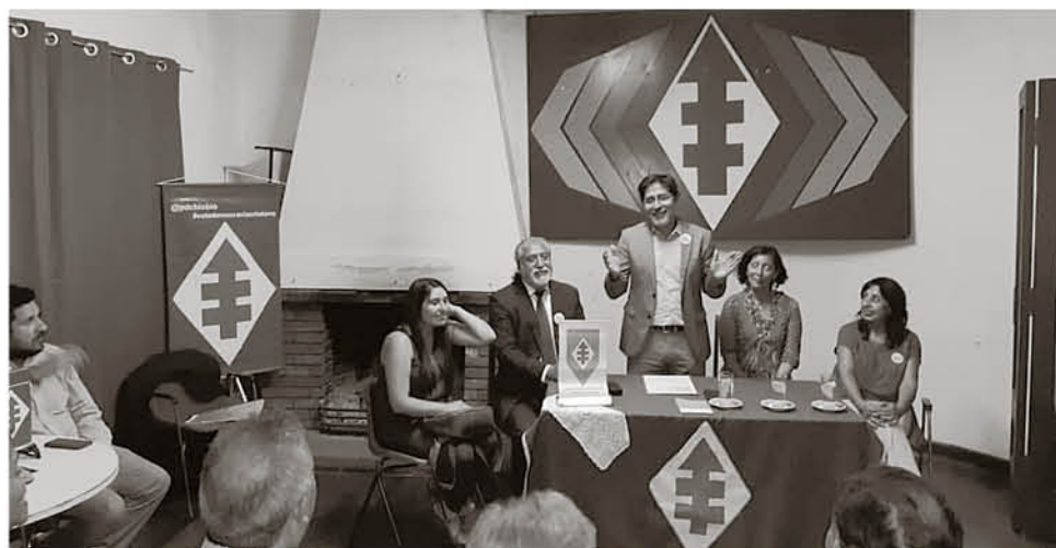
LA DC ANGELINA aún no define si presentará o no candidato a alcalde.

El ex candidato a diputado asumió el cargo tras su triunfo en las elecciones de enero.