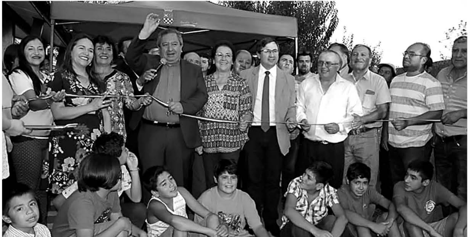
CON GRAN ALEGRÍA, directiva del Club social y deportivo Estrella Azul, recibió sus nuevas instalaciones.

Cabe señalar que en el mes de marzo del año 2018, tanto los directivos de la institución social y deportiva de "Estrella Azul" fir-