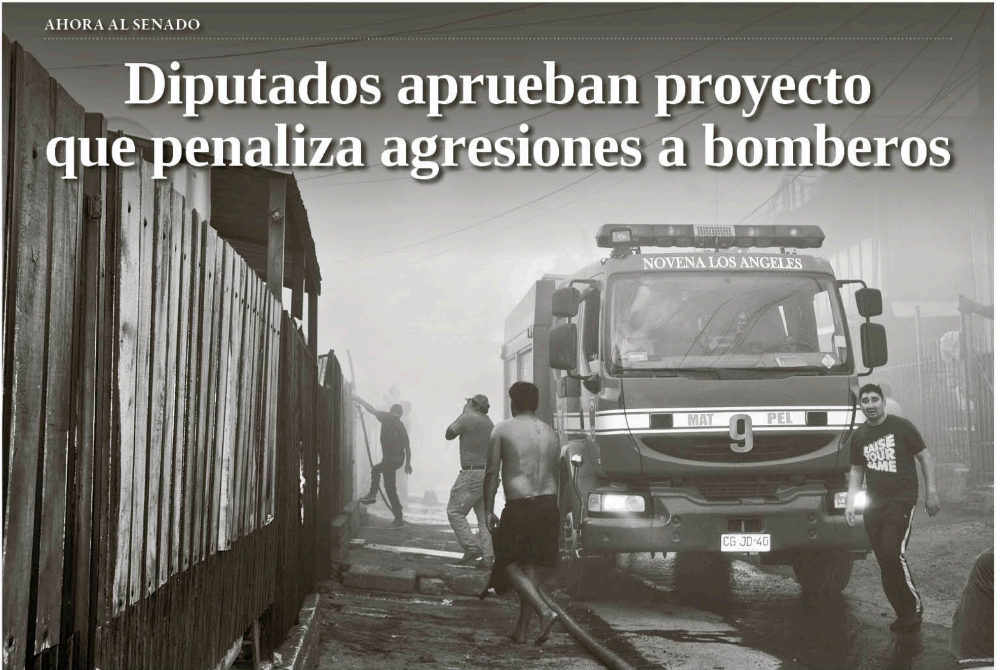
LOS DIPUTADOS LOGRARON que se penalice a quienes agreden a Bomberos en las emergencias.

La norma en trámite, originada en mociones refundidas, modifica el Código Penal para sancionar los atentados cometidos contra los bomberos cuando se encuentran en servicio activo.