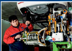
Taller de Mecánica