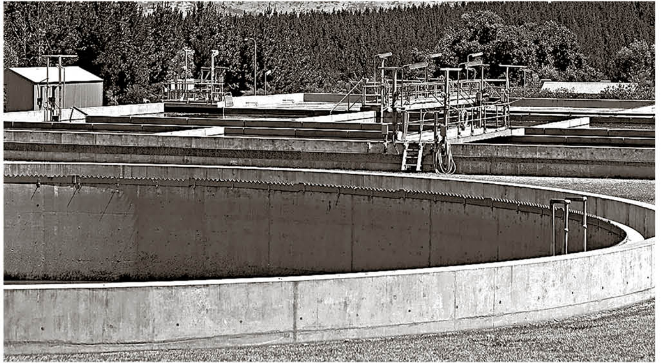
EL PROBLEMA DE LOS MALOS olores fue reconocido por la planta, pero ya se arregló. (Foto de contexto).

Desde la autoridad sanitaria informaron que al momento de la fiscalización, ya habían subsanado esa situación, pero se detectaron incumplimientos administrativos y técnicos.