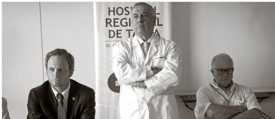
SALUD SIGUE BUSCANDO a toda la red de contactos del matrimonio que viajó de luna de miel al sudeste asiático.

protocolo de manejo de casos ordenado por el Ministerio de Salud. Esta paciente califica como caso importado, debido a que es posible trazar el origen de su enfermedad a un caso en otro país.