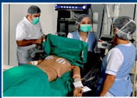
Pabellones de Práctica