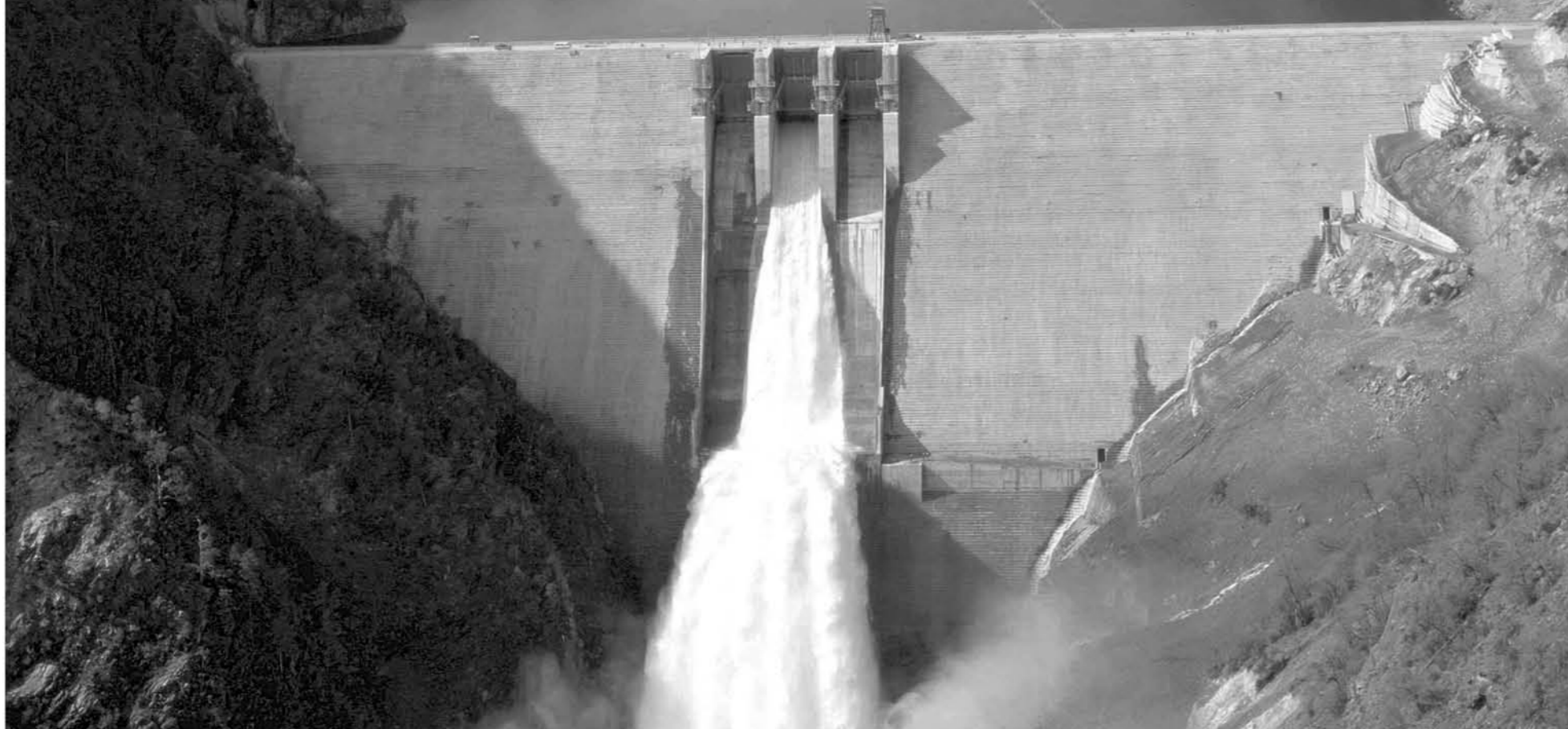
EL TRABAJO DE LA ONU busca guiar a nuestro país en un tema tan complicado como es la sana convivencia entre la naturaleza y las grandes industrias.

El informe del organismo multinacional pide a nuestro país mejorar la inversión y constituir una estructura de trabajo estable para asegurar la convivencia entre el recurso natural y la industria maderera.