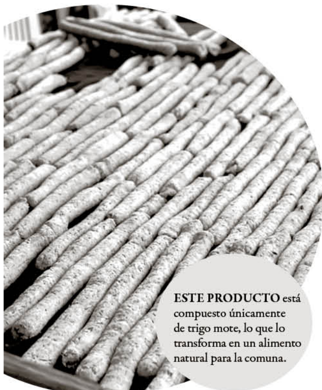
ESTE PRODUCTO está compuesto únicamente de trigo mote, lo que lo transforma en un alimento natural para la comuna.

remos superar, sin embargo, ya tenemos el primer ejercicio y quién sabe, el próximo año lo podemos lograr, porque de esta forma mantenemos tradiciones y también nos damos a conocer en nuestra comuna", sentenció esta dirigente vecinal.