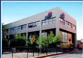
AIEP Los Ángeles