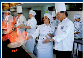
Taller de Gastronomía