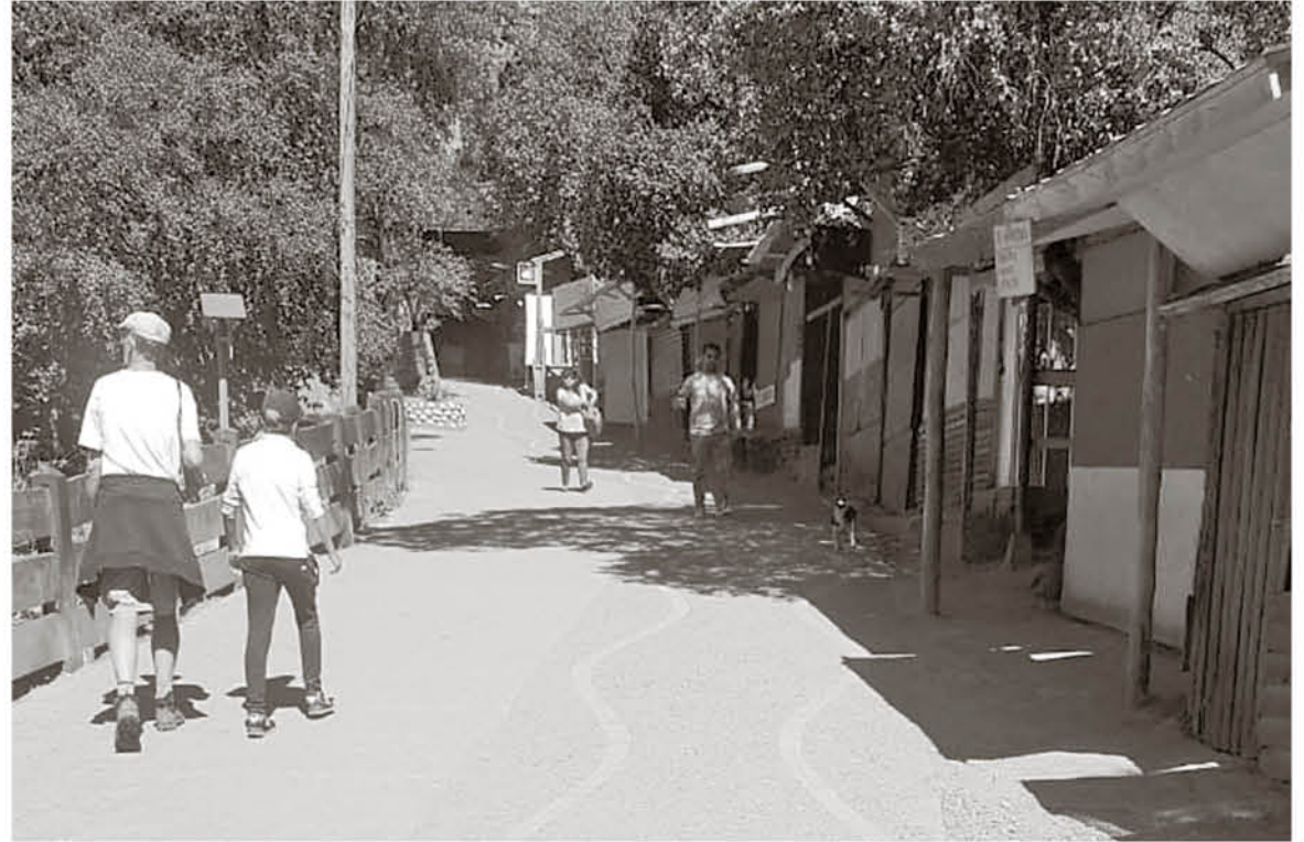
DE CARA A UN NUEVO fin de semana insisten en mantener el aislamiento social.

el cierre si fuese necesario, pero lo principal es que las personas entiendan que no son vacaciones" afirmó el vocero de la Cámara de Turismo.