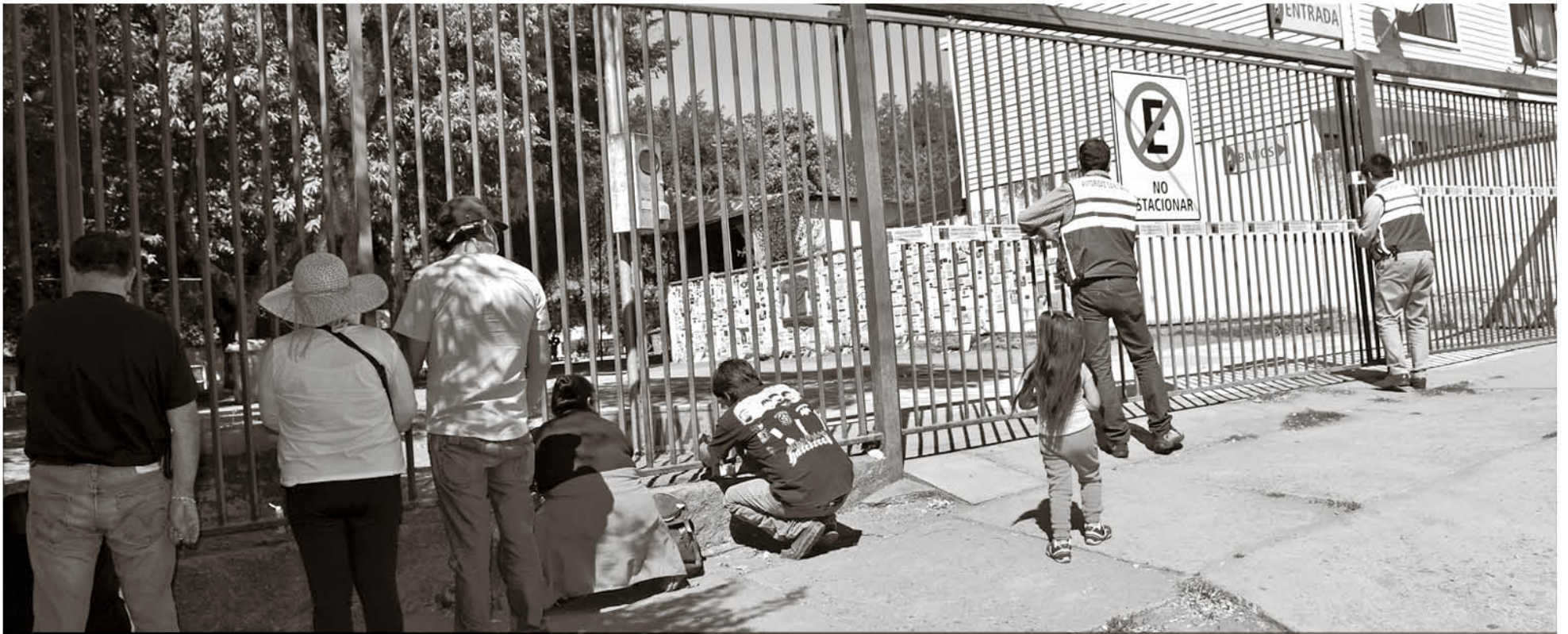
ENTRE OTRAS MEDIDAS la autoridad sanitaria decretó el cierre del campo de oración e iglesia de Yumbel, con el fin de controlar el ingreso de público hasta el término de este periodo.