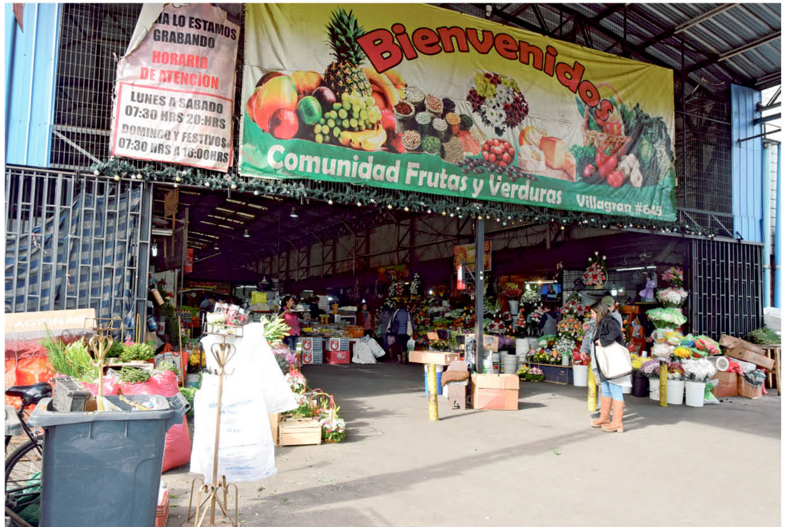
LA VEGA SE MANTENDRÁ FUNCIONANDO para atender los requerimientos de alimentos frescos de la población provincial.

La medida apunta a evitar un potencial contagio en lugares de alta