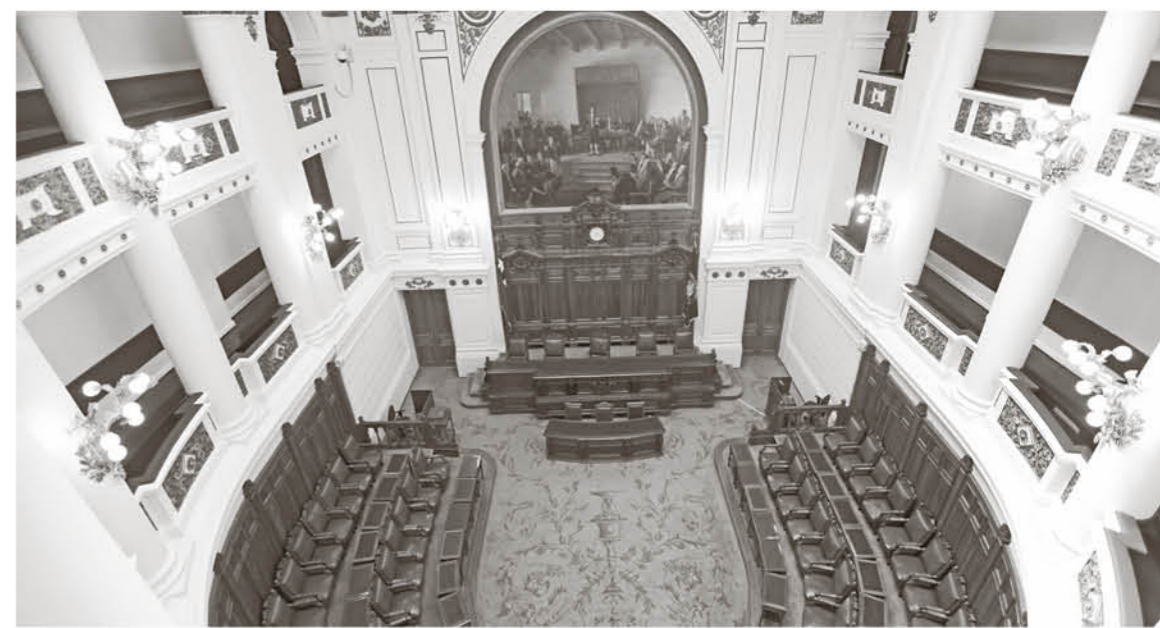
EL ACUERDO FUE TOMADO por los 15 partidos con representación parlamentaria.

Además, se propuso fechas entre 2020 y 2021 para realizar las demás elecciones relacionadas con los gobernadores, los alcaldes y los eventuales constituyentes.