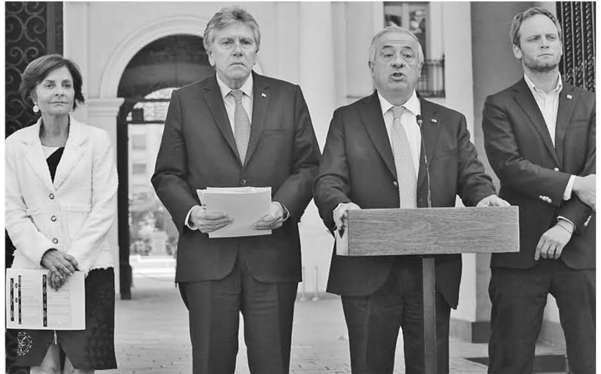
ANUNCIO DEL MINISTRO DE SALUD JAIME MAÑALICH en el marco del anuncio del nuevo balance de contagios por Covid-19 en Chile.

Cabe señalar, que seis están conectadas a ventilador mecánico y una de ellas en "situación