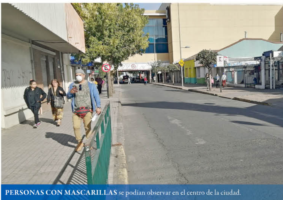
PERSONAS CON MASCARILLAS se podían observar en el centro de la ciudad.

Hasta parece bostezar de aburrimiento y si fue así, hace esfuerzos por disimularlo. Es que hay más de 25 grados y algo de sopor en las calles de la ciudad que se multiplica por mucho justo después del almuerzo, en una tarde inusual en el centro de Los Ángeles.