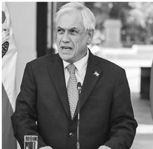
ANUNCIO DEL PRESIDENTE SEBASTIÁN PIÑERA en el marco del anuncio económico para mermar la propagación del coronavirus.

Personas naturales que tengan a su cargo a personas con discapacidad intelectual que vivan a sus expensas (de cualquier edad).