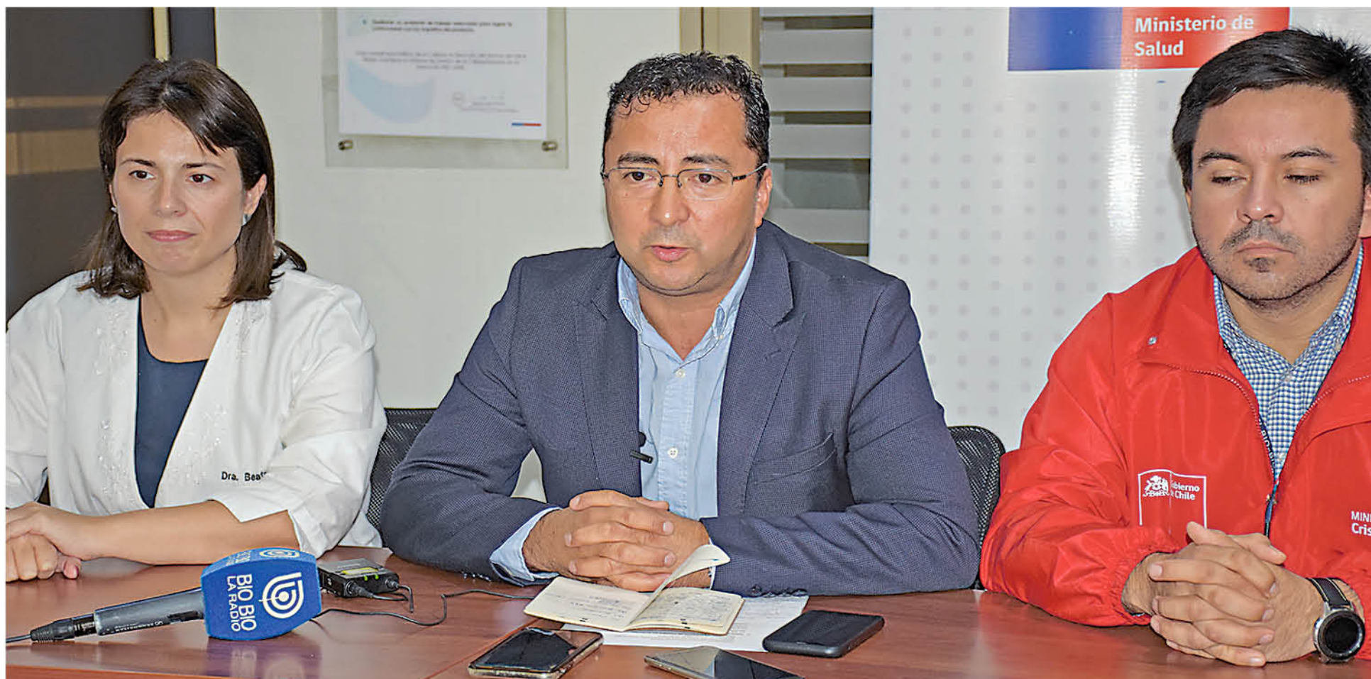
LA INFORMACIÓN FUE ENTREGADA por las autoridades de la salud en una conferencia de prensa.