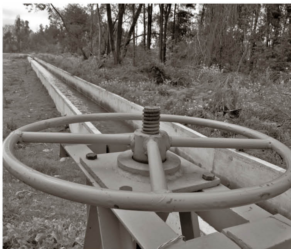
OBRAS DE TECNIFICACIÓN podrán ser financiadas en Biobío.

Es así como entre los meses de junio y noviembre, dependiendo de cada área, se podrá cumplir con las postulaciones, en el caso puntual de Biobío sobre tecnificación para las regiones con emergencia agrícola, al igual que las regiones de Valparaíso, Metropolitana, O'Higgins, Maule y Ñuble.