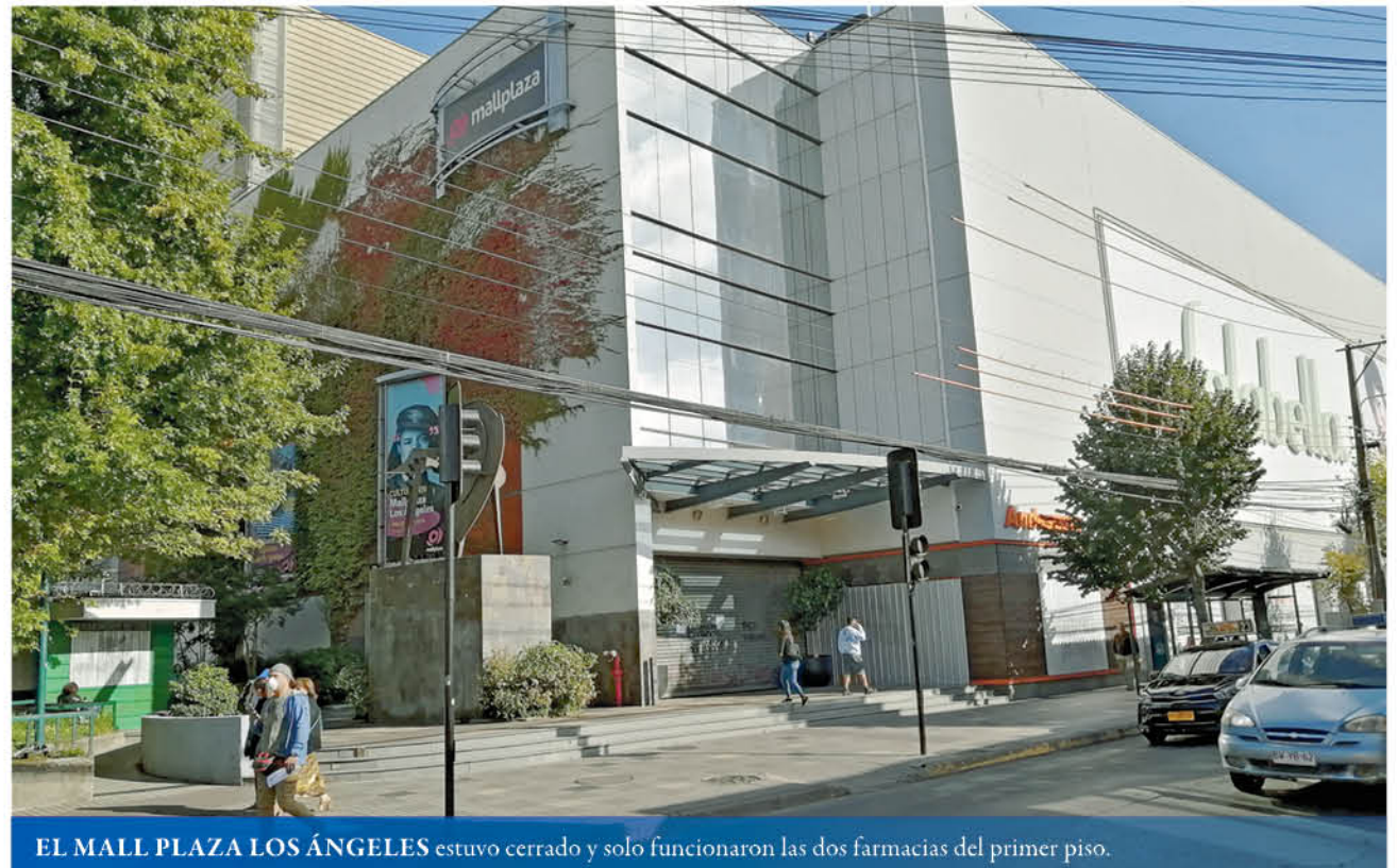
EL MALL PLAZA LOS ÁNGELES estuvo cerrado y solo funcionaron las dos farmacias del primer piso.

Pero ayer, 19 de marzo de 2020, el centro de la capital provincial parecía ser el esperable pero un día domingo cualquiera de febrero de hace 15 años. Pero las personas no se fueron en micro desde la avenida Ricardo Vicuña al río Huaqui a capear el calor ineluctable. No, porque tampoco ayer era un día de asueto. Ni tampoco hacía tanto calor. Ayer, en pleno día laboral, muchos permanecieron en sus casas, atendiendo los llamados de las autoridades a evitar las aglomeraciones, a rehuir de los grupos humanos numerosos para reducir las posibilidades de un eventual contagio. De hecho, entre el