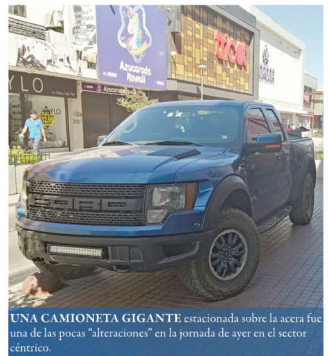
UNA CAMIONETA GIGANTE estacionada sobre la acera fue una de las pocas "alteraciones" en la jornada de ayer en el sector céntrico.

Los bancos atendían en grupos pequeños. Los clientes que iban llegando se apostaban a las afueras, esperando su turno. En una notaría de calle Caupolicán, un joven ataviado de un traje de protección que lo cubría enteramente, recomendaba a los usuarios que se agolpaban al lado afuera.