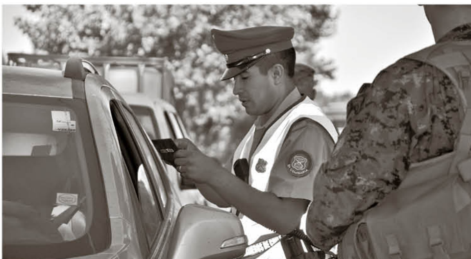
LA MEDIDA BUSCA que la gente no salga de sus casas y personas ajenas a la comuna que puedan ser portadoras del virus no entre.