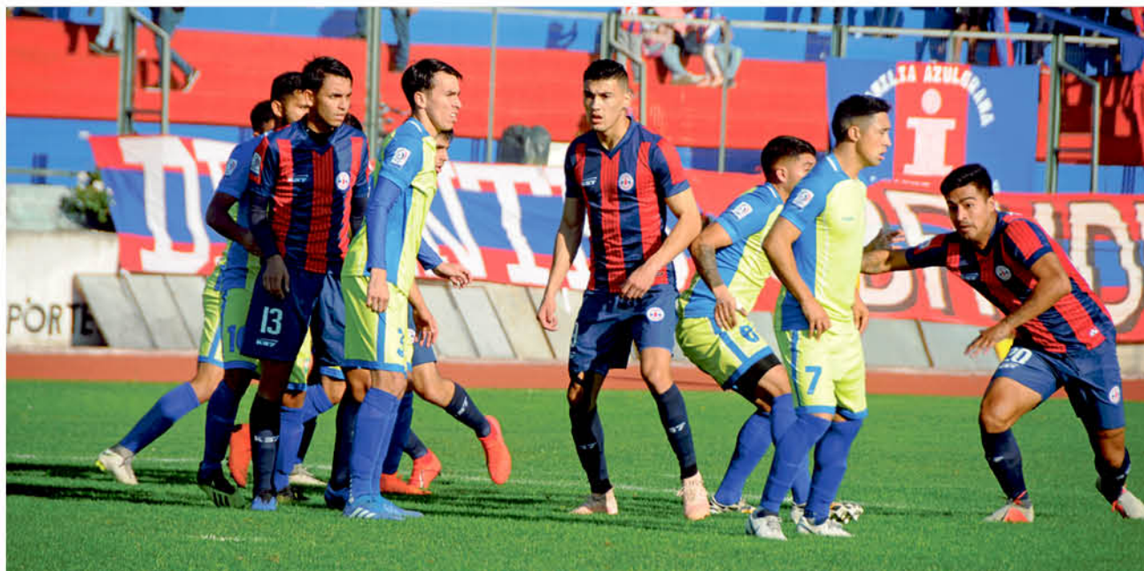
OTROS CLUBES QUE RECIENTEMENTE dejan sus entrenamientos para evitar la propagación del Covid-19 son Colchagua, Recoleta y Rangers entre otros.

Ante la publicación desde Comunicaciones azulgrana aseguran que se ha trabajado esta semana "sólo desde la casa" y que en relación la nota, conversaron con el matutino acordando que para la edición de este viernes deberán comunicar un desmentido o "de no ser así, nosotros emitiremos uno oficial".