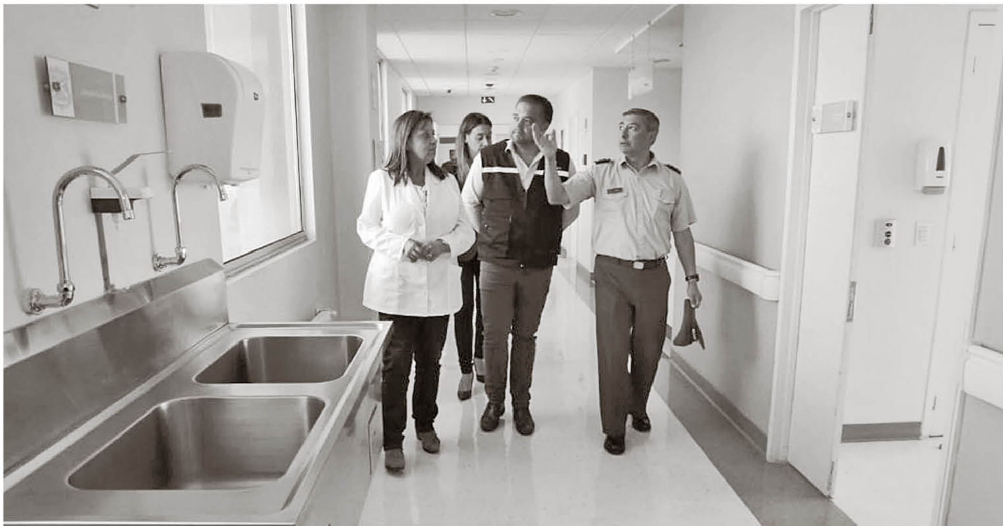
LAS GESTIONES DE LA DIPUTADA PÉREZ fueron fundamentales en la decisión del gobierno.

En paralelo, los diputados oficialistas del Distrito 21 pidieron no abandonar la legislación social y valoraron los anuncios en materia económica.