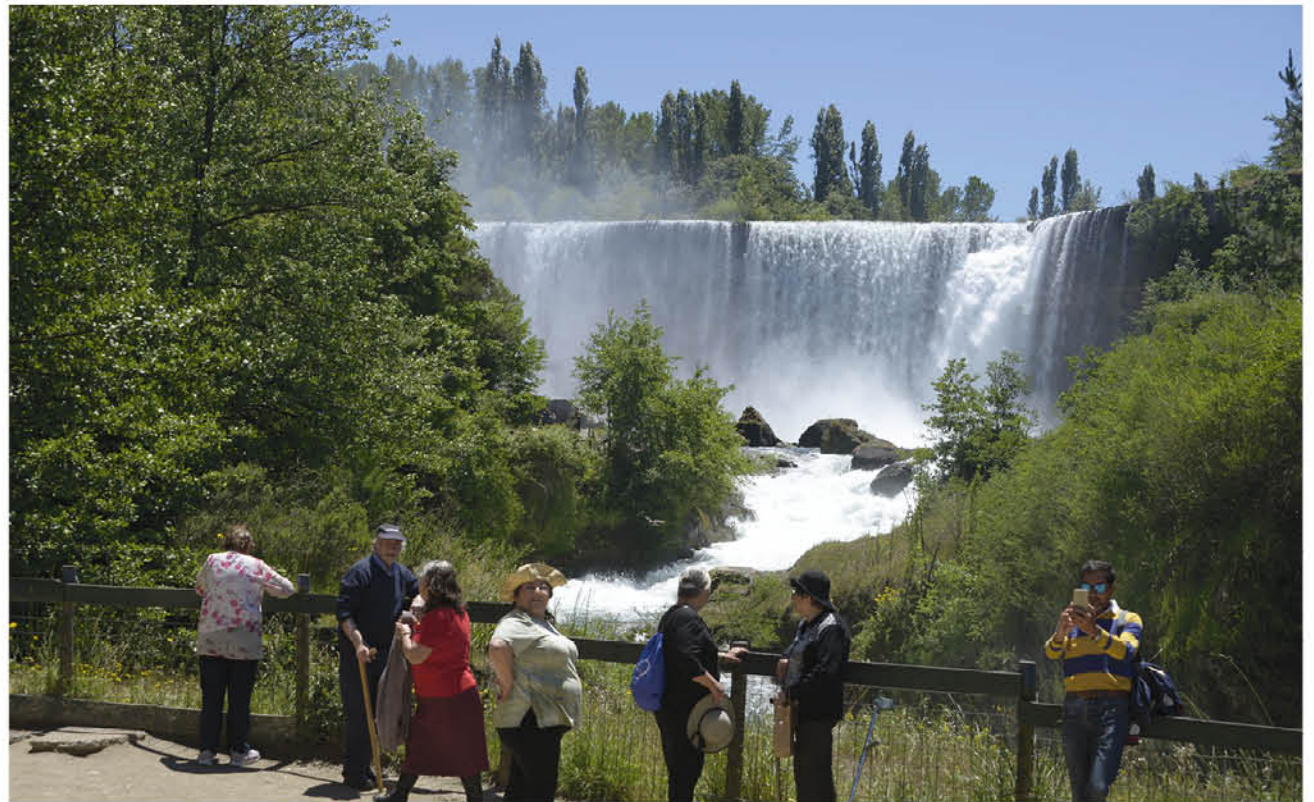
EL CONSEJO PÚBLICO PRIVADO de Turismo de Bío-Bío es un gremio sin fines de lucro, cuyo objetivo es velar, junto al apoyo de Sernatur, por el permanente desarrollo del sector Turismo y actividades afines en el ámbito provincial.

“NUESTRA INTENCIÓN COMO GREMIO ES PONER UN LLAMADO DE ATENCIÓN, porque consideramos que las medidas económicas que se están ofreciendo, si bien es cierto, se ven atractivas en las cifras y cantidades, en la práctica no están llegando a las Pymes”.