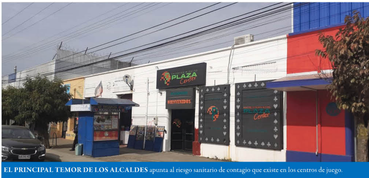
EL PRINCIPAL TEMOR DE LOS ALCALDES apunta al riesgo sanitario de contagio que existe en los centros de juego.