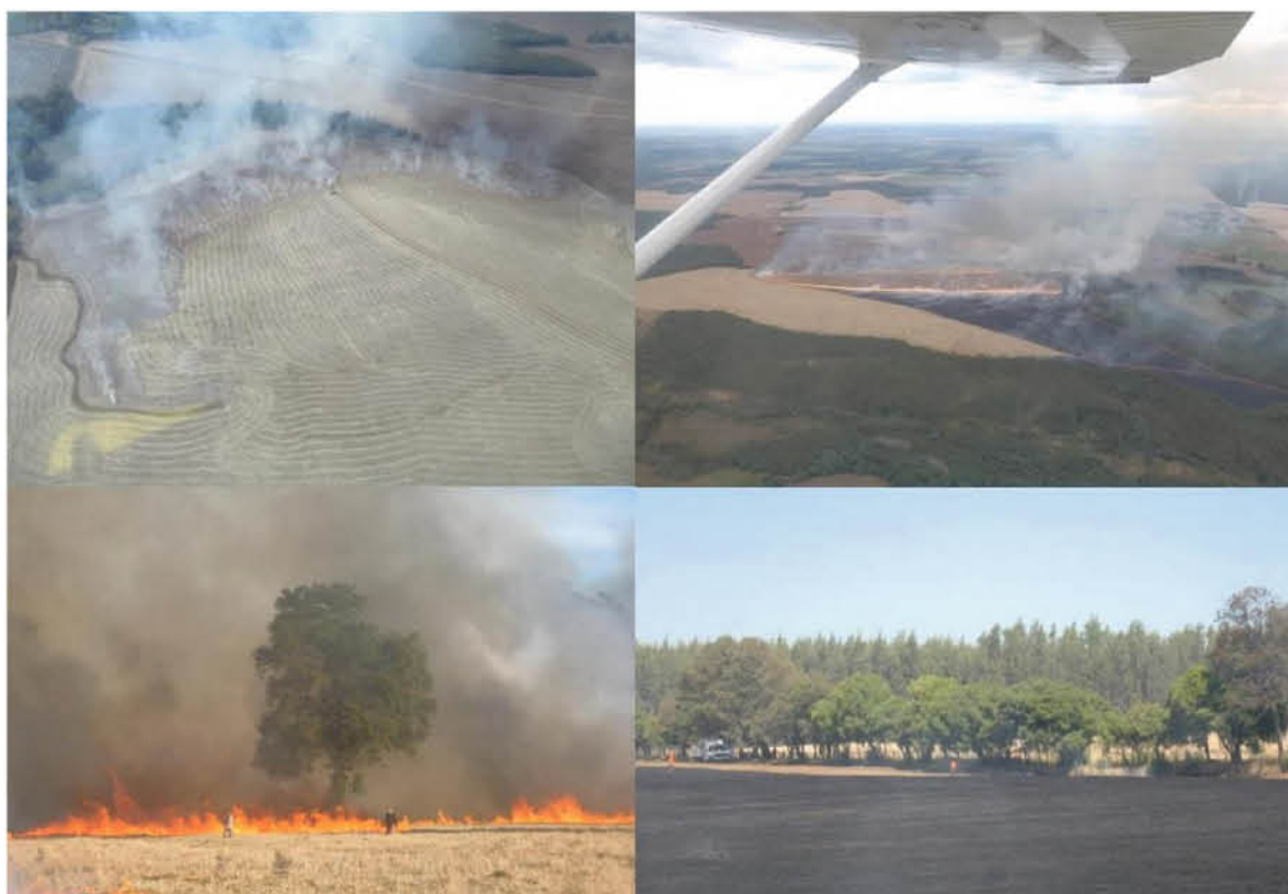
EN UN PERÍODO DE TRES HORAS se recibieron 16 solicitudes de permisos de autorizaciones de quema de la comuna de Tucapel, se informó en Conaf.