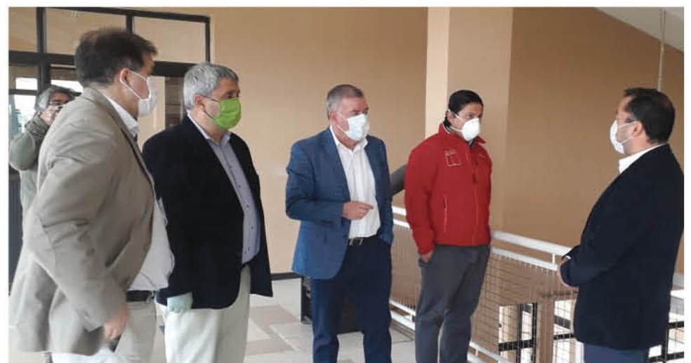
EN NACIMIENTO se centraron las actividades el día de ayer.