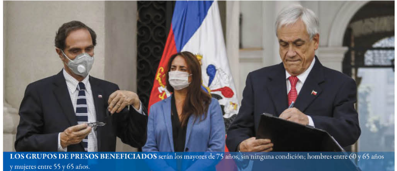
LOS GRUPOS DE PRESOS BENEFICIADOS serán los mayores de 75 años, sin ninguna condición; hombres entre 60 y 65 años y mujeres entre 55 y 65 años.

“La cifra ha ido incrementándose exponencialmente: dos oficiales, 22 funcionarios de planta que son suboficiales, dos civiles y nueve internos más contagiados”, detalló, agregando que hay 102 funcionarios de Gendarmería con coronavirus a nivel nacional, mientras que la población penal ya alcanza a las 32 personas, añadió.