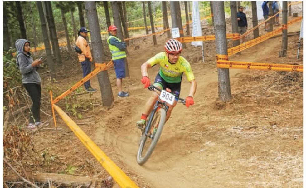
CON EL APORTE, Team Cicleskano recibirá una tricota nueva, y también ayuda para costear distintos gastos durante sus competencias.

Respecto a los entrenamientos junto a la actualidad del elenco, Sáez explicó que en este momento 17 cicleskano figuran en la lista del club y toman las medidas de resguardo en casa