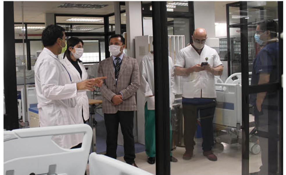
ACTUALMENTE SE REALIZA UNA RECONVERSIÓN de camas para responder a la contingencia en el hospital de Los Ángeles.