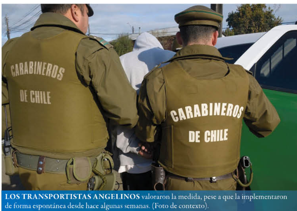
LOS TRANSPORTISTAS ANGELINOS valoraron la medida, pese a que la implementaron de forma espontánea desde hace algunas semanas. (Foto de contexto).

Así, el control se puede realizar de forma aleatoria sobre micros, buses interurbanos y rurales, colectivos, taxis, biotrán, transporte aéreo, entre otros medios; cuyo incumplimiento está sancionado dentro del Código Sanitario, con