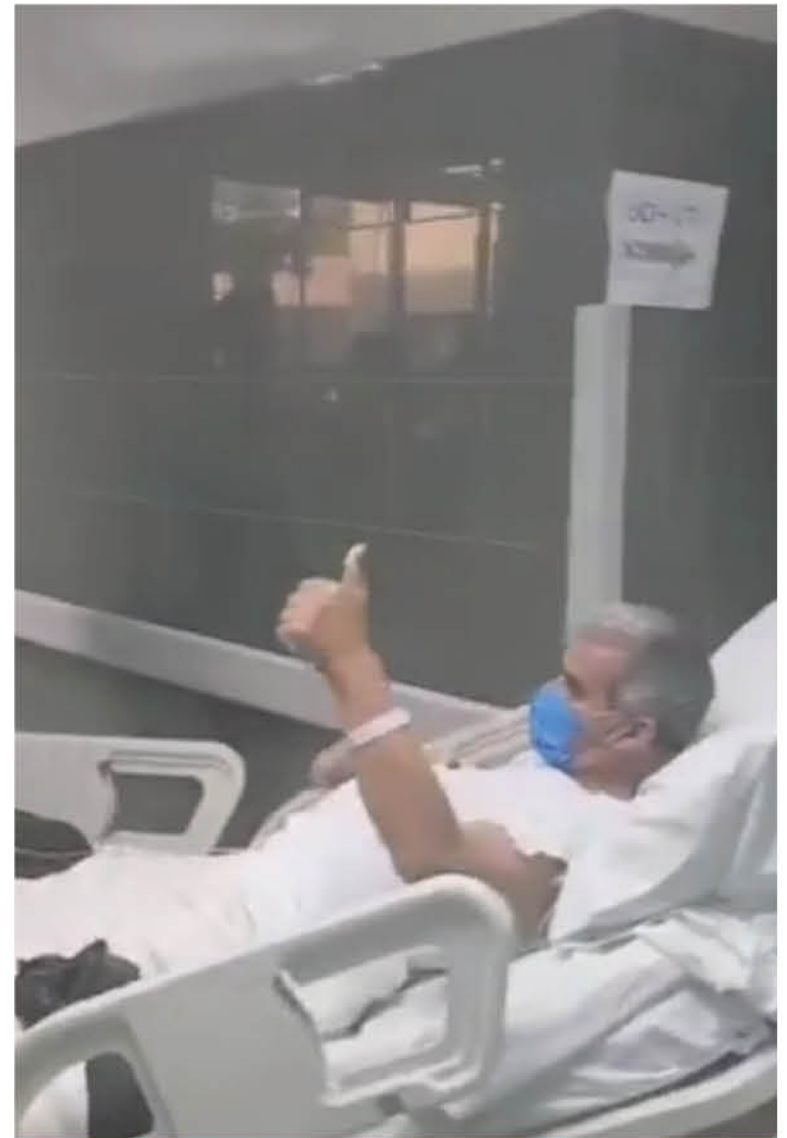
ENTRE APLAUSOS SALIÓ de la Unidad de Paciente Crítico el hombre de Laja, noticia que dio a conocer su familia a través de un video que circula por redes sociales.