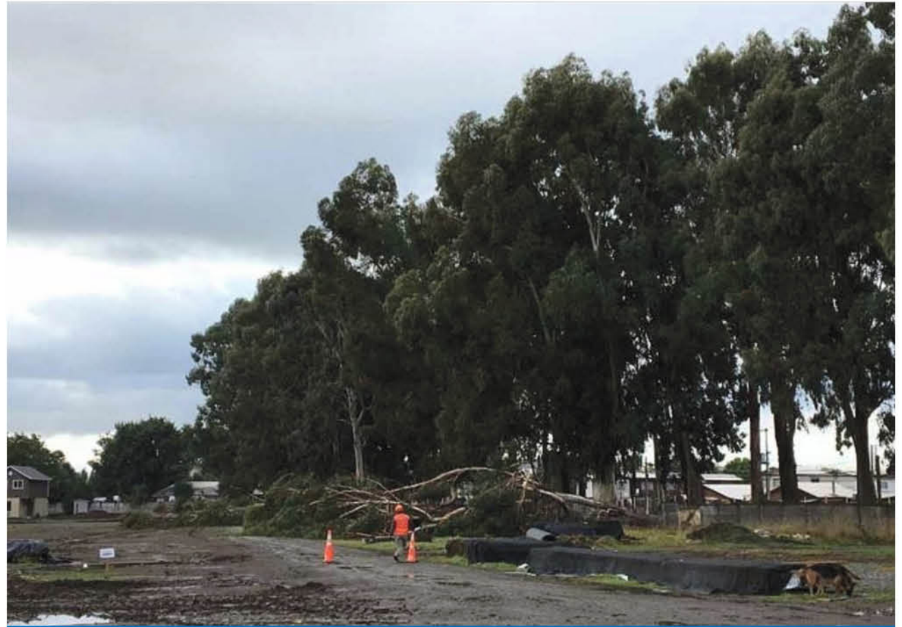
LA ESPECIALISTA COMENTÓ que deberían existir soluciones alternas como “que van a replantar en un futuro con árboles de especies nativas entre otros”.

De todas formas, aseguró que quitar muchos árboles es complicado ya que “lo que más se necesita hoy en el sector urbano son los árboles”, enfatizando lo impor-