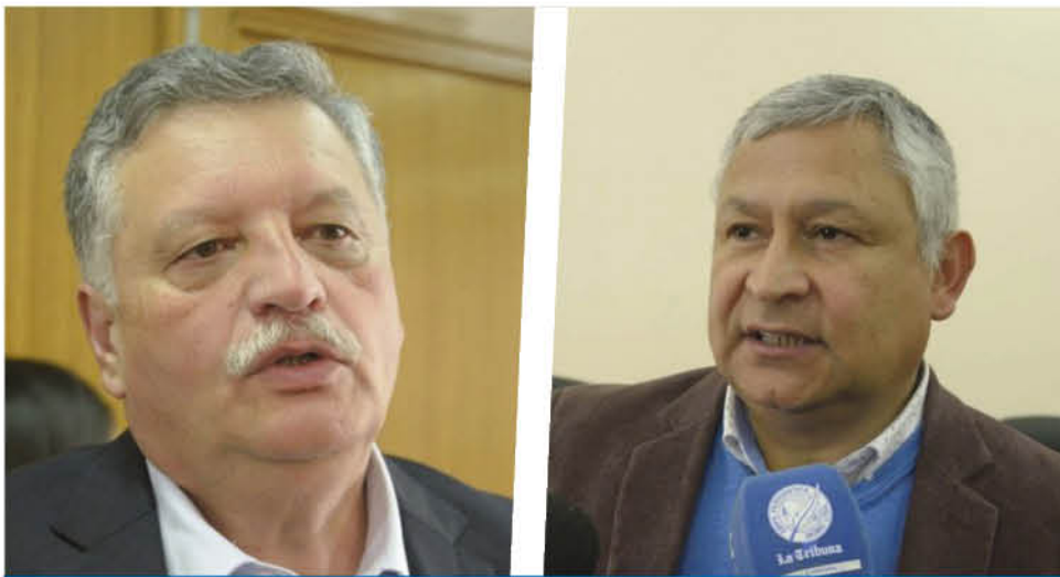
KRAUSE Y MELO LLAMARON A LA COMUNIDAD a respetar las medidas restrictivas de desplazamiento de cara al fin de semana largo.