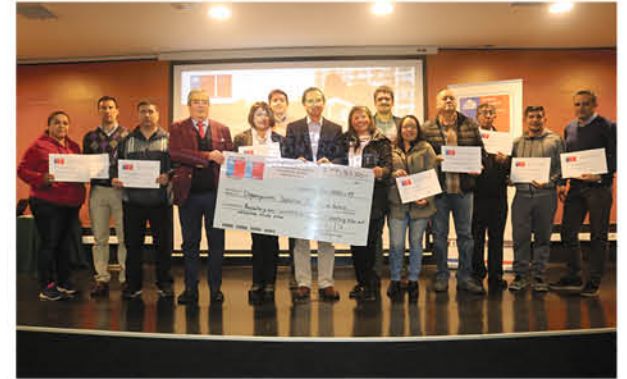
LA PROVINCIA DE BIOBÍO fue la más beneficiada con proyectos a nivel regional durante el 2019. Los Ángeles lideró el ranking adjudicándose 13 proyectos.