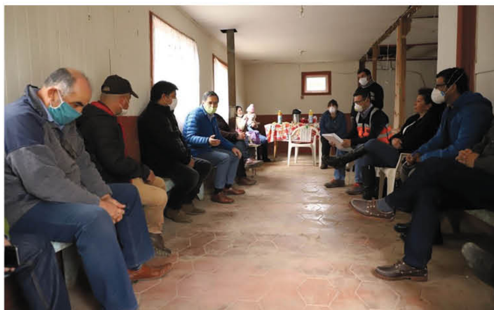
EL PROYECTO PERMITIÓ que los bureanos cuenten con 515 millones de pesos para hacer el estudio de pavimentación.

En total, se entregaron 515 millones de pesos que permitirán modernizar 2,9 kilómetros entre la localidad rural y el centro urbano del Bureo.