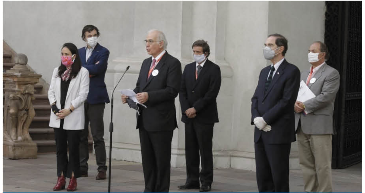
CMPC OFICIALIZÓ EL APOORTE A NUEVE HOGARES del Servicio Nacional de Menores (Sename) que consta de diversos insumos de cuidado, higiene, y protección personal.

Por otro lado, CMPC continúa con las labores de desinfección de calles, espacios recreativos, paraderos de buses, accesos