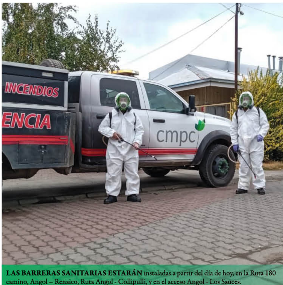
LAS BARRERAS SANITARIAS ESTARÁN instaladas a partir del día de hoy, en la Ruta 180 camino, Angol - Renaico, Ruta Angol - Collipulli, y en el acceso Angol - Los Sauces.

pertenecientes al Servicio Nacional del Adulto Mayor. Esta iniciativa es una ayuda muy importante para nosotros, ya que ellos son la población de riesgo del coronavirus". Las jornadas de sanitización se estarán realizando durante los próximos 7 días, en los principales sectores de la comuna, además de los operativos en los 3 cordones preventivos habilitados junto al municipio y Carabineros para sanitizar todos los vehículos que ingresan a Angol.