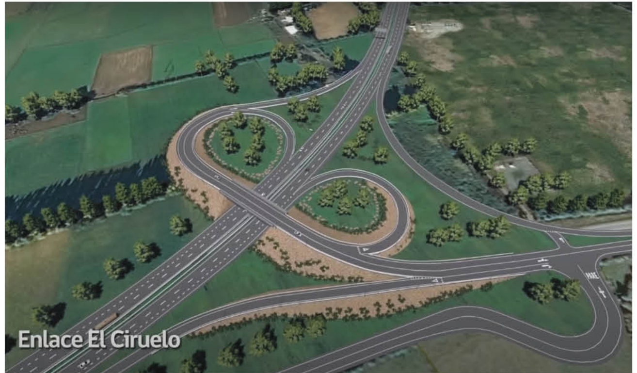
UNA CAPTURA DE PANTALLA DEL VIDEO elaborado por el MOP que muestra el enlace vial que se construirá en el sector El Ciruelo-cruce Santa Fe.