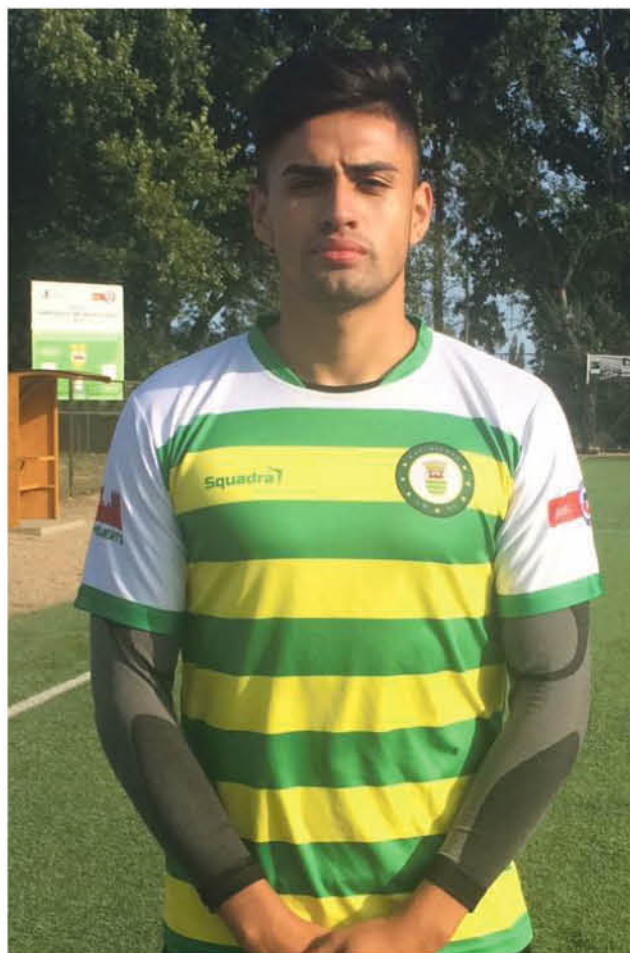
EL PORTERO CONTINÚA con un férreo entrenamiento en casa al igual que todo el plantel del “Fuerte”.

Para cerrar, el jugador del cuadro alfarero manifestó que tras el contacto con el “astro” nacional de la portería tiene más esperanzas de llegar lejos en su carrera, gracias a las palabras de un portero que también comenzó sin grandes lujos dentro de la cancha.