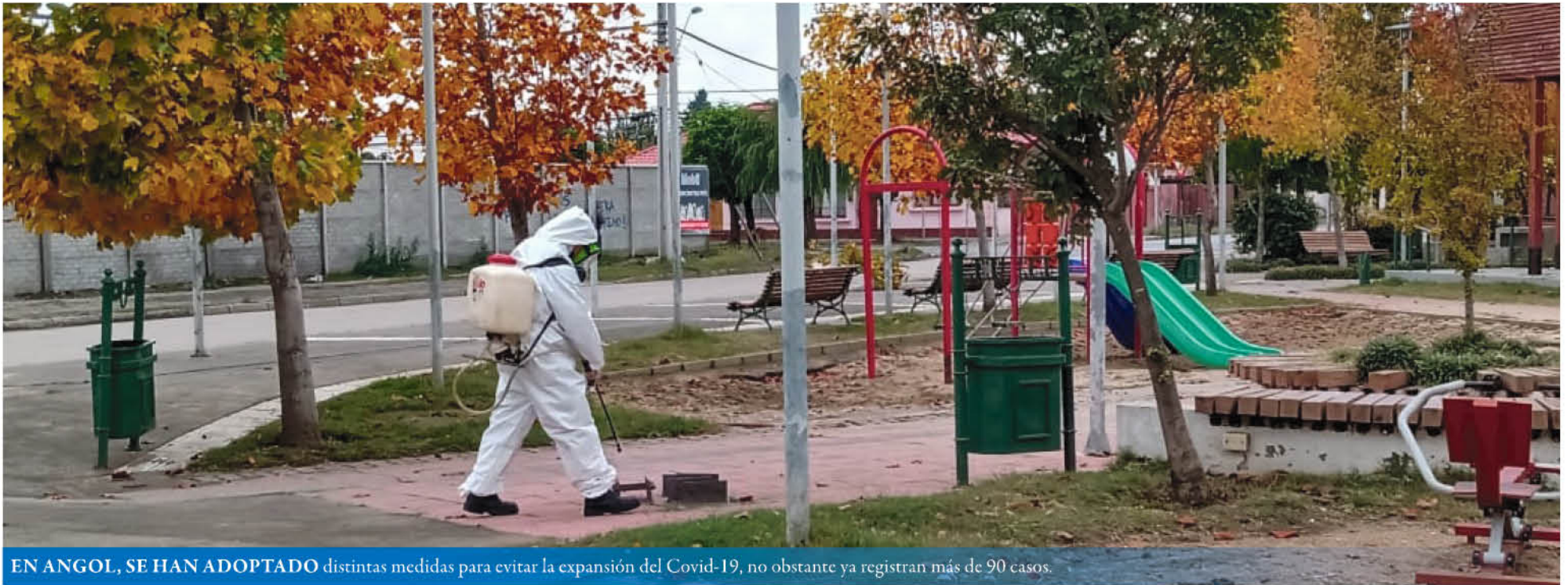
EN ANGOL, SE HAN ADOPTADO distintas medidas para evitar la expansión del Covid-19, no obstante ya registran más de 90 casos.

La medida responde a la alta cantidad de contagios que presenta la capital provincial de Malleco.