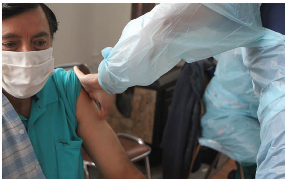
EN APOYO A ESTA INICIATIVA, la Pastoral Social Cáritas, gestionó la vacunación para personas en situación de calle y para los voluntarios.

A raíz de la contingencia, están atendiendo de lunes a viernes, y aunque son 25 voluntarios, atienden en turnos de cinco.