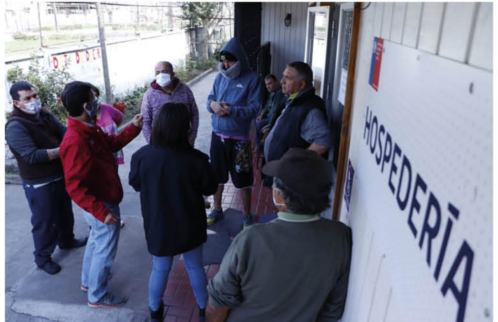
DE FORMA PARALELA SE EJECUTARÁN TRES RUTAS: Protege, Social, y Médica, adaptadas a los requerimientos sanitarios actuales.