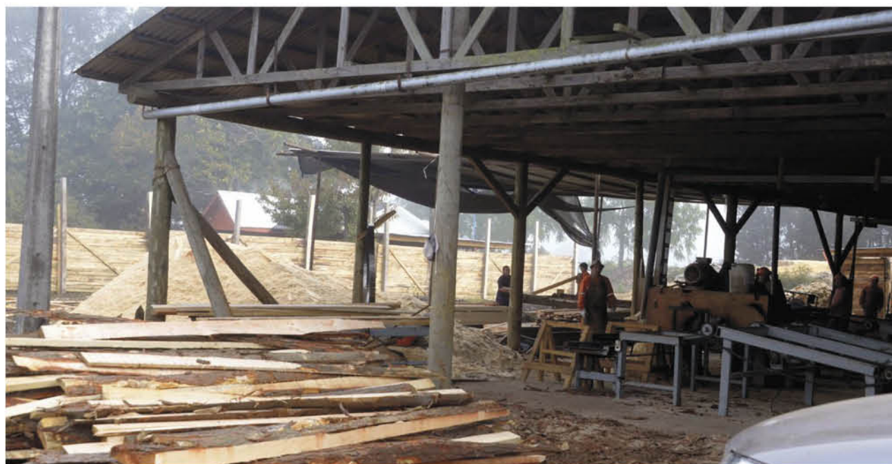
LOS DIRIGENTES GREMIALES argumentan que la situación sigue siendo complicada para muchas empresas, industrias, oficinas y emprendedores debido al impacto que provoca en la actividad económica la crisis mundial.

Mientras que Esquerré manifestó que sería muy beneficioso para todos los aserraderos del país la mantención de la elimi-