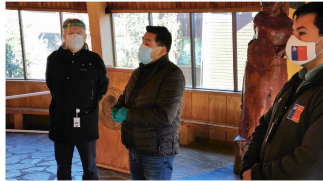
AL INTERIOR del municipio cordillerano se reunieron las autoridades, con el fin de evaluar la situación que afecta a las comunidades pehuenche.

no salgan de su primera residencia y que tampoco se realicen algunas prácticas, como la caza que se realiza en esta zona", detalló Vidal.