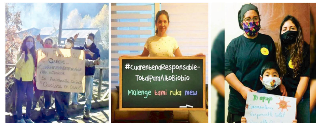
PESE A LA BAJA CONECTIVIDAD a internet que existe en la zona, muchos han hecho el esfuerzo de enviar sus imágenes en apoyo a la medida.