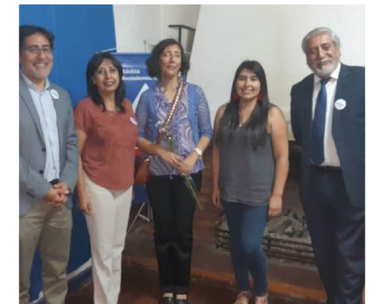
LA DC DE LOS ÁNGELES, también rechazó la votación del Senado.