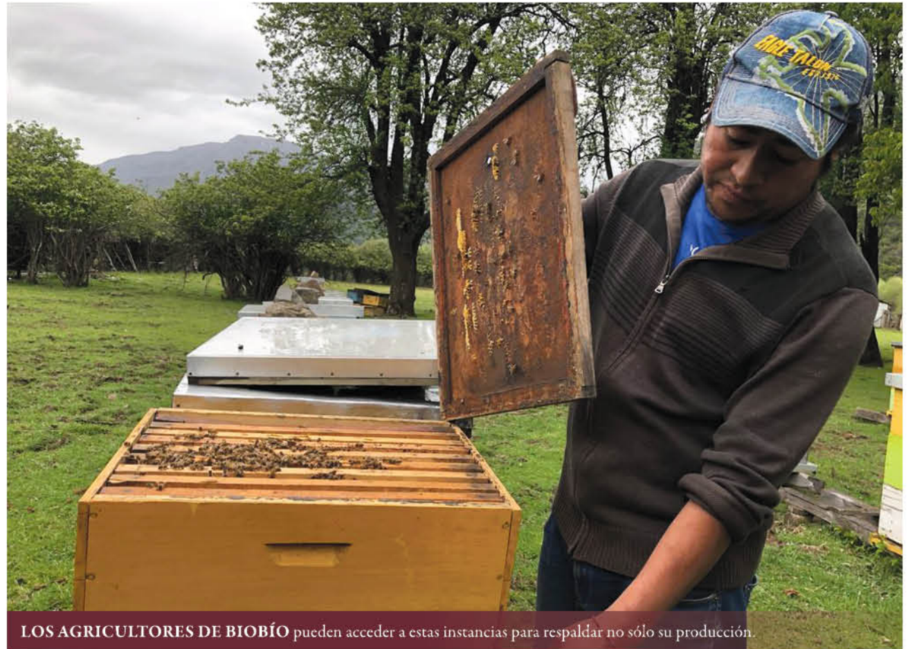
LOS AGRICULTORES DE BIOBÍO pueden acceder a estas instancias para respaldar no sólo su producción.

“Se trata de proteger a los agricultores de las pérdidas económicas que provocan los daños ocasionados por los eventos climáticos, eventos de la naturaleza y enfermedades, permitiéndoles recuperar el capital de trabajo invertido y de esta forma mejorar su estabilidad financiera permitiendo la continuidad del agricultor y su grupo familiar en