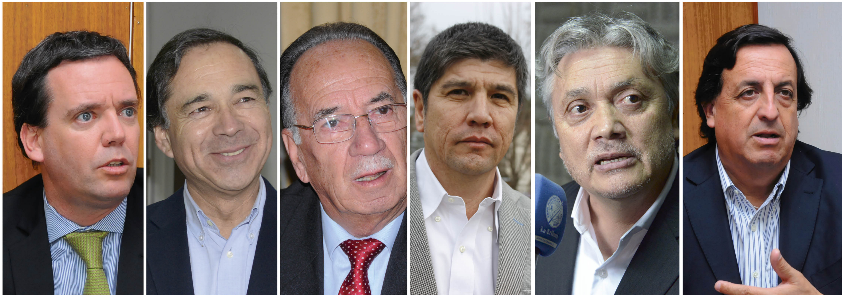
Iván Norambuena, diputado.

"Los dueños de la democracia en cualquier país son los ciudadanos. Son los mandantes, a quienes representamos los diputados y lo senadores y el mandato de la ciudadanía, en este ámbito es muy claro, muy nítido".