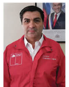
Francisco Lagos, seremi de Agricultura.

“El objetivo de los seguros para el agro es proteger a los agricultores de las pérdidas económicas que provocan los daños ocasionados por los eventos climáticos, eventos de la naturaleza y enfermedades”.