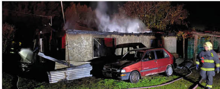
UN ASPECTO DEL INCENDIO ocurrido en el camino a Santa Clara.

Al respecto, la Dirección de Desarrollo Comunitario de Los Ángeles, además de informar que parte de su trabajo se ha concentrado en apoyar a este grupo etéreo, en la comuna se cuentan más de mil personas mayores de 75 años. De ese total, más de 3 mil viven solos.