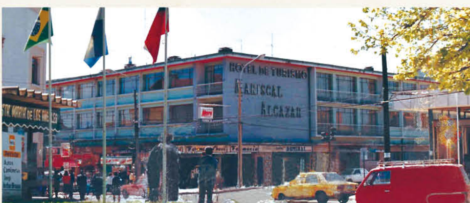
Un hotel que no funciona desde 2010 lleva el nombre del Mariscal Alcázar. También la avenida del sector poniente.