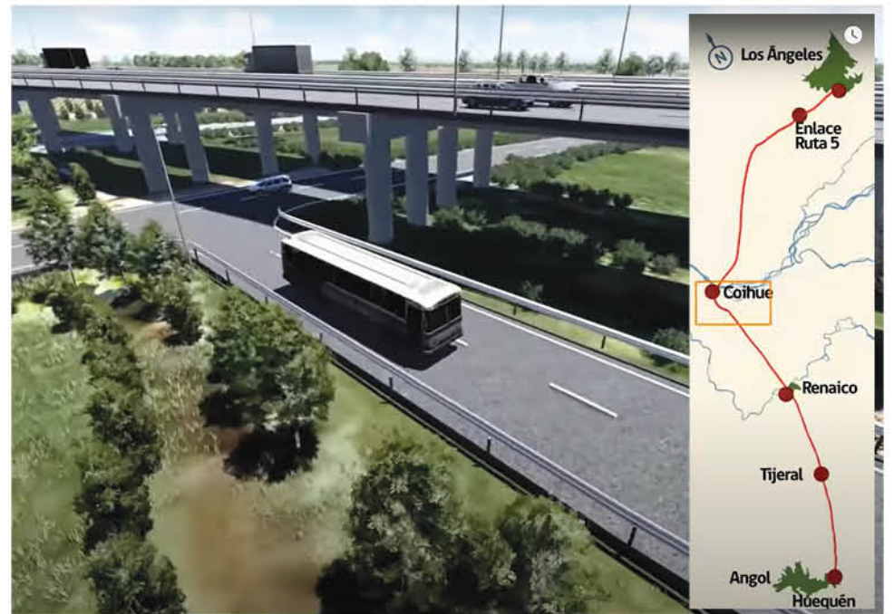
UN ASPECTO DE LA FUTURA AUTOPISTA NAHUELBUTA en su paso por la localidad de Coigüe (captura del video institucional del Ministerio de Obras Públicas).