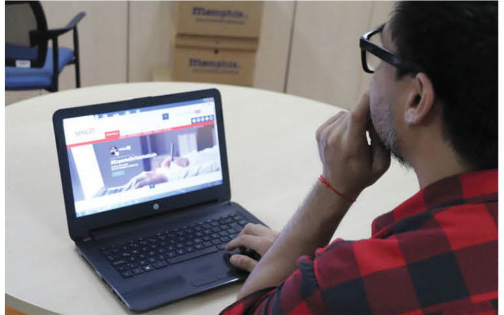
CON ESTOS NUEVOS 10 CURSOS la oferta gratuita llega a los 79 talleres para los que quieran aprender y reinventarse.

Aliaga también entregó las cifras locales y dijo que “este 2020 van más de 10 mil inscritos en nuestros cursos en línea en el Biobío y sumando 2019-2020 la cifra se eleva a 19.003 personas”.