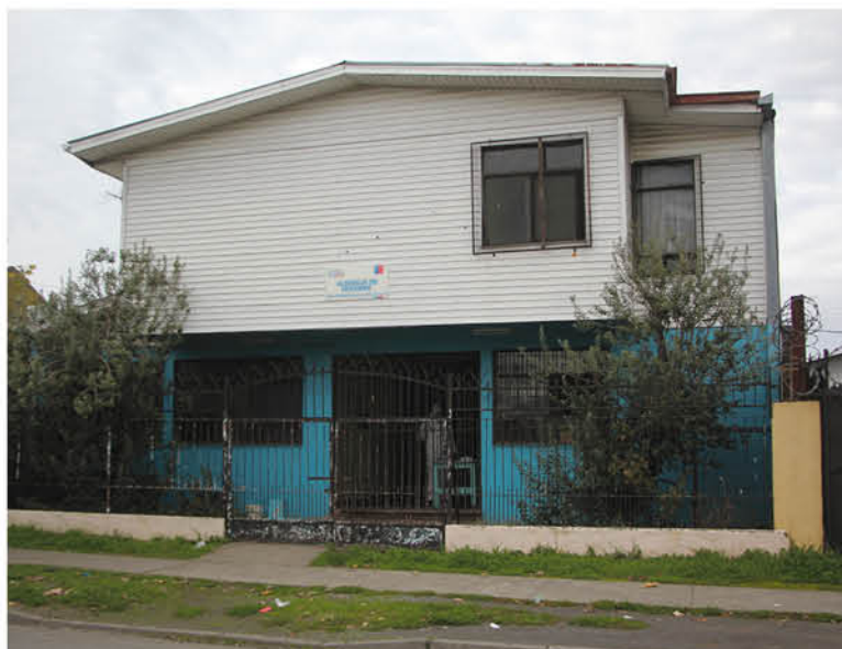
El albergue municipal tiene capacidad para veinte personas, y su apertura se prolonga por 24 horas.

La iniciativa tiene una duración de 122 días, es decir, aproximadamente cuatro meses y está ubicada en Bulnes 746.