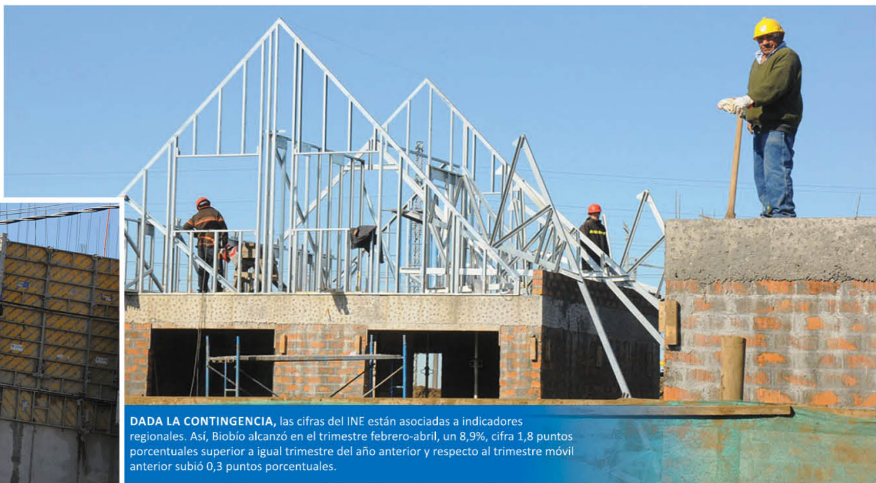
DADA LA CONTINGENCIA , las cifras del INE están asociadas a indicadores regionales. Así, Biobío alcanzó en el trimestre febrero-abril, un 8,9%, cifra 1,8 puntos porcentuales superior a igual trimestre del año anterior y respecto al trimestre móvil anterior subió 0,3 puntos porcentuales.

de mano de obra. Especialistas del mismo Banco Central y de la Universidad de Chile pronostican una tasa de desempleo del 14% para el mes de junio".