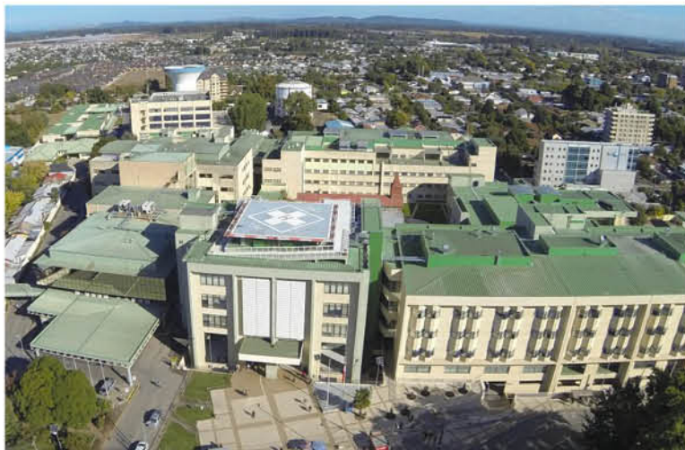
ESTAS TRES SITUACIONES fueron comunicadas por el propio recinto asistencial, poniendo énfasis en que se hace "en el marco de la política de transparencia que siempre hemos tenido como equipo directivo".

El Complejo Asistencial angeliño, confirmó que un paciente de Diálisis resultó positivo a Covid-19, "situación que alertó de inmediato a los equipos de esta unidad y a la Seremi de Salud, quien se encuentra realizando la trazabilidad de los posibles contactos estrechos que pudo tener este paciente".