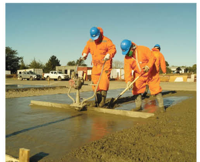
UNA VISTA DE LA INSTALACIÓN DE FAENAS de la empresa a cargo de la construcción de la Autopista Nahuelbuta.

¿El inicio de las obras? A fines de este año 2020. La inversión para su ejecución supera los 200 millones de dólares y permitirá la contratación, en su peak, de hasta 600 trabajadores. En ese punto, los asistentes pusieron acento en lo importante que será para absorber el fuerte incremento de la cesantía, a consecuencia de la pandemia del coronavirus.