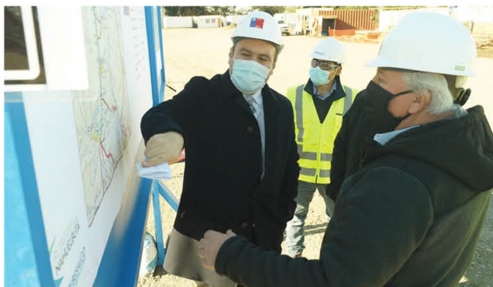
LAS AUTORIDADES se interiorizaron de los detalles de la obra.