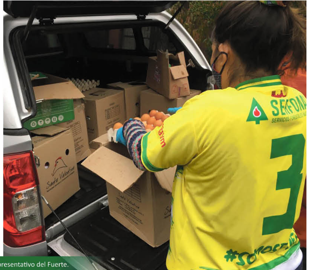
LA COMUNIDAD DE NACIMIENTO recibió con gran alegría el aporte del equipo representativo del Fuerte.

El equipo quiso retribuir a la comunidad el apoyo que cada domingo se hace presente en las galerías del estadio municipal.