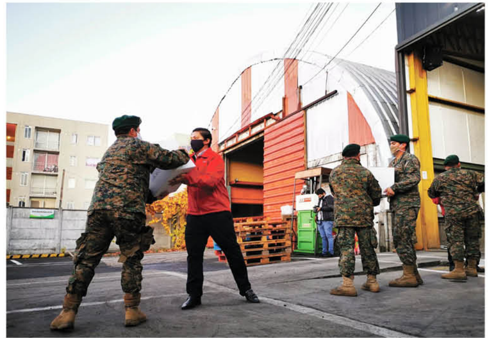
PERSONAL DE LA GOBERNACIÓN DE BIOBÍO, de los municipios y del Ejército, han colaborado en la entrega de ayudas durante los últimos días.

A raíz de lo anterior, tanto los funcionarios como la comunidad, que rápidamente se enteraron del hecho, comenzaron a