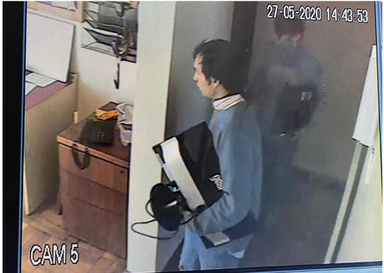
UNO DE LOS AUTORES del último robo perpetrado a bomberos.

En abril, un delincuente aprovechó que los bomberos debieron acudir a un accidente de tránsito