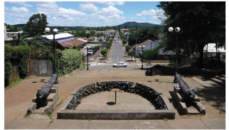
TODOS LOS CONTACTOS ESTRECHOS de las personas afectadas fueron enviados a cuarentena preventiva.

“Lamentablemente, no podemos garantizar que no tendremos más contagios, pero sí les podemos asegurar que no descansaremos en combatir esta crisis sanitaria y social que afecta al mundo, país y nuestra gente”, concluye el escrito.