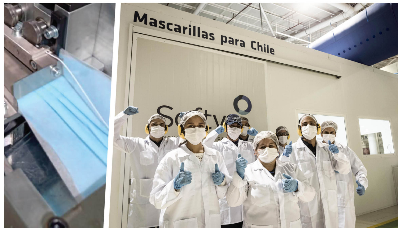
CADA MÁSCARILLA CUMPLE con los máximos estándares internacionales.

Pero la necesidad de contar con este insumo no sólo se da en Chile sino también en varios países de América Latina. Por esa razón CMPC ya adquirió y se encuentran en proceso de