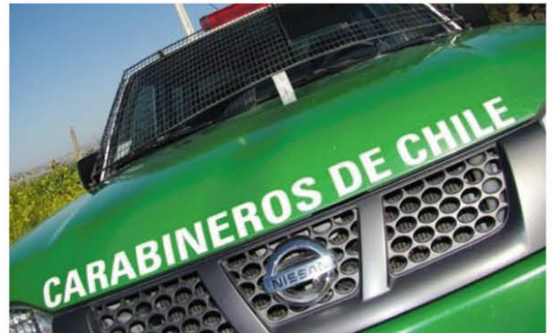
Fotografía de contexto.

Así lo dio a conocer el prefecto de Carabineros de Biobío, Coronel Luis Rozas, quien añadió que "el mando de dicho estamento adoptó el procedimiento legal y administrativo de rigor, el cual se encuentra en estos momentos en desarrollo".