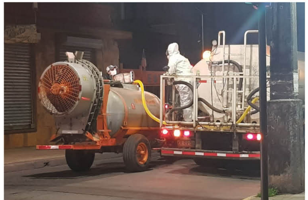
DE TODAS LAS LABORES desarrolladas hasta ahora, esta ha sido la de mayor despliegue en Los Ángeles.