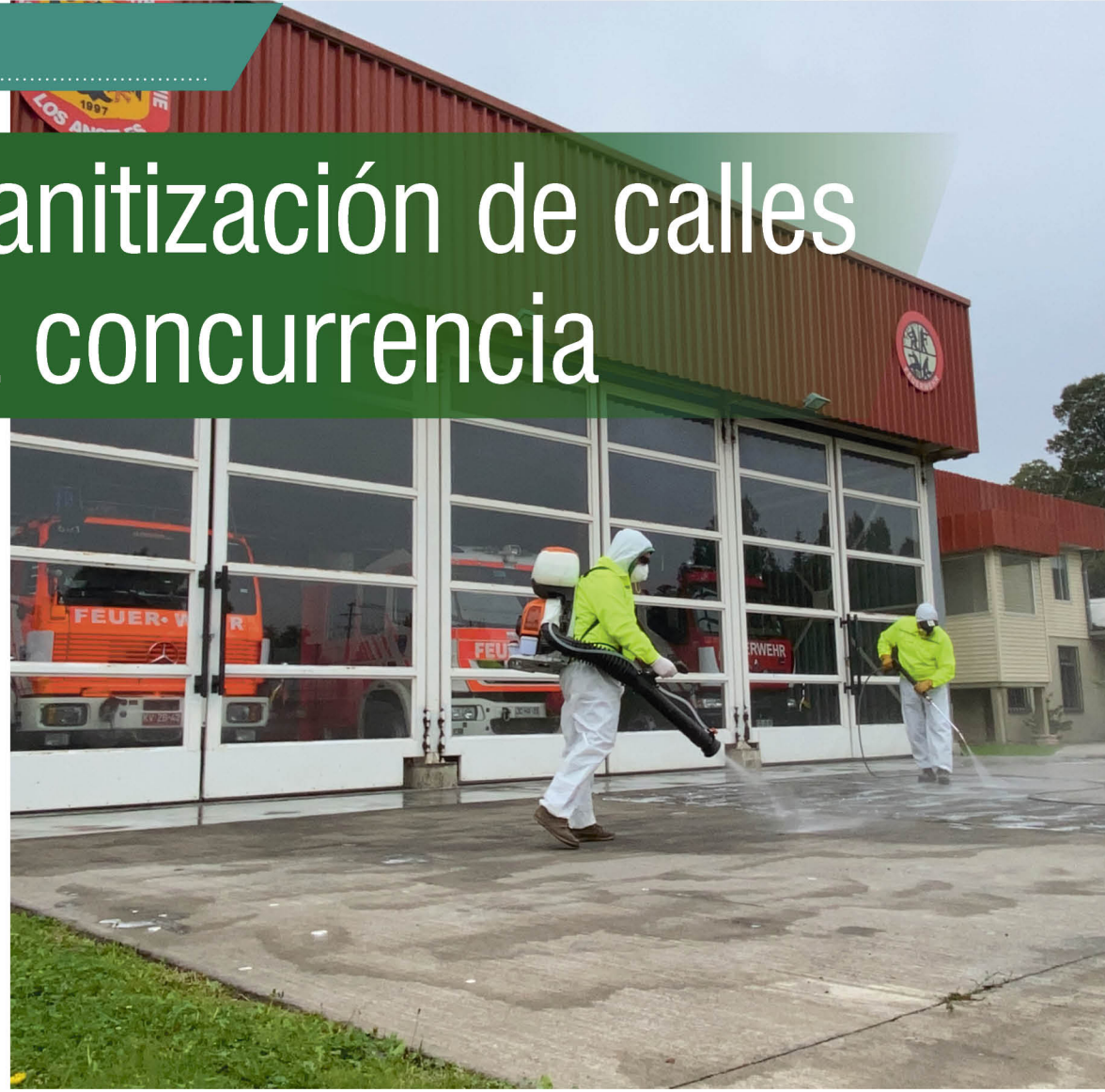
amigables con las personas y el medio ambiente.

Como una forma de ayudar a la prevención de contagio con Covid-19, CMPC ha apoyado las medidas sanitarias en las comunas de Nacimiento, Laja, Los Ángeles y Mulchén (región del Biobío), Villa Mininco, Victoria en La Araucanía, entre varios otros sectores y localidades.