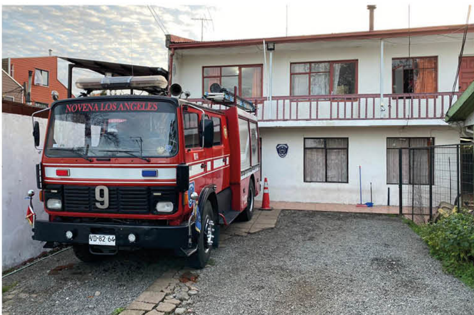
EL CUARTEL DE LA NOVENA COMPAÑÍA fue víctima de la delincuencia.

Por lo mismo, sostuvo que “para una compañía, es plata que en estos momentos es muy escasa porque sobrevivimos solo con los recursos que nos dan nuestras autoridades”.