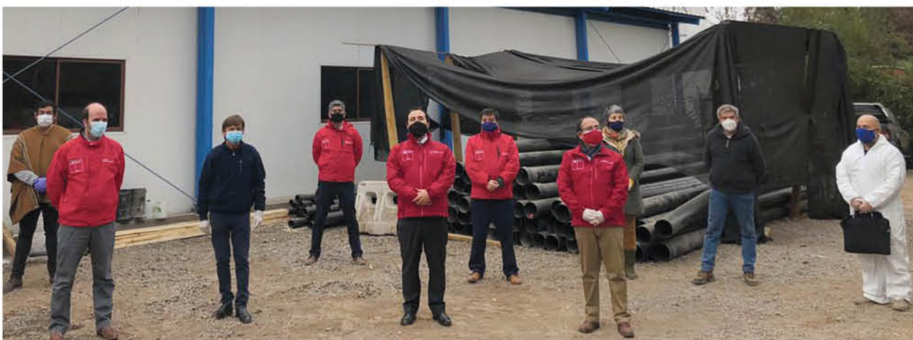
LA AYUDA SE GESTIONARÁ por los comités y beneficiará a sus usuarios, se precisó desde el MOP.

En promedio la ayuda, dependiendo del tamaño del sistema de APR, oscilará entre 300 y 560 mil pesos mensuales. De esta forma, a nivel nacional el bono mensual será en total de 1600 millones de pesos, acumulando durante los tres meses una inversión total de 4 mil 800 millones.