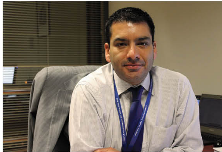
DESDE EL HOSPITAL ANGELINO aseguraron que la institución y sus equipos continúan trabajando para coordinar y garantizar las atenciones a la comunidad en este complejo escenario.