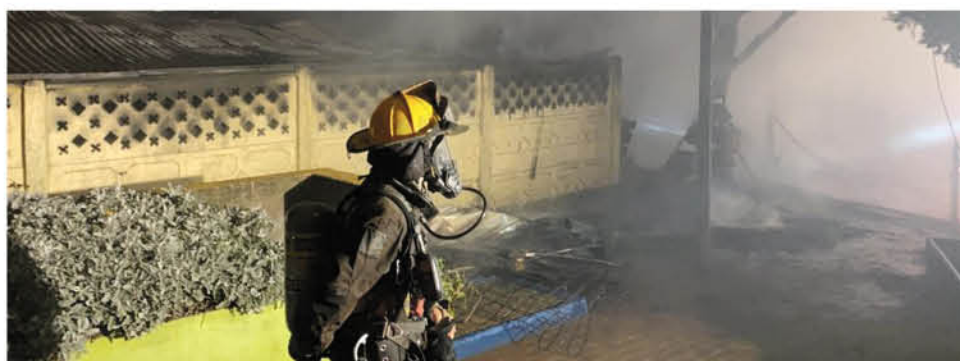
LA EMERGENCIA FUE ENFRENTADA por más de una treintena de voluntarios de cuatro compañías.

Las viviendas afectadas funcionaban como un cité, ya que varias familias ocupaban las habitaciones situadas al interior de ambas propiedades.