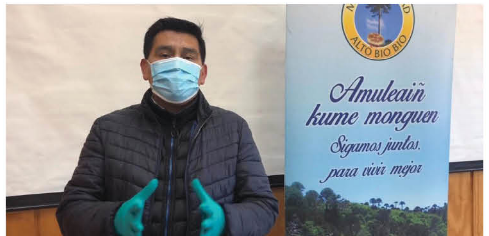
SE ESPERA QUE ESTE MIÉRCOLES DESDE EL MINSAL anuncien alguna medida más drástica para el territorio