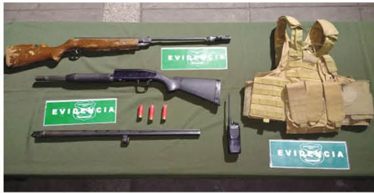
CARABINEROS INCAUTÓ EL ARMA UTILIZADA, así como un chaleco táctico, una radio portátil, dos cartuchos percutidos y uno sin percutir en la recámara de la escopeta.

Su detención se desarrolló en un complejo ambiente, donde una persona resultó herida y una turba atacó dos viviendas.