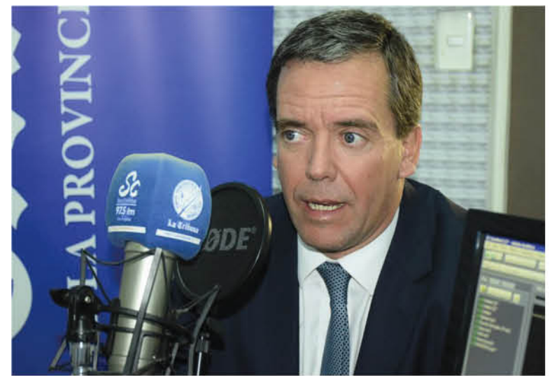
EL SENADOR SE PREGUNTA cómo se habla de descentralización eliminando herramientas tan importantes como las cifras de desempleo local.

Tras enterarse del tema y ser consultado al respecto por Diario