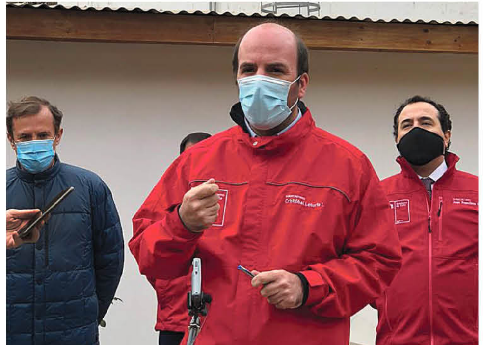
CRISTÓBAL LETURIA, MINISTRO (S) DEL MOP, entregó detalles acerca del plan que apoyará a los comités de Agua Potable Rural a lo largo del país.

En términos concretos, precisó que el aporte es el equivalente a 2 mil pesos por usuario de cada comité de Agua Potable Rural: “Si un sistema de APR tiene 500 personas, va a recibir un millón de pesos al mes por tres meses