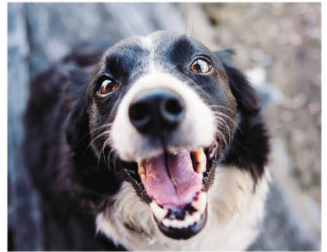
SEGÚN LAS INSTITUCIONES asociadas el proyecto de ley se erguiría contra los derechos de los animales.

Los firmantes de la carta explican que este boletín que se encuentra en el senado modificaría la actual Ley Cholito, que establece que "las ordenanzas municipales no podrán permitir la utilización de métodos que admitan el sacrificio de animales como sistema de control de la población animal. Esta prohibición se extiende a todos los servicios públicos, así como también a todas las organizaciones de protección animal".