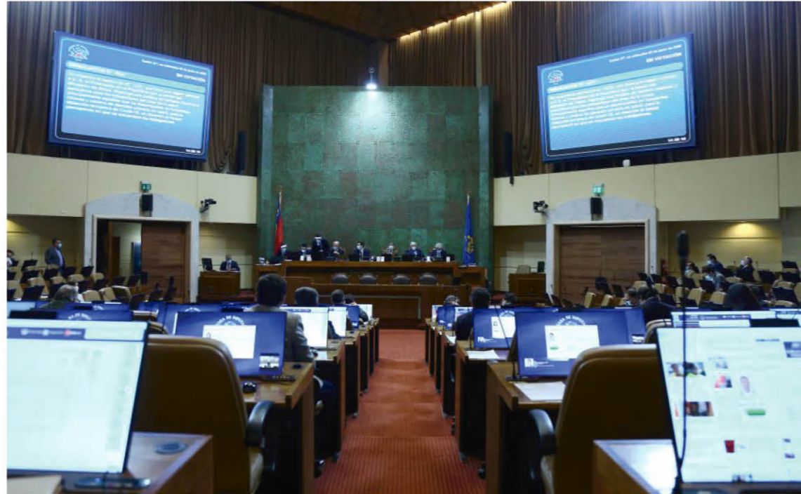
CON LA NUEVA LEY NUESTRA provincia perderá tres diputados y dos senadores.

Tras un intenso debate que registró seis votaciones separadas, los representantes distritales establecieron que "los diputados podrán ser reelegidos sucesivamente en el cargo hasta por dos periodos; mientras que los senadores podrán ser reelegidos sucesivamente en el cargo por un periodo. Para estos efectos, se entenderá que los diputados y senadores han ejercido su cargo durante un periodo cuando han cumplido más de la mitad de su mandato".