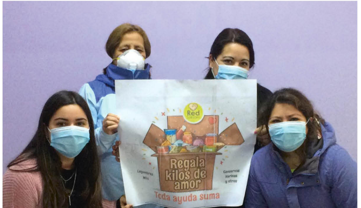
LA CAMPAÑA ESTÁ EN DESARROLLO en Los Ángeles con la finalidad de ir en ayuda de las familias que se han visto afectadas en medio de la crisis sanitaria.

principalmente con leche, legumbres y conservas “que son alimentos que están disminuidos en las cajas que entrega el gobierno. Por supuesto que si la comunidad quiere aportar con otro tipo de donación, también