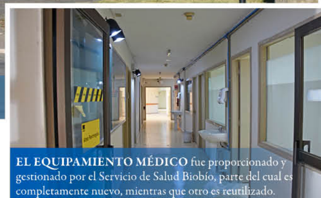
EL EQUIPAMIENTO MÉDICO fue proporcionado y gestionado por el Servicio de Salud Biobío, parte del cual es completamente nuevo, mientras que otro es reutilizado.