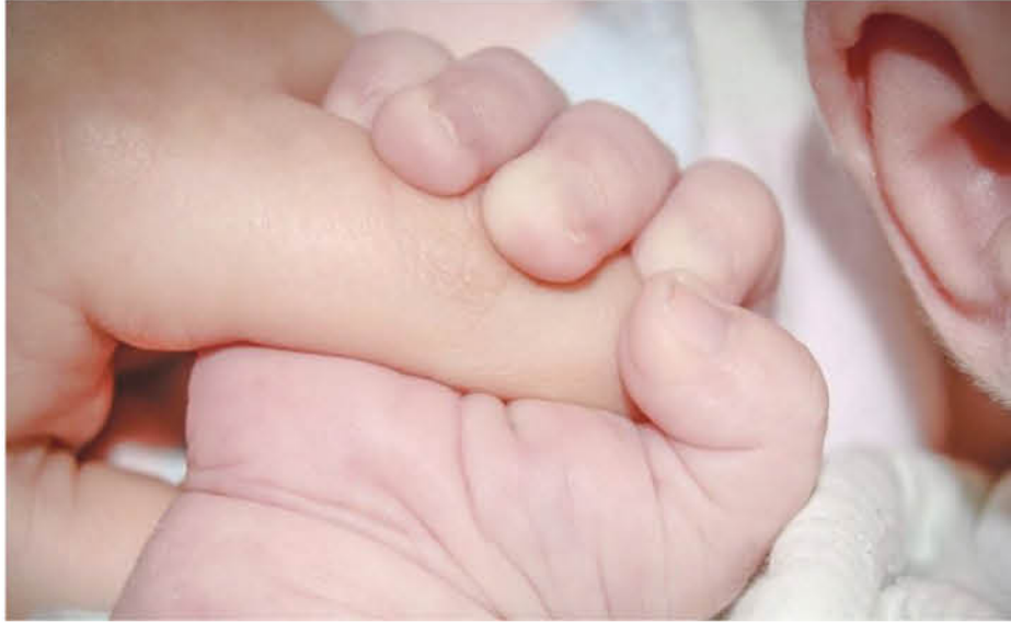
(Fotografía de contexto)

La Seremi de Salud de Valparaíso confirmó que una lactante de 10 meses falleció en el Hospital San Agustín de La Ligua, producto de Covid-19.