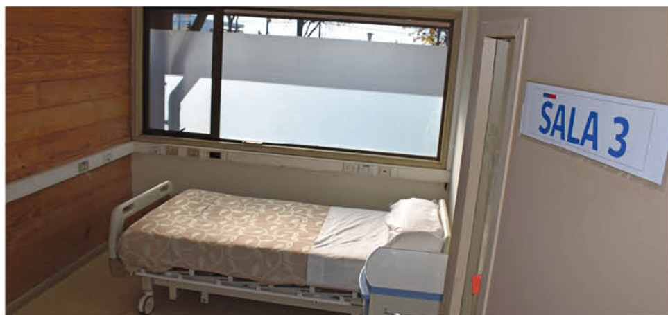
LAS HABITACIONES DISPUESTAS en distintas alas, tienen capacidad para 1, 2, 3 y 4 personas, las que se destinarán de acuerdo a la complejidad de los pacientes.

Tras la firma del convenio que comenzó a regir desde el 1 de junio, las dependencias ya están en condiciones de recibir pacientes, no sólo de la provincia de Biobío, sino de cualquier parte del país, ya que el recinto queda a disposición de la Unidad de Gestión Centralizada de Camas del Minsal.