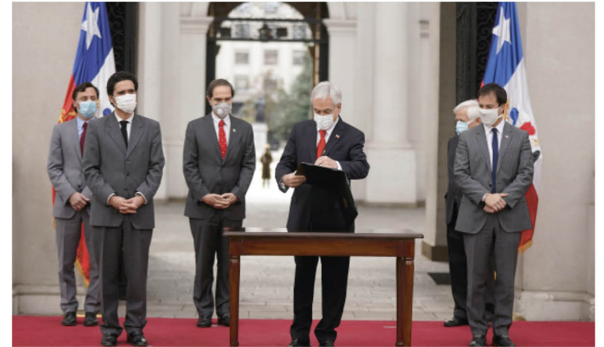
LOS DIPUTADOS FISCALIZARÁN el rol del Ejecutivo y todas las medidas tomadas por la Pandemia para enfrentar al Covid-19.

Así, se explica que "la primera instancia, aprobada en la ocasión por 77 votos a favor, 62 en contra y 11 abstenciones, se fijó como objetivo