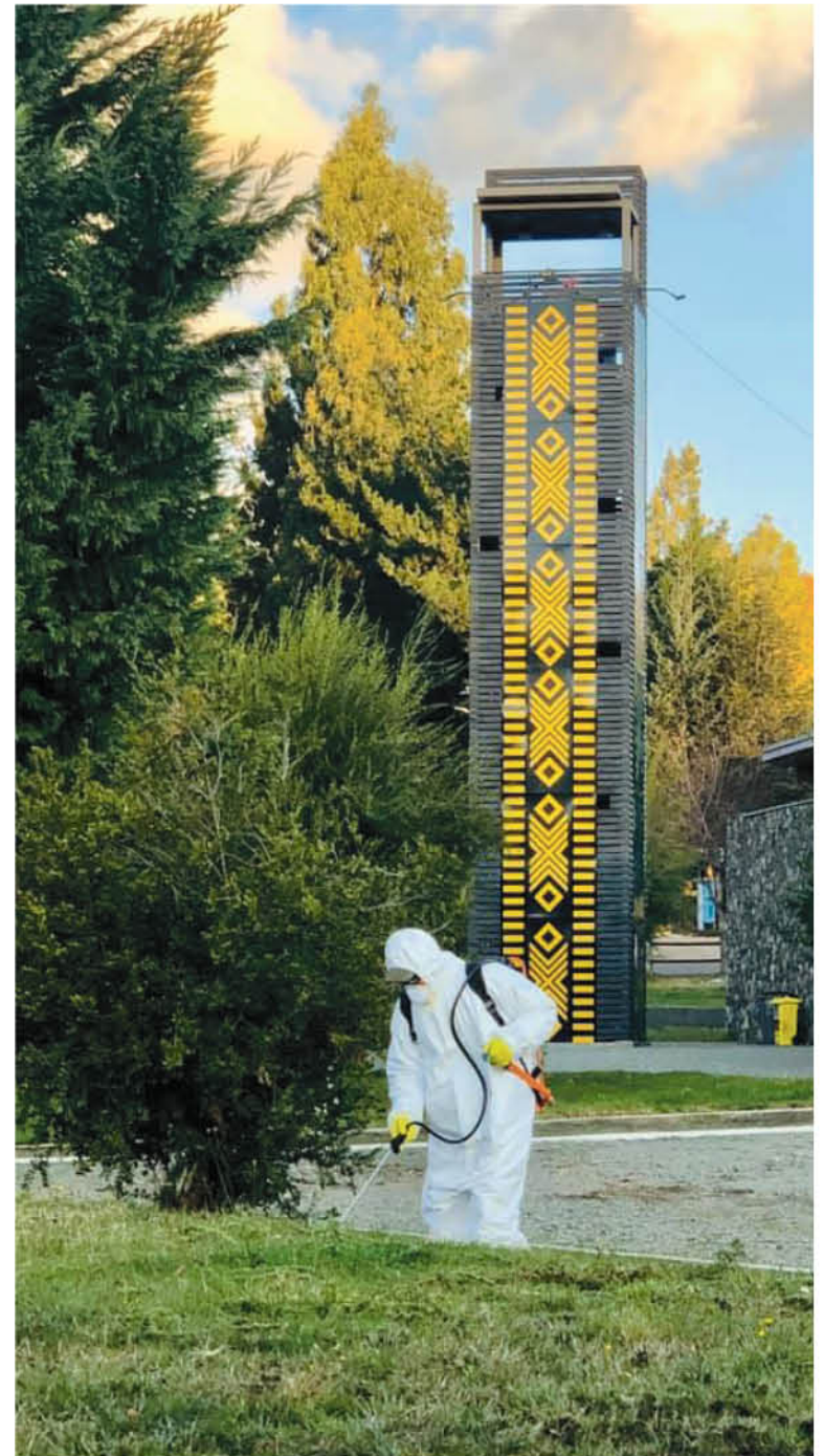
CON RECURSOS MUNICIPALES se han desarrollado distintas sanitizaciones en espacios públicos, además de otras medidas preventivas, que apuntan a disminuir el avance del coronavirus en territorio pehuenche.