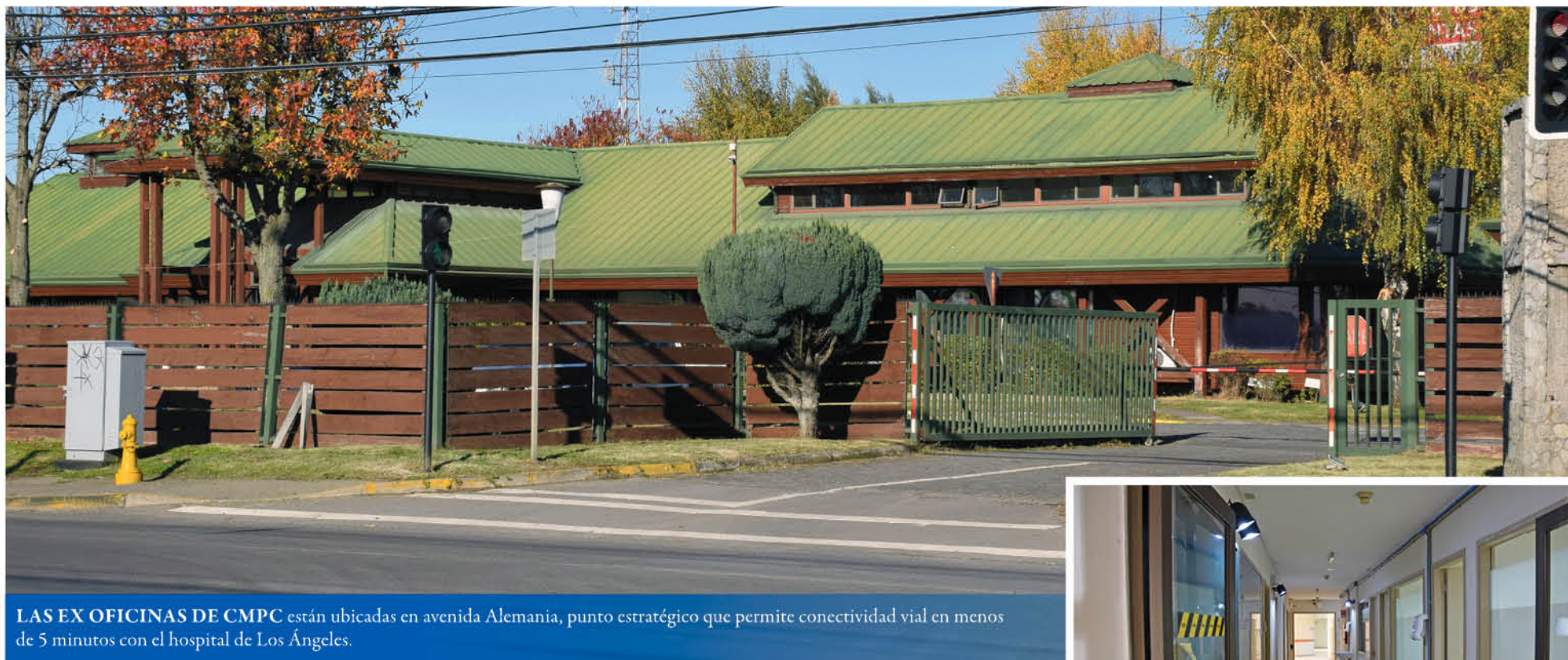
LAS EX OFICINAS DE CMPC están ubicadas en avenida Alemania, punto estratégico que permite conectividad vial en menos de 5 minutos con el hospital de Los Ángeles.

El recinto fue reacomodado para recibir a personas con patologías de menor complejidad.