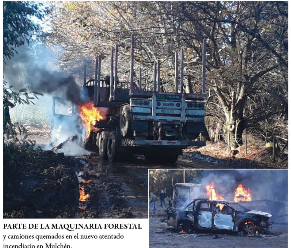
PARTE DE LA MAQUINARIA FORESTAL y camiones quemados en el nuevo atentado incendiario en Mulchén.

Según se pudo establecer en forma posterior, el disparo fue percutado desde una pistola 9 milímetros. Este hecho fue incorporado dentro de las declaraciones recopiladas con las personas que presenciaron.