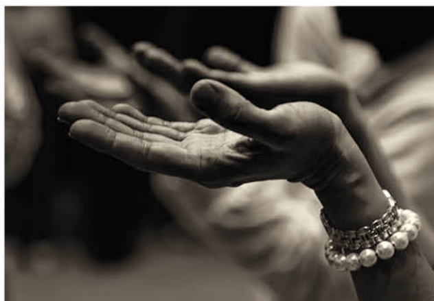
LA MEDIDA SERÁ implementada por las restricciones experimentadas durante la crisis sanitaria.

Por ello, recurrirán a la CIDH por una presunta violación a las libertades religiosas establecidas en la Convención Americana de Derechos Humanos, acción fundada -argumentan- "en las diversas vulneraciones materializadas en detenciones, contradicción de normativa jurídica, funas, presiones de las autoridades y similares".