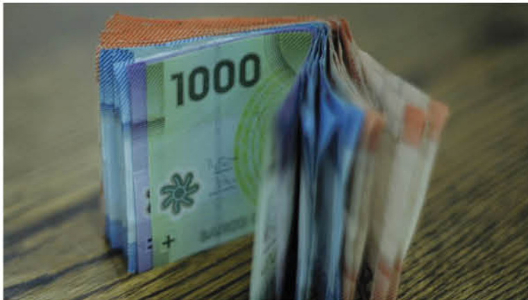
LA INICIATIVA PRETENDE convertirse en una medida paliativa de la crisis económica derivada del coronavirus.

Este miércoles ingresó a la comisión de Constitución la reforma constitucional de los senadores Yasna Provoste, Carlos Bianchi y Pedro Araya que busca que los afiliados a las AFP puedan retirar hasta el 10% de sus ahorros previsionales como medida paliativa de la crisis económica derivada del coronavirus.