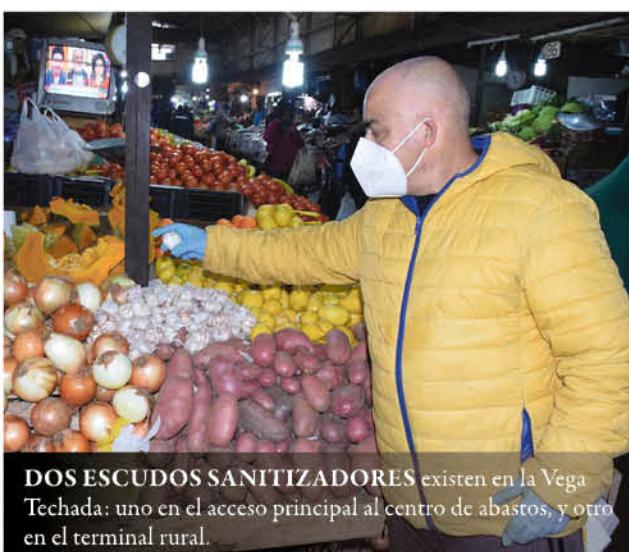
DOS ESCUDOS SANITIZADORES existen en la Vega Techada: uno en el acceso principal al centro de abastos, y otro en el terminal rural.

Actualmente el área de frutas y verduras cumple con todas las medidas sanitarias exigidas por la autoridad del ramo, y recalcaron que de desplazarse al área de bodegas utilizan escudos faciales que consiguieron en alianza con la “Cruz Negra”, entidad de voluntariado, que se los intercambió por frutas y verduras para ollas comunes.