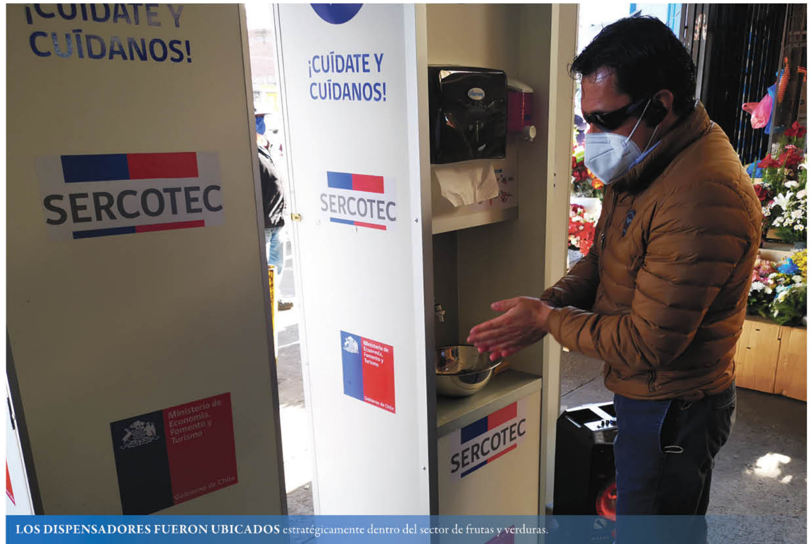
LOS DISPENSADORES FUERON UBICADOS estratégicamente dentro del sector de frutas y verduras.