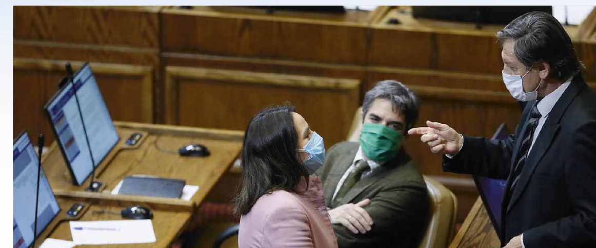
LA SALA DE LOS DIPUTADOS aprobó por amplia mayoría los arreglos al proyecto, que de ser aprobado por el Senado, se convertirá en Ley.

De esta forma, el proyecto fue aprobado por 138 votos a favor y trece abstenciones, y despachado al Senado, institución que, de dar también su ratificación, dejará la propuesta en condiciones de pasar