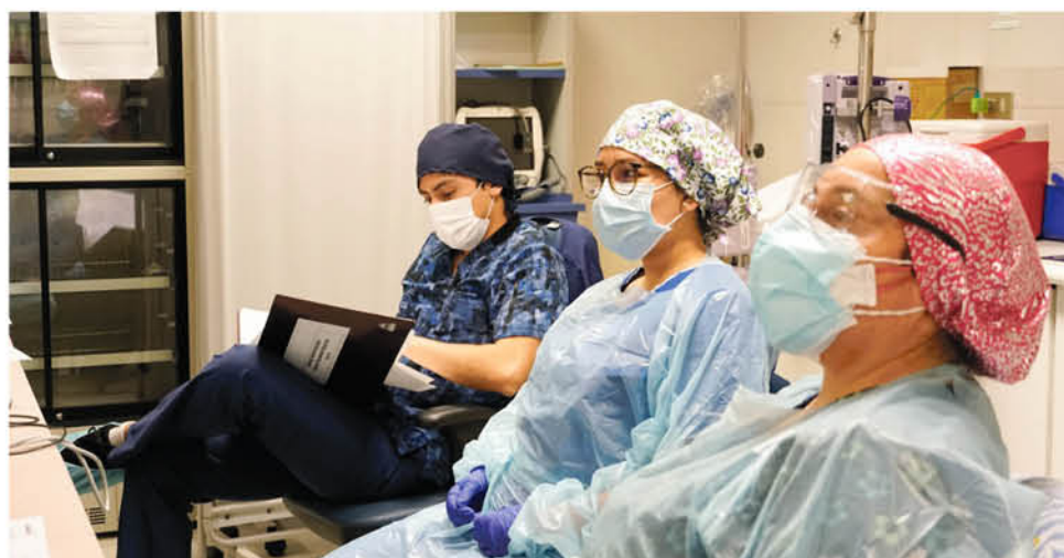
EN EL RECINTO ASISTENCIAL se han tomado todos los resguardos sanitarios debido a la contingencia del coronavirus.

quien además recibe la educación y orientación del químico farmacéutico de la unidad.