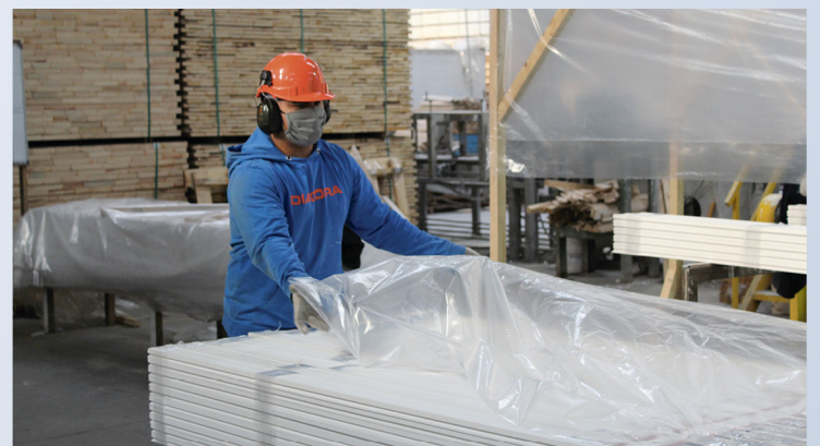
EL DISTANCIAMIENTO FÍSICO en el trabajo ha sido una de las medidas más efectivas en las obras.

En la actualidad la Cámara Chilena de la Construcción se encuentra en una campaña para que el 100% de las empresas del rubro adhiera al Protocolo Sanitario,