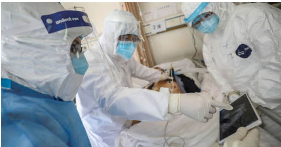
ACTUALMENTE en el contexto nacional, el número de nuevos contagios y fallecidos se encuentra en una creciente alza.

Desde el Colegio Médico lamentaron la confusión creada por el cambio del Gobierno respecto a la metodología para contabilizar a los fallecidos por Covid-19.