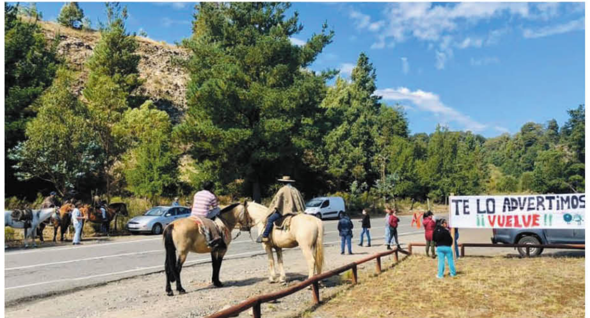
NAVARRO PIDIÓ LA CUARENTENA a la CIDH y no descarta pedir ayuda la ONU.

Según el informe entregado por el ahora ex ministro de Salud, Jaime Mañalich, al 7 de junio, Alto Biobío superó por 10 veces a la comuna de Concepción en la tasa de incidencia acumulada, con un índice de 1771,2 por cada 100.000 habitantes, entendiéndose esta