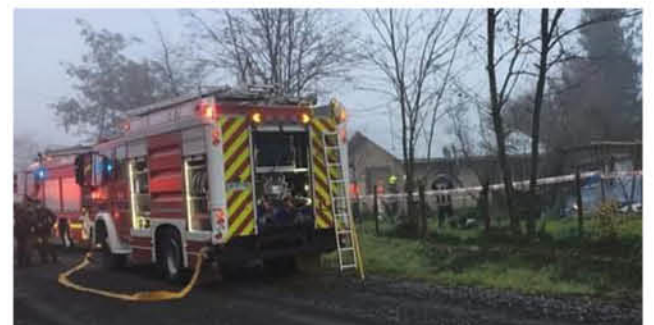
LOS TRABAJOS DE LAS UNIDADES de emergencias se extendieron por más de cinco horas, hasta el retiro del cuerpo calcinado de la víctima.