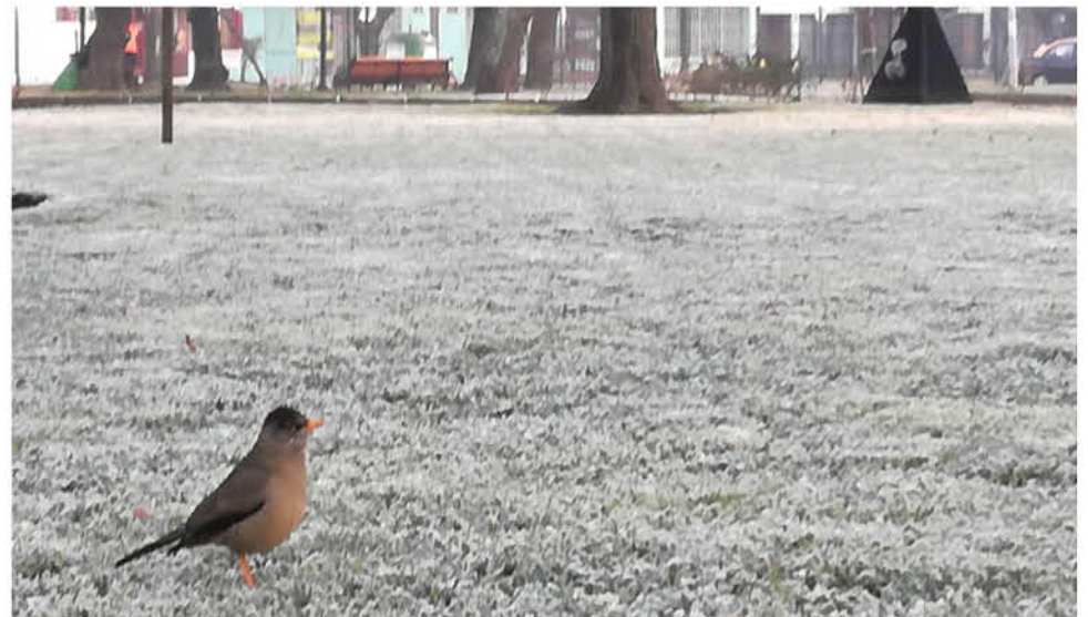
UN MANTO DE ESCARCHA cubrió las calles de la ciudad en la jornada de ayer domingo.