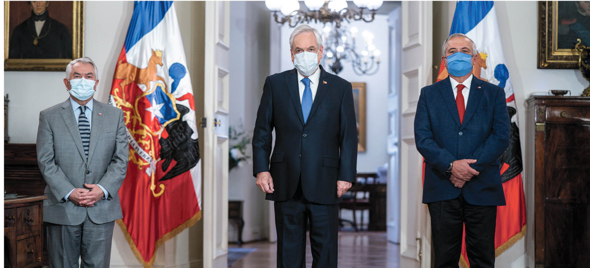
ENRIQUE PARIS ASUME como nuevo ministro de Salud con la tarea principal de la metodología y la recuperación de la credibilidad.

En el salón Montt Varas se concretó el sorpresivo cambio de gabinete, donde asumió el doctor Enrique Paris, ex presidente del Colegio Médico en dos oportunidades, quien ya ha asesorado a gobiernos ante-