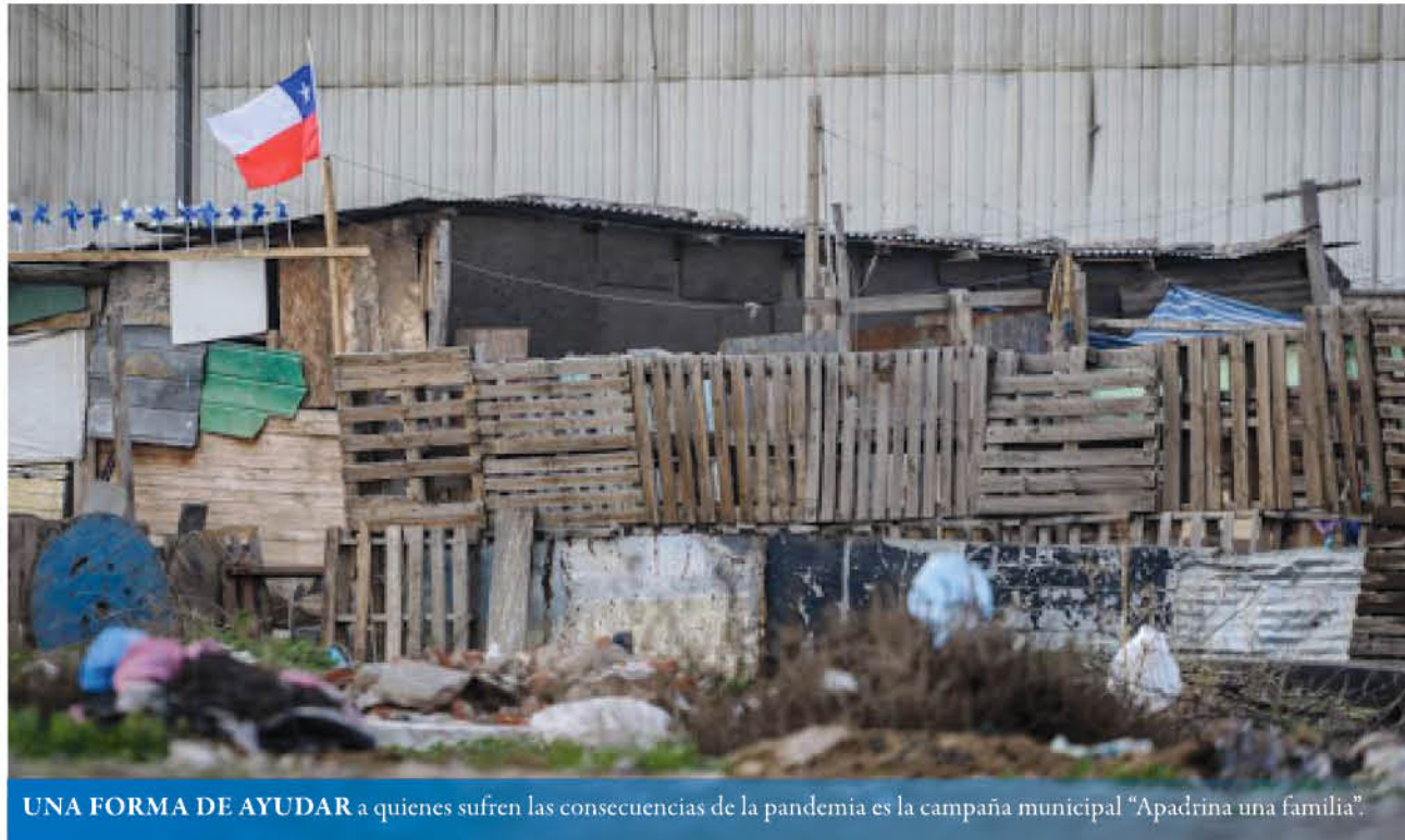
UNA FORMA DE AYUDAR a quienes sufren las consecuencias de la pandemia es la campaña municipal "Apadrina una familia".

En paralelo, en las últimas semanas también le hemos contado de los esfuerzos de las organizaciones sociales en la zona -como la Pastoral Social,