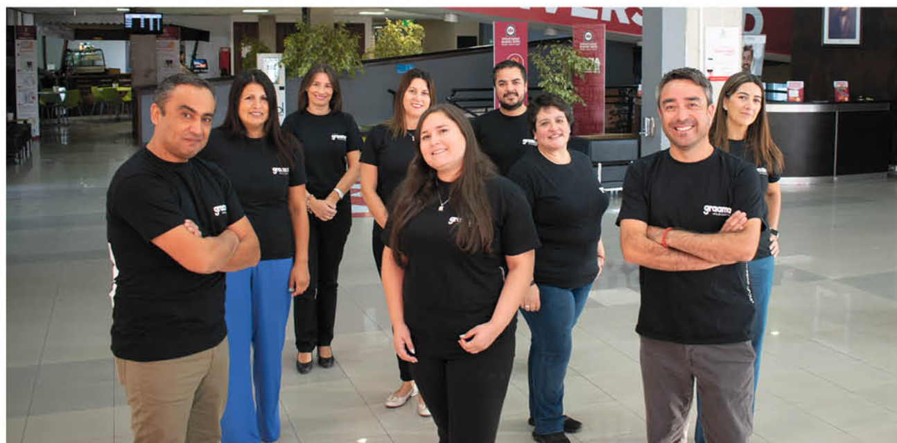
GRAAMA POSEE un equipo de profesionales multidisciplinario que pretende poner en valor a la región.

Finalmente, los involucrados en impulsar este proyecto hicieron un llamado a estar conectados con Graama a través de los diferentes soportes en los que está presente, ya que durante todo el año se realizarán instancias en donde especialistas del cine, la fotografía y el mundo de la cultura en general, estarán dando cita a espacios de conversación sobre el área.