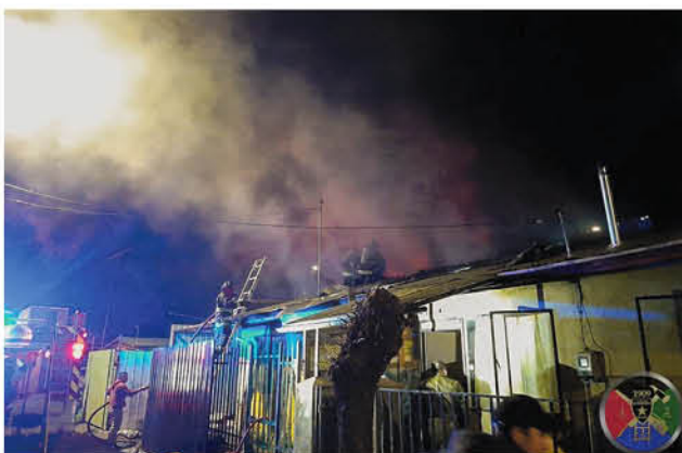
EL OPORTUNO TRABAJO DE BOMBEROS impidió que otras viviendas resultaran afectadas por el fuego.

Los peritos de la institución bomberil, así como personal del Laboratorio de Criminalística de Carabineros, deberán indagar el origen de la emergencia, que terminó con la vida de un hombre de 54 años.