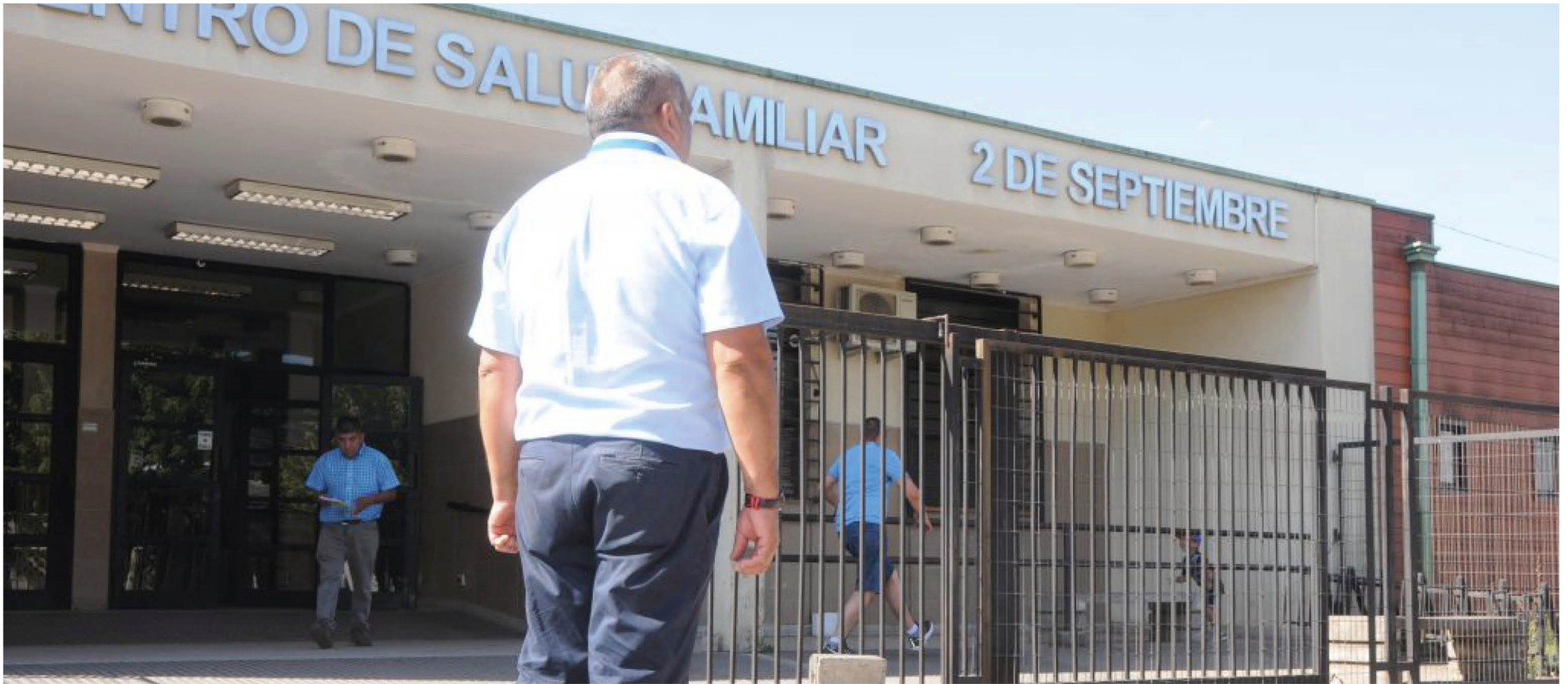
LOS PACIENTES CRÓNICOS descompensados, o adultos mayores con problemas de desplazamiento, han visto garantizadas sus atenciones en sus propios domicilios.