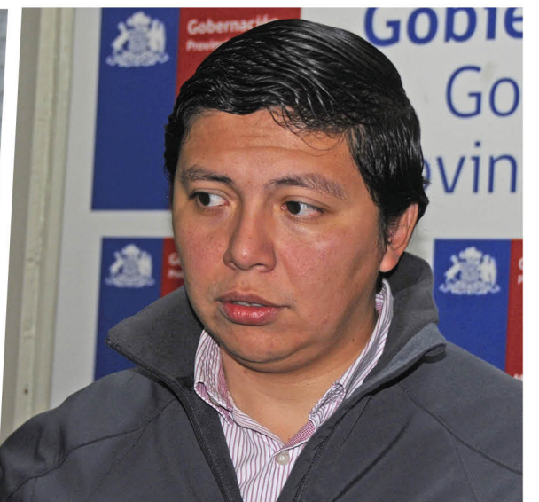
GOBERNADOR DE LA PROVINCIA DE BIOBÍO, Ignacio Fica