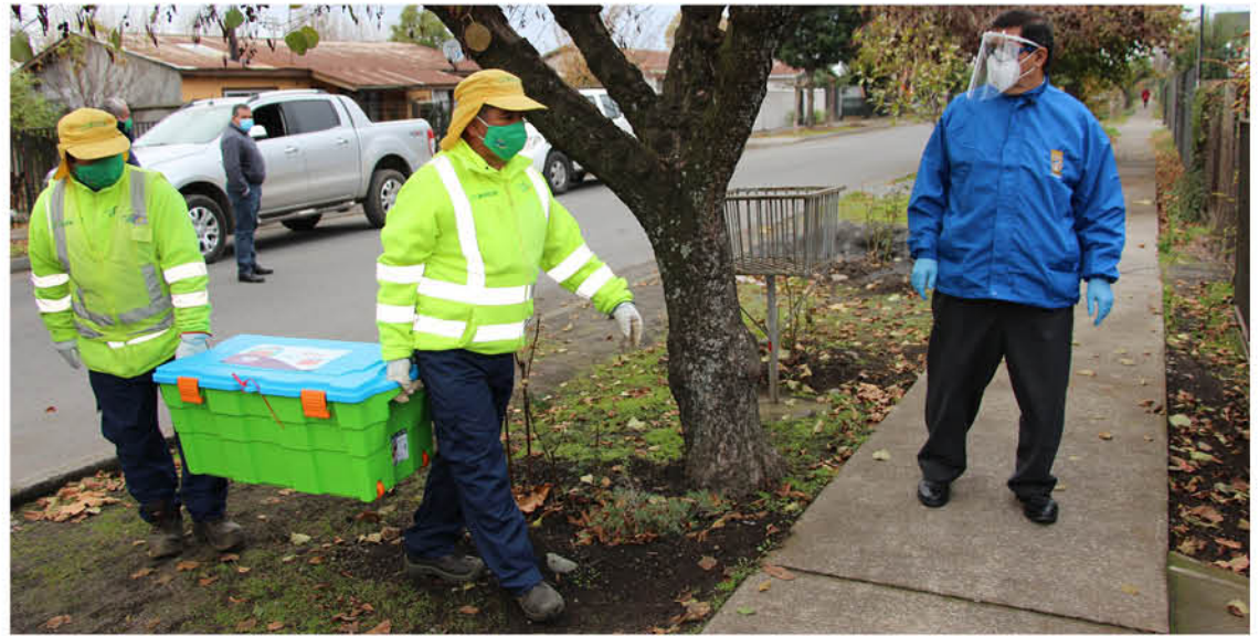
EL ALCALDE VELOSO coordinó personalmente la entrega de alimentos.

Y, los demás adultos mayores de 65 años deben postular a las megacajas de alimentos.