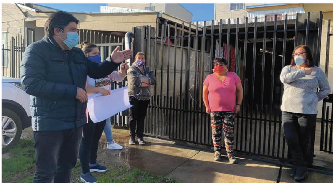
SE HAN ENTREGADO ALIMENTOS en la zona rural y urbana.

Desde la llegada de la pandemia de coronavirus a nuestro país y provincia, el alcalde de Mulchén, Jorge Rivas, se reunió con su equipo para poder enfrentar esta crisis sanitaria a través de múltiples acciones.