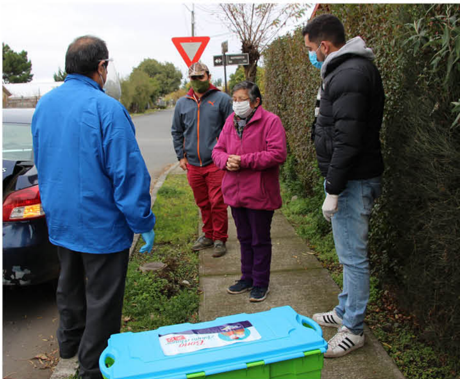
ADULTOS MAYORES que se pagan por IPS o por AFP recibirán alimentos.

Tucapel fue la primera comuna de la región del Biobío en dictar una ordenanza de distanciamiento social y uso obligatorio de mascarilla.