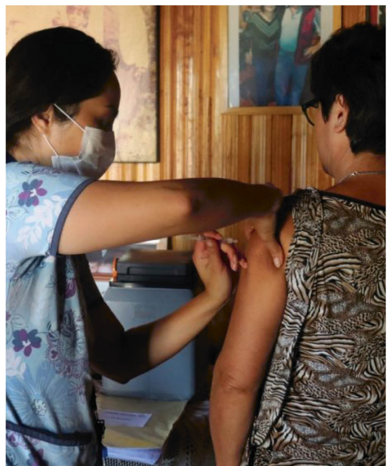
LOS CENTROS DE SALUD Familiar han tenido una notoria baja en la asistencia de usuarios, ya que la mayoría de las orientaciones se está coordinando vía telefónica o correo electrónico

zó que una acción importante es la desarrollada con los pacientes oncológicos, donde se han mantenido y desarrollado iniciativas que permiten