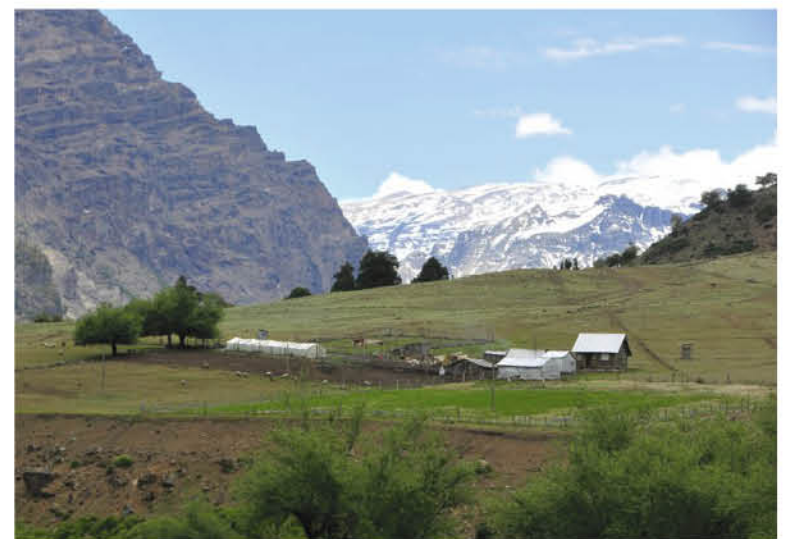
LA RESIDENCIA SANITARIA de Alto Biobío tiene 10 cabañas con 30 cupos para pacientes con sintomatología leve por Covid-19.

que las personas afectadas por la enfermedad serían derivadas a residencias sanitarias de Santa Bárbara o Los Ángeles, a fin de que estuviesen más cerca de un hospital en caso de agravarse su estado de salud.