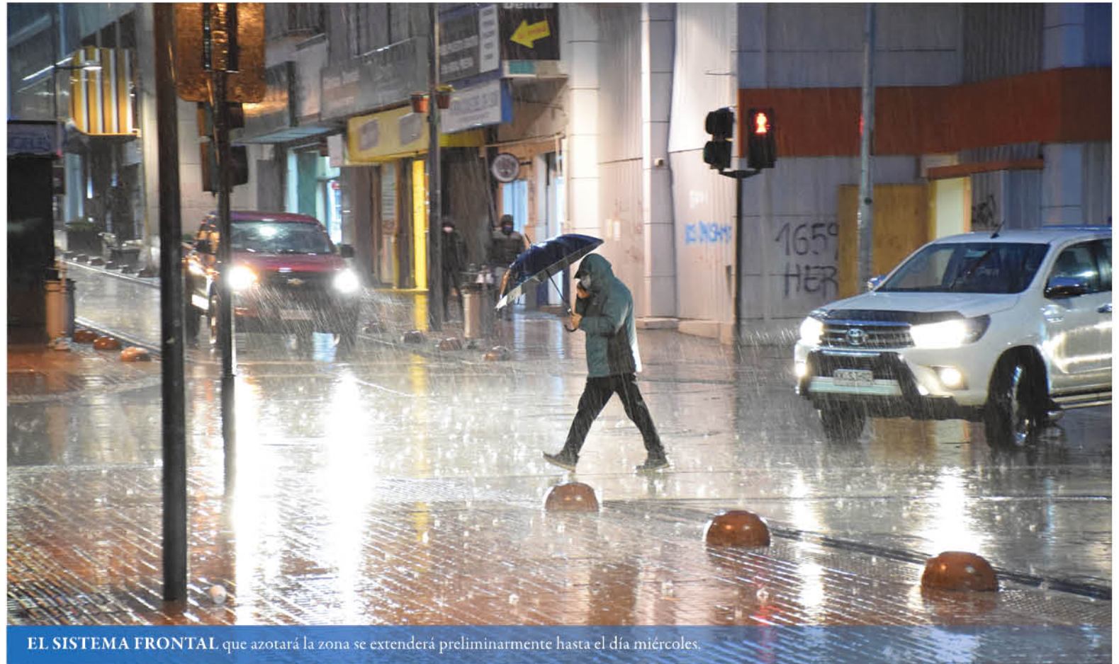
EL SISTEMA FRONTAL que azotará la zona se extenderá preliminarmente hasta el día miércoles.

El profesional dijo además que las precipitaciones que se esperan son catalogadas como normales, con montos que van desde los 20 a 30 milímetros para este martes