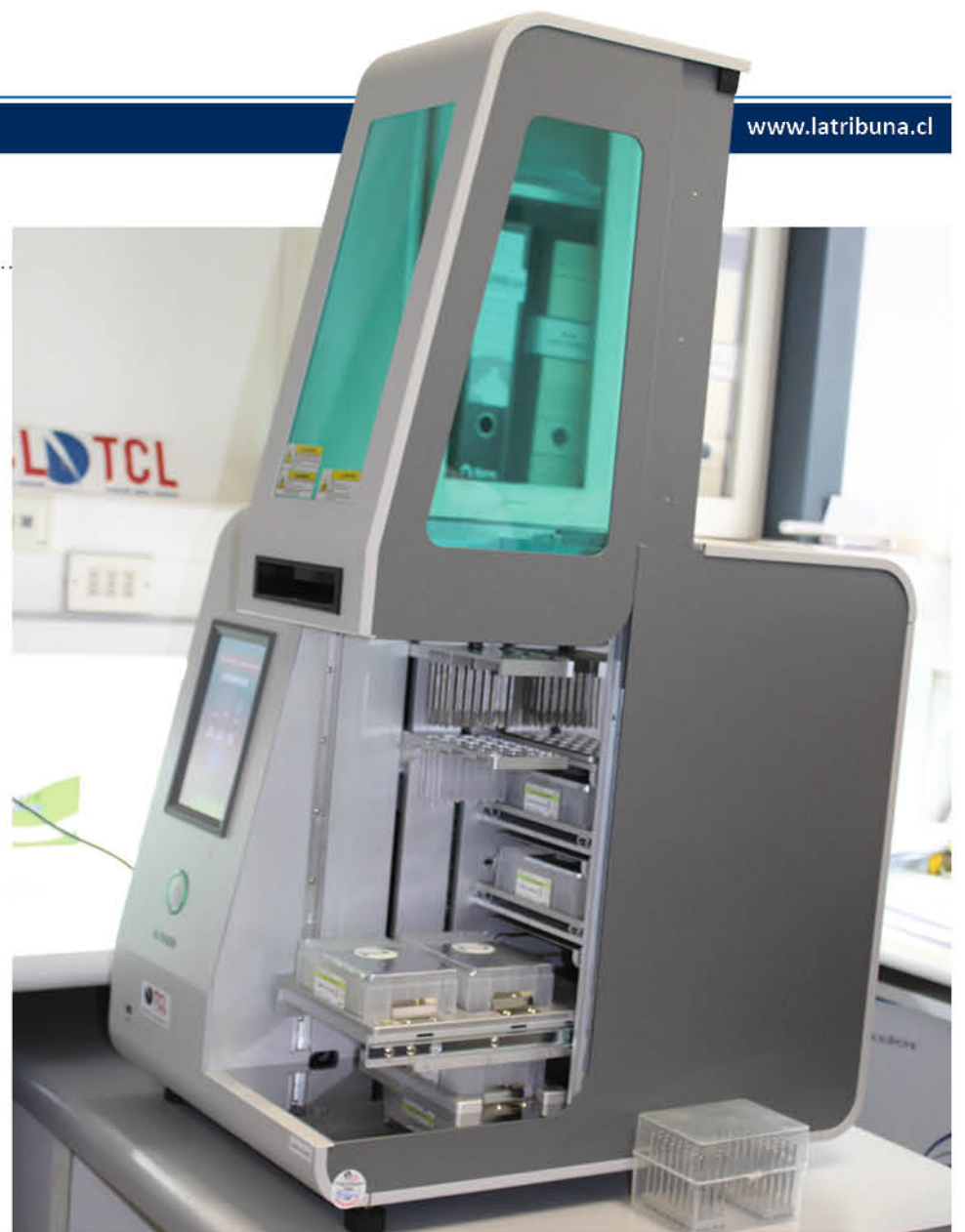
LA REGIÓN DEL BIOBÍO es la segunda a nivel nacional con un mayor nivel de análisis de muestras PCR.

La primera de ellas dice relación con la extracción de ácido nucleico, es decir, la separación del material genético de la muestra del paciente, que hasta ahora era desarrollada a nivel local de forma manual, y la segunda etapa llamada de amplificación, que permite crear múltiples copias del ácido nucleico, con lo que se logra identificar la presencia del virus