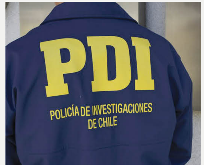
EN EL MARCO DE LA LEY 20.000 se solicitó el máximo plazo de ampliación de la detención para Emilio Berkhoff

Emilio Berkhoff se encontraba en libertad condicional tras haber sido condenado a cinco años de presidio en el año 2015 por porte ilegal de armas y municiones.