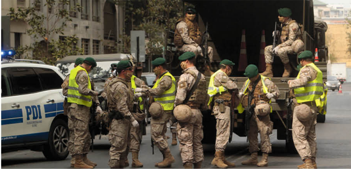
A NIVEL NACIONAL, el toque de queda sigue rigiendo de las 10 de la noche a las 5 de la mañana por un plazo adicional de 90 días.

El Gobierno anunció que decidió extender por 90 días -hasta el 14 de septiembre- el estado de excepción constitucional de catástrofe ante la emergencia provocada por el Covid-19.