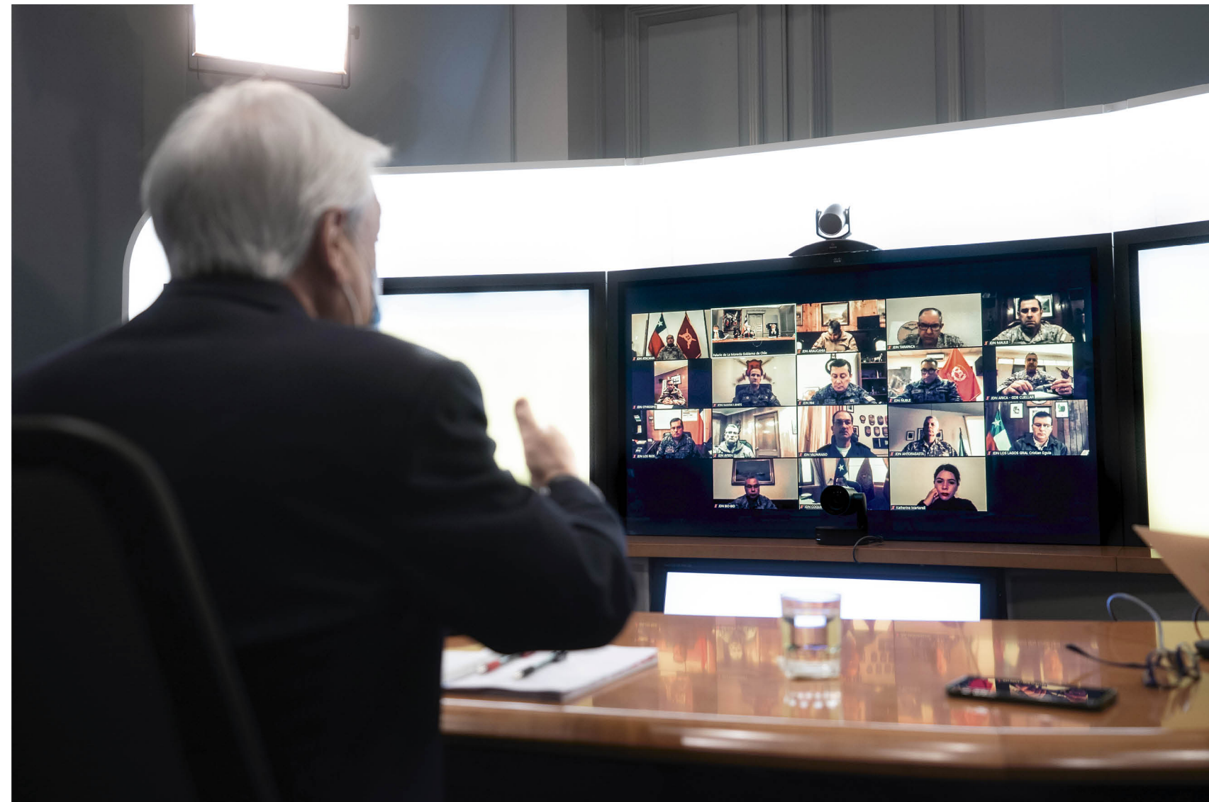
TRAS UNA INTENSA REUNIÓN con los delegados de la Defensa Nacional, el Presidente anunció, a través de la prensa, la extensión del estado de excepción.

En cuanto al tema del respeto de las medidas y normas que nacen en medio de la pandemia, el líder comunal angelino dijo: "Respecto