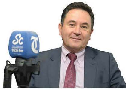
Juan Pablo Pinto Director regional del Sernac

La plataforma también promueve la competencia, pues los consumidores tendrán más oportunidad de elegir a quien le entregue un mejor servicio. Las empresas deben competir ofreciendo mejores ofertas y servicios y no reteniendo a la fuerza a quienes deseen elegir otra alternativa más conveniente o simplemente, dejar de recibir el servicio.