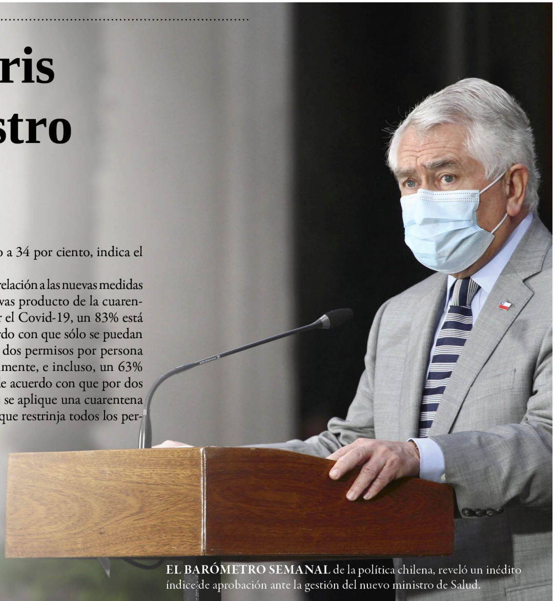
EL BARÓMETRO SEMANAL de la política chilena, reveló un inédito índice de aprobación ante la gestión del nuevo ministro de Salud.

Y en relación a las nuevas medidas restrictivas producto de la cuarentena por el Covid-19, un 83% está de acuerdo con que sólo se puedan obtener dos permisos por persona semanalmente, e incluso, un 63% estaría de acuerdo con que por dos semanas se aplique una cuarentena estricta que restrinja todos los permisos.