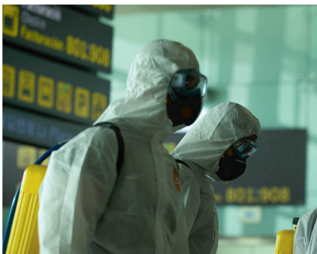
CABE DESTACAR que personal municipal prestará apoyo a Carabineros para poder controlar el cumplimiento de esta medida.