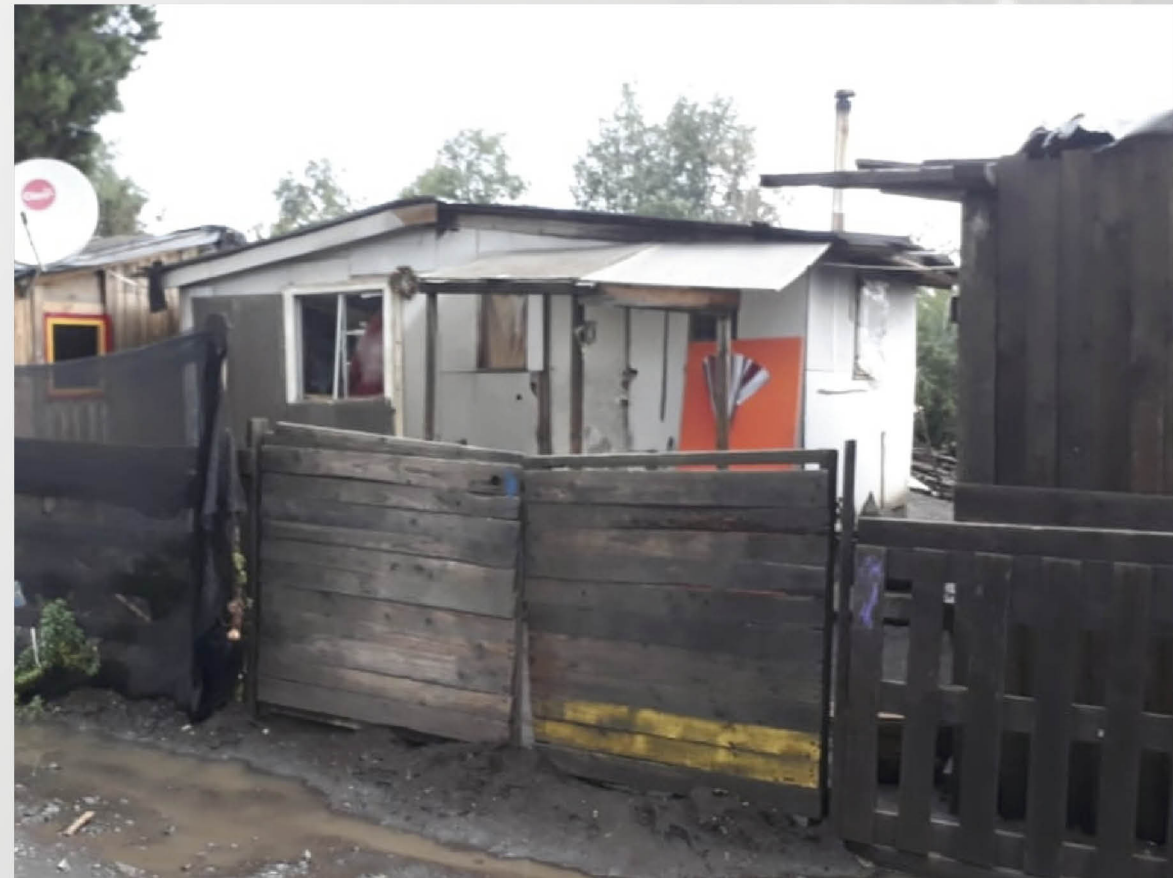
UN ASPECTO DE LAS CASAS del campamento Cuñibal, en el camino a Santa Bárbara.

Juvenal Rivera S. y Cristian Salazar prensa@latribuna.cl