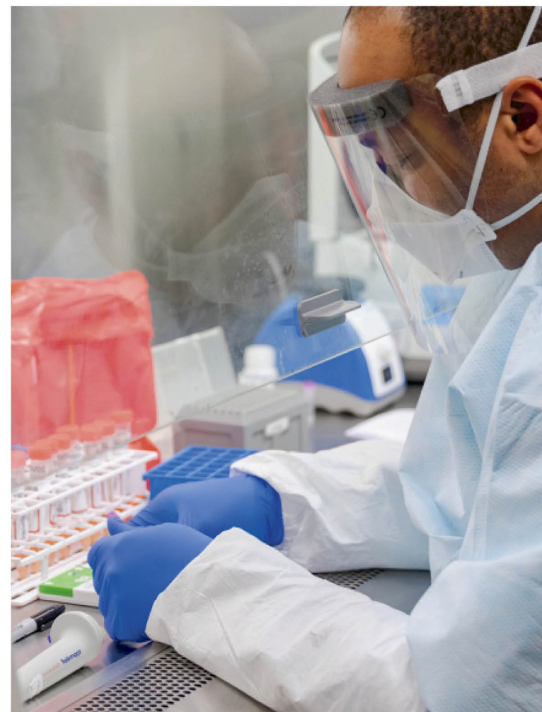
AUMENTAR EL MUESTREO para aislar a los casos positivos y sus contactos estrechos, es una sentida petición por parte de los ediles del área norponiente de la provincia.