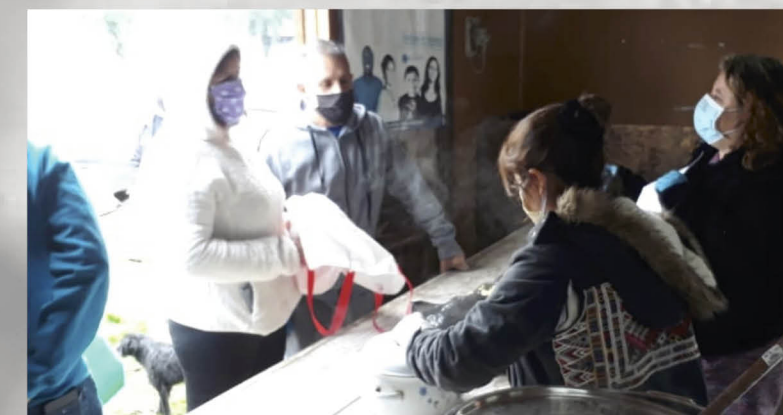
DOS ASPECTOS DE LOS APORTES que han recibido vecinos del campamento Cuñibal.