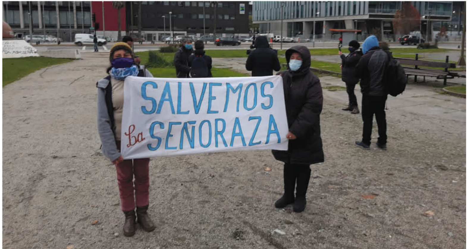
LOS VECINOS AGRUPADOS EN ESTE MOVIMIENTO se manifestaron en diversos organismos públicos de la región del Biobío.

Marisel Venegas Díaz prensa@latribuna.cl