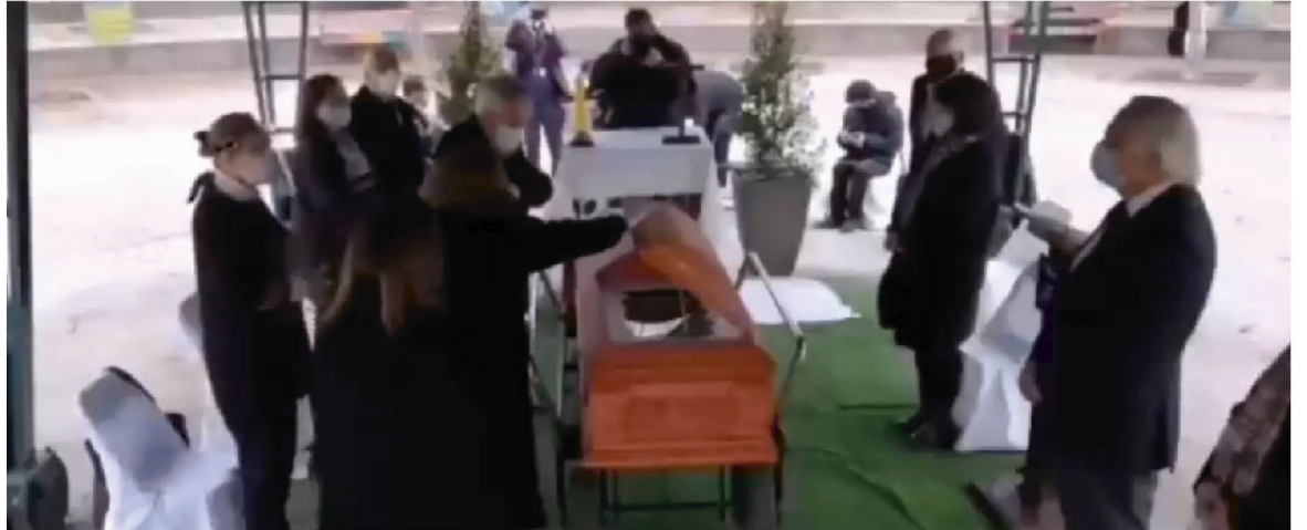
LA DEFENSA DE DAZA se basó en asegurar que se respetaron los protocolos sanitarios.

Los responsables de defender al mandatario fueron las autoridades de Salud, así su subsecretaria, Paula Daza aseguró que se respetaron todos los protocolos.