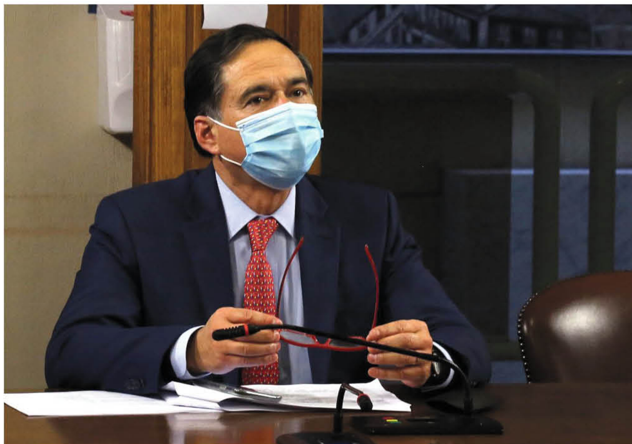
NORAMBUENA HABLÓ DE CORDÓN SANITARIO, pensando en que podría ser necesario y urgente, una cuarentena comunal para Los Ángeles.

"Le hemos solicitado a las Autoridades considerar desde ya la implementación de un cordón