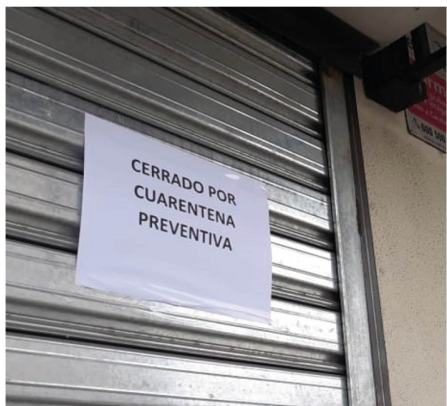
DIARIAMENTE SE VEÍA GRAN AFLUENCIA de personas en Notaría Carrillo, e incluso filas de clientes esperando turno para realizar trámites.

La autoridad regional enfatizó en que tras cumplir con este procedimiento, el lugar puede volver a funcionar, no obstante en este caso se determinó por parte de sus dueños, el cierre preventivo de las céntricas dependencias, por los próximos 15 días.