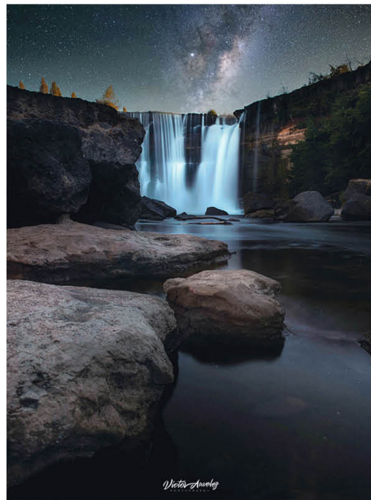
LA IMAGEN MUESTRA LA POPULAR CASCADA de los Saltos del Laja con la Vía Láctea de fondo.

Luego, en el Photoshop - programa de edición de fotografía - reunió las tres imágenes que tomó