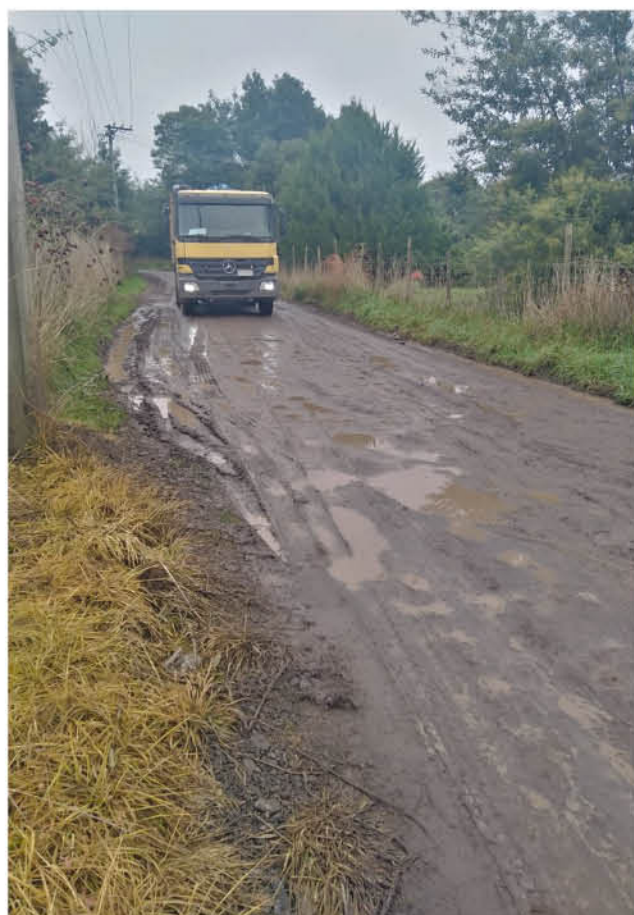
LOS VECINOS DE LA VILLA PULMAHUE se quejan por el mal estado en que dejó el camino el paso de vehículos de carga pesada.