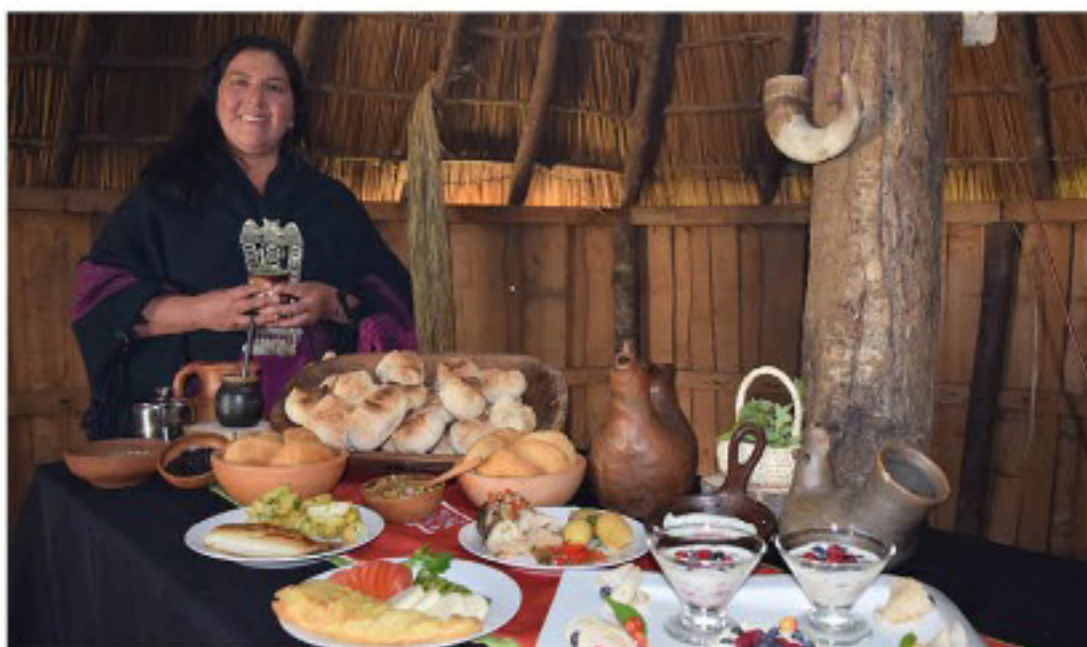
MONKUL ES ADMINISTRADO por la comunidad Mateo Nahuelpán, que es la propietaria de este lugar con identidad territorial lafkenche. Los emprendedores turísticos han sido apoyados por la municipalidad de Carahue, Empresas CMPC y el Departamento de Acción Social del Obispado de Temuco.

Carahue Navegable es una travesía turística de 30 kilómetros que conecta la historia de este gran río a través de un conjunto de servicios turísticos ubicados en sus riberas y sectores aledaños. Este recorrido comienza en la Estación Fluvial de Carahue y finaliza en el espectacular humedal de Monkul.