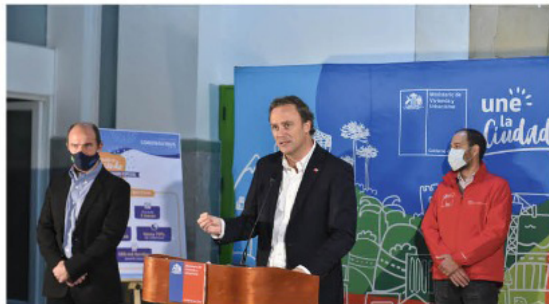
LAS POSTULACIONES ESTARÁN ABIERTAS hasta el 24 de agosto a través de la página web del ministerio (minvu.cl).

El proceso de postulación estará abierto desde el 14 julio al 24 de agosto de 2020, con cierres parciales cada 15 días. Se trata de un plan extraordinario como parte de la emergencia sanitaria por Covid-19 que considera una inversión de 93 millones de dólares.