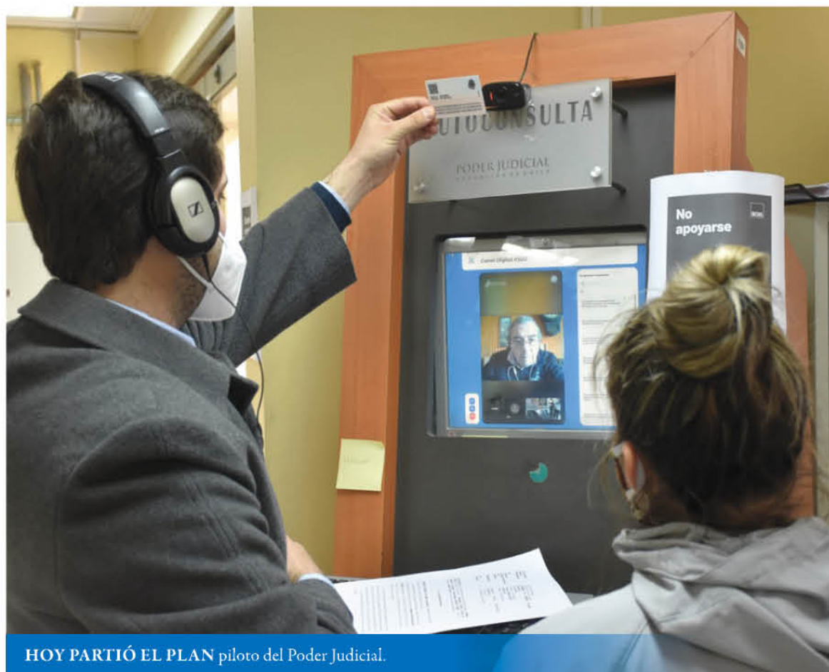
HOY PARTIÓ EL PLAN piloto del Poder Judicial.

La magistrada agregó que “lo importante es que la gente de sectores rurales pueda mante-