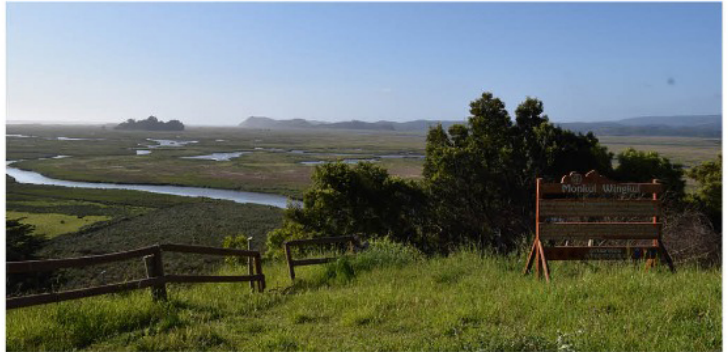
EL HUMEDAL DE MONKUL forma parte del circuito turístico Ruta Fluvial: Carahue Navegable y es administrado por la comunidad Mateo Nahuelpán, compuesta por 20 familias mapuches.

Según consta en la web de Ramsar el reconocimiento a este humedal de la Región de La Araucanía se debe a que "es un sistema de estuario que consiste en lagunas costeras, pantanos de pastos altos y pastizales ribereños. El sitio alberga