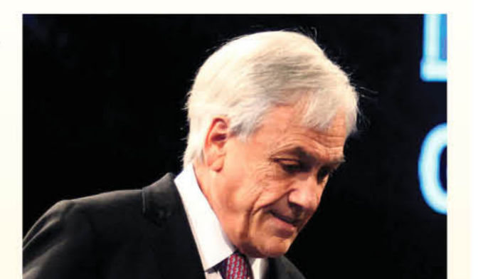
FUE UNA MALA SEMANA para La Moneda, con la baja en la aprobación del Jefe de Estado y de todos sus ministros, salvo el de Salud, Enrique Paris.

Los que más caen son Ignacio Briones (38% -18pts) y Gonzalo Blumel (31% -22pts). Finalmente, solo el 34% considera muy buena o buena su situa-