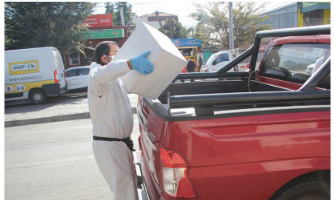
A TRAVÉS DE GIFTCARD, el municipio de Los Ángeles entregará ayuda a las familias más afectadas por la crisis sanitaria derivada del coronavirus.

que la distribución de las giftcards permitirá que cada favorecido pueda decidir los alimentos que comprará de acuerdo a sus propias necesidades, además de liberar a los funcionarios municipales de la responsabilidad de distribuir las cajas de alimentos que entrega el municipio y el gobierno. "No hay gastos de cajas, traslados ni