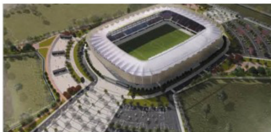
EL NUEVO ESTADIO para Los Ángeles sigue en compás de espera.