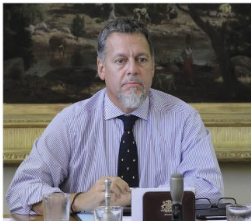
LAS AMENAZAS fueron realizadas a través de redes sociales.

Recordar que el senador por la región de Valparaíso, había declarado en la pasada sesión de la Comisión de Constitución del Senado, que no está de acuerdo en que "la gente que no tiene necesidad de retirar sus fondos lo haga sin pagar impuestos para invertirlos, luego, en un APV". Finalmente, el parlamentario informó que no presentará dicha indicación.