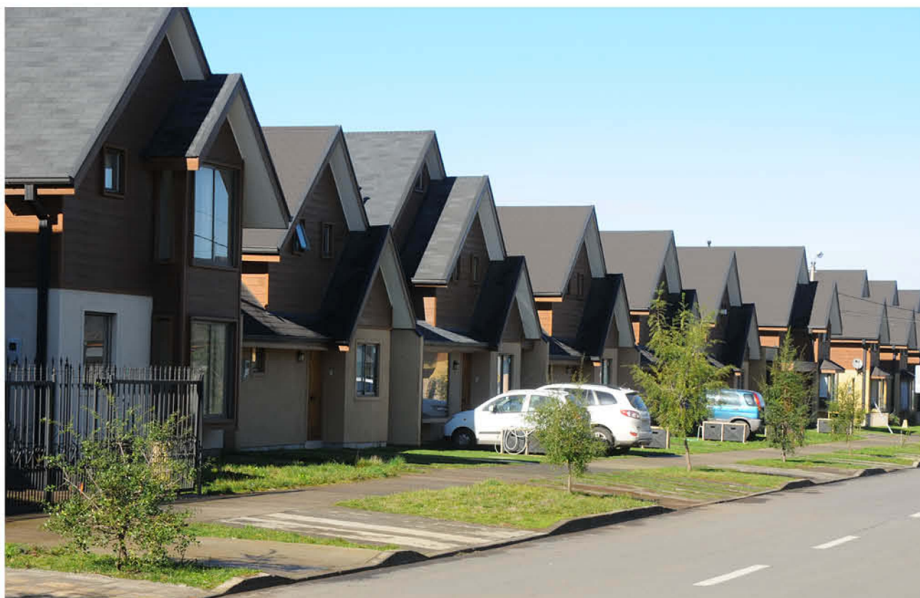
CASI LA MITAD DE LAS CONSTRUCCIONES que realizan los socios de la cámara en la capital provincial van destinadas a la clase media.

Las cesaciones de compra se dispararon en el periodo: más de un 400% de alza con respecto a los meses anteriores, porcentajes entregados tras el estudio que realizó la CChC en la