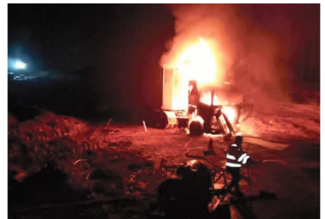
FOTOGRAFÍA DE CONTEXTO del atentado del 14 de julio de 2020 en Mulchén.

Hasta el cierre de esta edición continuaban los patrullajes, a fin de ubicar a los autores de este nuevo hecho delictual que afecta a la zona.