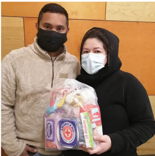
LAS MUJERES MIGRANTES embarazadas fueron el foco de la campaña realizada por la Pastoral Social.

A través de una campaña solidaria realizada por la oficina de Movilidad Humana de la Pastoral Social del Obispado de Los Ángeles, fue posible ayudar a las mujeres migrantes embarazadas que están ad portas de dar a luz.