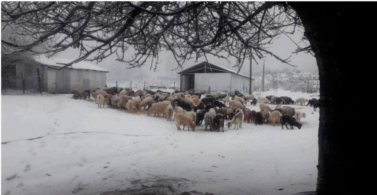
EL GANADO DE LAS COMUNIDADES pehuenches debe recibir un suplemento de forraje y alimento concentrado para capear la temporada invernal.