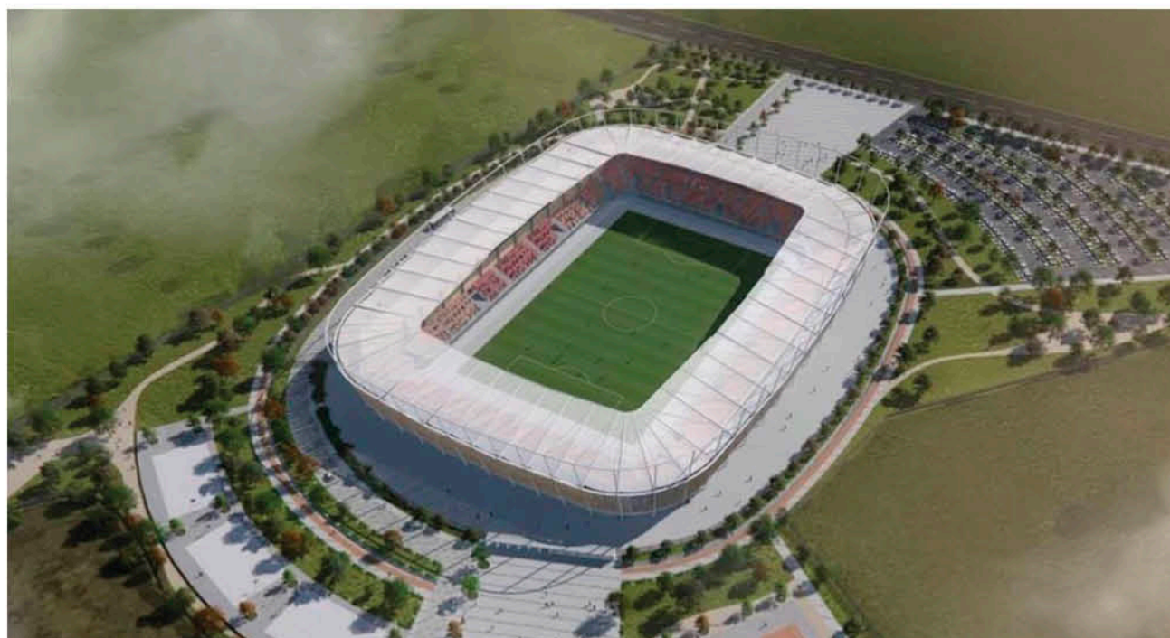
EN LA CÁMARA DE DIPUTADOS se analizará la situación del retiro de fondos del estadio de Los Ángeles, a través de una citación que se le hizo a la ministra Cecilia Pérez.

Agregó que no se ha dado por parte de la cartera de Deportes una respuesta clara y contundente con respecto a estos fondos, y tampoco a la primera auto-