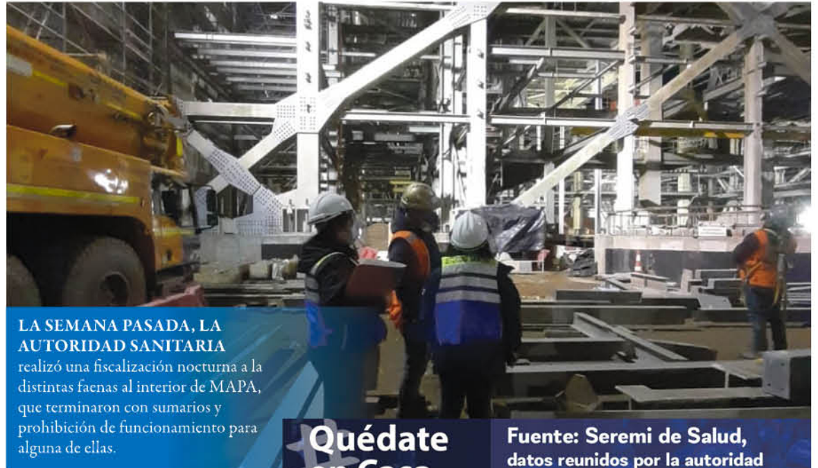
LA SEMANA PASADA, LA AUTORIDAD SANITARIA realizó una fiscalización nocturna a la distintas faenas al interior de MAPA, que terminaron con sumarios y prohibición de funcionamiento para alguna de ellas.