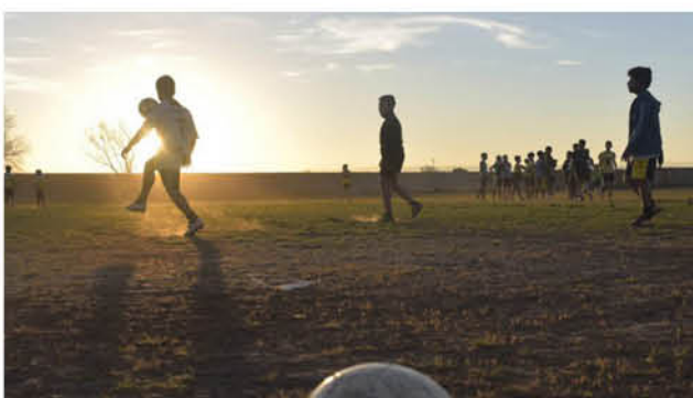
SIBIEN TODAS LAS COMUNAS DE LA PROVINCIA de Biobío están en la fase tres del plan Paso a Paso del Minsal, aún no han sido autorizadas este tipo de actividades deportivas. (Foto de contexto).

Recordemos que la semana pasada se registró una situación similar en Negrete, oportunidad en la que el seremi de Salud de Biobío recordó que sólo está permitido el entrenamiento de este deporte para las ligas profesionales, previo cumplimiento de una serie de medidas sanitarias preventivas.