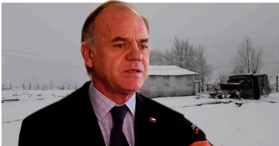
ANTONIO WALKER , ministro de Agricultura.

A través de nuestro Facebook Muni Mulchén