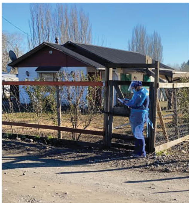
GRACIAS A LA UNIDAD DE TOMA DE MUESTRAS de la Dirección Comunal de Salud, las personas no tendrán que moverse de su hogar para concretar el examen.

Esto se explicaría en brotes familiares, provocados por el regreso de los trabajadores a su casa, por lo que el profesional enfatizó en que “las personas que retornen a sus hogares, o provengan de zonas donde hay brotes activos, tengan en consideración que deben guardar precauciones en su domicilio”.