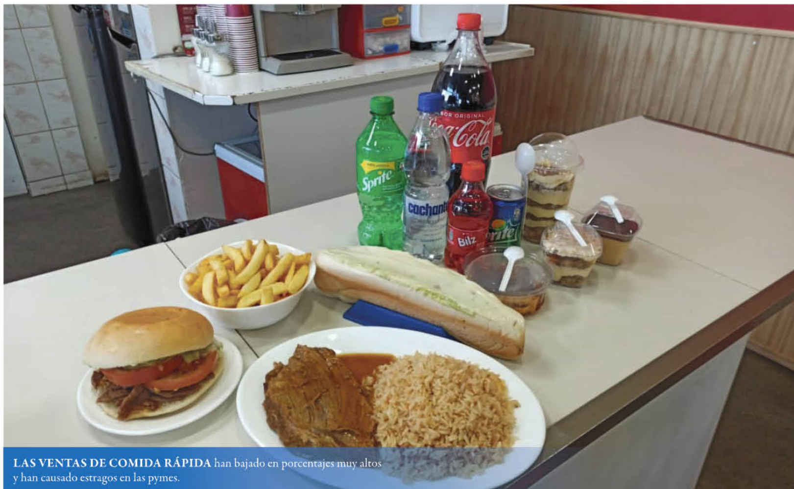
LAS VENTAS DE COMIDA RÁPIDA han bajado en porcentajes muy altos y han causado estragos en las pymes.

Con esto, el sector cierra el primer semestre de