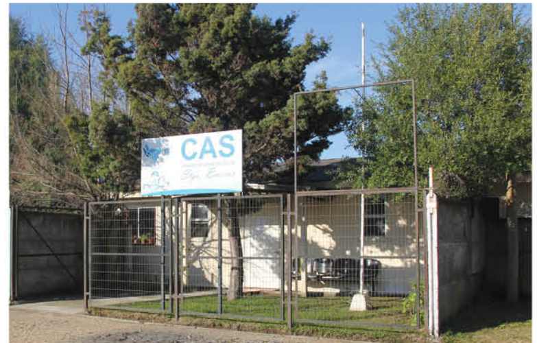
HASTA AHORA CHACAYAL SOLO CUENTA con un Centro de Atención Social, el que no da abasto con las necesidades de los vecinos.

La autoridad comunal precisó que “lo que existía hasta ahora era ayuda social, en casos puntuales, y era como eso fundamentalmente, en cambio al ser una delegación, primero tiene una dependencia directa del alcalde, y por lo tanto se supone que será mucho más resolutiva y eficaz”.