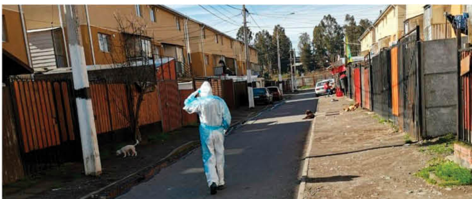
LOS FUNCIONARIOS que están desarrollando este tipo de labores lo hacen con toda la implementación necesaria y debidamente identificados.

Durante las visitas, además, se ha enfatizado en la educación en salud de la comunidad. Por ejemplo, reforzando el correcto uso de la mascarilla; cómo y cuándo deben lavarse las manos, la mantención del distanciamiento social y, también, remarcando el especial cuidado que se debe tener con grupos considerados más vulnerables frente a esta patología, como son adultos mayores y sujetos con enfermedades crónicas de base.