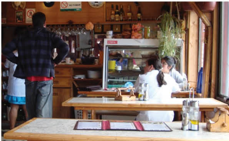
24 SUMARIOS SANITARIOS ha cursado la Autoridad Sanitaria a restaurantes o cocinerías de la provincia por encontrarse en su interior personas consumiendo alimentos.

los bancos, dado el proceso de retiro del 10%, por eso se ha incrementado el trabajo de vigilancia, controlando que se respete el distanciamiento físico como también el uso de mascarilla en espacio cerrado, agregó la autoridad sanitaria.