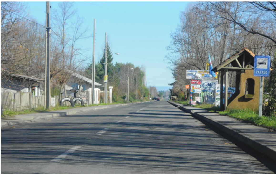
MÁS DE 9 MIL VECINOS se verán beneficiados con la construcción de una Delegación Municipal en El Peral.