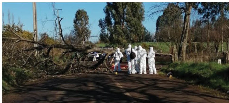
ESTE HECHO se suma al tenso ambiente que se vive en la región de La Araucanía.

La empresa Frontel también señaló en un comunicado que varios árboles fueron derribados en el mismo sector de Pillanlelbún generando la interrupción del suministro eléctrico en una amplia zona.