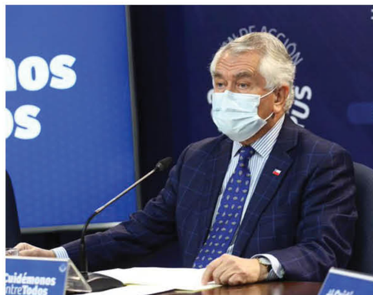
CHILE ACTUALMENTE aparece en ranking como el noveno país del mundo con más casos con Covid-19.

Referente a la situación país y el procesamiento de datos Enrique Paris reconoció que “obviamente pueden haber estándares más altos” para la recolección de cifras. Sin embargo, dijo creer que Chile no está “tan lejos” de los países con los más altos estándares.