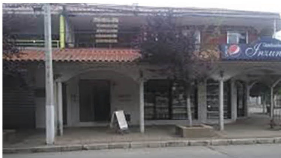
LA TERRAZA ES UN LOCAL DE YUMBEL que ha experimentado bajas superiores al 95% en las ventas.