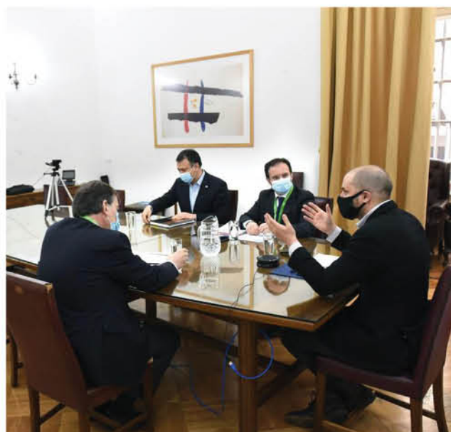
DEBATE Y PARTICIPACIÓN ciudadana fueron materia de análisis.

la necesidad, que las regulaciones y nuevos proyectos legislativos permitan los espacios de libertad que deben caracterizar a los medios en un sistema democrático sano.