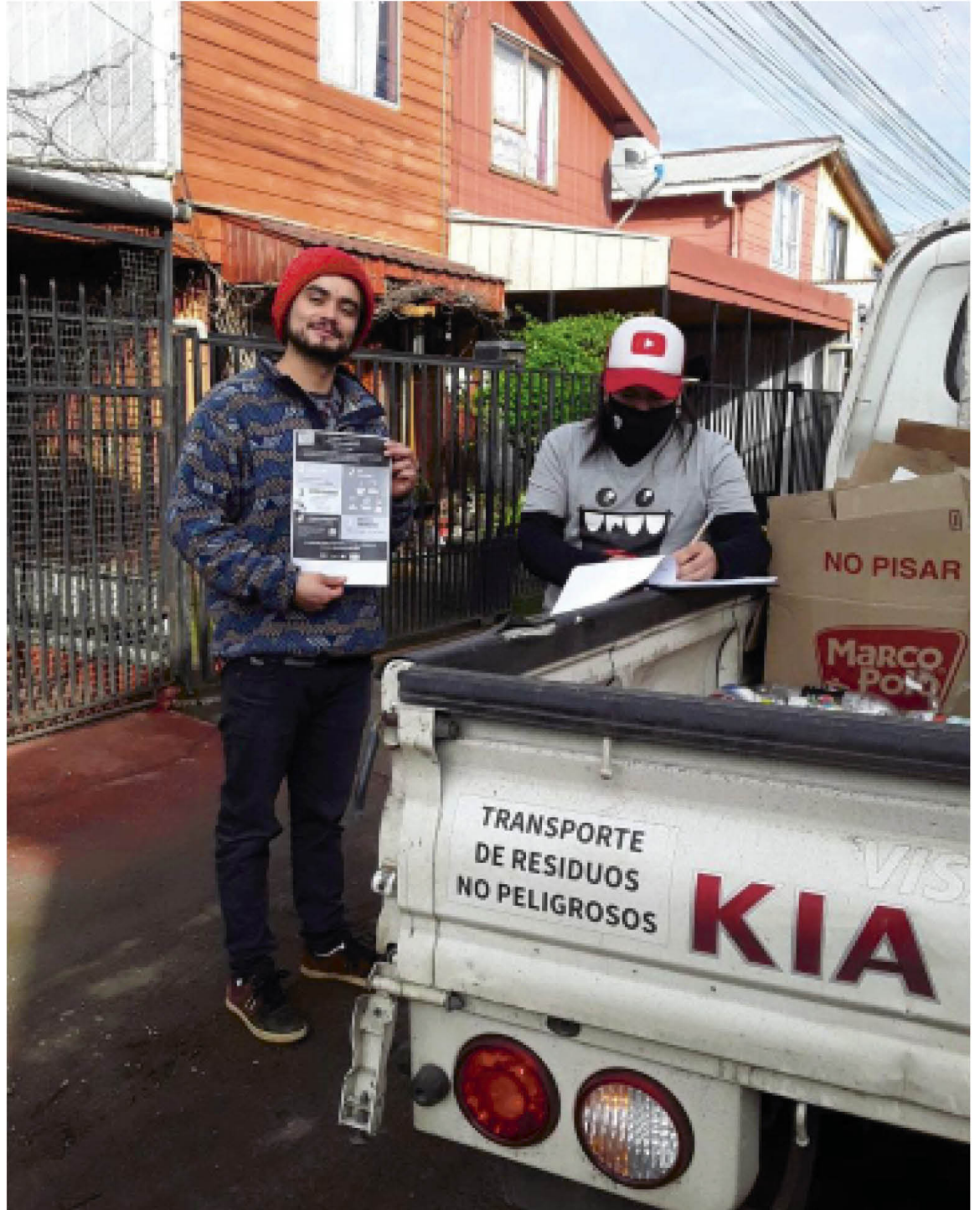
A TRAVÉS DE ESTA INICIATIVA se busca generar cambios desde las personas para lograr disminuir la cantidad de residuos que terminan en el vertedero.

El alcalde Jorge Rivas informó que: "Nosotros como comuna y en conjunto con Kyklos y CMPC, comenzamos con un plan piloto en el sector de villa La Granja donde estamos trabajando en una primera etapa con 51 viviendas o familias, quienes entregan a un camión que pasa semanalmente de forma separada: papel, cartón, latas de conserva y bebidas, además de plástico. Una iniciativa que hasta el momento ha sido todo un éxito y que se extenderá hasta 150 viviendas este 2020 (...) esperamos que podamos ampliar esta iniciativa a los demás sectores de la comuna en los próximos años, ya que se entiende que es un proceso que tiene mucho trabajo, organización e inversión detrás y debemos ir implementando gradualmente".