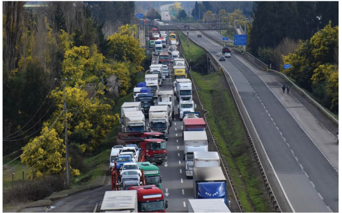
LA PARALIZACIÓN SE MANTENDRÁ de forma íntegra a nivel nacional hasta que el gremio de camioneros logre un acuerdo con el gobierno.

Respecto a la paralización, Martínez se declaró optimista y catalogó “de un balance muy positivo” lo que se ha logrado en materia de convocatoria, sin embargo, respecto a las negociaciones, aseveró que en un comienzo la respuesta del gobierno fue totalmente inconsistente, por lo que ven esta semana como un tiempo