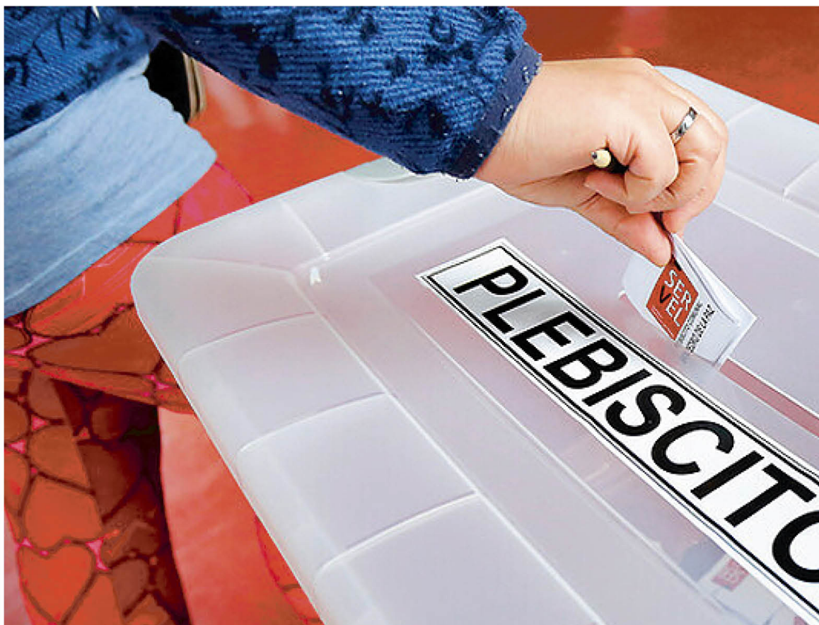
EL PLEBISCITO PARA CAMBIAR o no la Constitución Política del Estado es el 25 de octubre.

A su juicio, la violencia ha escalado demasiado y desde fuera del aparato público asumen que las polí-