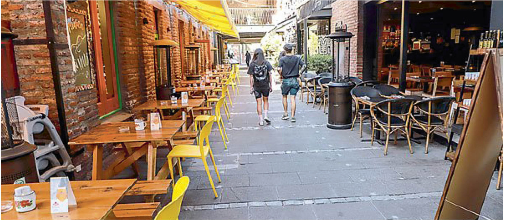
LOS RESTAURANTES Y CAFÉS con terraza podrán abrir según indicaciones del Minsal.