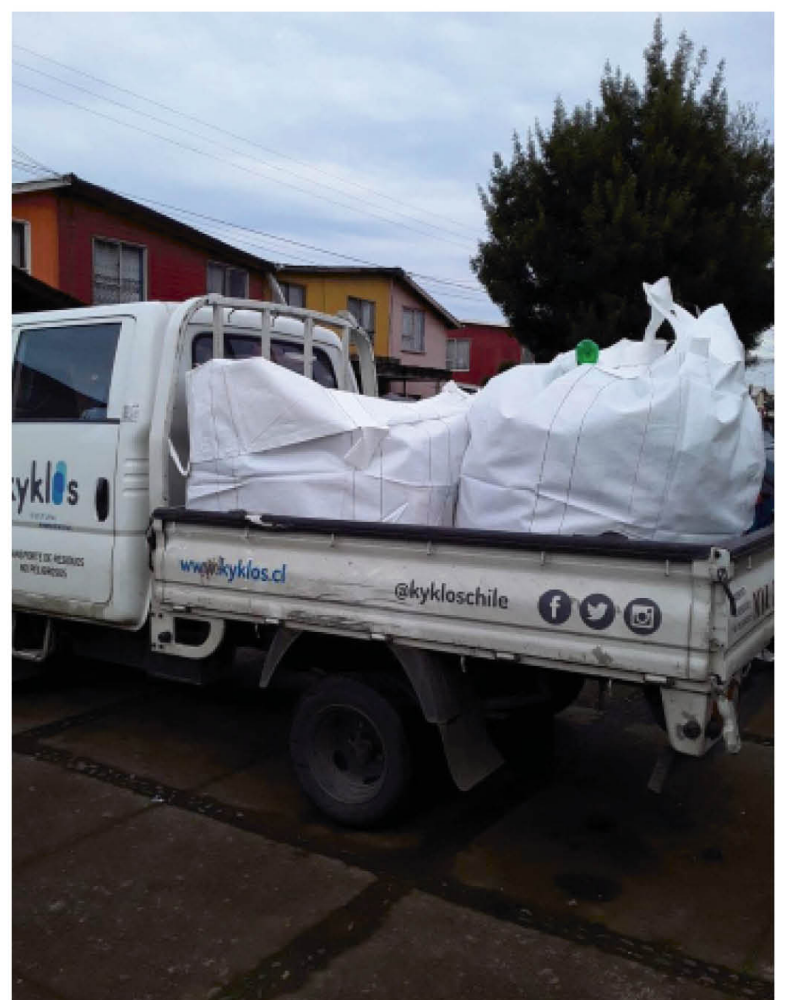
EN LA INICIATIVA trabaja la comunidad junto al municipio, CMPC y a Kyklos.