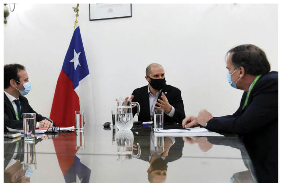
LOS REPRESENTANTES DE LA FEDERACIÓN destacaron el rol de los medios de comunicación en los siete procesos electorales que vivirá el país.

Los representantes de la Federación resaltaron la importancia de los medios