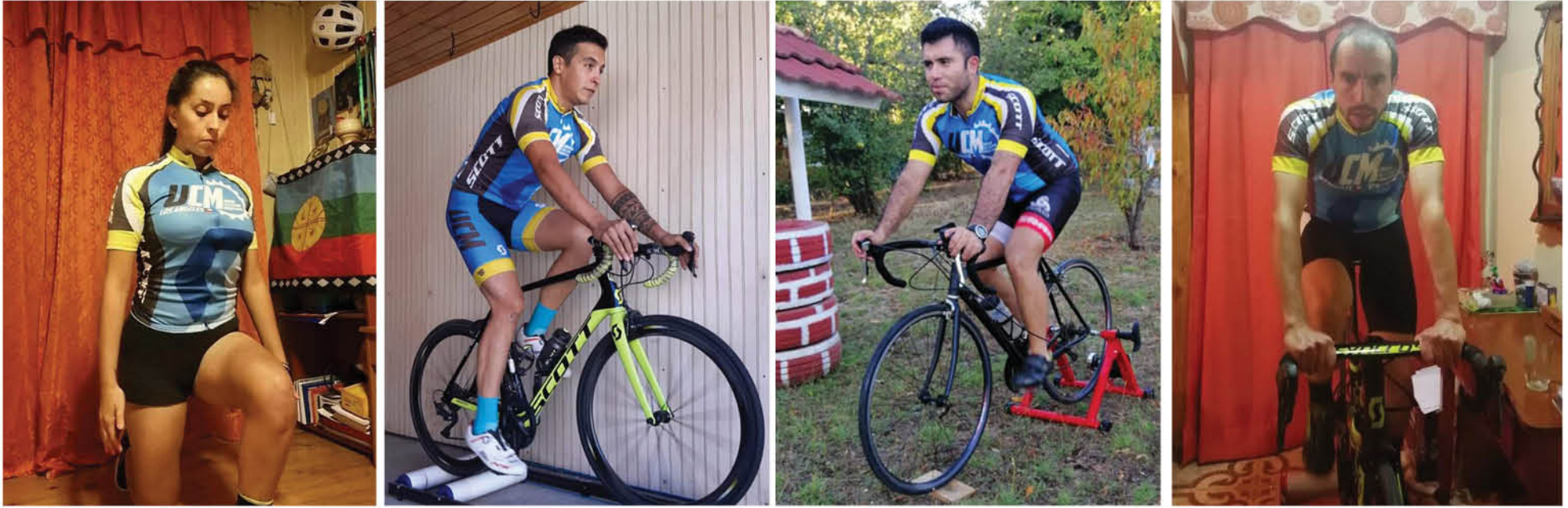
UCM SCOTT LOS ÁNGELES ha logrado mantener una adecuada preparación deportiva desde casa para las competencias que se encuentran programadas, de cara a la temporada 2021.

El elenco angelino que ha logrado destacar en el contexto nacional y local durante los últimos años, sigue trabajando desde casa enfocado en mantener el nivel competitivo.