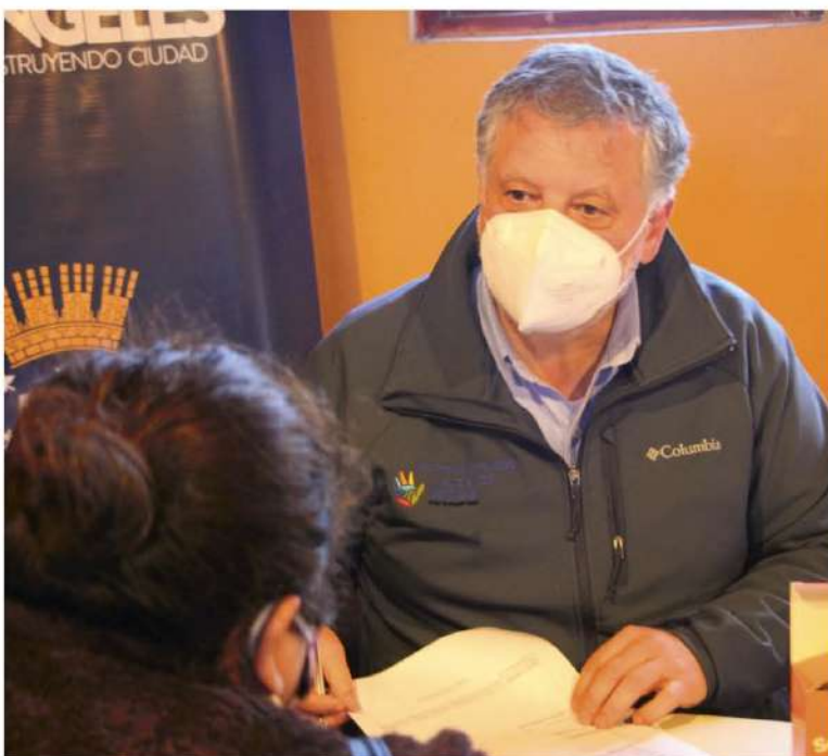
EL ALCALDE ESTEBAN KRAUSE entregó detalles del programa de apoyo social aprobado por el Concejo Municipal.