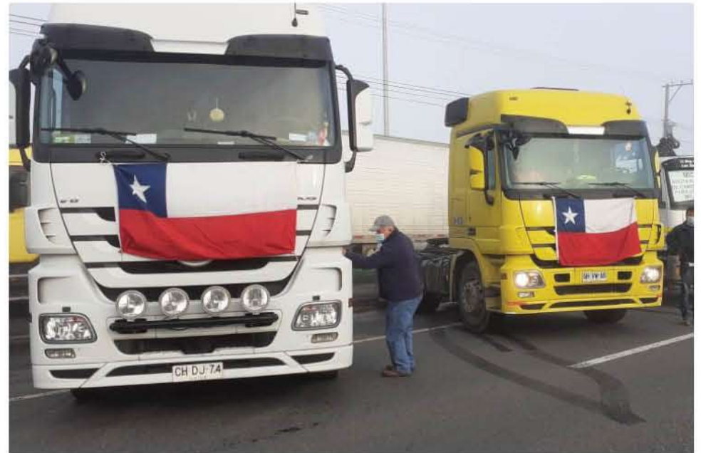
MILES DE CAMIONES SE ENCUENTRAN APOSTADOS en las principales rutas del país, a la espera de lograr un acuerdo con el gobierno.

Desde La Moneda, el ministro del Interior, Víctor Pérez, dijo que el Gobierno está sorprendido por el rechazo “porque este documento fue construido