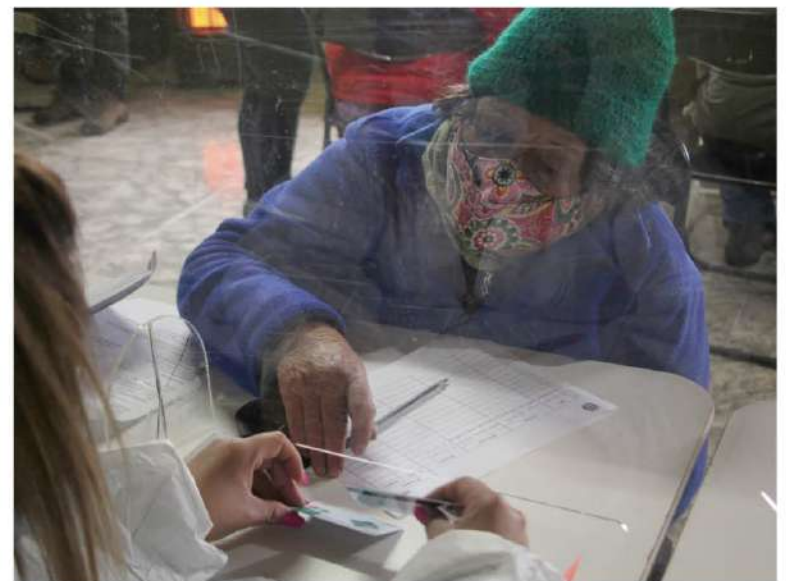
LA DISTRIBUCIÓN DE LA AYUDA social significará un importante despliegue para abarcar el territorio comunal.

Krause hizo notar que la implementación de la ayuda social a las familias más afectadas dentro del territorio comunal implicará un despliegue logístico importante “para llegar a todos los sectores, urbanos y rurales”.