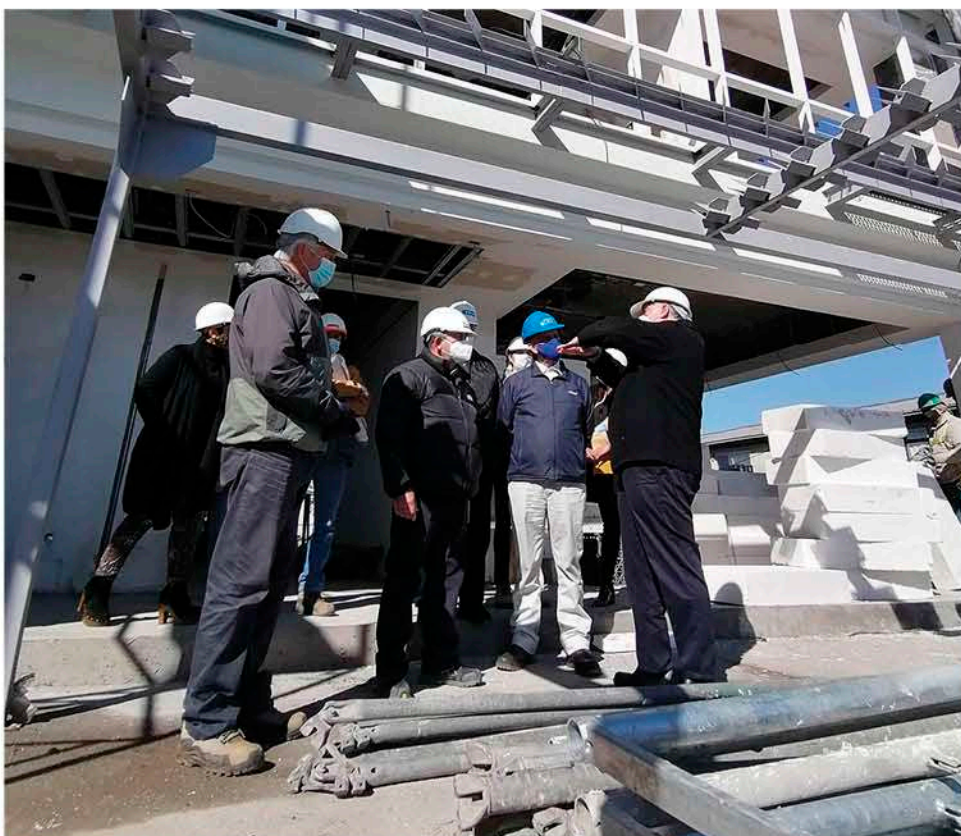
LAS OBRAS FUERON RECORRIDAS en su totalidad por las autoridades.

A su juicio, “no se trata solo de los trabajadores, sino de tener actividad económica y generar una rueda que produzca riqueza donde el rubro de la construcción es uno de los más relevantes de Los Ángeles”.