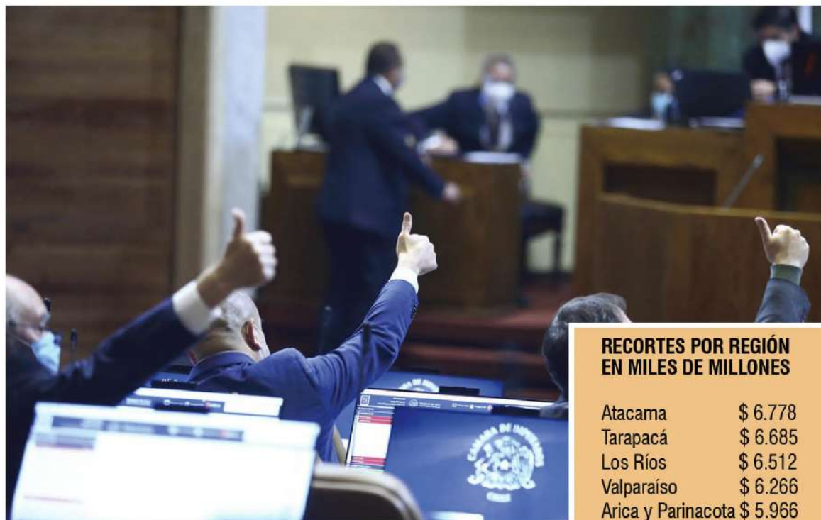
LA DIPUTADA DESVELÓ que las palabras del director de Presupuesto pueden ser interpretadas para construir el Estadio de Los Ángeles.