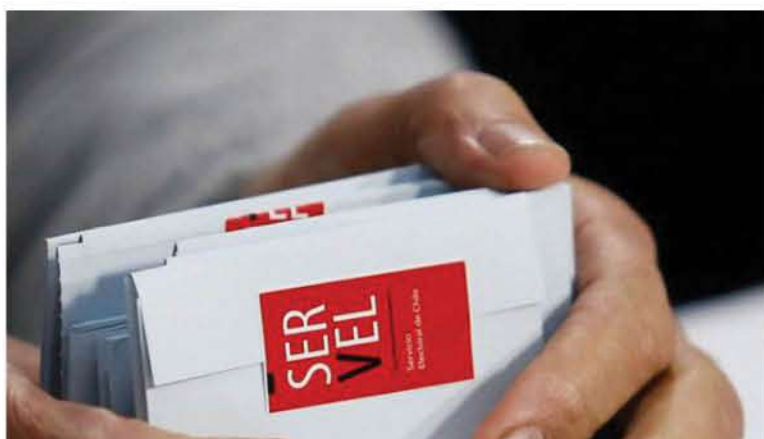
EL PLEBISCITO MANTIENE hasta el momento la fecha de votación pactada para el 25 de octubre.

El sondeo reveló que el 25% afirma que los contagiados podrían sufragar en locales o mesas especiales y el 10% piensa que es mejor que no participen del proceso constituyente.