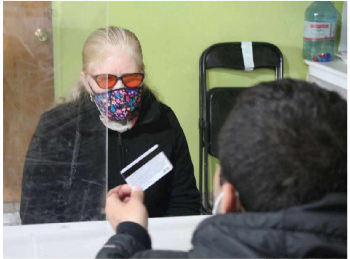
LAS GIFTCARDS YA FUERON implementadas por el municipio angelino para favorecer a más de 13 mil personas. Con la inyección de recursos, el beneficio se podría ampliar de manera sustantiva.

deran poco más de 200 millones de pesos, entre vales de gas licuado, cajas familiares y raciones de alimentos.