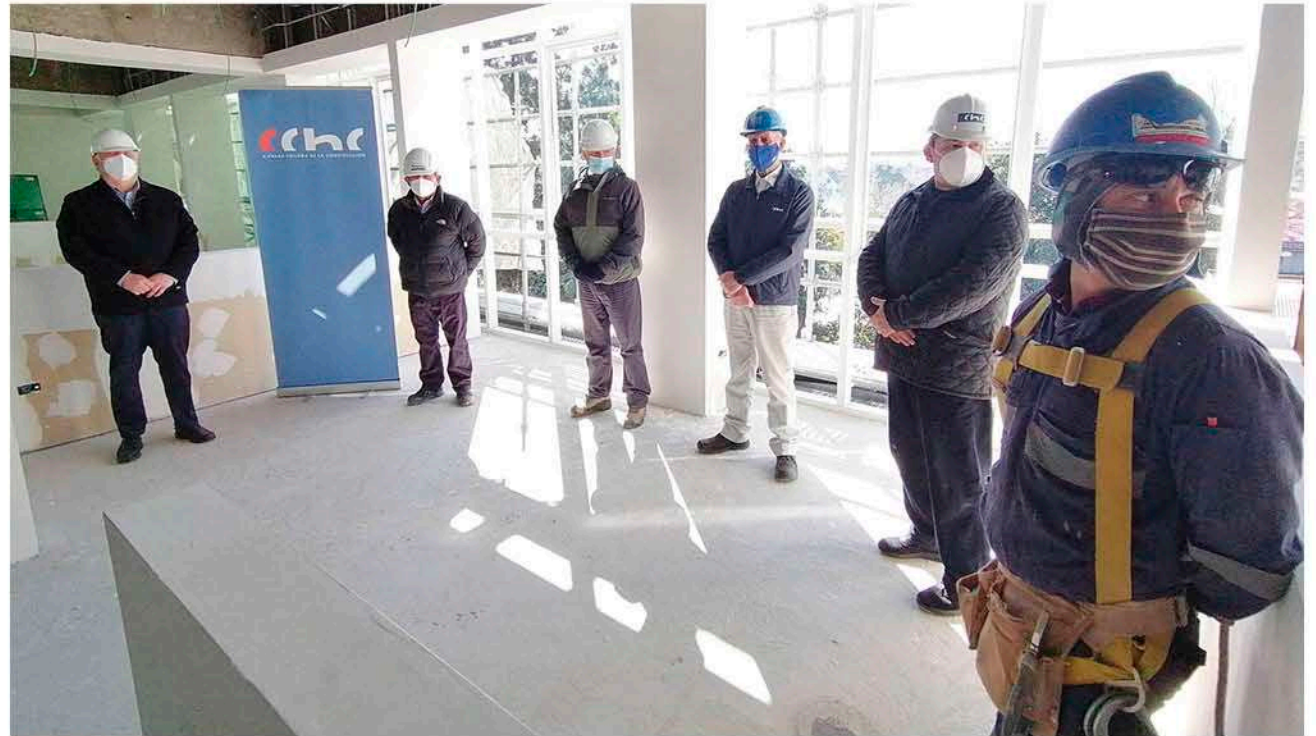
LA EMPRESA A CARGO DE LAS OBRAS ha tenido que poner especial acento en el cumplimiento de las medidas sanitarias para proteger la salud de los trabajadores y mantener el ritmo de los trabajos.

Pero no se trata de la única medida para mantener a raya la enfermedad. También hay medidas muy consabidas, como el uso permanente de mascarillas en todos los ope-