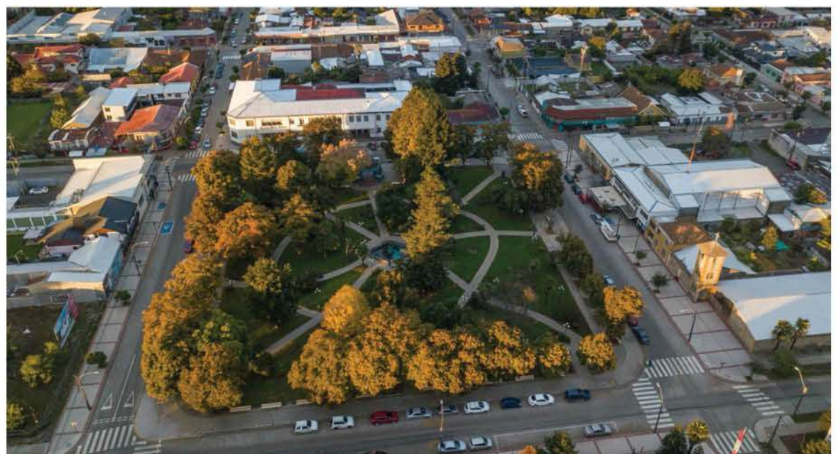
EL MUNICIPIO BUREANO convocó una mesa de trabajo con distintos actores para abordar la situación relacionada con la pandemia.