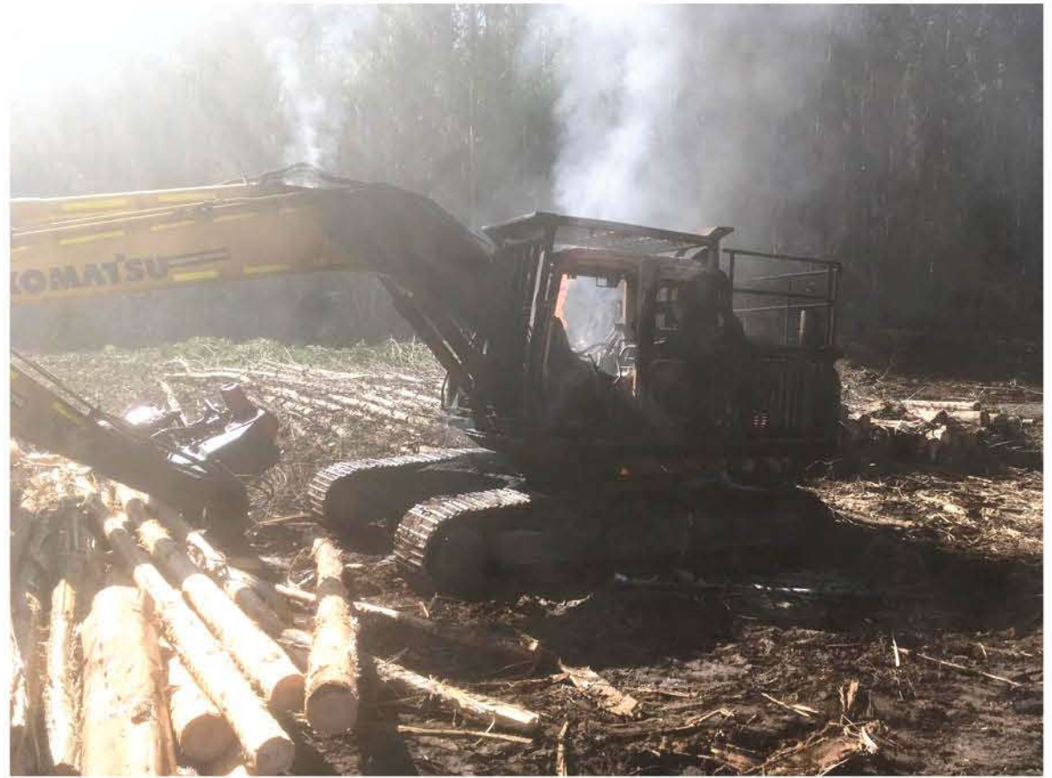
DESCONOCIDOS PROVISTOS DE ARMAS DE FUEGO, tipo fusiles, abandonaron el lugar luego de incendiar maquinaria forestal.

El gobernador de Biobío, Ignacio Fica dijo que un grupo indeterminado de personas fue la que atacó una faena forestal en donde se encontraba operando la empresa Besalco pero que pertenece a la empresa Mininco, y que espera que se pueda dar con el paradero de