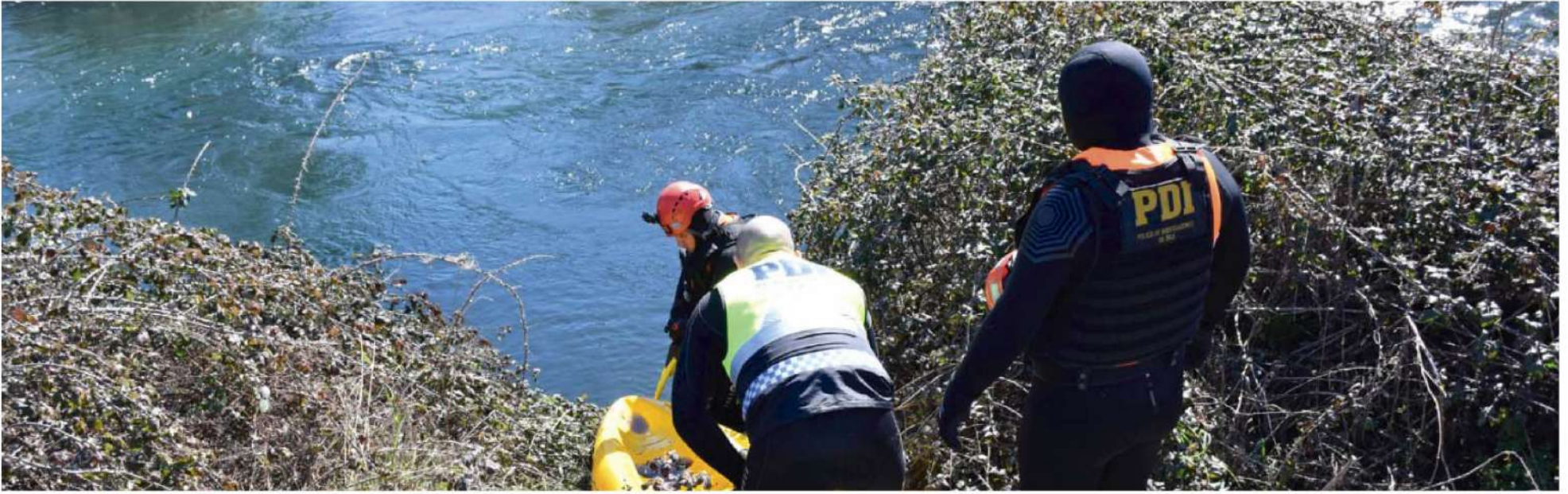
EL CAUCE DEL ESTERO DIUTO presenta algunos tramos de mucha corriente, por lo que el implemento usado por la brigada especializada para desplazarse por el agua fue un kayak.