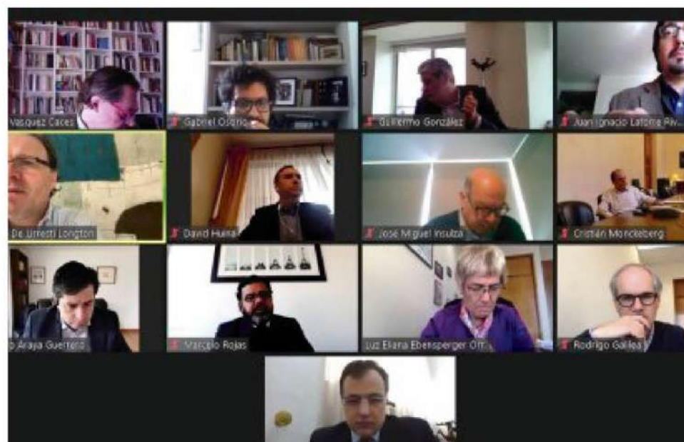
EL PRÓXIMO 25 DE OCTUBRE se realizará el Plebiscito Constituyente.

La iniciativa ya fue aprobada en general y dentro del plazo