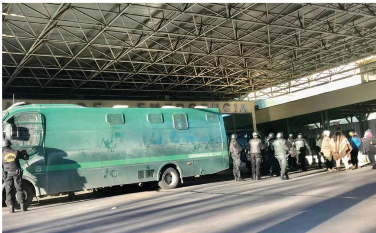
LA MAÑANA DEL LUNES LLEGARON desde la comuna de Lebu los 12 presos mapuche que se encontraban en huelga de hambre.