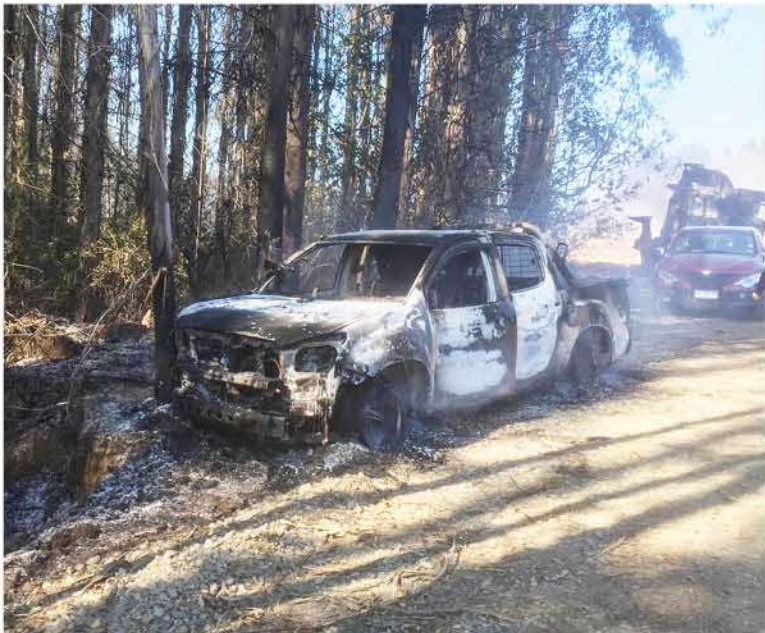
EL ATAQUE TAMBIÉN comprometió vehículos menores.

Muñoz manifestó que en conjunto con el Ministerio Público de Los Ángeles y personal especializado de Concepción de la PDI, estarán trabajando para encontrar a los responsables de este acto delictual lo antes posible.