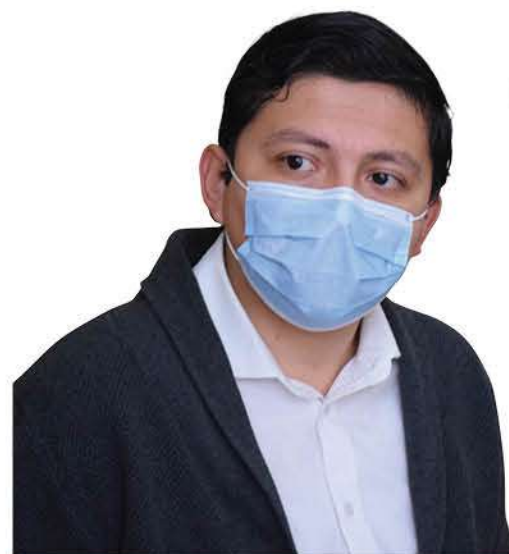
Ignacio Fica, gobernador.

“Esperamos que se logre dar cuánto antes con el paradero de los responsables de este ataque en la comuna de Mulchén, situación en la que las policías están trabajando de forma ardua”.