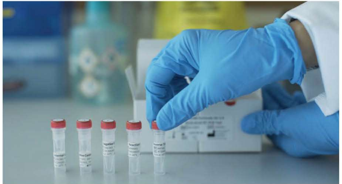
MULCHÉN ES LA SEGUNDA COMUNA de la provincia de Biobío con mayor número de casos activos después de Los Ángeles.

Mulchén, con tan solo 30 mil habitantes, ayer superó por segundo día consecutivo el número de nuevos contagios de Los Ángeles. De hecho, en tres