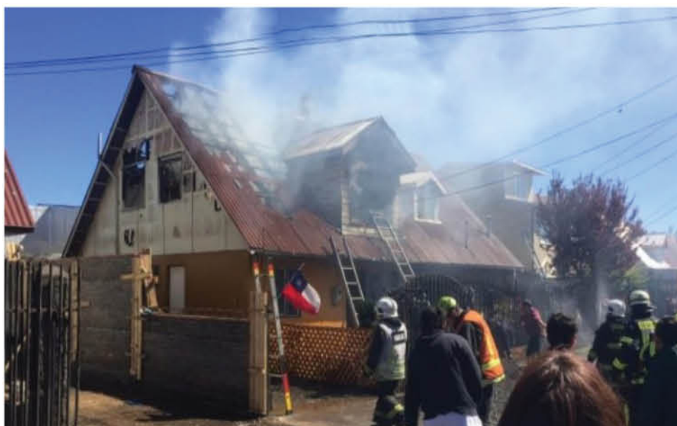
CERCA DE 120 EMERGENCIAS asociadas con inflamación de estufas ha atendido Bomberos en lo que va del 2020, temporada que aún no termina.