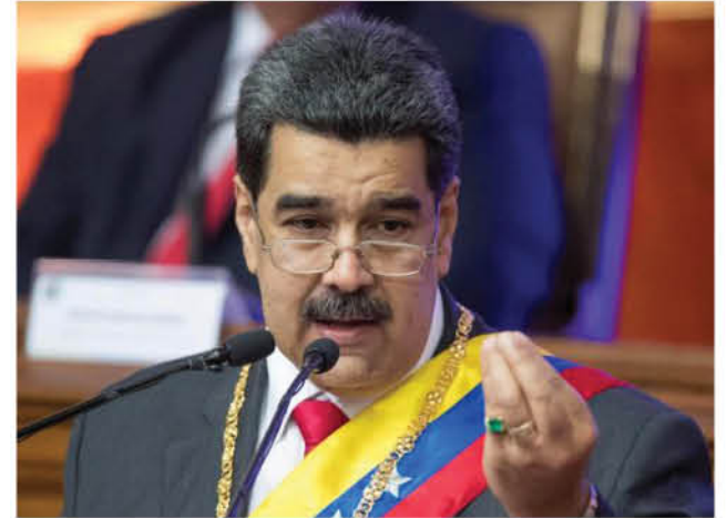
TRAS LEER DETENIDAMENTE el informe de la ONU, el gobernador de Biobío habló de Dictadura y condenó el régimen político de Venezuela.

En este sentido, Fica dijo que “acá hay que decirlo con claridad, esta dictadura ha afectado a muchos ciudadanos venezolanos, a muchas personas que por elegir un futuro distinto se encuentran en nuestro país”. Como chilenos, agregó el gobernador de Biobío, “hemos recibido a cada uno de los venezolanos que han llegado a nuestro país, teniendo el objetivo claro