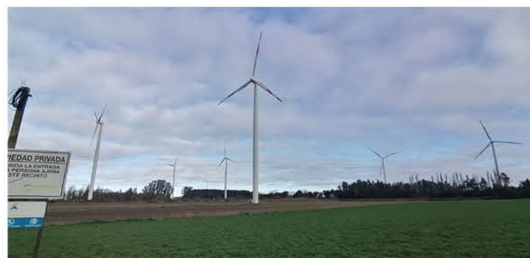
CERCA DE EL CIRUELO se encuentra el parque eólico Cuel, el primero de su tipo en la zona que presentó reclamos de la comunidad por los ruidos molestos.