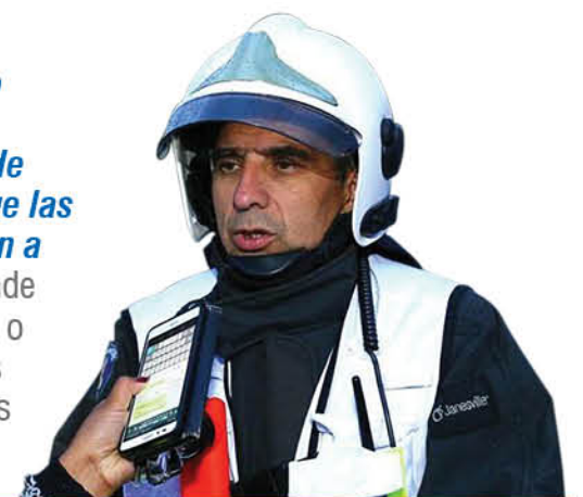
Raúl Márquez, comandante del Cuerpo de Bomberos de Los Ángeles.

“Presuponíamos que este año iba a registrarse un descenso en la ocurrencia de este tipo de emergencias, atendiendo a que las personas por la pandemia iban a estar más en su casa, y por ende iba a haber una mayor atención o preocupación por los artefactos de calefacción, sin embargo nos anduvimos equivocando”.