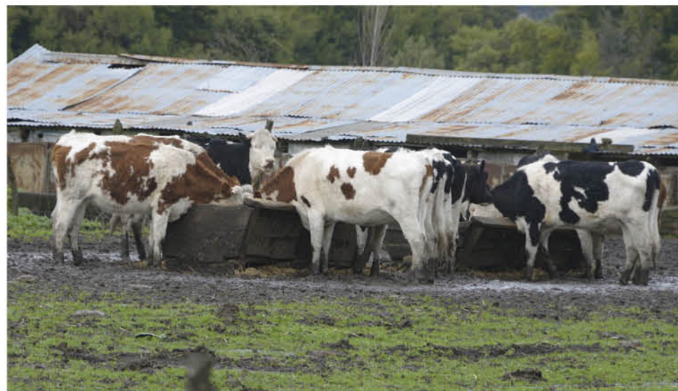
CON LA PRESENTACIÓN DE LA DENUNCIA en el Ministerio Público, se busca establecer quién o quiénes fueron los responsables de la adulteración de la edad del ganado.

En la reciente declaración, el SAG asegura que “sí es posible sostener que se han adoptado las medidas necesarias para cautelar el patrimonio zoonosanitario del país, respondiendo el Servicio con prontitud y en el marco de sus atribuciones y deberes legales”.