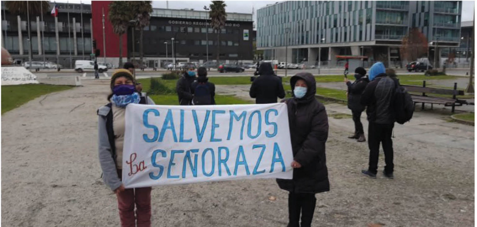
LOS VECINOS DE LAJA QUE ESTÁN A FAVOR DE LA REALIZACIÓN de un Estudio de Impacto Ambiental han realizado diversas manifestaciones para ser escuchados en su demanda de resguardar el humedal urbano.

Esta semana se llevaron a cabo los alegatos en la Corte en el marco de los dos recursos de protección interpuestos por la comunidad en contra de la Municipalidad papelera.