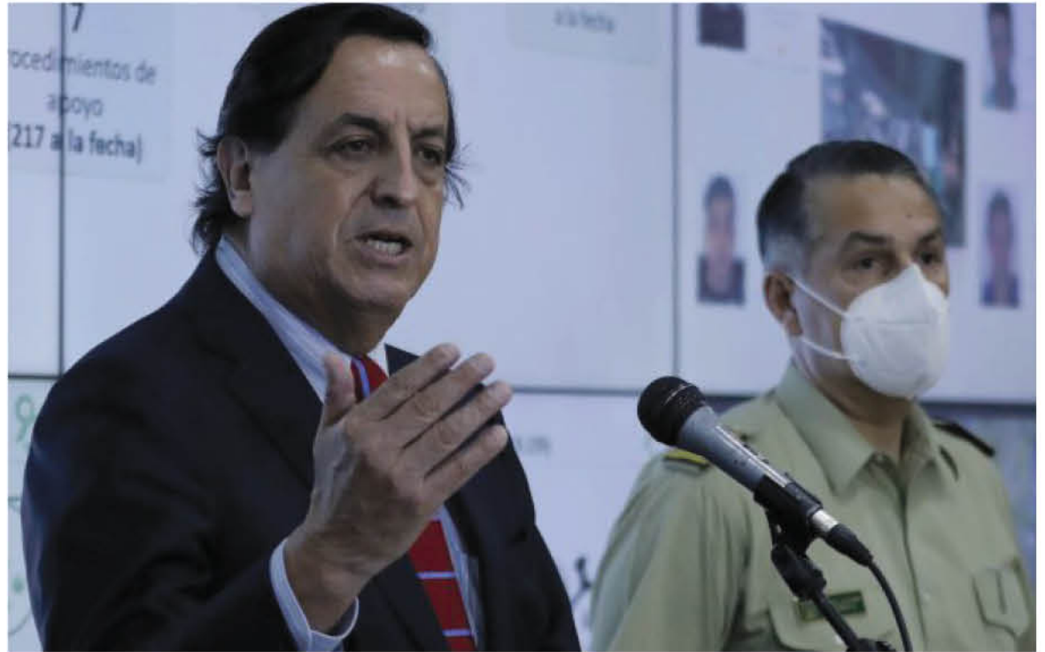
EL GOBIERNO HA CUESTIONADO en reiteradas ocasiones que la oposición recurra al instrumento de la acusación constitucional.