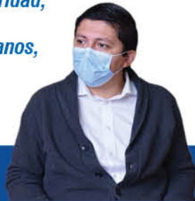
Ignacio Fica, gobernador de Biobío.

“Acá hay que decirlo con claridad, esta dictadura ha afectado a muchos ciudadanos venezolanos, a muchas personas que por elegir un futuro distinto se encuentran en nuestro país”.