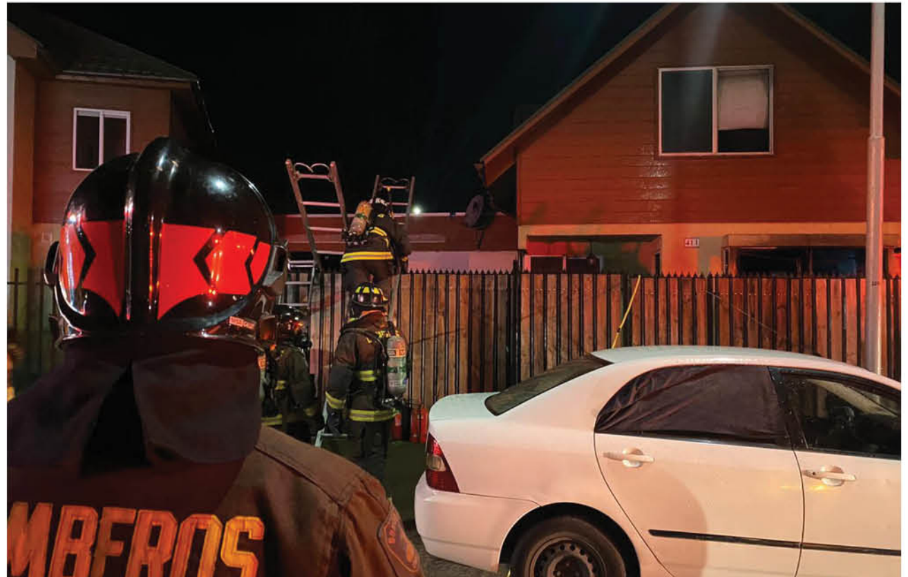
LAS ESTUFAS A PELLETT también requieren de mantención enfatizó Bomberos, tras acudir a un incendio de vivienda que se originó por este artefacto en Fiestas Patrias.

Hasta la fecha, se han registrado cerca de 120 llamados por este motivo y la temporada aún no termina. Si se analizan los números de los últimos cinco años, la estadística 2020 se aproxima a las