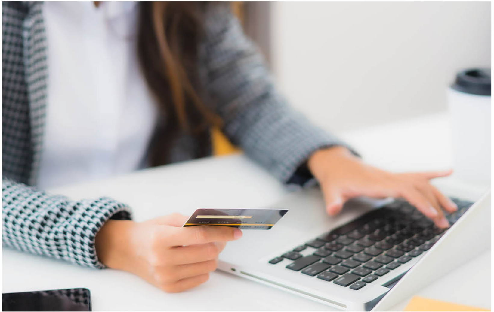
LAS HERRAMIENTAS DIGITALES son fundamentales a la hora de mostrar y vender productos.

un símil de lo que son los cyber day pero enfocado en las pymes. Esta vitrina se va a llevar a efecto en los meses de septiembre, octubre, noviembre y diciembre. La inscripción es gratuita para las empresas y podrán mostrar la oferta y vender sus productos".