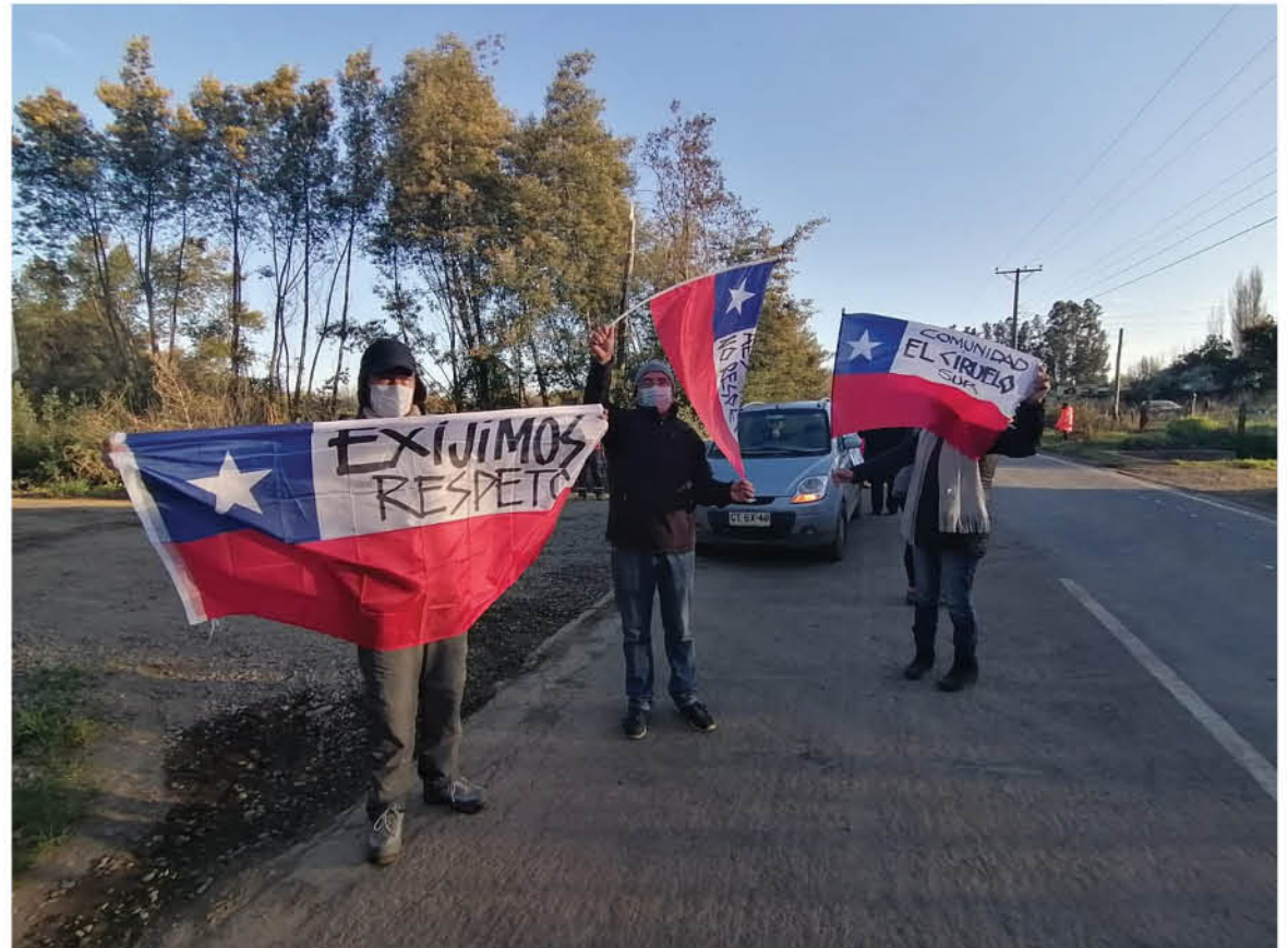
CON BANDERAS Y LIENZOS, los vecinos de El Ciruelo salieron a protestar contra las obras del parque eólico.

Asimismo, puso reparos en que no estuviera disponible la información sobre los cambios al proyecto. Recor-