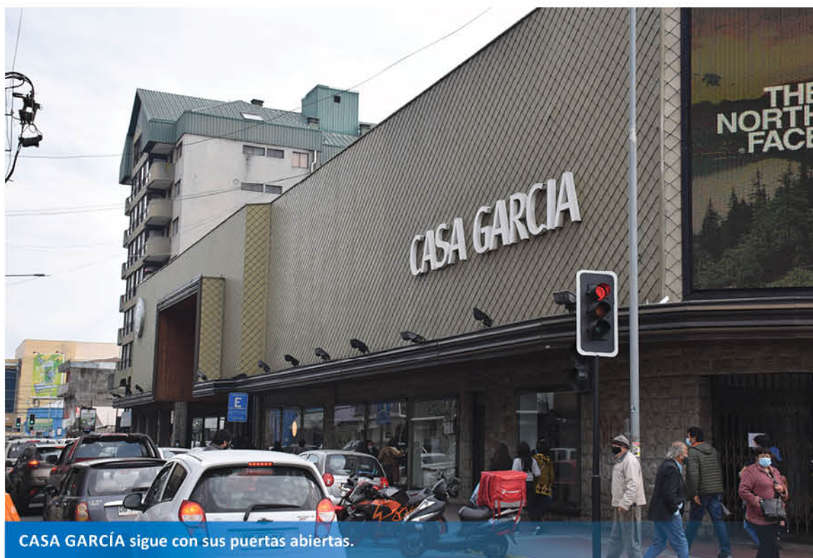
CASA GARCÍA sigue con sus puertas abiertas.