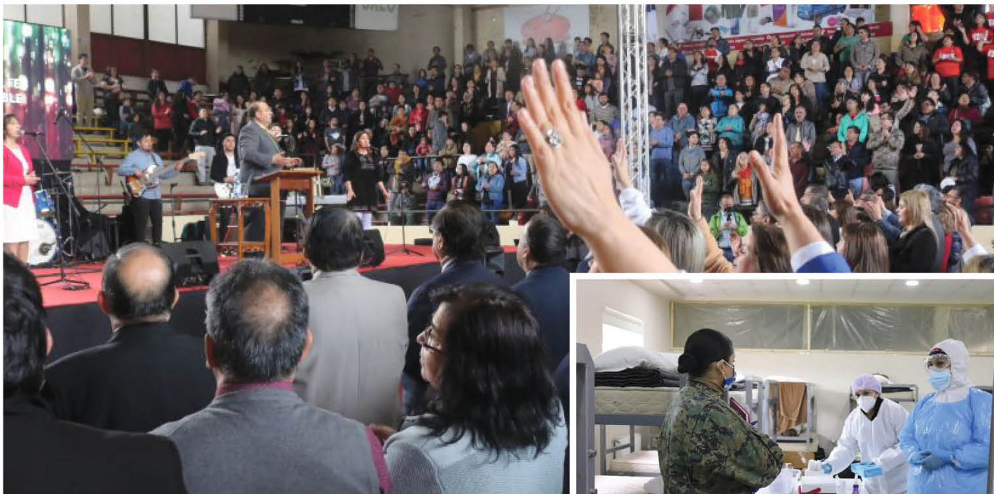
LA AUTORIDAD DE SALUD SEÑALÓ que el protocolo indica que están permitidas las reuniones, con un máximo de 25 personas en espacios cerrados y de 50 en espacios abiertos.