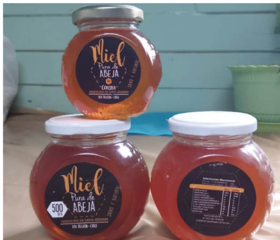
LA MIEL DE LOS PRODUCTORES LOCALES viaja hasta el Medio Oriente para deleitar el paladar de los árabes.

Actualmente Coasba está integrada por más de 45 apicultores, de los cuales 30 están vinculados al Programa de Alianzas Productivas (PAP) de Indap, cuyo objetivo es articular, en forma sostenible, iniciativas de continuación productiva entre un poder comprador y los proveedores de productos y servicios de la agricultura familiar campesina. En este sentido Salamanca indicó que desean seguir expandiendo su producción y que para esto, están recibiendo apoyo desde el Ministerio de Agricultura, a través de Indap, pero que de todas formas es necesario que se sigan