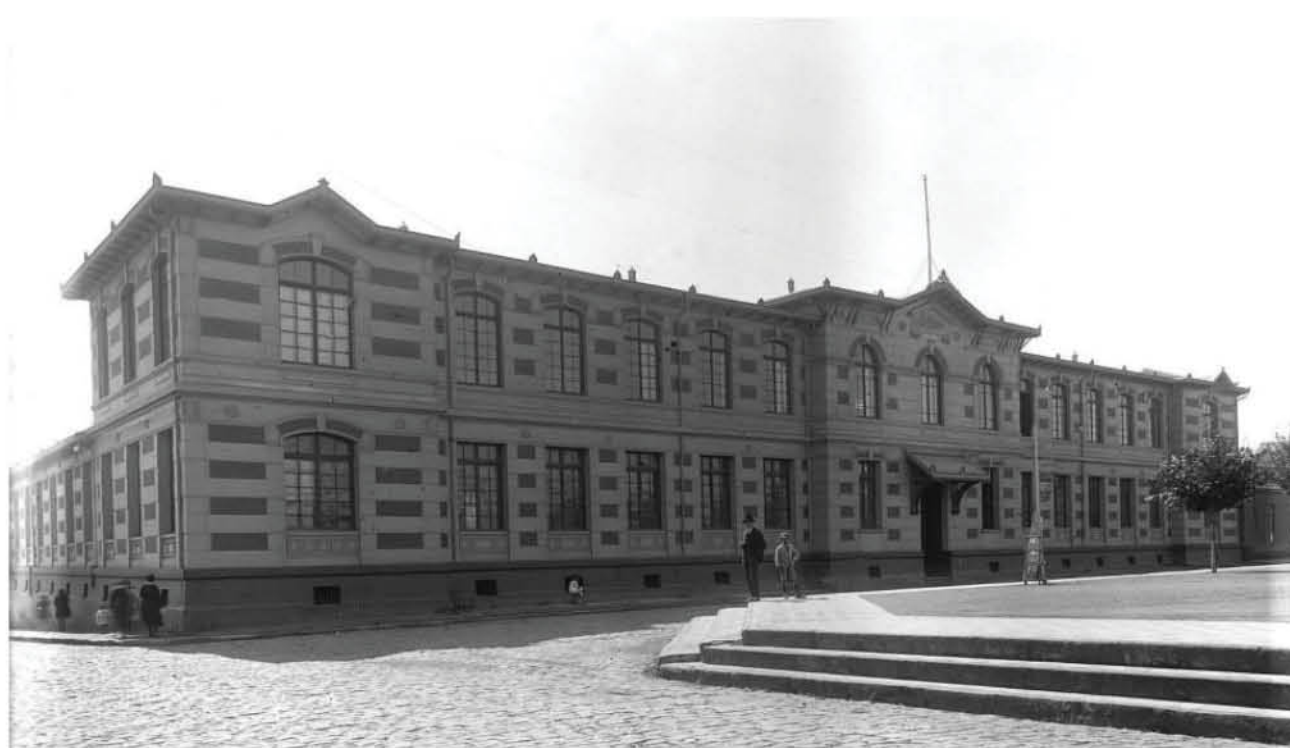
LICEO DE HOMBRES, ubicado en calle Lautaro frente a la Plaza de Armas.

Enormes cambios ha experimentado desde todo punto de vista la capital de la provincia en apenas 80 años. La presente crónica recoge lo que existía en la ciudad de aquel entonces.