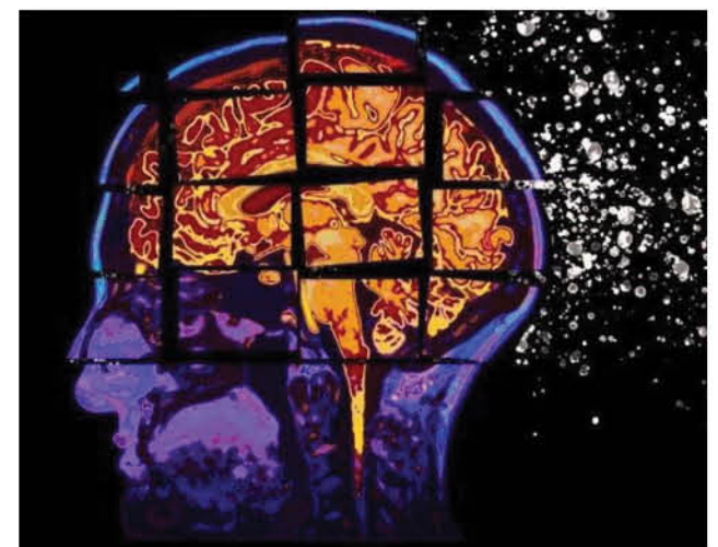
LA PRÁCTICA DE ACTIVIDADES FÍSICAS contribuye a evitar la enfermedad; en cambio la mala alimentación es un factor clave para el desarrollo de la misma.

Con este avance, la propuesta científica se posiciona como una alternativa "única en el mundo que con una tecnología sencilla permite tener información certera y predictiva, no solamente de diagnóstico sino que de detención tem-