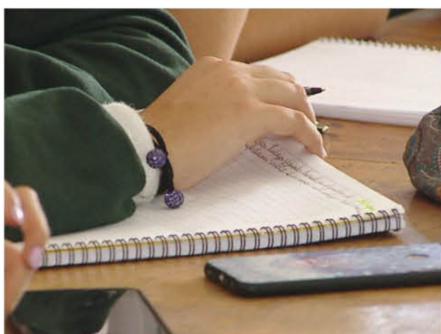
EL REGRESO PRESENCIAL a las aulas de clases sido cuestionado transversalmente tanto por apoderados como por el colegio de profesores.

El retorno consistiría en sumar clases online, talleres presenciales y voluntarios, que tendrán foco en lo socioemocional. Además, tienen contemplado llevar los talleres al aire libre, a espacios amplios como el casino o las canchas. Todo planificado, sin embargo, aún no cuentan con el permiso ministerial, según precisó el Mineduc.