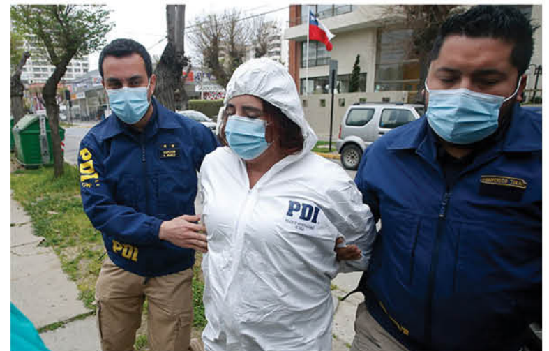
LA AUDIENCIA COMENZÓ a las 11:00 de la mañana y se extendió hasta cerca de las 14:00 horas.