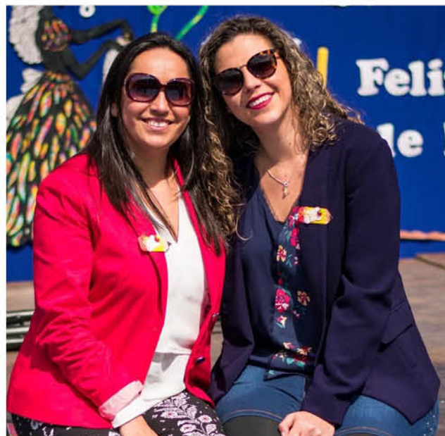
LA DIRECTORA INDICÓ que lo particular de este ciclo de aprendizaje semanal, es que cada profesor elabora sus cápsulas, donde explica la materia o el contenido que van a tratar.

Esta es una modalidad comenzó a implementarse a mediados de agosto y es 100 por ciento virtual, donde cada establecimiento puede aplicar un diagnóstico vía remota con sus estudiantes sin necesidad de imprimir los instrumentos, pero sí contemplan cuestionarios socioemocionales y pruebas censales en Lectura y Matemática, y estará disponible de 7° básico a 4° medio, para luego incorporar de 1° a 6° básico.