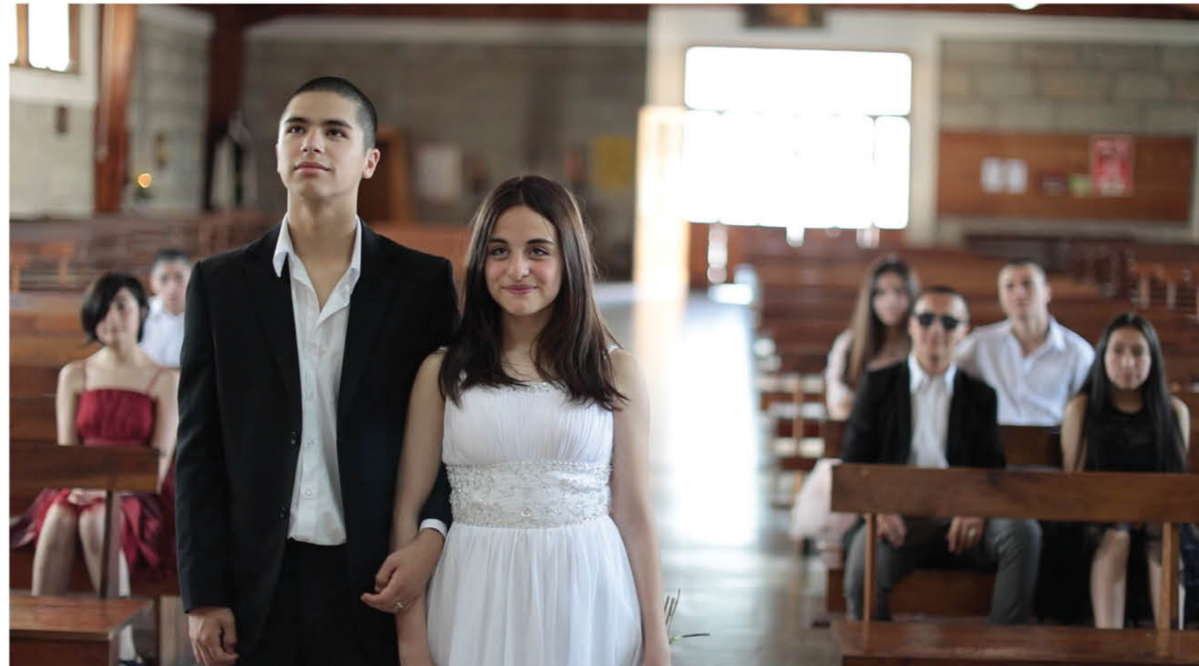
"EL AMOR NO DUELE" trata la historia de Elena y Bryan, dos jóvenes enamorados desde el liceo hasta el matrimonio relatando un círculo de violencia que sólo traerá trágicas consecuencias.

Agregó que en su rol profesional se siente alegre porque "esta selección oficial en festivales internacionales es muy significativa, ya que hablamos de instancias de participación con un alcance global, en donde se postulan creadores de todo el mundo y la