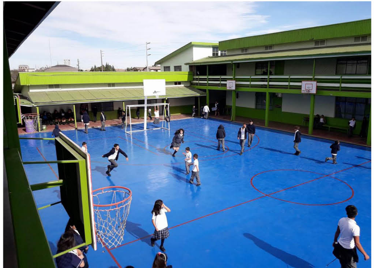
EL COLEGIO ALIWEN es una institución que nació el año 2017 y está a cargo de la corporación educacional Alihuen Suyai, cuyo significado es "árbol de esperanza".

Es desde esa mirada que el colegio Aliwen sobresale del resto con una simple y amigable plataforma que ayuda a los padres y alum-