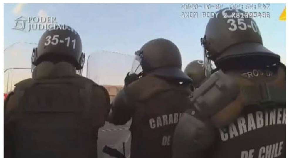
LA AUDIENCIA DE CONTROL DE DETENCIÓN y formalización de la investigación contra el carabinero Sebastián Zamora (22).