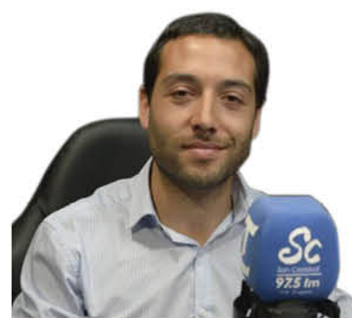
Sebastián Abudoj Seremi de Bienes Nacionales

“Este proyecto tenemos que finiquitarlo con la ayuda de las autoridades de turno y de cualquier color político. Voy a golpear las puertas que sean necesarias en Los Ángeles, Concepción, e incluso Santiago”.