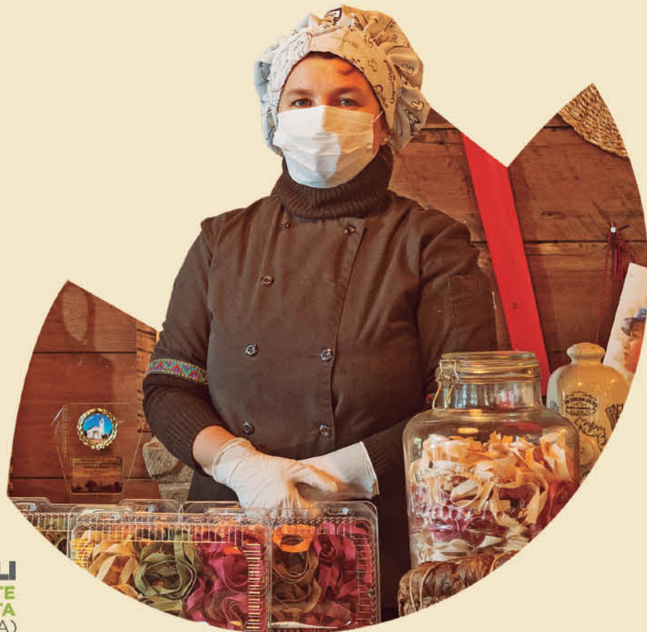
ANITA COVILI RISTORANTE Y PASTA LUMACO (ARAUCANÍA)