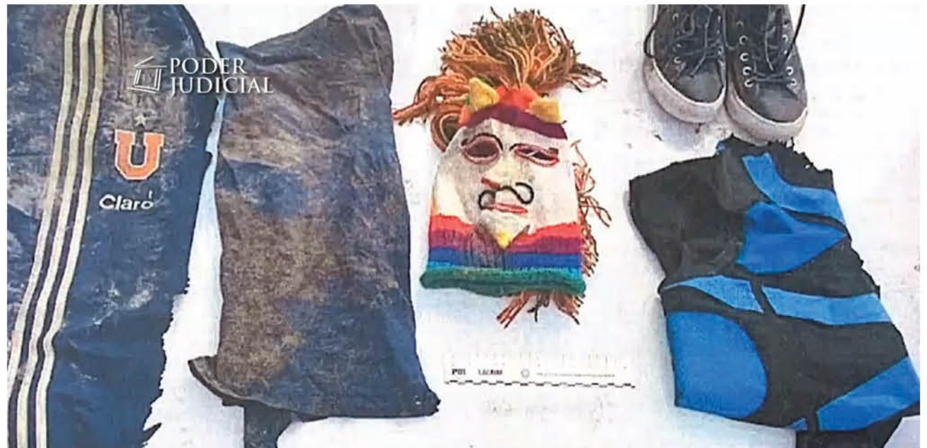
EN LA AUDIENCIA se mostraron las pertenencias del joven, dando cuenta de que en la mochila sólo tenía ropas y una máscara para gas.

Con todo, descartó que existan argumentos suficientes para “aplicar la medida tan gravosa como la prisión preventiva; esta parte considera que pue-