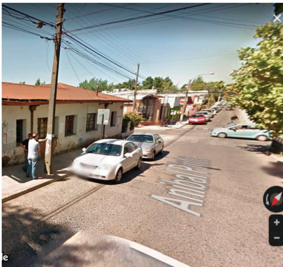
EN LA CUADRA CUATRO de la calle Aníbal Pinto se encontró el cuerpo del adulto mayor.

El detenido, que no presenta antecedentes policiales anteriores, fue puesto a disposición del Tribunal de Garantía de Concepción para el respectivo control de detención.