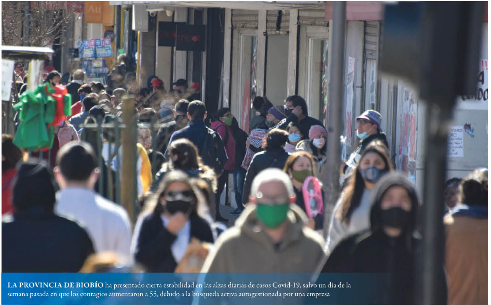
LA PROVINCIA DE BIOBÍO ha presentado cierta estabilidad en las alzas diarias de casos Covid-19, salvo un día de la semana pasada en que los contagios aumentaron a 55, debido a la búsqueda activa autogestionada por una empresa

Hasta ayer, la provincia de Biobío mantiene la cifra más baja de casos activos de la región, con 214 personas en posibilidad de transmitir el coronavirus, mientras que Arauco cuenta con 317 y Concepción con 1252, según el último reporte de la Seremi de Salud.