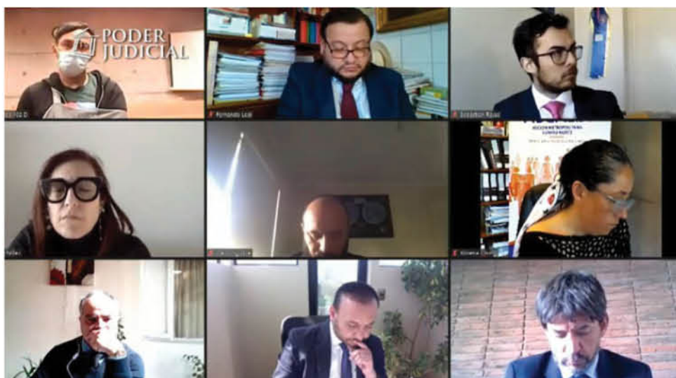
LA FISCAL XIMENA CHONG expuso diferentes pruebas, con las que dio cuenta de que el joven cayó producto de la acción del funcionario.

Además, el juez consideró que las grabaciones telefónicas “que dan cuenta de un procedimiento de detención que nunca ocurrió, y que se intentó validar mediante actos que por cierto significarán una investigación paralela y que el propio Ministerio Público anunció en lo sucesivo”. La falta de auxilio “también debe recogerse como antecedente para poder tener una visión cabal de los hechos”.