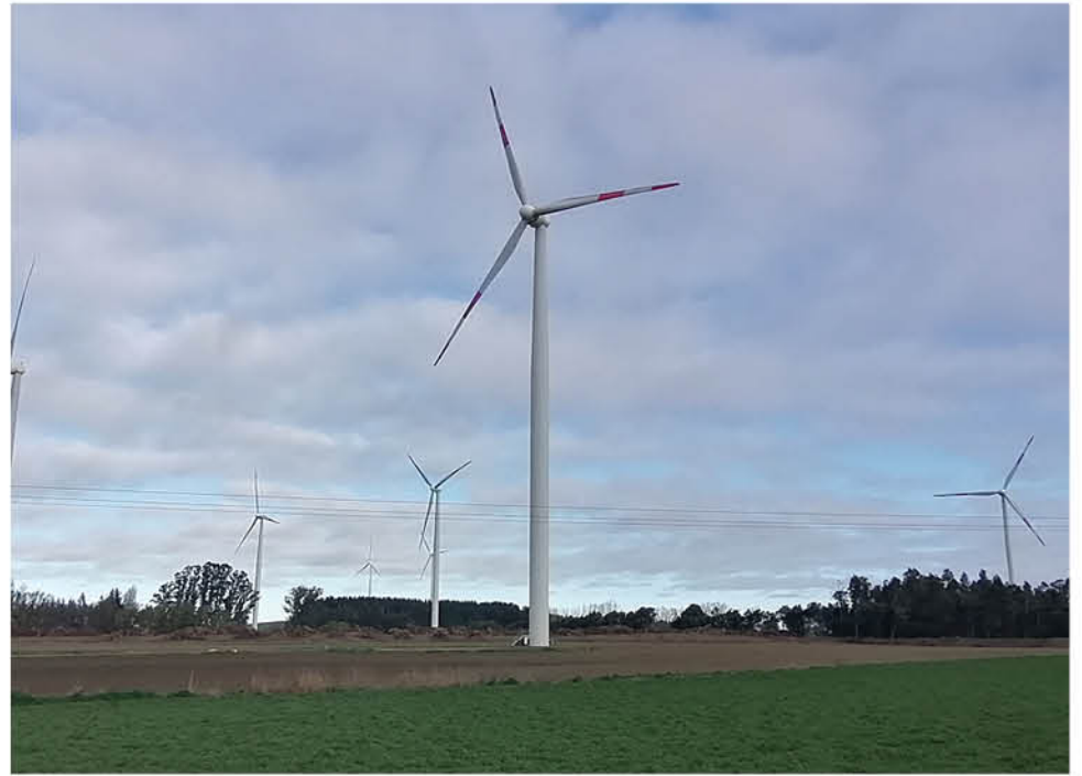
EN LA ÚLTIMA DÉCADA se ha producido la irrupción de dos alternativas de generación que también son naturales y renovables: las energías eólica y solar.

Aunque el potencial máximo aún no se puede estimar a ciencia cierta, el ejecutivo insistió en la importancia de llevar a cabo estudios “para determinar si un lugar es o no apto para producir el recurso. Son demasiados los factores a tomar en cuenta antes de iniciar el desarrollo de un proyecto. En Consorcio Eólico creemos que el potencial de la región es muy gran-