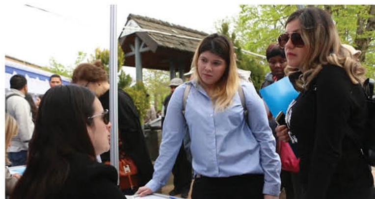
LAS PERSONAS INTERESADAS DEBERÁN ingresar a la plataforma ferialaboralomillosangeles.cl o al Facebook que lleva el mismo nombre.

La oficina municipal de intermediación laboral en Los Ángeles, ha