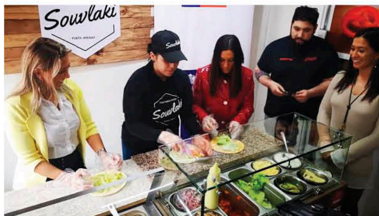
LA DIFERENCIA entre el capital Semilla y el Abeja Emprende es que el primero es para hombres y mujeres, mientras que el Abeja la postulación es sólo femenina.

programas abiertos a concurso en su versión 2020, en medio de la cuarentena que afecta a gran parte de la provincia de Biobío.