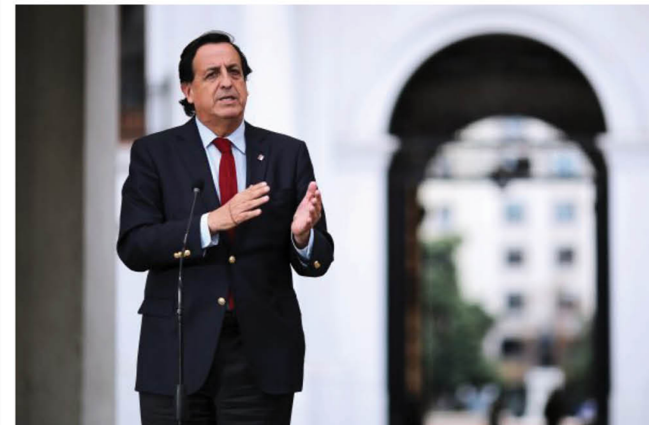
SEGÚN LO ESTABLECIDO POR LA OPOSICIÓN, la Acusación Constitucional contra Pérez debiera ser presentada esta jornada.

Sobre los abusos detectados en los bonos del Estado para la Clase Media la UDI ha calificado el actuar de un grupo de chilenos como “de la mayor gravedad las irregularidades detectadas en la entrega del Bono Destinado a la Clase Media, por lo que considera necesario que estas sean investigadas y se aplique las sanciones que la ley establece a quienes hayan obtenido fraudulentamente este beneficio, ya que no solo afectó gravemente recursos fiscales y la fe pública, sino además, dejó sin poder optar al bono a muchos chilenos que realmente lo necesitaban”.