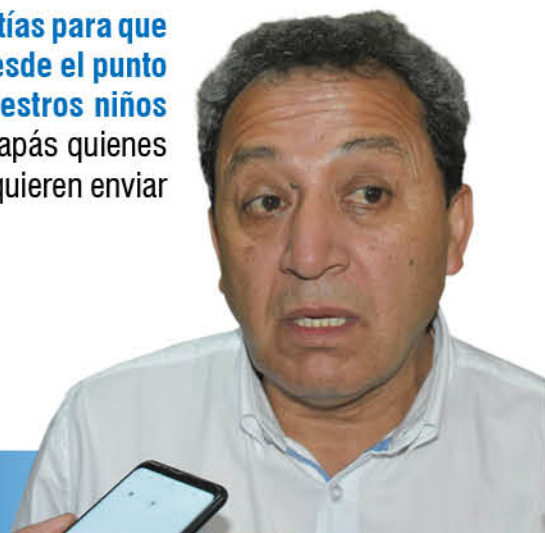
Vladimir Fica , alcalde de Laja.

“Yo voy a dar todas las garantías para que estén dadas las condiciones desde el punto de vista sanitario para que nuestros niños vuelvan a clases, y serán los papás quienes tomen la responsabilidad si los quieren enviar o no los quieren enviar”.