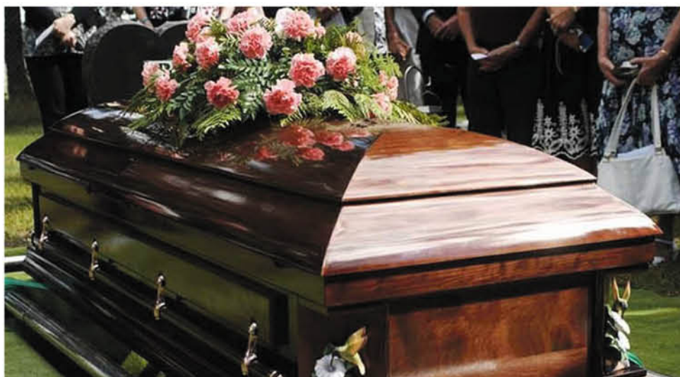
EL VELORIO DE ALTO IMPACTO se realizó en la población Santiago Bueras de Los Ángeles, mientras que el funeral tuvo lugar en uno de los cementerios públicos.

El féretro fue trasladado desde el norte del país a la capital provincial de Biobío durante el fin de semana, y recién ayer fue sepultado.