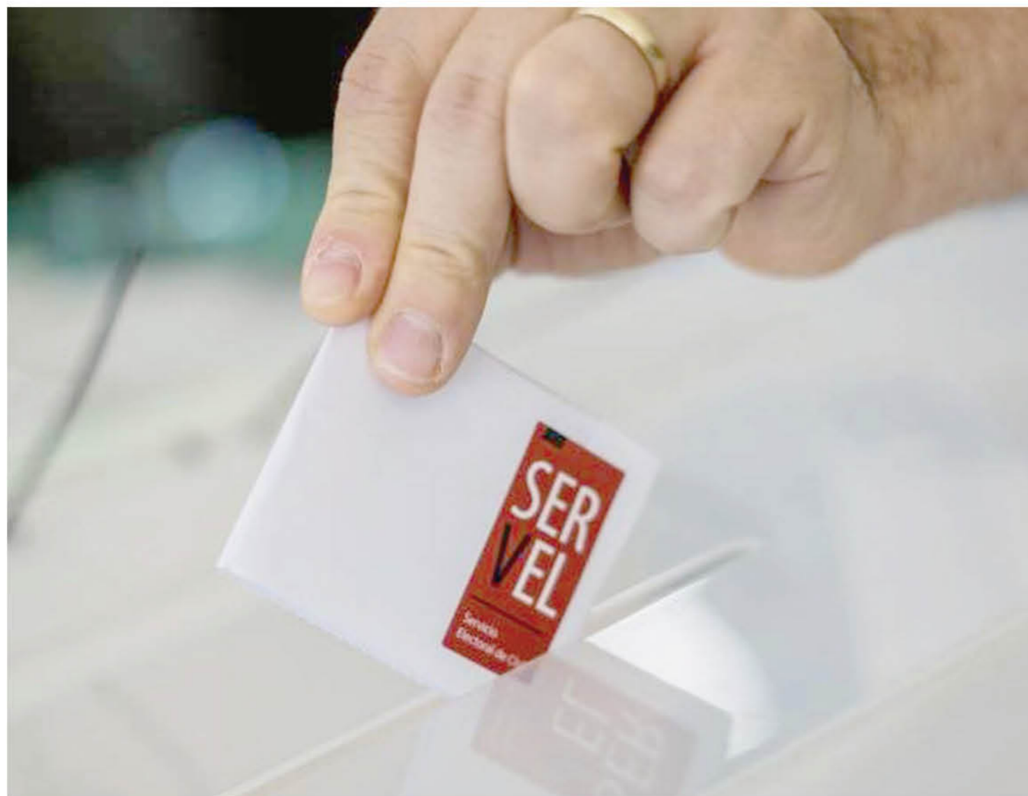
EL PROCESO CONSTITUYENTE ha sido garantizado en todas sus aristas, sobre todo en materia sanitaria.

A 17 días del plebiscito del 25 de octubre, el gobernador Ignacio Fica dio cuenta de todos los detalles para este proceso republicano. “Hemos estado en constante coordinación regional y provincial. Ayer tuvimos la última reunión de tantas que hemos tenido con los alcaldes, las policías, el Ejército, Salud y el Servel, donde acordamos los últimos detalles para que las personas vayan a sufragar de forma segura”, expresó este martes 6, la máxima autoridad provincial.