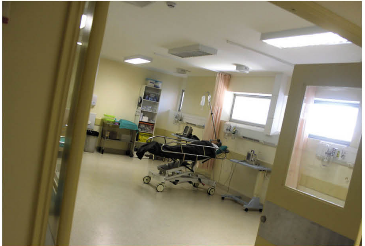
DESDE EL SERVICIO DE SALUD BIOBÍO informaron que todos los funcionarios contagiados se encuentran en buenas condiciones y ya están cumpliendo sus respectivas cuarentenas.

Por su parte el seremi de Salud Héctor Muñoz dijo que “todos los brotes en los diferentes centros de Salud son muy complejos para nosotros porque perdemos funcionarios que son clave muchas veces para otras patologías y para el trabajo que se hace en la pandemia misma”.