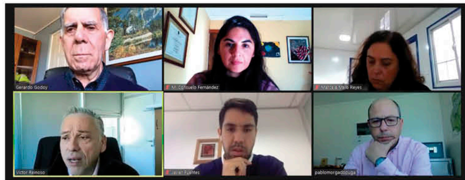
LA REUNIÓN entre la Mesa Directiva Regional de CChC Los Ángeles y el seremi Víctor Reinoso se llevó a cabo a través de la plataforma Zoom.

analizó el escenario de la reactivación económica a través de los proyectos de inversión pública que tiene el ministerio, que se complementa con los proyectos privados que tienen las empresas.