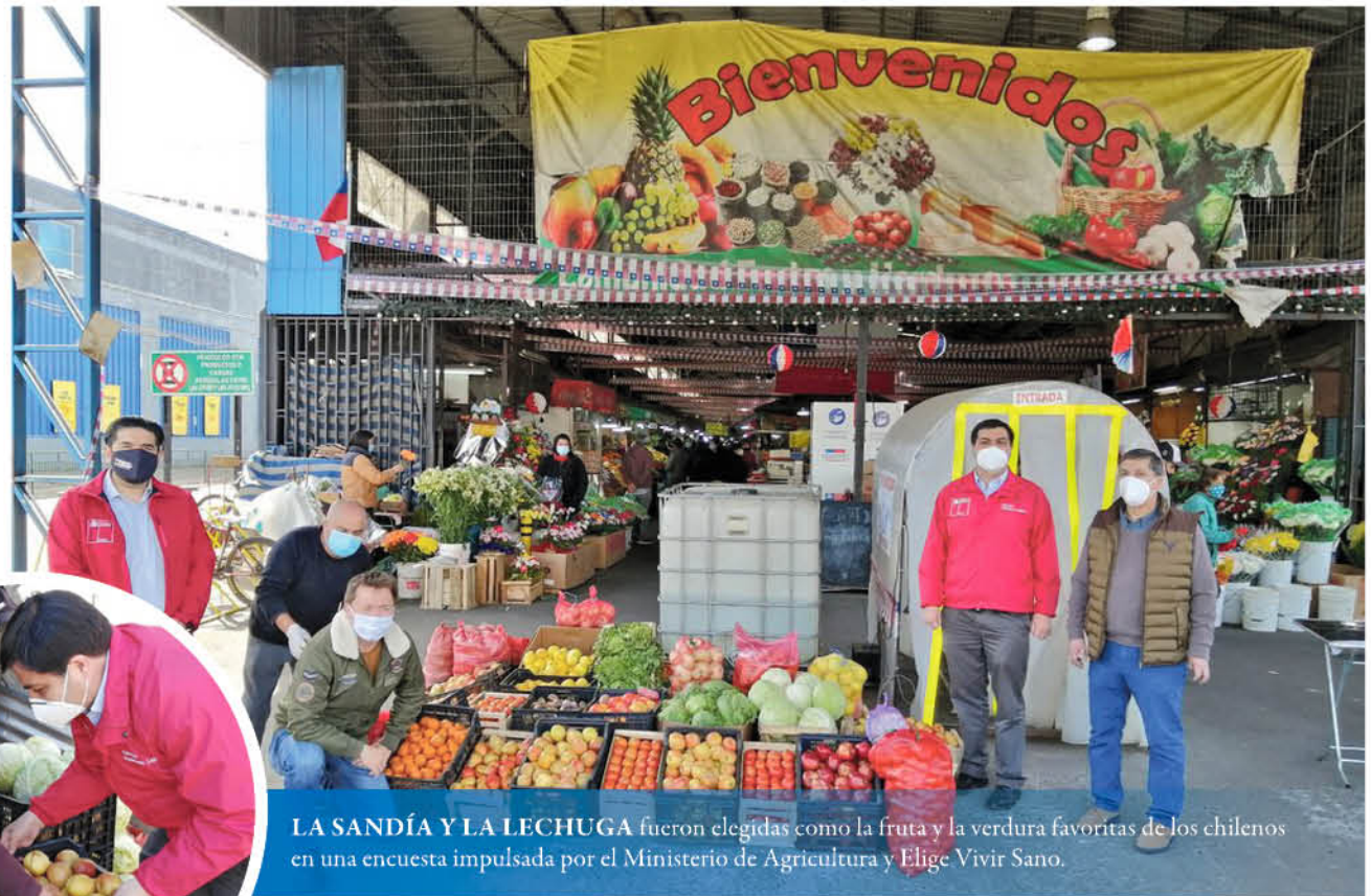
LA SANDÍA Y LA LECHUGA fueron elegidas como la fruta y la verdura favoritas de los chilenos en una encuesta impulsada por el Ministerio de Agricultura y Elige Vivir Sano.

También se entregaron folletos informativos con medidas de prevención para