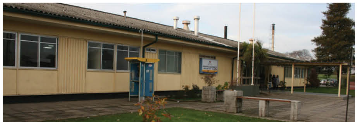
CABEMENCIONAR que anteriormente otros tres funcionarios habían dado positivo a Covid-19, quienes ya se encuentran recuperados.