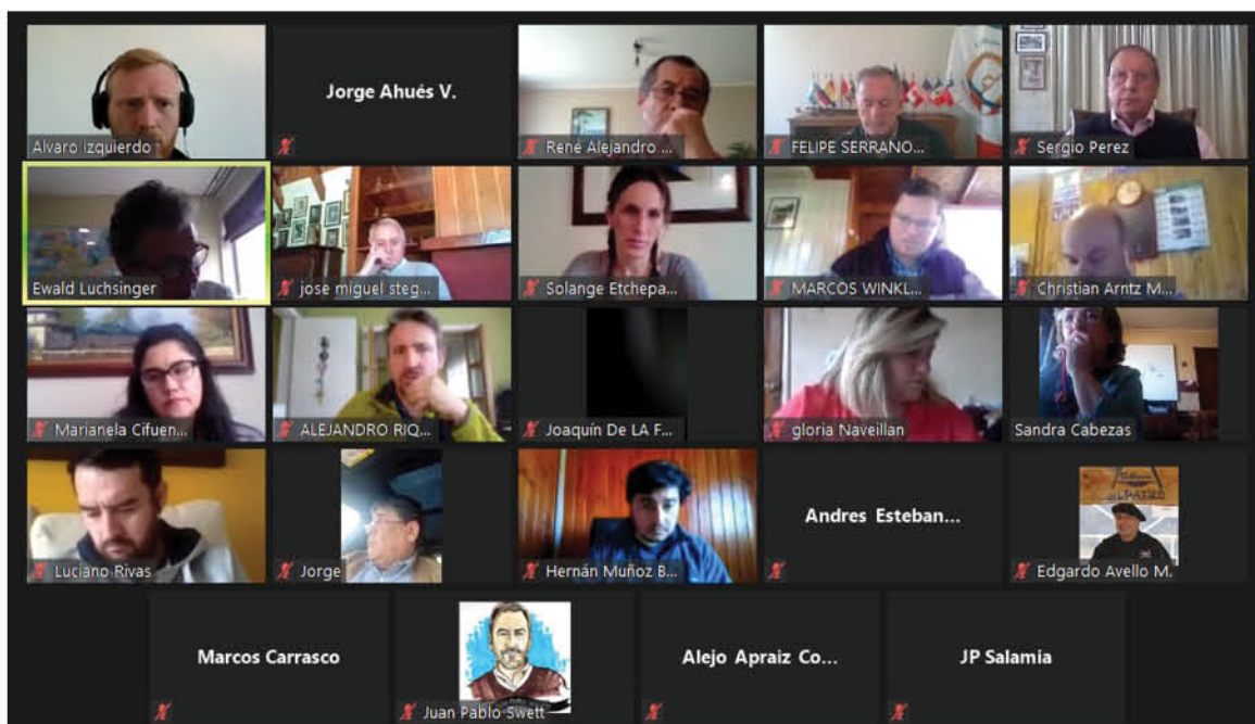
LA MULTIGREMIAL REUNIÓ A TODAS LAS AGRUPACIONES de víctimas de los incidentes en la macro zona sur para delinear un plan de acción.

Sostuvo que el Congreso “debe aprobar reformas que permitan mejorar la inteligencia de las policías para prevenir y perseguir delitos terroristas, además de endurecer las medidas cautelares y las condenas para sus autores, proyectos de ley que no avanzan. Desde el sector agrícola y forestal, pedimos que estos cambios se hagan urgente, ya que mientras más se dilaten, más terreno ganan estas células paramilitares en la macrozona sur del país y más se recrudecen sus acciones contra personas inocentes”.