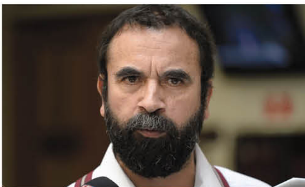
EL PROCESO JUDICIAL espera llegar a una resolución en un plazo aproximado de dos meses.

También se le imputará el delito de denegación de auxilio. Ambos, en calidad de autor.