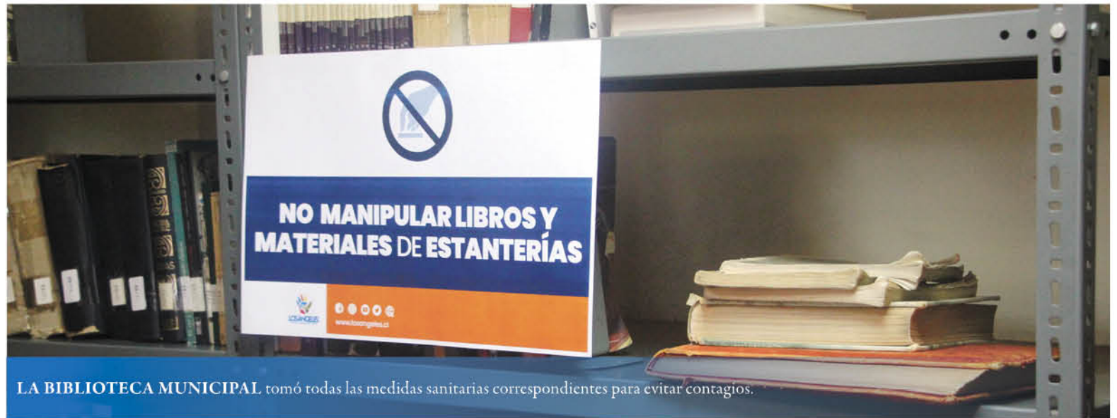
LA BIBLIOTECA MUNICIPAL tomó todas las medidas sanitarias correspondientes para evitar contagios.

El martes 17 de marzo se dejó de atender a usuarios en la Biblioteca Municipal "Roberto Espinoza" debido a la pandemia del coronavirus. Han pasado cerca de siete meses desde ello y hoy las noticias son alentadoras, luego que se decidiera volver a entregar y recibir