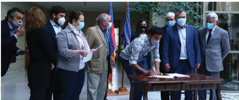
EL LIBELO FUE PRESENTADO por 13 diputados de oposición.

La Acusación Constitucional contra el ministro del Interior, Víctor Pérez fue presentada por 13 diputados de oposición: Gabriel Ascencio, Gabriel Boric, Jorge Brito, Carmen Hertz, Tomás Hirsch, Rodrigo González, Pamela Jiles, Jaime Naranjo, Luis Rocafull, Camila Rojas, René Saffirio, Alejandra Sepúlveda y Víctor Torres.