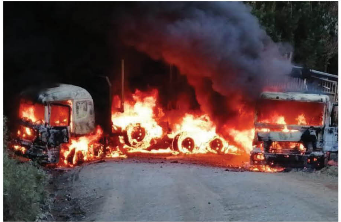
LOS INCIDENTES VIOLENTOS EN LA MACRO ZONA SUR suman y siguen. El último lugar fue una faena forestal en Contulmo.

La Multigremial del Bío Bío llevó a cabo una reunión extraordinaria con gremios y asociaciones de víctimas de los hechos de violencia de la macro zona sur del país, con el fin de alinear posiciones y avanzar en futuras acciones estratégicas, jurídicas y comunicacionales, en