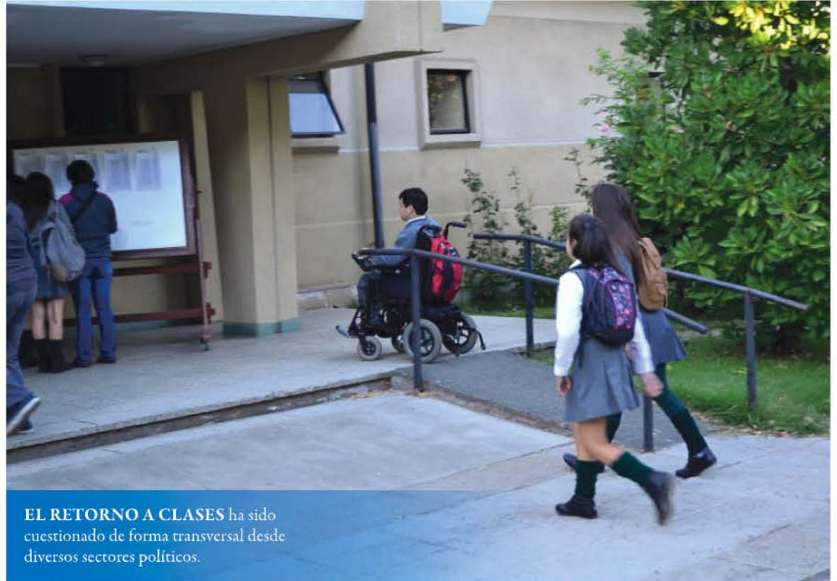
EL RETORNO A CLASES ha sido cuestionado de forma transversal desde diversos sectores políticos.

En esa línea, Figueroa manifestó que "el proyecto tenía una mirada centralista, rígida y totalmente incompatible con lo que hoy necesitan los establecimientos educacionales, que quieren abrir sus puertas en la medida que las condiciones sanitarias lo permitan".