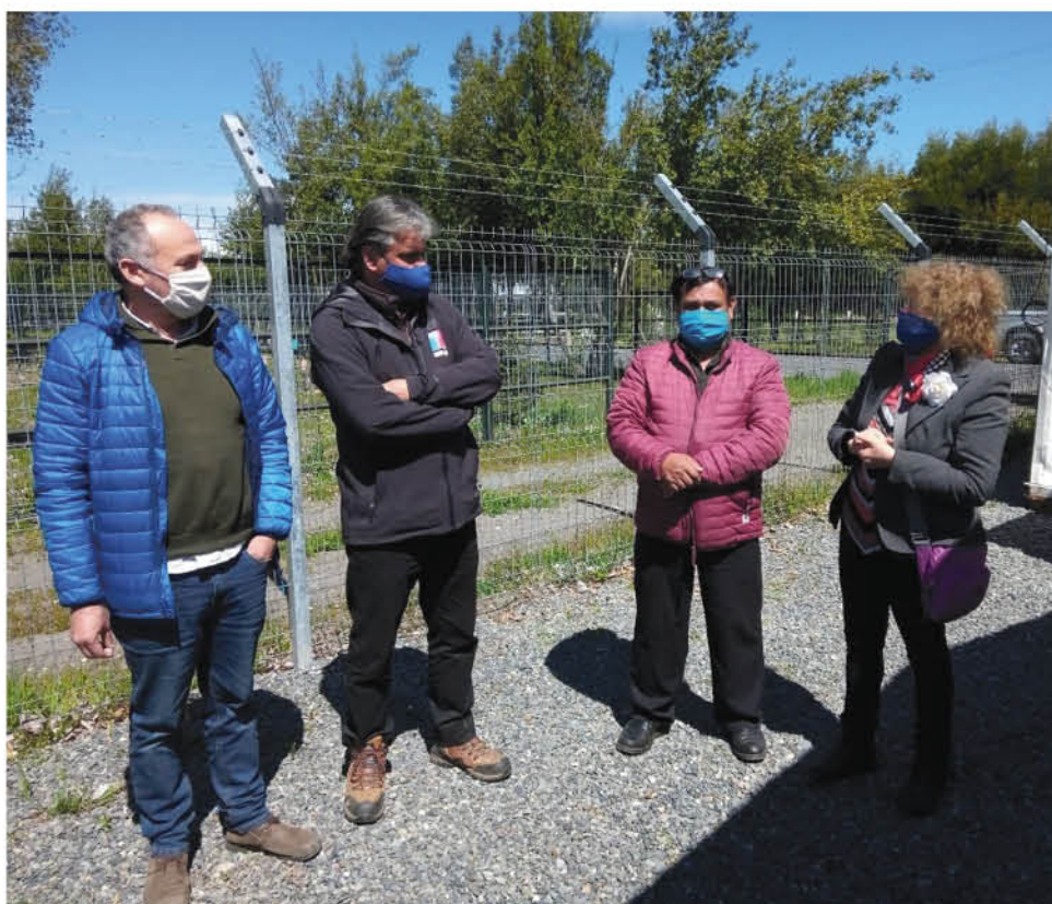
UN ASPECTO DEL ACTO DE ENTREGA de la administración a la directiva del comité de agua potable rural de La Perla.