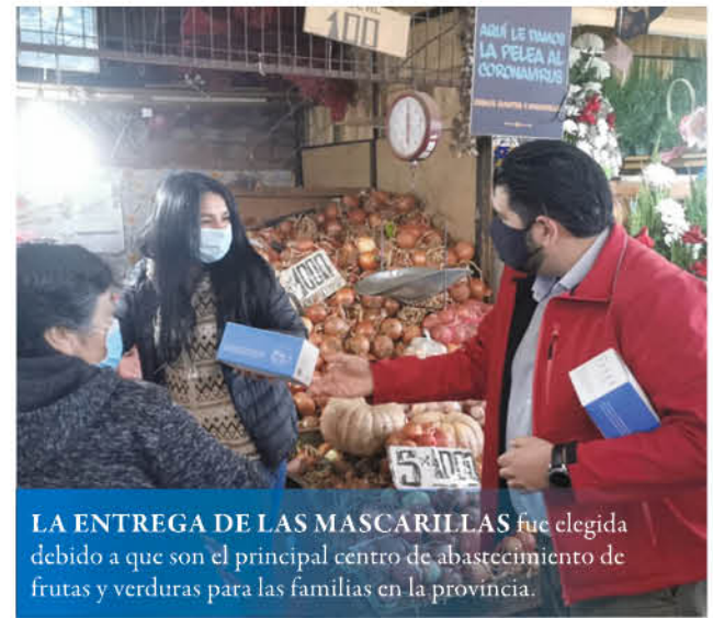
LA ENTREGA DE LAS MASCARILLAS fue elegida debido a que son el principal centro de abastecimiento de frutas y verduras para las familias en la provincia.

Desde el 2017, cada 8 de octubre se conmemora el Día Nacional de las Frutas y Verduras. Para eso, el Ministerio de Agricultura realizó el concurso para elegir la fruta y verdura preferida de los chilenos.