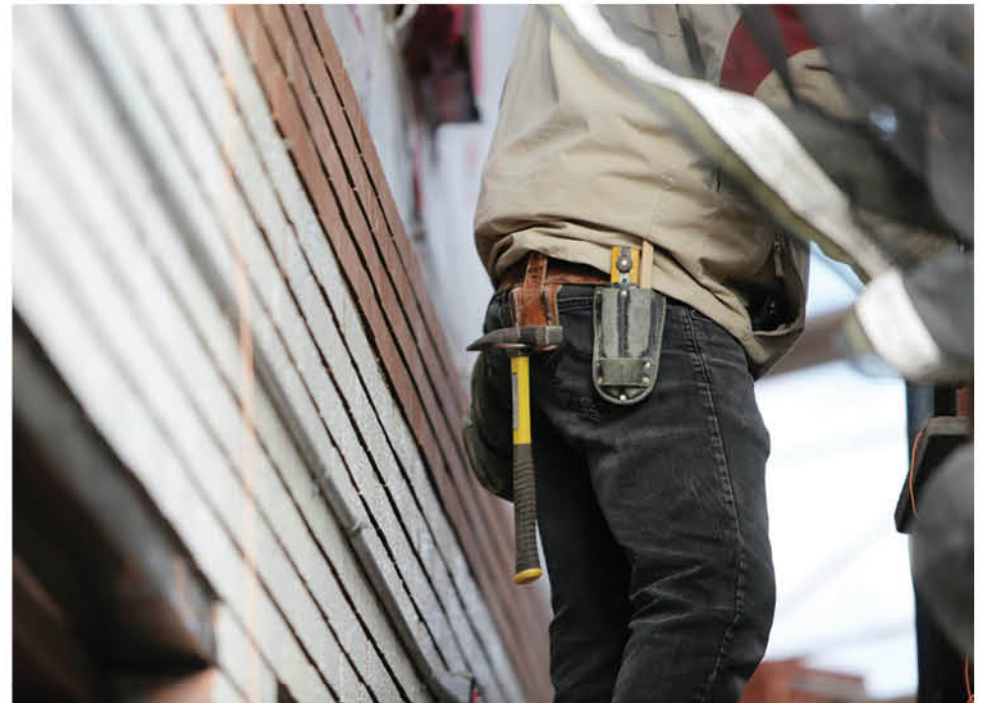
HASTA EL MINUTO, los funcionarios municipales afectados estarían en buenas condiciones de salud.

Recordemos que Laja es el primer municipio de la región en solicitar el retorno a clases, específicamente para los alumnos de octavo básico y cuarto medio de nueve establecimientos educacionales.