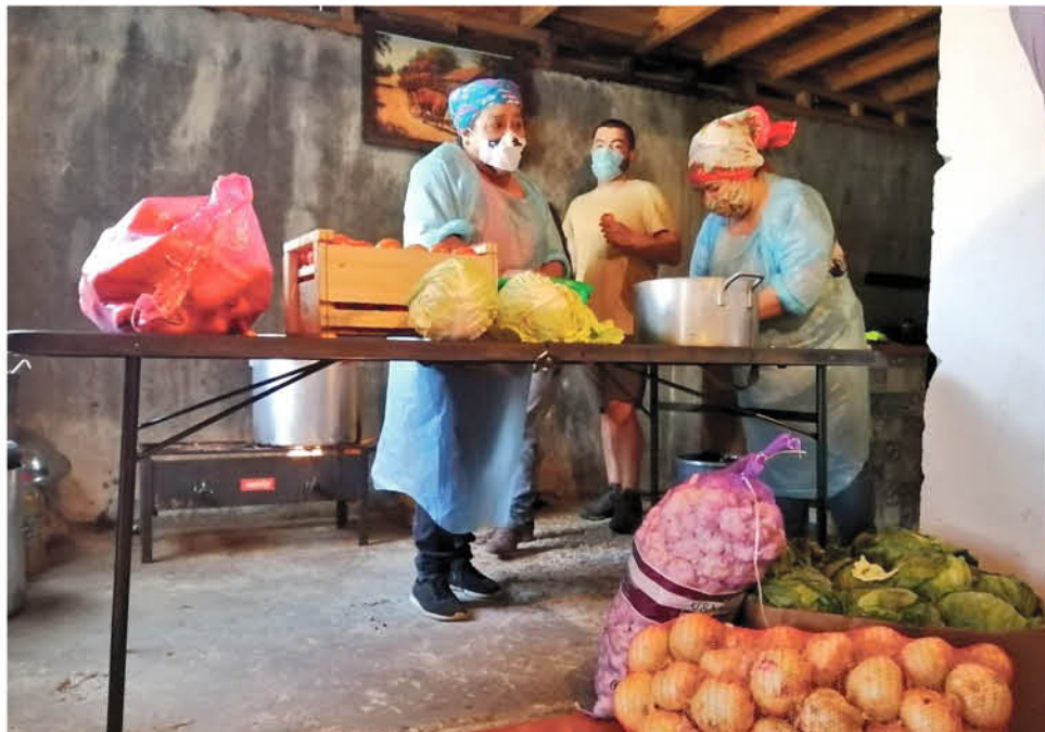
LA JUNTA DE VECINOS DEL SECTOR PADRE HURTADO de Los Ángeles, donde en promedio cocinan 150 platos de comida dos veces a la semana.

Debido a que La Organización de las Naciones Unidas para la Alimentación y la Agricultura más conocida como la FAO y la Organización Mundial de la Salud (OMS) recomiendan un consumo mínimo diario de 400 gramos de frutas y verduras para prevenir enfermedades crónicas no transmisibles como las cardiopatías, el cáncer, la diabetes o la obesidad. Sin embargo, se estima que el consumo mundial per cápita de frutas y hortalizas se sitúa entre un 20% y un 50% por debajo de la ingesta mínima recomendada.