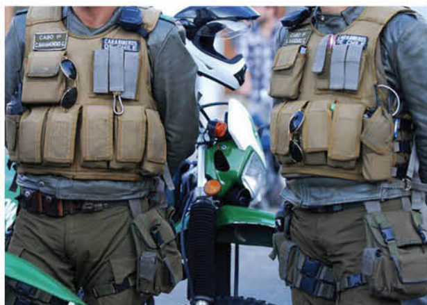
ESTE ANUNCIO está enmarcado dentro de la “reconstrucción” al interior de Carabineros.

Lo señalado por el alto oficial fue confirmado por el Ministerio del Interior, desde donde expresaron que el énfasis de los efectivos será la protección de la manifestación.