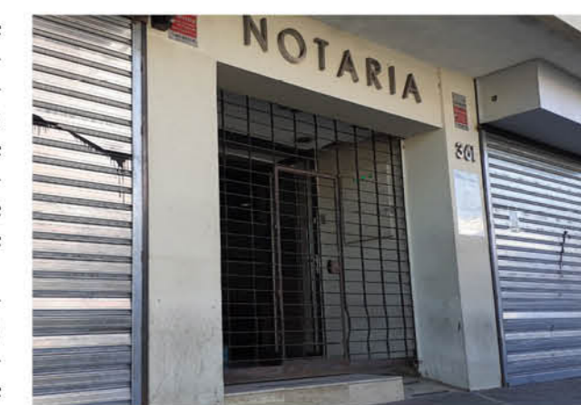
HASTA AHORA no hay detenidos por el robo, pero se confirman intenciones diligencias para dar con el paradero de él o los delincuentes.

El policía agregó que "en el lugar, el personal policial se abocó al análisis y estudio del sitio del suceso que