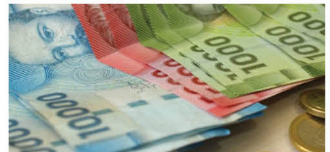
DEL UNIVERSO ENCUESTADO solo un 15% se manifestó en contra de la medida.

Entre los pertenecientes a los sectores socioeconómicos D y E, los encuestados que retirarían superan el 90%, mientras que en el ABC1 quienes también lo harían llegan al 69%.