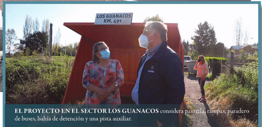
EL PROYECTO EN EL SECTOR LOS GUANACOS considera pasarela, rampas, paradero de buses, bahía de detención y una pista auxiliar.

Las obras se ejecutarán en trece puntos de la comuna de Los Ángeles.