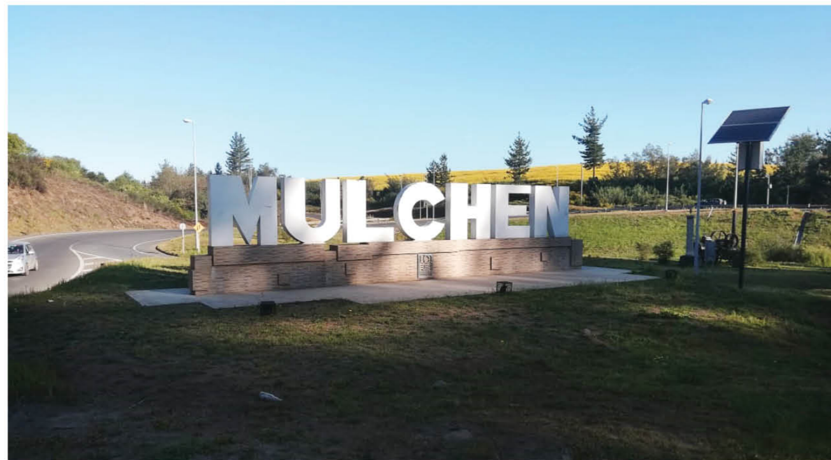
LA INVERSIÓN EN GRANDES OBRAS DEL ESTADO es fundamental para la reactivación económica, pues entre otras cosas permite dar vida al mercado del trabajo.

El Ministerio de Obras Públicas invertirá más de 663 millones de dólares en más de 160 proyectos en la Región del Biobío.