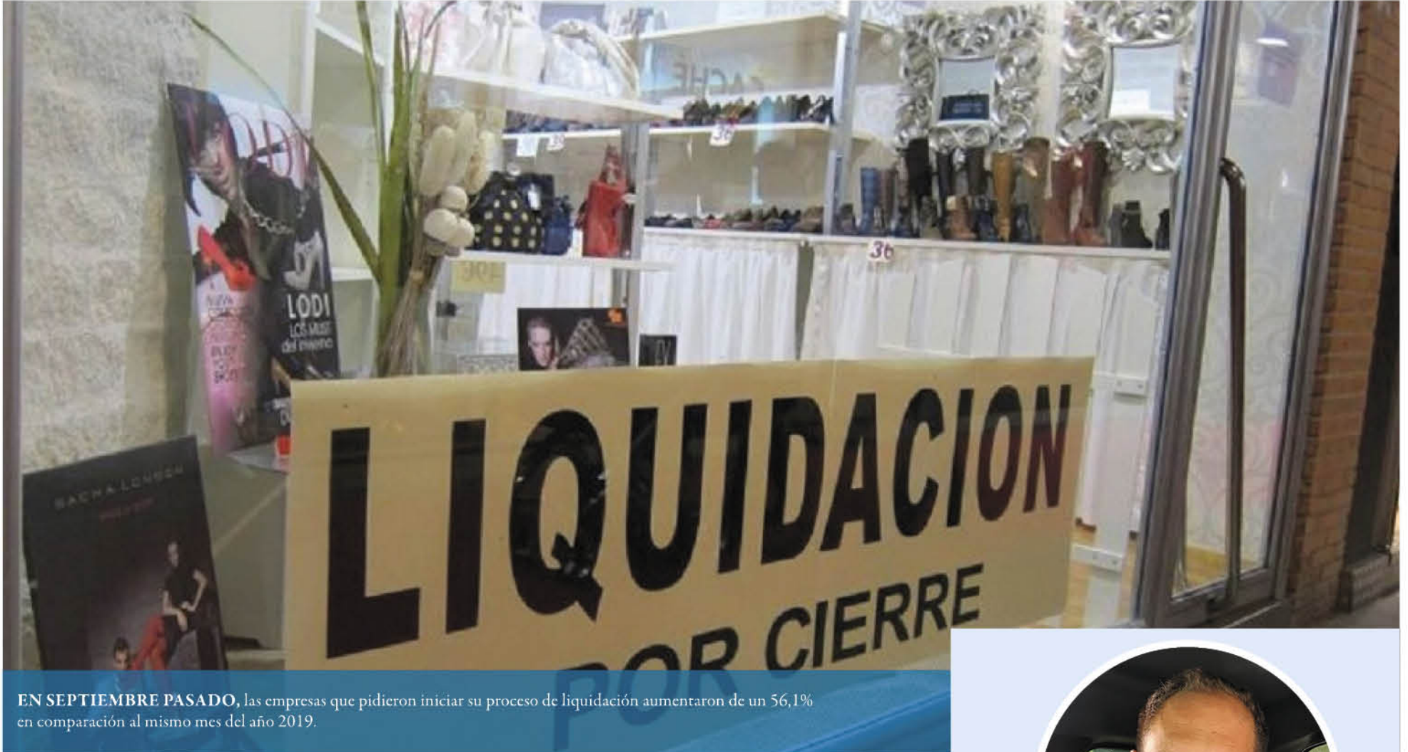
EN SEPTIEMBRE PASADO, las empresas que pidieron iniciar su proceso de liquidación aumentaron de un 56,1% en comparación al mismo mes del año 2019.