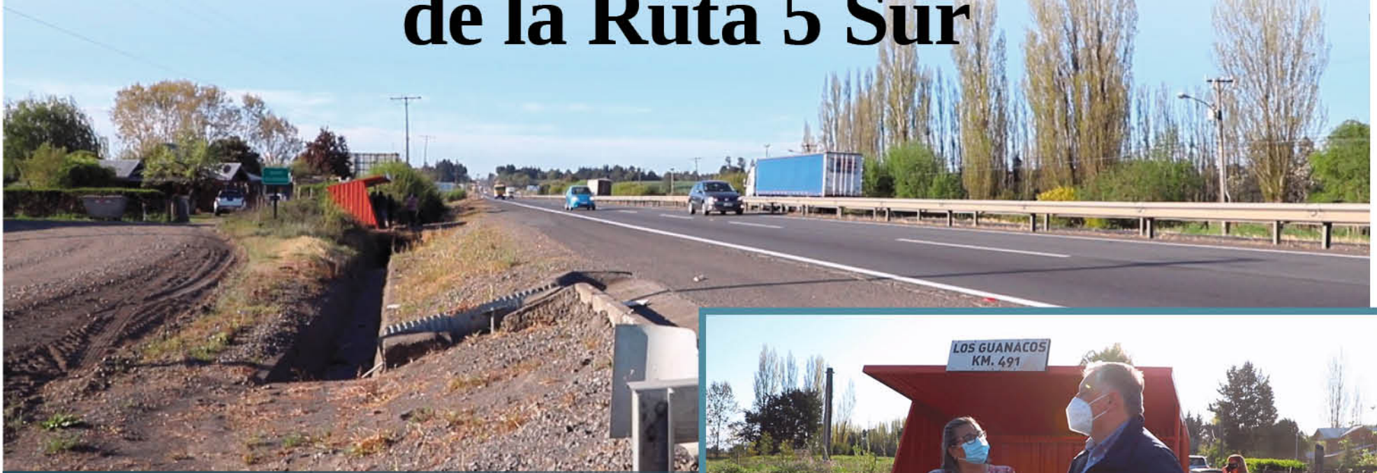
LUEGO DE LAS REITERADAS demandas de los vecinos y las autoridades locales, se mejorará la seguridad y accesibilidad en la Ruta 5 Sur.