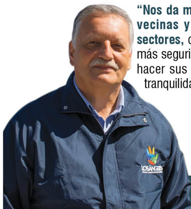
Esteban Krause, alcalde de Los Ángeles

“Nos da mucha alegría por las vecinas y los vecinos de los sectores, que van a poder tener más seguridad en la ruta y poder hacer sus actividades con más tranquilidad”.